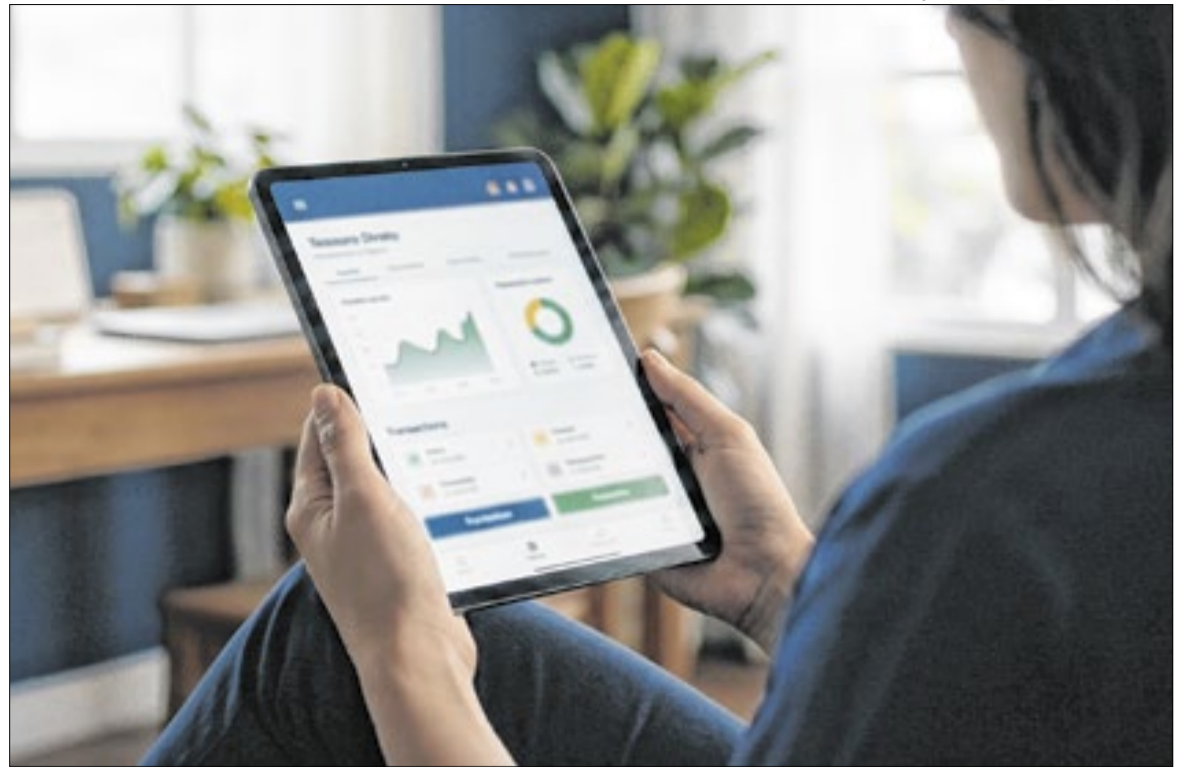
Títulos públicos são emitidos pelo governo federal para financiar a dívida pública

O Tesouro Selic é um título pós-fixado cuja rentabilidade acompanha a taxa básica de juros definida pelo Comitê de Política Monetária (Copom) do Banco Central. Esse papel é utilizado para reserva de emergência por apresentar menor oscilação de preço em relação a outros títulos públicos. O investidor pode solicitar resgate antes do vencimento, e o Tesouro Nacional