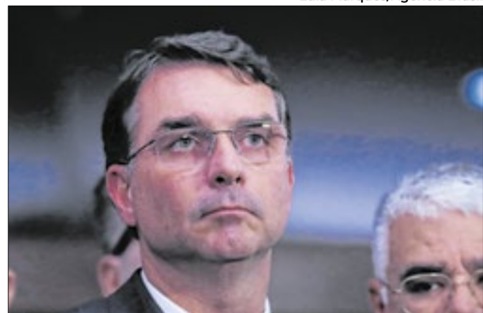
Flávio fica. Porque o clã não enxerga alternativa