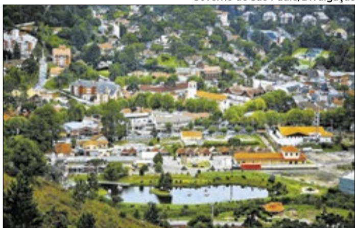
Pessoas podem explorar lugares como Campos do Jordão