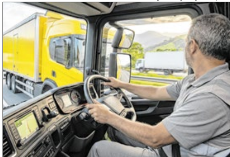
Transporte de cargas teve retração de 1% em março

O nível de atividade do setor permanece 18,2% acima do patamar registrado em fevereiro de 2020, antes da pandemia de covid-19. Ainda assim, o volume