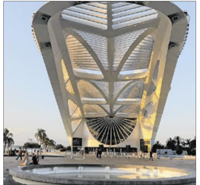
Nesta segunda, o mundo volta os olhos ao Museu do Amanhã

Na história da competição, o Atlético-MG é o clube que mais vezes chegou às oitavas, com 32 participações. O Corinthians aparece na segunda posição, com 29, ficando de fora apenas duas vezes em suas 31 participações no torneio. O Flamengo, que tinha sido eliminado apenas uma vez antes das oitavas, até ser eliminado para o Vitória.