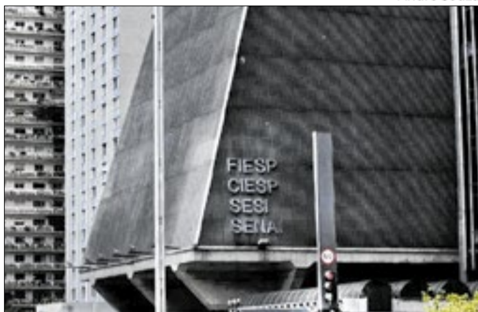
Prédio da Fiesp na Avenida Paulista, em São Paulo