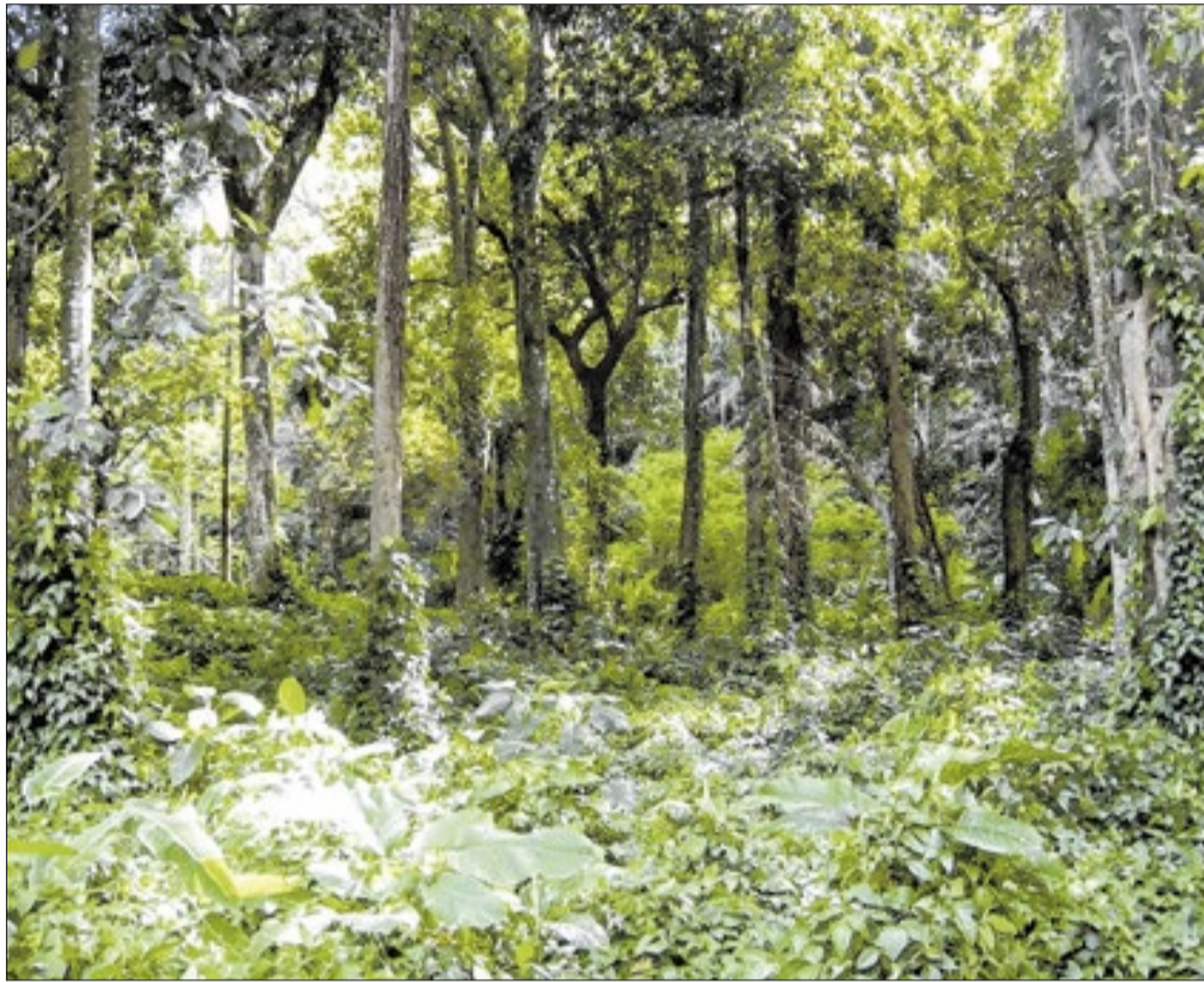
A iniciativa reúne mais de 30 mil registros de ocorrências de espécies da fauna e da flora