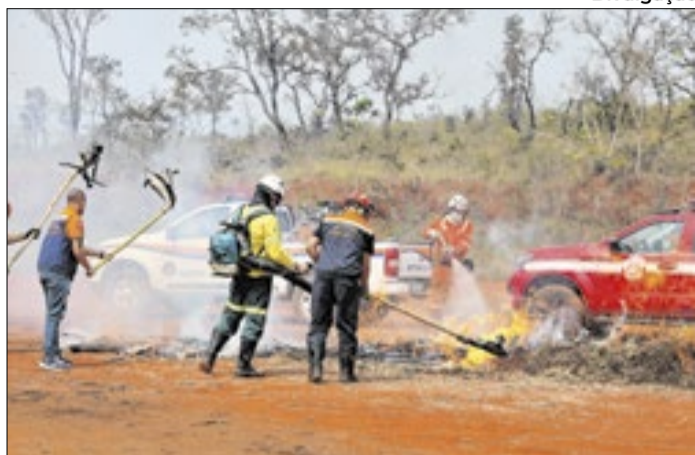
Capacitação reuniu agentes, produtores rurais e prefeitos