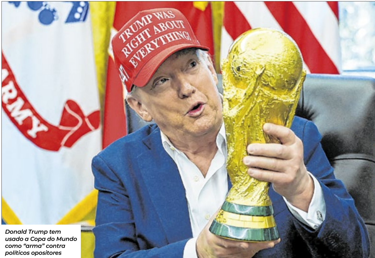
Donald Trump tem usado a Copa do Mundo como “arma” contra políticos opositores

“Vejo esta Copa como particularmente carregada politi-