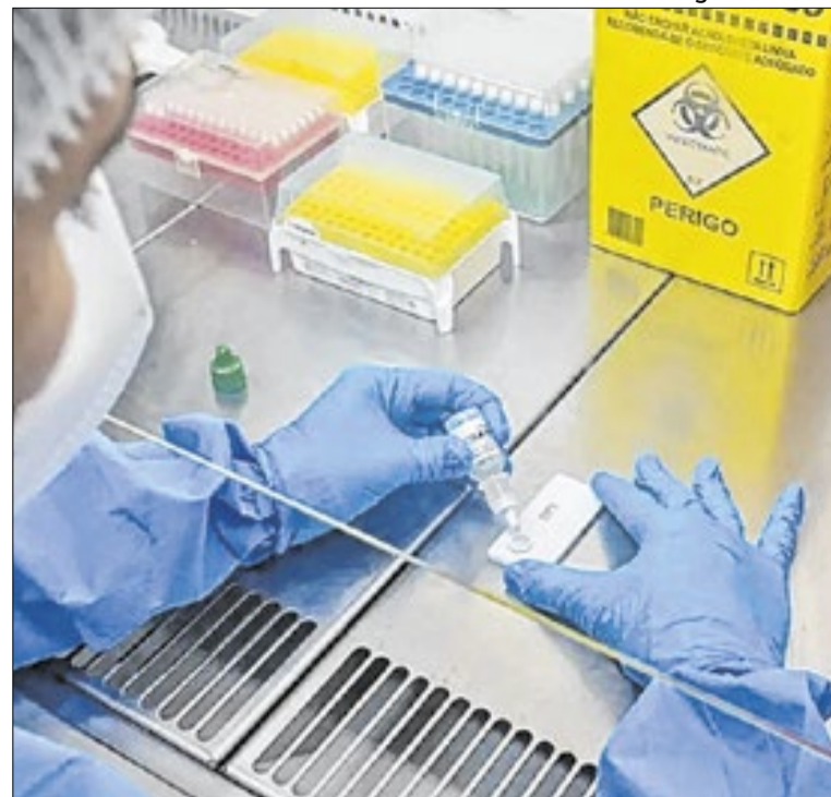
Diagnóstico precoce é essencial para reduzir complicações

Após mudanças de endereço, a feira se consolidou no Centro Administrativo Vivencial e Esporte, ao lado da administração regional, e teve sua estrutura atual inaugurada em 1983. Em 2010, ganhou uma ala adicional com 120 novas lojas. Hoje, reúne mais de 645 estabelecimentos e gera renda para cerca de 1.500 famílias, tornando-se referência comercial para o Guará e para outras regiões do DF. O projeto destaca que o reconhecimento busca preservar a sua identidade cultural.