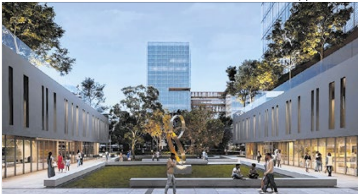
Complexo reunirá órgãos estaduais na região central da capital

A homologação é a etapa administrativa em que o Estado analisa a regularidade do processo licitatório, garantindo que todas as exigências legais e formais foram cumpridas. Concluída essa fase, o projeto segue para a adjudicação, procedimento que formaliza o consórcio vencedor como responsável pela execução do empreendimento. Em seguida, será assinada a concessão entre o Estado e a empresa, estabelecendo responsabilidades, parâmetros de desempenho