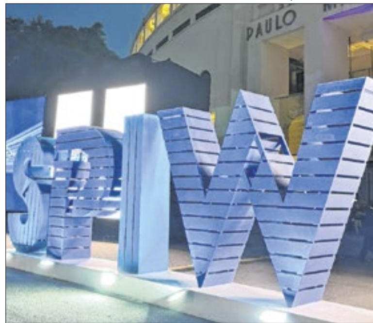
Organização quer evento com mais dias e palestras em 2027

O Fundo Garantidor de Créditos (FGC) ainda tem cerca de R$ 2,2 bilhões disponíveis para ressarcir credores do Banco Master, Will Bank e Banco Pleno, instituições liquidadas pelo Banco Central. Segundo o fundo, 117,7 mil investidores ainda não solicitaram os valores. Até agora, o FGC já devolveu R$ 39,7 bi aos clientes afetados.