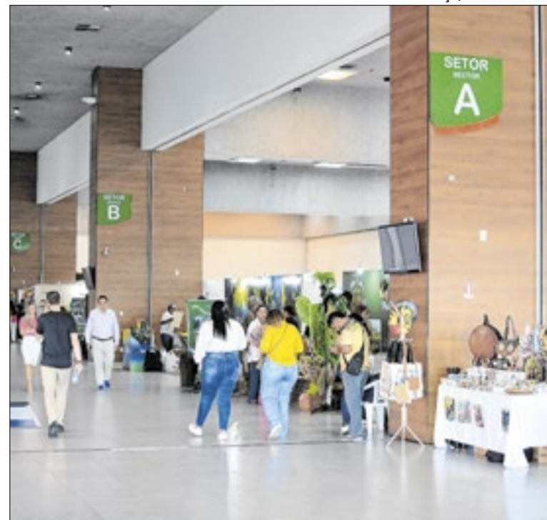
Na edição de 2025, o evento recebeu mais de 5 mil visitantes

O governador do Amazonas, Roberto Cidade, inaugurou o novo Serviço de Ressonância Magnética da Fundação Hospital Adriano Jorge (FHAJ), consolidando mais um avanço na modernização da rede estadual de saúde. Com a entrega do equipamento, o estado amplia a oferta de exames de alta complexidade.