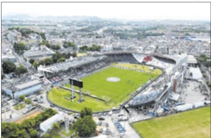
Com 99 anos, São Januário respondeu bem à tecnologia