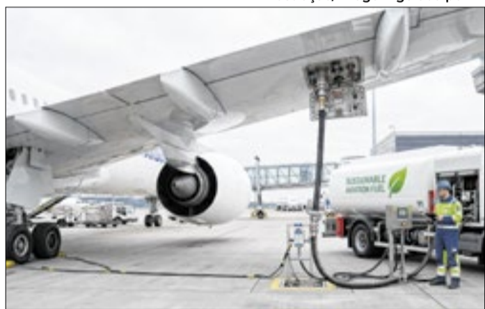
Combustível de aviação (SAF) fabricado com óleos vegetais