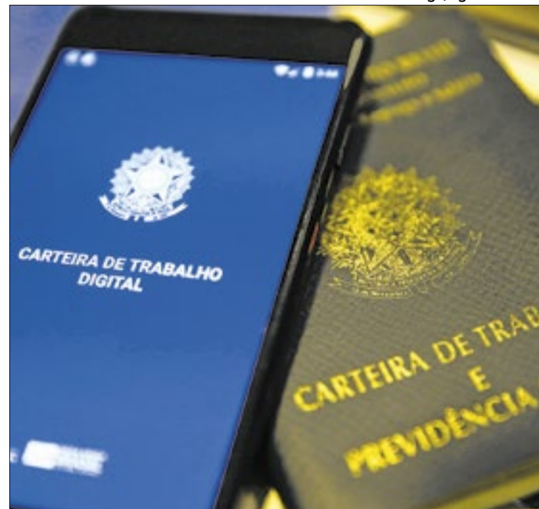
Discussão pela ótica de empregadores e trabalhadores

Enfim, a avaliação, então, é que o candidato é Flávio Bolsonaro até onde der. Porque o clã Bolsonaro não aceitaria alguém com outro sangue correndo nas veias. E entre aqueles que têm o sangue Bolsonaro não haveria mais alguém incólume. O problema é a vida correr à revelia dos planos do clã.