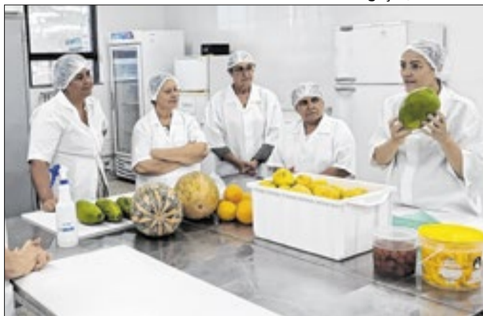
Pequena agroindústria transforma frutas em polpas