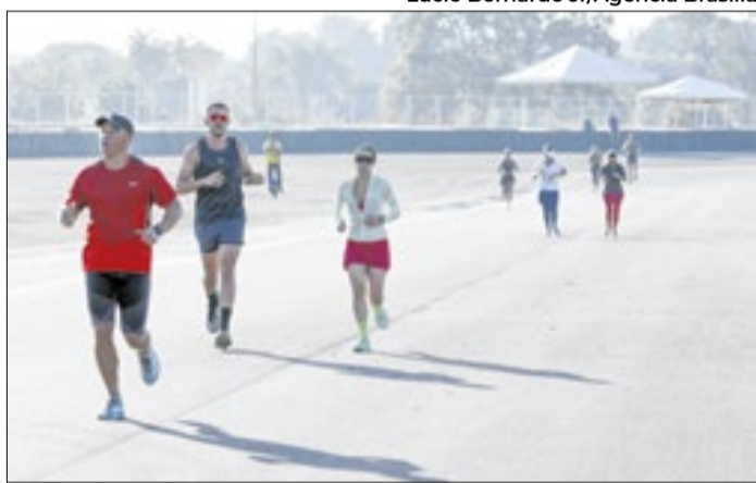
Espaço terá acesso gratuito às sextas-feiras