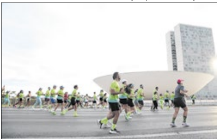
A corrida dos 200 anos foi no Eixo Monumental