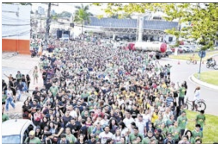
Organização espera a presença de mais de 20 mil pessoas