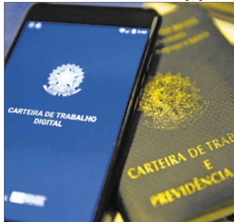
Discussão pela ótica de empregadores e trabalhadores

Enfim, a avaliação, então, é que o candidato é Flávio Bolsonaro até onde der. Porque o clã Bolsonaro não aceitaria alguém com outro sangue correndo nas veias. E entre aqueles que têm o sangue Bolsonaro não haveria mais alguém incólume. O problema é a vida correr à revelia dos planos do clã.