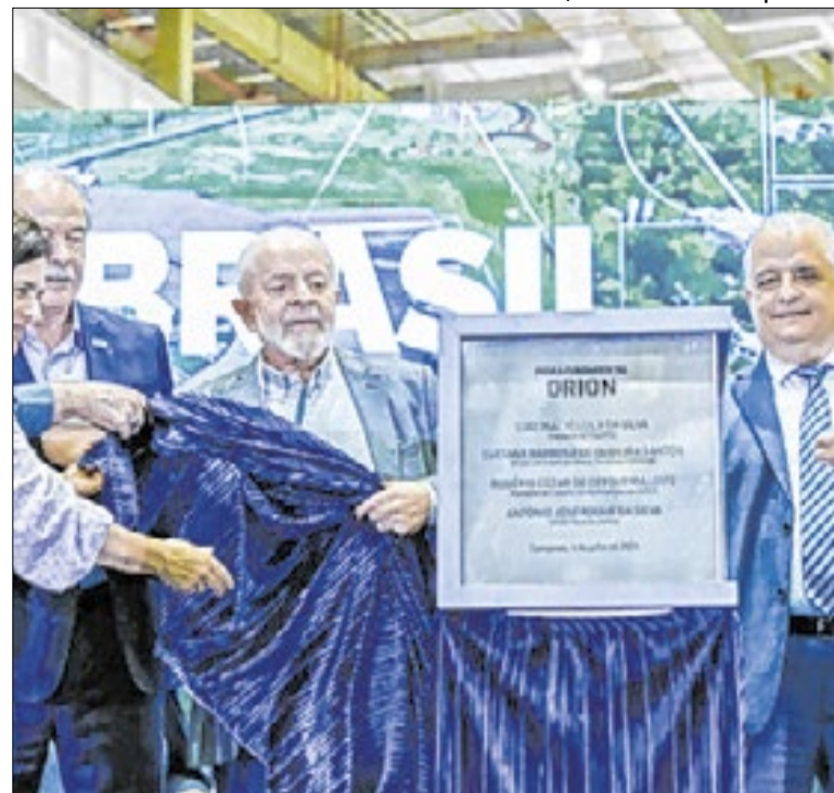
Lula lança pedra fundamental do Orion em julho de 2024

Quando a provocação deliberada encontra a truculência disfarçada de ordem, o ambiente democrático perde para o espetáculo da intolerância recíproca. Em suma, atesta que o respeito mútuo e o debate polido foram lamentavelmente anulados.