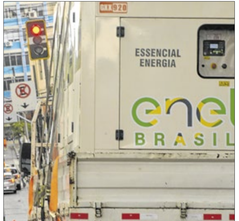
Empresa diz ter adotado medidas para reforçar operação

A audiência busca ouvir a população e as necessidades do cada município e região. O público poderá dar sugestões e acompanhar a definição dos investimentos estaduais de 2027. A Comissão de Finanças da Alesp deverá destinar emendas ao orçamento estadual para as regiões que sediarão as audiências