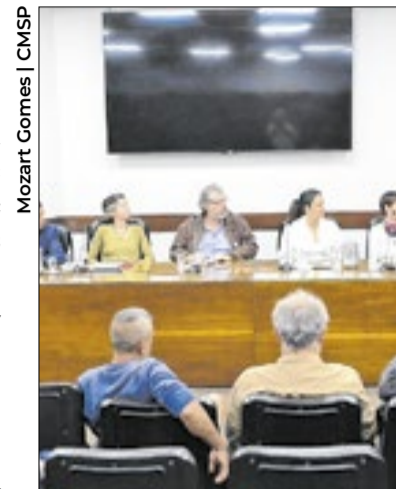
Também foram discutidas ideias de logística reversa

Especialistas destacaram que São Paulo enfrenta desafios relacionados à capacidade dos aterros sanitários e ao aumento constante na geração de resíduos sólidos. Estudos e debates apresentados ao longo dos últimos anos no Legislativo paulistano apontam a necessidade de