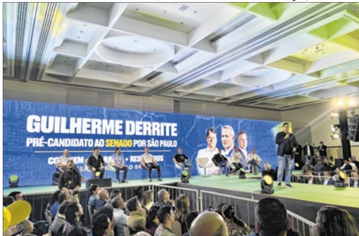
Dário Saadi, Sérgio Moro, Guilherme Derrite, Flávio Bolsonaro e Tarcísio de Freitas no evento

O evento marcou a oficialização da pré-candidatura de Derrite ao Senado e reuniu o senador