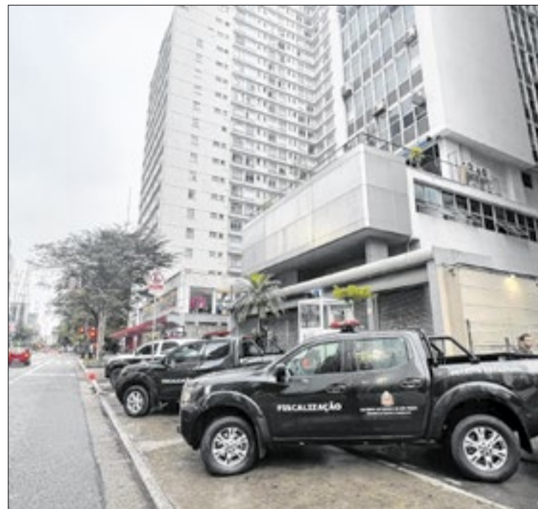
Mais de 530 agentes públicos participaram da operação

Os apartamentos têm 45 m 2 com dois dormitórios, sala, cozinha, banheiro e lavanderia. O condomínio oferece piscinas, academia, churrasqueira e espaço pet. Desde o início da gestão, o Casa Paulista entregou 48,9 mil moradias nessa modalidade, com investimento de R$ 597,2 milhões e impacto de R$ 26,7 bilhões na economia.