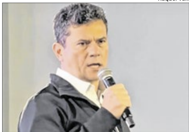
Moro foi a surpresa e destaque entre os congressistas