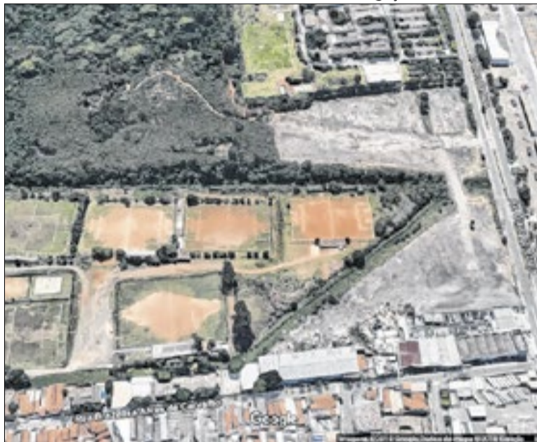
Campos de futebol no terreno do Campo de Marte

Com a nova decisão, fica mantida a autorização para que o muni-