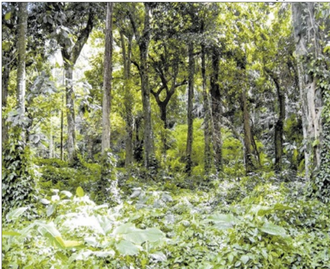
A iniciativa reúne mais de 30 mil registros de ocorrências de espécies da fauna e da flora

"Monitora Bio SP inova a gestão das Unidades de Conservação, com base em inteligência de dados", afirma Rodrigo Levkovicz, diretor-executivo da Fundação Florestal. "O sistema oferece monitoramento preciso e transparência para a sociedade", acrescenta. A