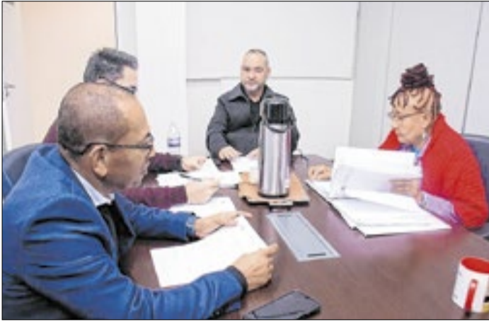
Comissão de saúde discutiu sobre animais e saúde