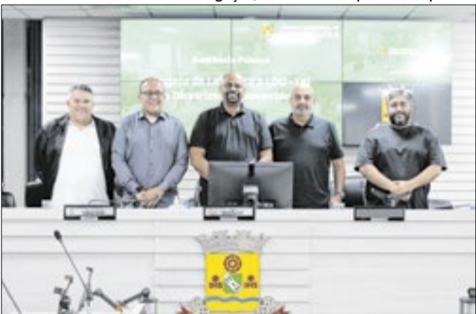
A Audiência pode ser acessada na íntegra na TV Câmara