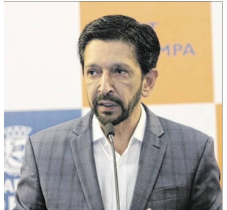
Prefeito diz que parte das decisões judiciais interfere em SP

A vacina contra a influenza é considerada uma das principais formas de prevenção contra complicações causadas pela gripe, especialmente em períodos de temperaturas mais baixas durante outono e inverno. A orientação é que a população procure a unidade de saúde mais próxima para atualizar a imunização.