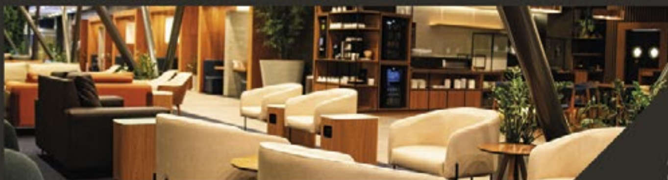
SALA VIP BRB EXCLUSIVA PARA CLIENTES BRB