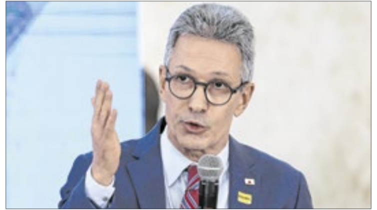
Romeu Zema é pré-candidato ao Planalto pelo partido Novo