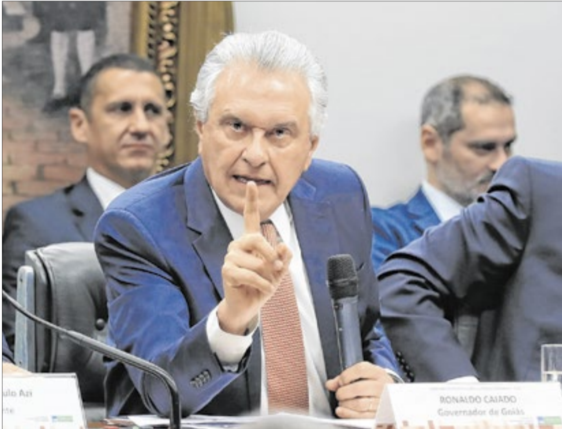
Caiado rebateu declarações de Otto Alencar sobre postura “muito mais radical”