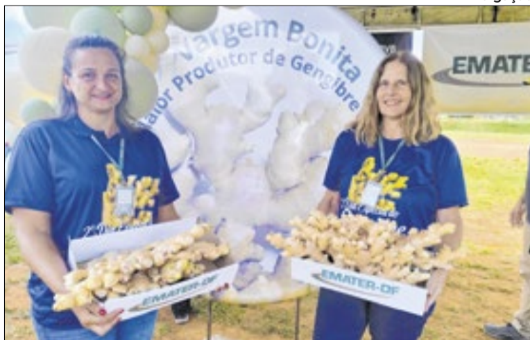
III Dia Especial do Gengibre terá oficinas, feira e atrações

blico poderá acompanhar o concurso culinário, a exposição agrícola, além de rodas de conversa, atendimento sobre regularização fundiária, distribuição de mudas e testes rápidos de saúde.