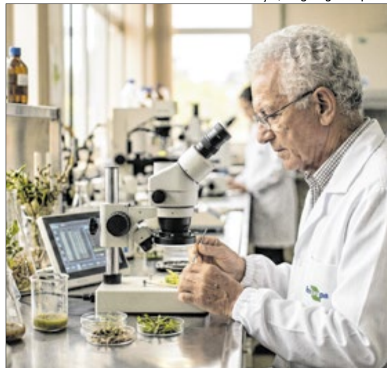
Proposta busca atender demandas da Embrapa

O STJ decidiu que entidades de previdência complementar terão 10 anos para pedir a devolução de valores pagos por decisão judicial provisória que depois foi cancelada. A 2ª seção da Corte entendeu que o prazo não será de três anos, já que os pagamentos estavam ligados ao contrato de previdência privada.