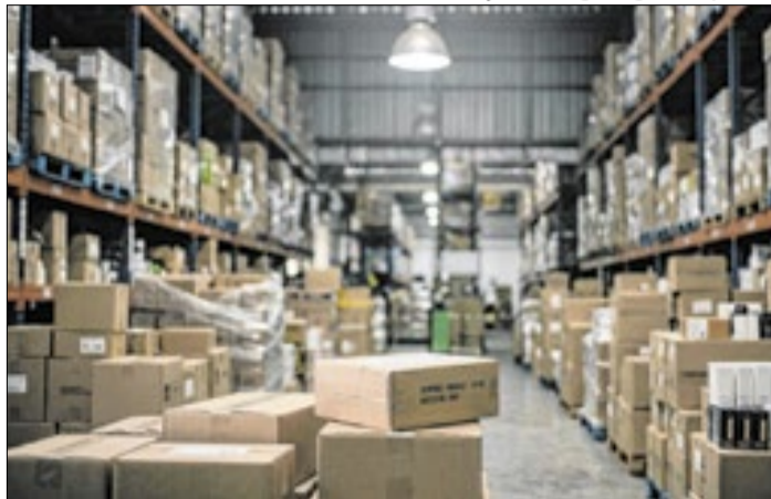
Ilustração / Imagem gerada por IA

Receita espera apreender R$ 30 milhões em mercadorias.