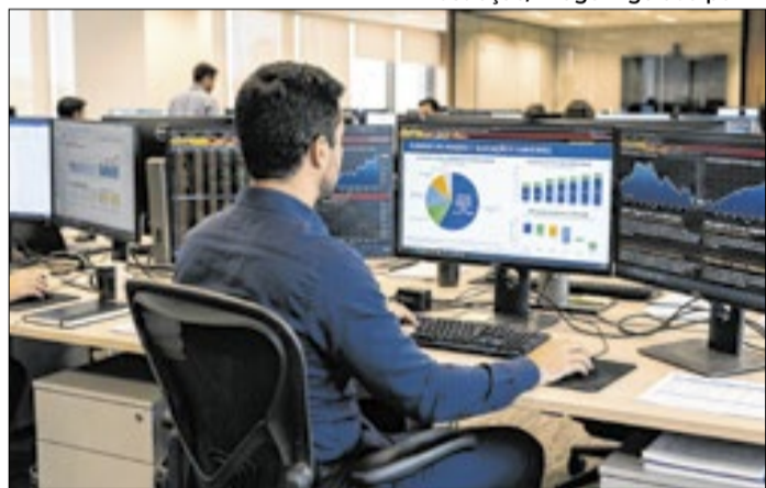
Gestores de Previdência Complementar buscam segurança