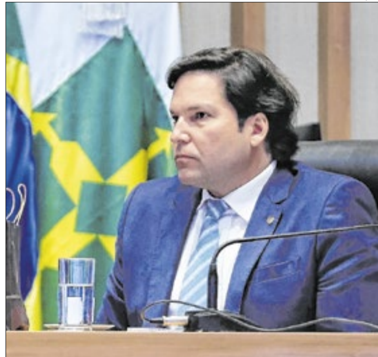
Qualquer mulher poderá acionar a ferramenta presencialmente

Aos finais de semana, a venda de pacotes ocorre no próprio local, a partir das 11h. De segunda a sexta, os envelopes podem ser adquiridos na Livraria Leitura.