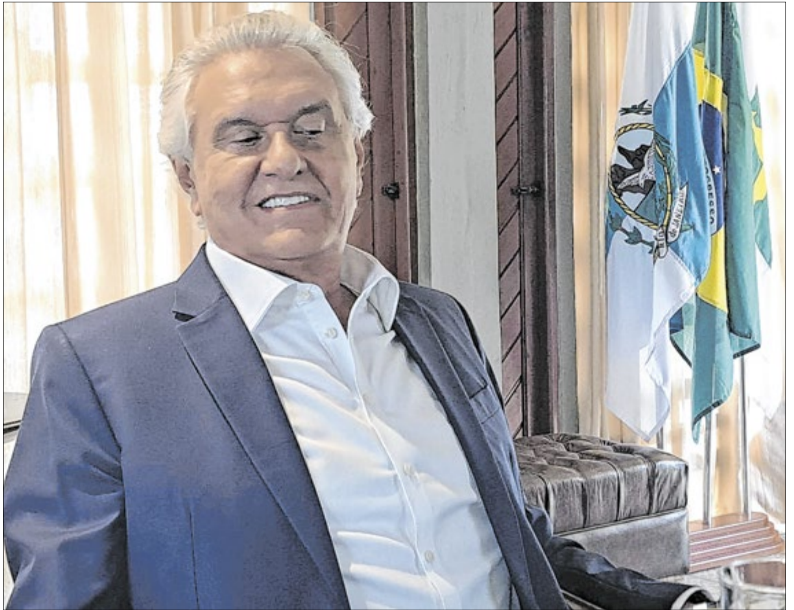
“Lula é conivente com o narcotráfico”, dispara Caiado

“Com relação às outras áreas nos demais estados, eu governarei dando todo apoio aos governadores. Com a capacidade de inteligência, imagens de satélites, apoio do Coaf (Conselho de Controle das Atividades Financeiras) para identificar as ramificações financeiras e como esse dinheiro está sendo levado para contaminar outras estruturas da economia brasi-