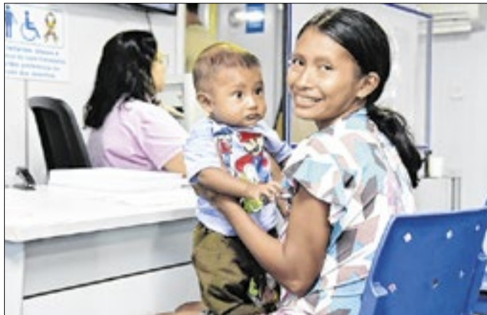
Benefício às mães tem duração de 120 dias