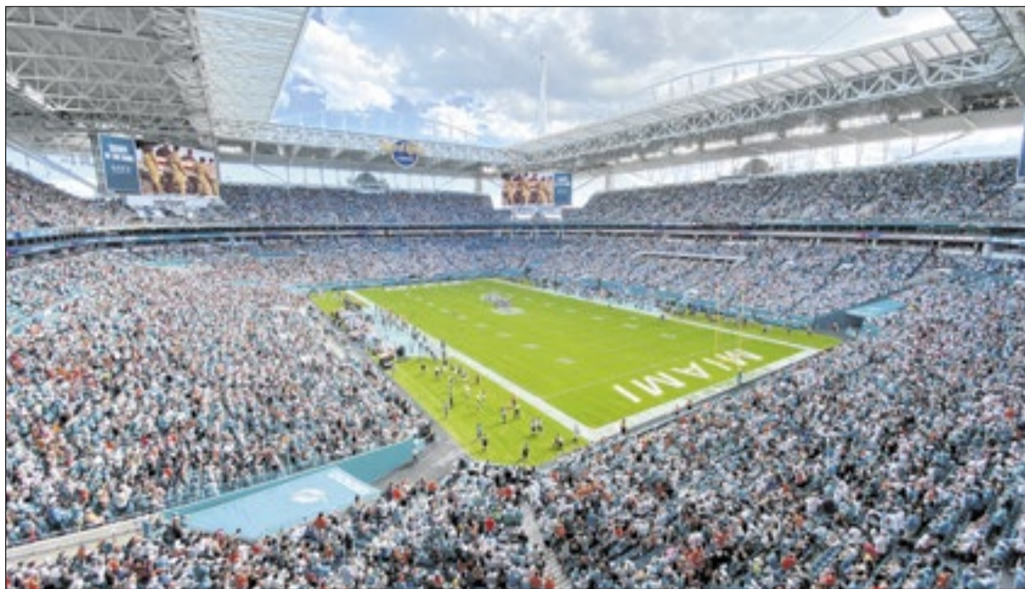
Hard Rock Stadium, em Miami, receberá um jogo da Seleção Brasileira e promete alta temperatura

Em Dallas, Alemanha e Coreia do Sul jogaram com termômetros batendo nos 46°C, recorde não oficial de partida mais quente da história das Copas. Favoritos, os alemães