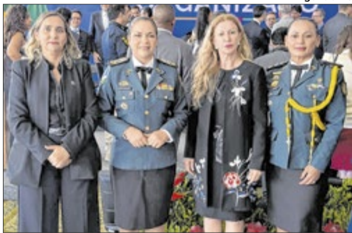
Investimento é de R$ 11 bilhões em ações