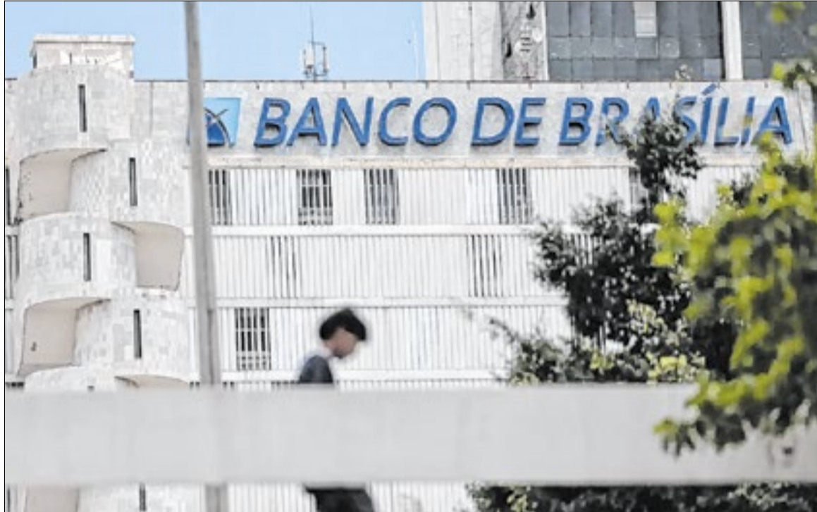
BRB tem até o final de maio para divulgar o balanço consolidado de 2025

Na ocasião, o Banco de Brasília informou, em fato relevante, a assinatura de um memorando de entendimento com a gestora para a criação de um fundo voltado à transferência desses ativos. A gestora fundada em 2016 é focada na compra de ativos de risco jurídico e de baixa liquidez. Atualmente a Quadra Capital gere os recursos de 44 fundos de investimento, que somam R$3,9 bilhões de 336 investidores, entre pessoas e empresas. Apesar do comunicado do BRB, não ficou claro quais ativos seriam vendi-