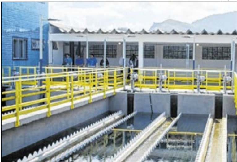
Nova ETA integra o conjunto de melhorias do Sistema Acari