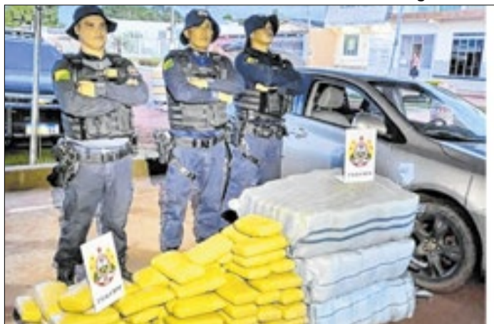
Apreensão de entorpecentes mantém um elevado nível