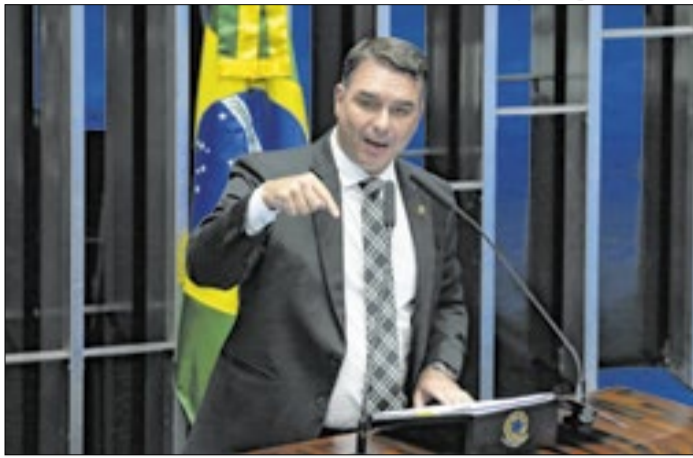
Flávio Bolsonaro pediu dinheiro ao Banco Master