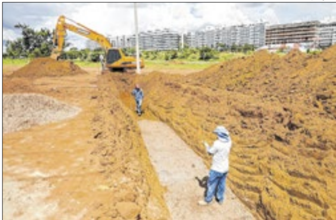
TCDF: obra prevista para 2023 será entregue em 2027