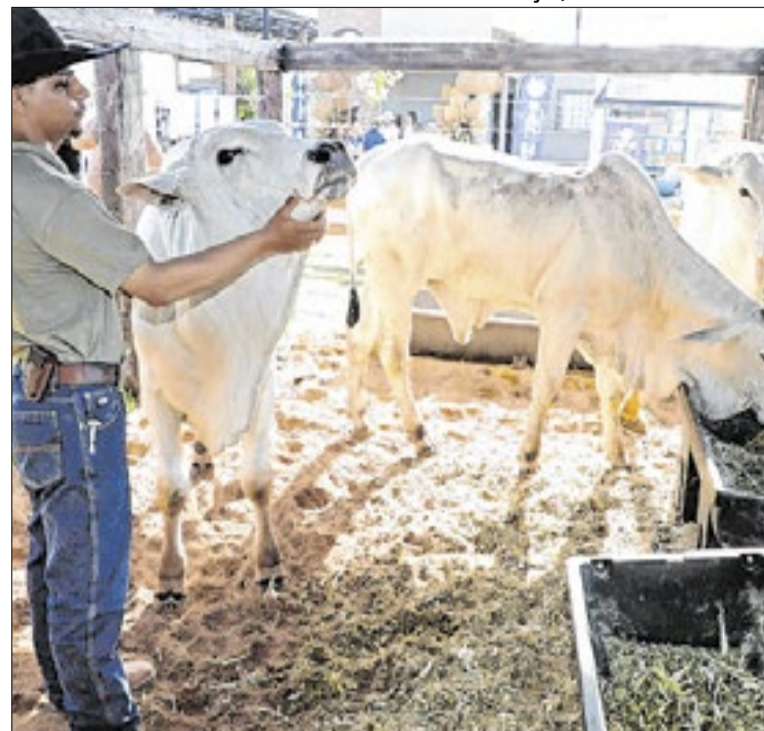
Exposição de animais reúne mais de 600 exemplares

O governo do Acre realiza em Cruzeiro Sul o segundo ciclo de formação para professores, coordenadores pedagógicos e profissionais de saúde para implementação do programa Elos – Construindo Coletivos. A capacitação é ministrada nos dias 13, 14 e 15 de maio. De 5 a 7 de deste mês foi realizada a formação #TamoJunto.