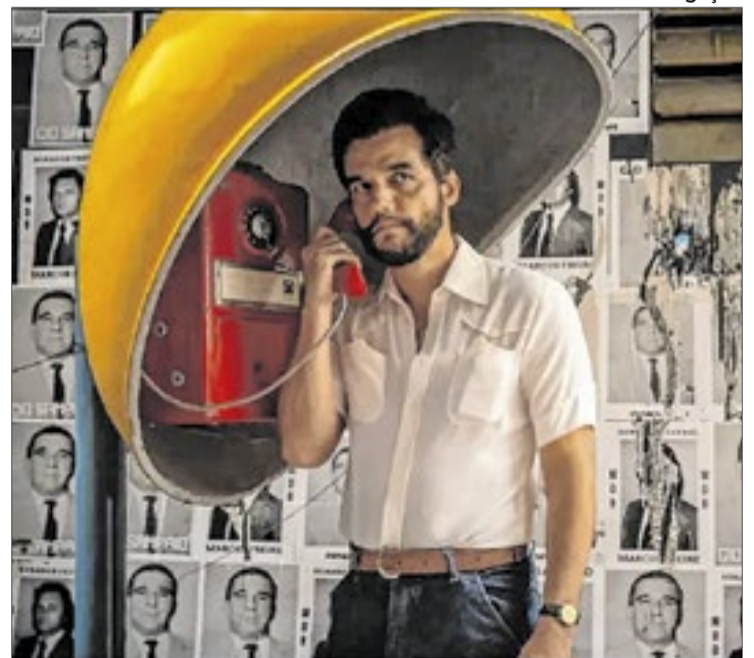
TCU apura denúncia sobre envio de recursos federais

O presidente Lula (PT) celebrou a participação de “O Agente Secreto” na premiação do Oscar em 2026. Em publicação nas redes sociais, destacou a força do cinema brasileiro. “É o Brasil levando ao mundo a potência da nossa cultura e das nossas histórias”, escreveu.