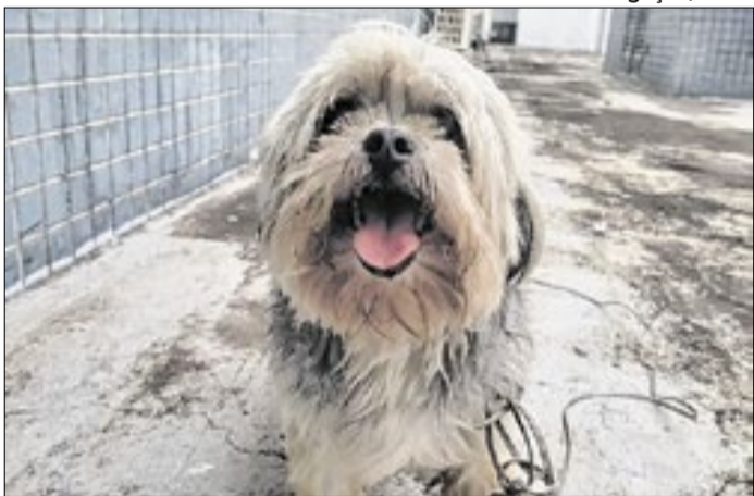
O cãozinho chegou sozinho à 31ª DP de Planaltina