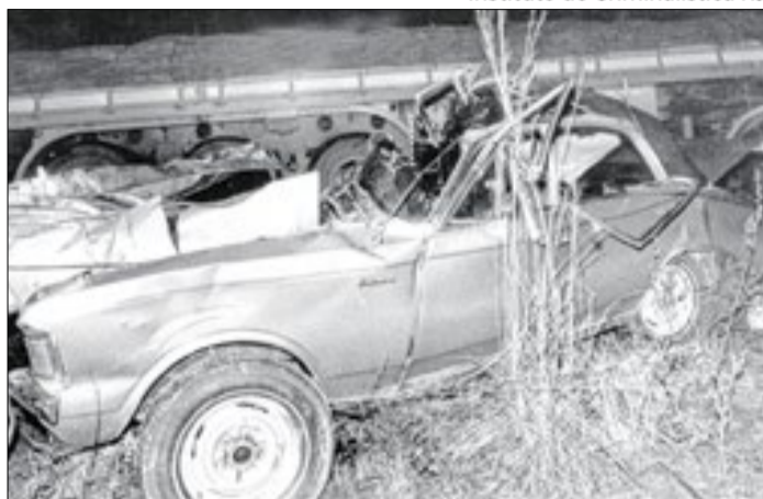
Morte de JK teria sido um acidente?