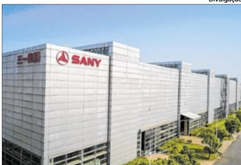
Sany vai ocupar área no Distrito Industrial, em Campinas

“A instalação da Sany representa um movimento importante para Campinas, tanto pela reativação de uma área industrial estratégica quanto pela