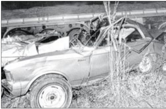
Morte de JK teria sido um acidente?