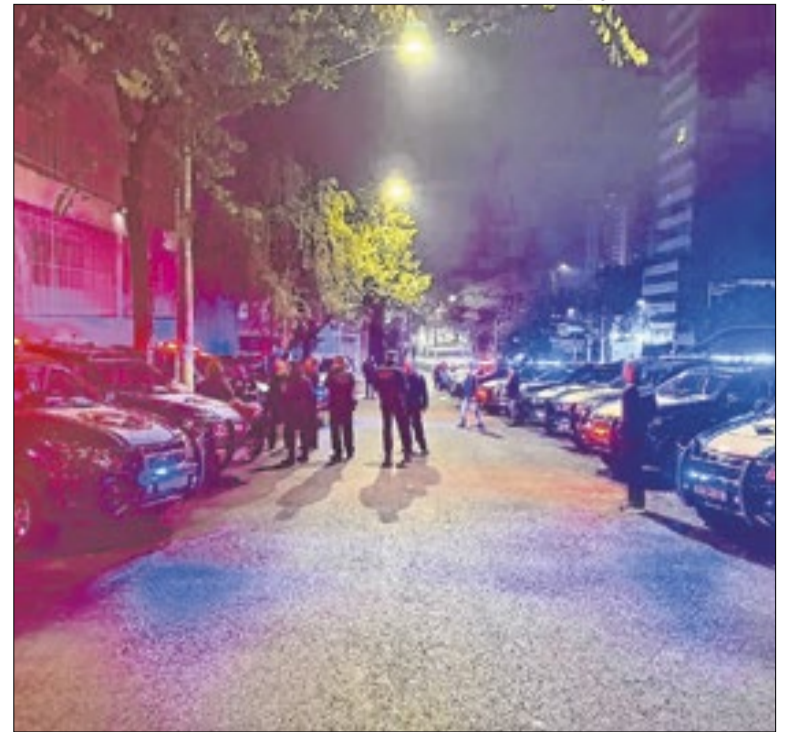
Investigação aponta o uso de empresas de fachada

O curso terá temas como ética na visitação hospitalar, biossegurança, uso de EPIs, legislação e acolhimento a pacientes e familiares. A capacitação tratará de protocolos exigidos pelas unidades de saúde e orientações para atuação em setores restritos, além de conteúdos sobre respeito à diversidade religiosa.