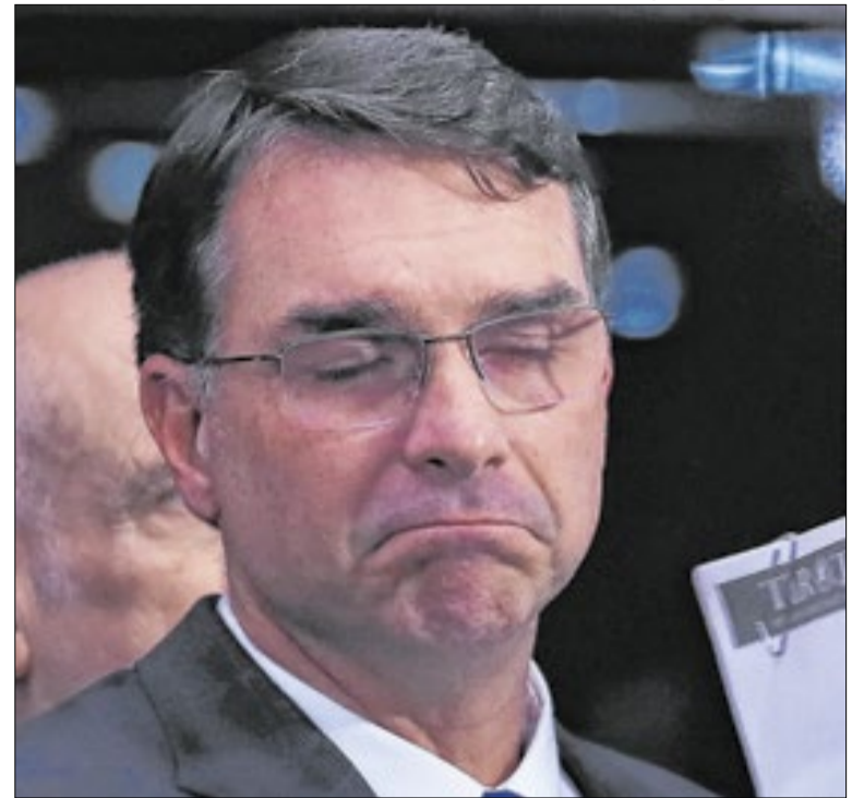
Flávio afirma que dinheiro recebido de Vorcaro "foi limpo"