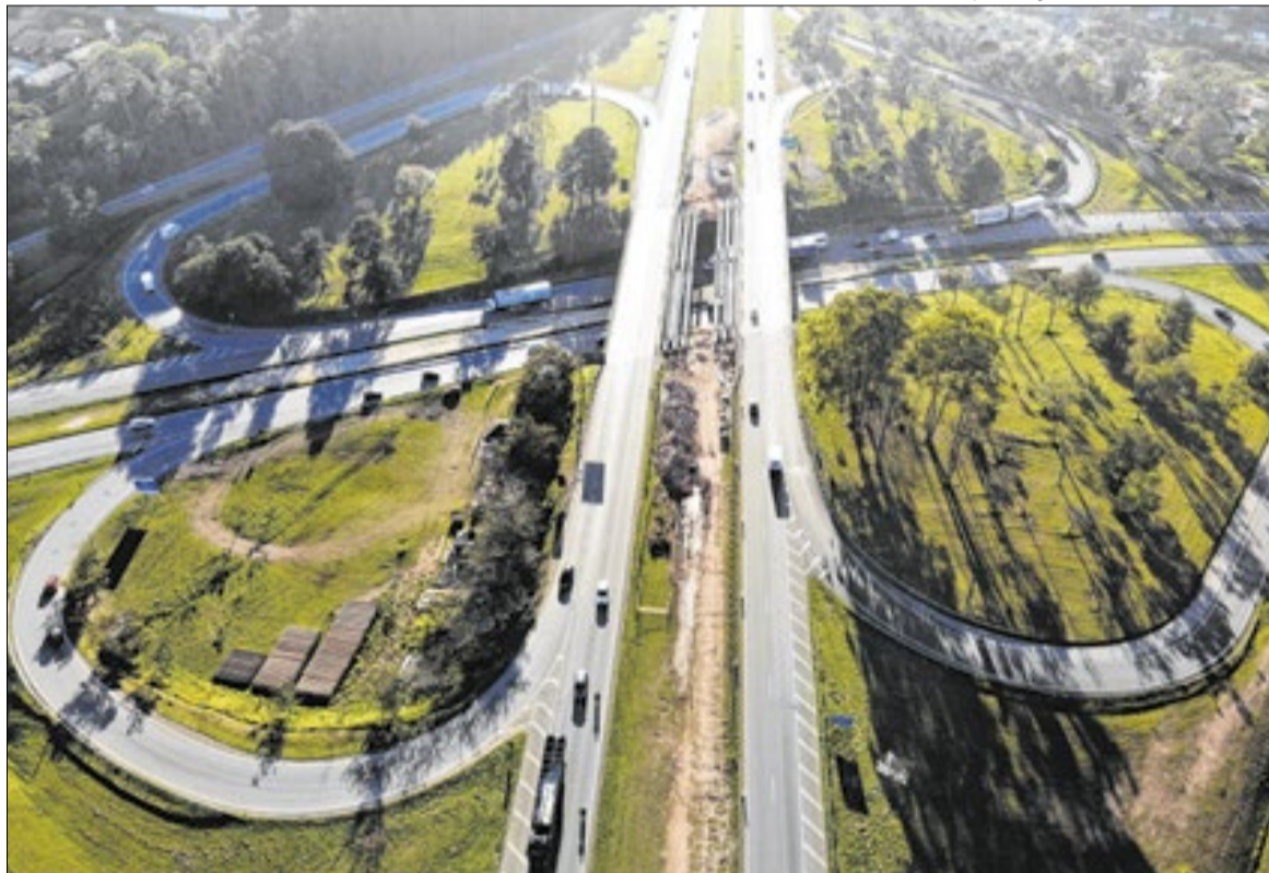
Estado recebeu estudos para implantação do Contorno Norte da Rodovia D. Pedro I

A proposta prevê a construção de um corredor viário de aproximadamente 32 quilômetros de extensão. O trajeto teria início na altura da ligação da D. Pedro I com o Anel Viário Magalhães Teixeira, próximo ao distrito de Sousas, em Campinas, seguindo até a Rodovia Anhanguera (SP-330), com conexões também às rodovias Professor Zeferino Vaz (SP-332) e Governador Adhemar Pereira de Barros (SP-340). O contorno atravessaria áreas de Campinas, Paulínia e Sumaré. Atualmente, o trecho urbano da Rodovia D. Pedro I recebe cerca de 125 mil veículos por dia. Nos horários de pico, motoristas enfrentam congestionamentos que chegam a dez quilômetros de extensão, principalmente entre os entroncamentos com as rodovias