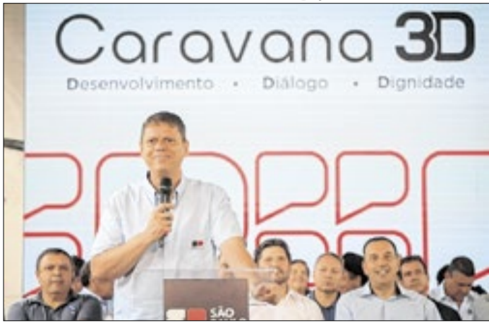
O Governador visita cidades para anunciar investimentos