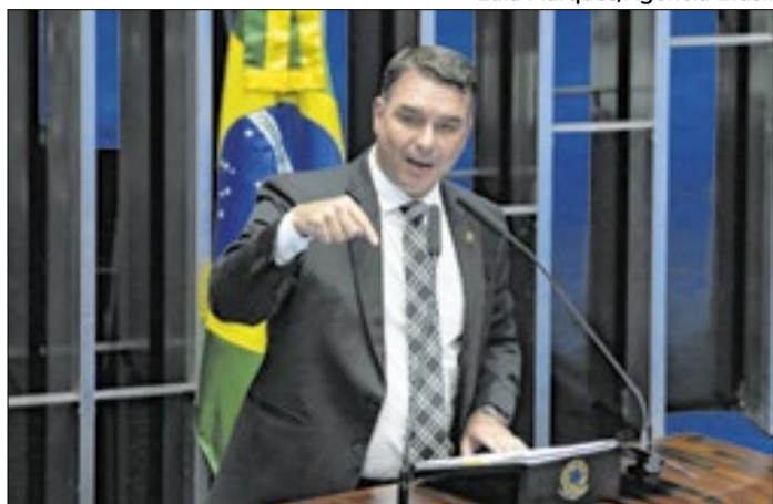
Flávio Bolsonaro pediu dinheiro ao Banco Master