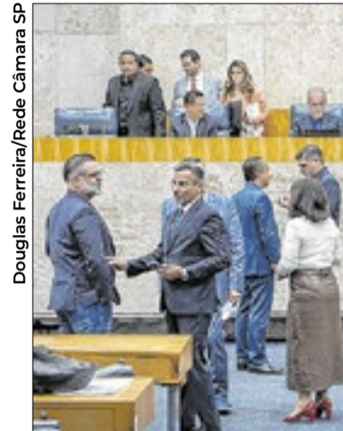
Sessão plenária que aprovou o aumento dos servidores

Entre os pontos contestados estão alterações envolvendo concursos públicos, evolução funcional e regras para cargos da educação infantil. As entidades avaliam que as medidas podem impactar