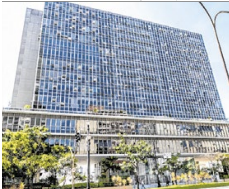
A investigação analisa o impacto das dívidas no município

Segundo a Câmara, a investigação pretende analisar o impacto das dívidas na arrecadação municipal, além de discutir possíveis mecanismos para ampliar a recuperação de créditos tributários pela Prefeitura. A expectativa é que representantes do Executivo, especialistas e empresas sejam convocados