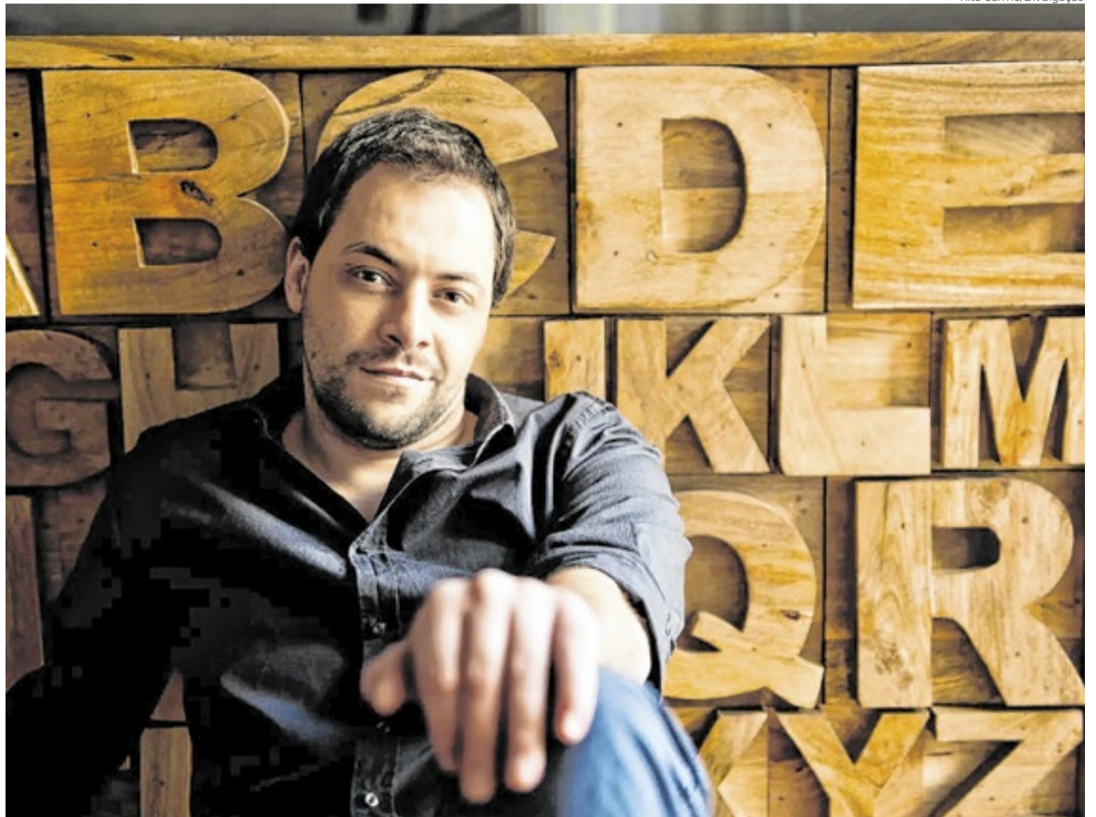
António Zambujo começou a cantar nos clubes de fado de Lisboa, mas logo abraçou novas influências, principalmente brasileiras

Dentro desse contexto, gravar a canção lançada por Caetano em 1979 era uma escolha natural. A faixa foi gravada em dueto com