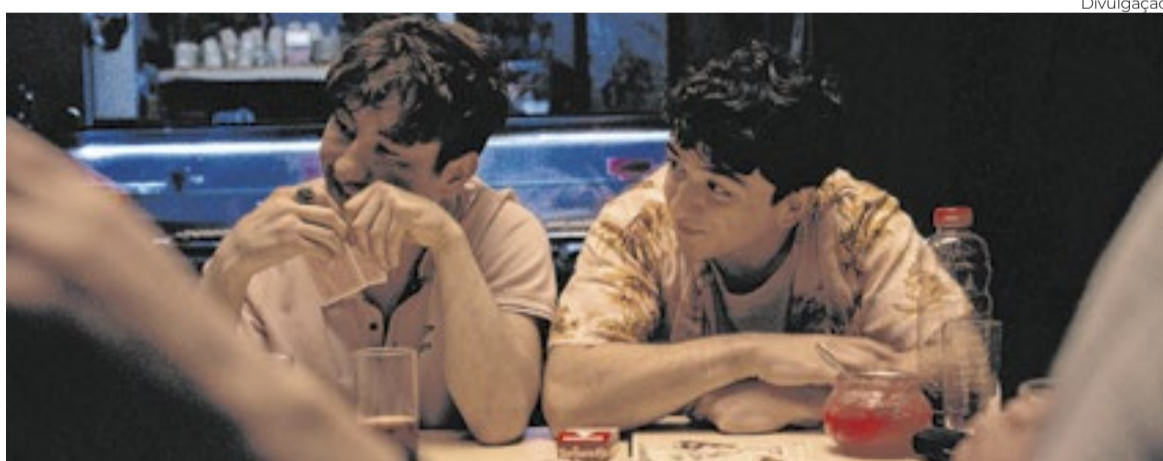
O coringa Barry Keoghan (à esquerda) amplia a popularidade de ‘Butterfly Jam’

da Crítica na mostra Un Certain Regard de Cannes, em 2019. Numa trama ambientada nos EUA, ele chega mais próximo do universo masculino do que nos seus longas-