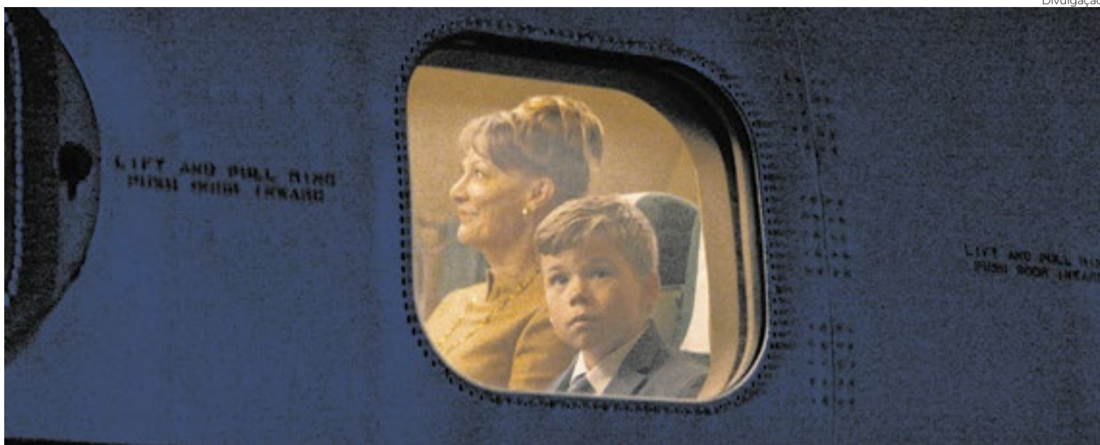
‘Aventuras nas Alturas’, primeiro filme dirigido por John Travolta, estreia em Cannes nesta sexta e chega à Apple no fim do mês