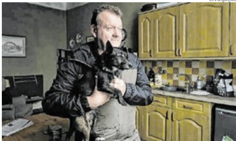
'O Último Pub', de 2023, foi o trabalho mais recente do bamba do roteiro em Cannes

Integrante do júri de Cannes, em 2026, Paul Laverty, roteirista escocês com duas Palmas de Ouro em seu currículo, toma a Croisette de assalto com suas reflexões políticas humanistas