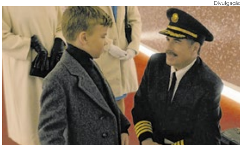
O eterno Tony Manero integra o elenco de seu debut como realizador, celebrando a aviação

Aos 72 anos, o eterno Tony Manero, celebrado ainda como Danny Zucco e Vincent Vega, faz da direção uma nova trilha de reinvenção ao levar a Cannes ‘Aventuras das Alturas’