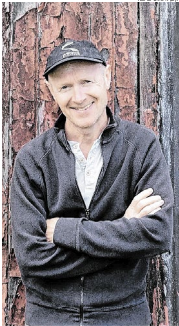
Aos 69 anos, Paul Laverty fez sua história profissional no cinema ao lado de Ken Loach, a partir de 1996

"Eu venho de uma geração que estudou Grego na escola e, embora não me lembre de muita coisa, sei que as raízes da palavra 'política' remetem para o modo como tratamos o povo, como se cuida do bem-estar da população. A política é parte do ar que respiramos. Quem se diz apolítico está a agir de modo político", disse Laverty, que, no final da conferência, fez referência ao cartaz oficial do evento, com o rosto de Susan Sarandon e Geena Davis