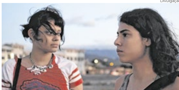
'Siempre Soy Tu Animal Materno', longa sobre reencontros familiares, pode dar à Costa Rica o Prix Un Certain Regard

passou um longo tempo na Europa, retorna para a América Latina e se reencontra com sua irmã mais nova, Amalia, de 20, que está se deixando levar por um caminho tão esotérico quanto existencial. Enquanto seu pai, Nahuel, busca segurança por meio de uma série de conquistas românticas e sua mãe, Isabel, dedica-se à reedição dos poemas eróticos de sua juventude, Elsa hesita. Deve tentar salvar uma irmã que se recusa a ser