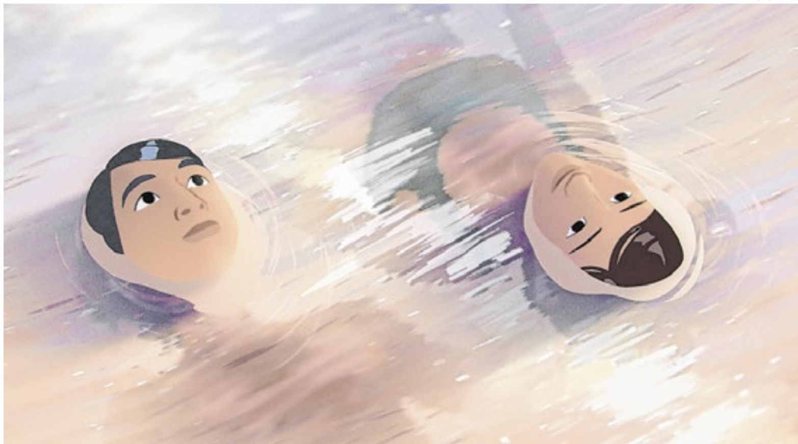
Dois adolescentes se apaixonam na versão (homônima) para as telas da graphic novel ‘In Waves’, de AJ Dungo

De um colorido dos mais acachapantes, “In Waves” é um filme que dói. Dói sobretudo por se deixar levar pelo inusitado, qual estivesse numa nau de autodescobertas. Em sua trama, Cannes navegou no amadurecimento do skatista AJ (interpretado na voz do multiartista Will Sharpe). Adolescente, o