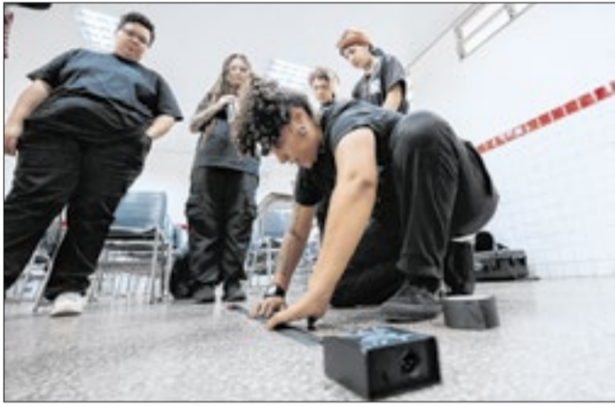
Favela em Cena: cursos gratuitos em montagem de palco