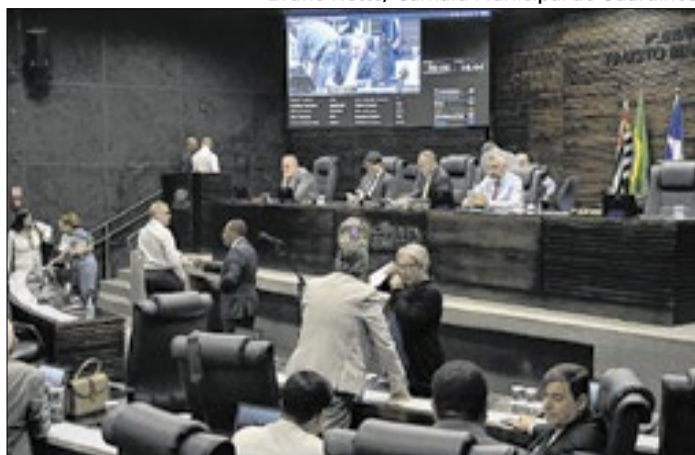
Sessão Ordinária na Câmara de Guarulhos

Bruno Netto/ Câmara Municipal de Guarulhos