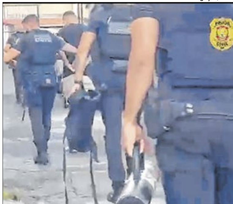
Suspeitos ofertavam veículos a preços abaixo do mercado

Os investigados poderão responder por estelionato eletrônico e lavagem de dinheiro.