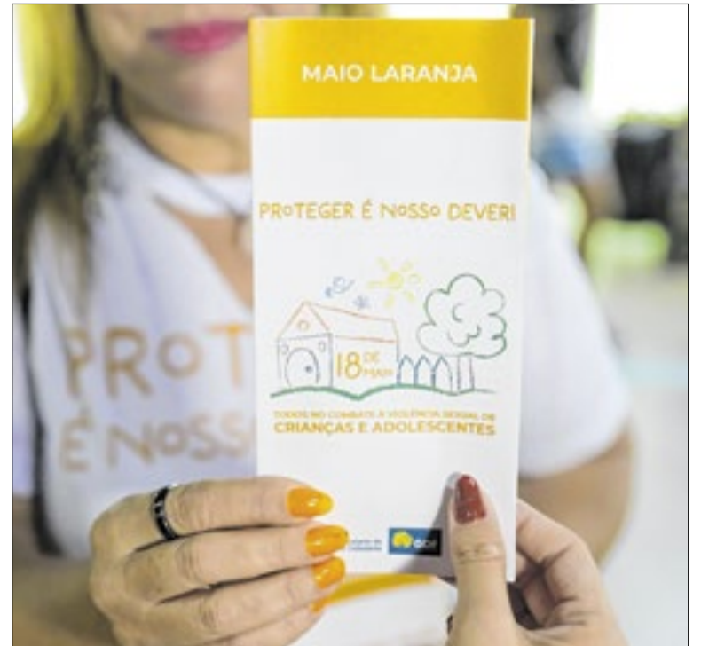
Informação de qualidade faz parte da programação

A Secretaria de Saúde de Mato Grosso do Sul divulgou uma nota sobre a hantavirose, doença transmitida por partículas de urina, fezes e saliva de roedores. O estado não registra casos desde 2019. Atualmente, há uma suspeita em investigação em Campo Grande (MS) após atendimento inicial por leptospirose.