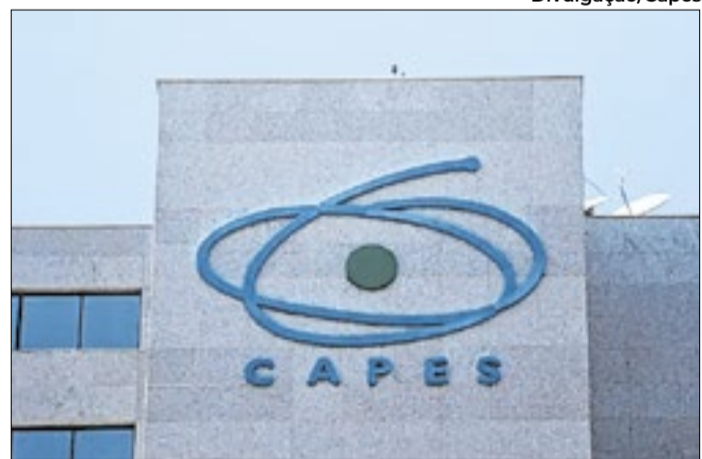
Iniciativa busca manter mulheres na carreira acadêmica