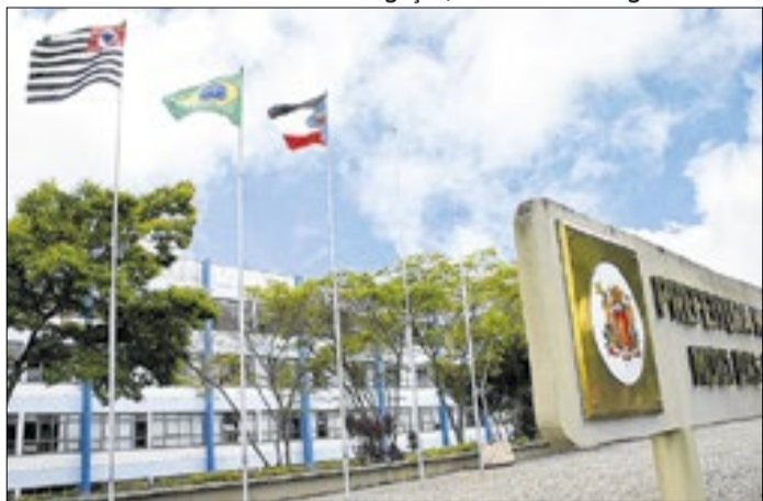
Em Mogi, médico é referência mundial com protocolos