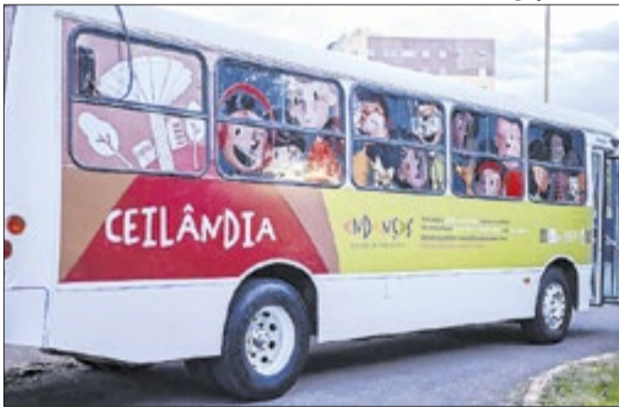
Mostra ficará na Biblioteca Pública até o próximo dia 23