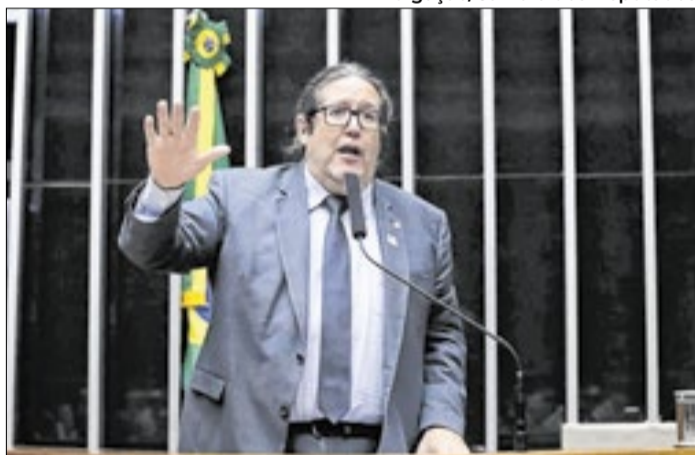
Deputado federal percorre cidades do Médio Paraíba