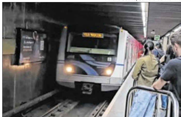
Metroviários criticava a falta de concursos públicos