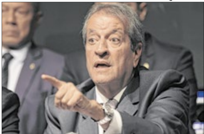
Presidente do PL deverá apontar saída