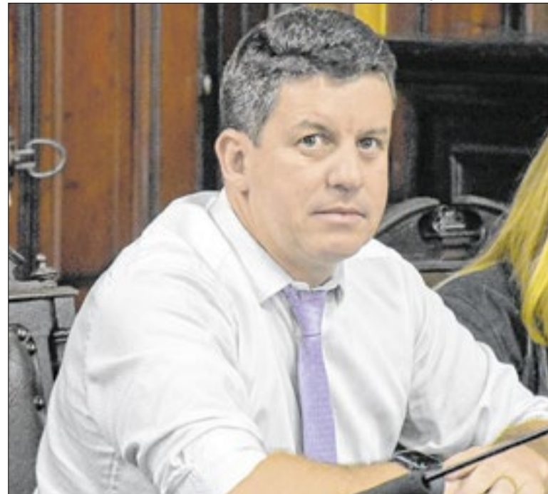
Admissibilidade pode ser votada nesta quinta-feira (14)