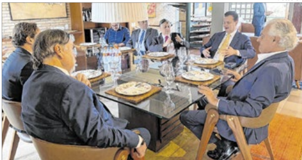
Almoço na Casa Correio da Manhã, em Brasília, reuniu o ex-governador e pré-candidato ao Planalto, Ronaldo Caiado, e o presidente nacional do PSD, Gilberto Kassab