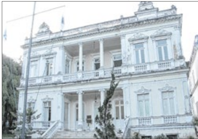
Prefeitura pede suspensão imediata da decisão