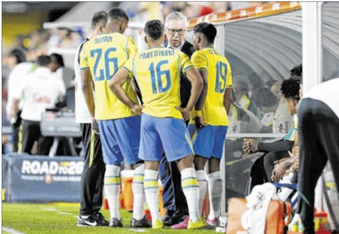
Copa do Mundo 2026 deve movimentar uma quantidade enorme de dinheiro no Brasil

bora diversão e entretenimento sejam a principal motivação para 54% dos potenciais apostadores, parte relevante dos entrevistados também associa a prática à possibilidade de obter renda extra para cobrir gastos do mês (31%) ou