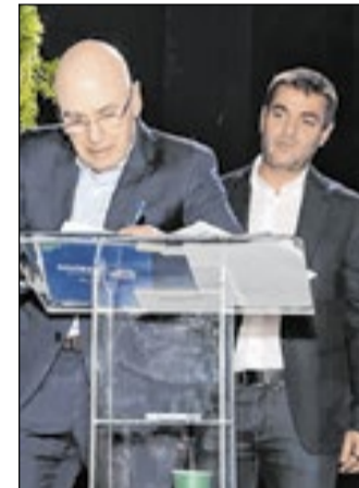
Durante o evento, Fecomércio RJ e Sindepat assinaram um convênio para ampliar o acesso dos associados do Sesc RJ aos atrativos turísticos