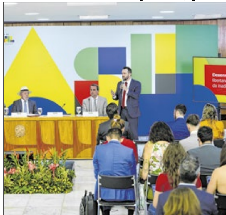
Desenrola teria ajudado na recuperação de Lula

“Ronaldo Caiado está em campanha somente há dez dias”, afirma Gilberto Kassab. Para ele, não é preciso bater em Flávio Bolsonaro para crescer sobre ele. “É comparação”, acredita. “A história de Ronaldo Caiado é a história de 40 anos de vida pública”. A de Flávio, comenta, “uma loja de chocolate”.