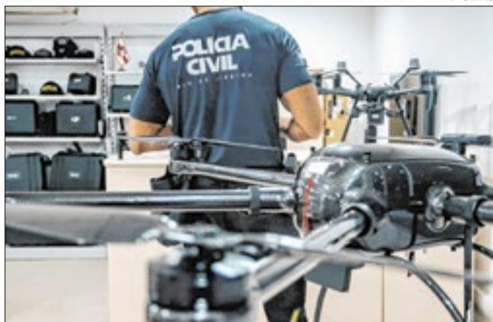
O uso de drones reforça o combate ao crime