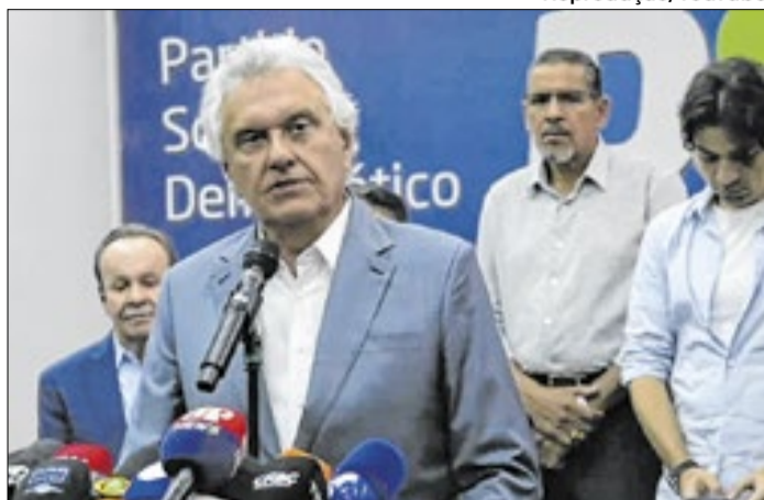
Ex-governador de Goiás é pré-candidato pelo PSD