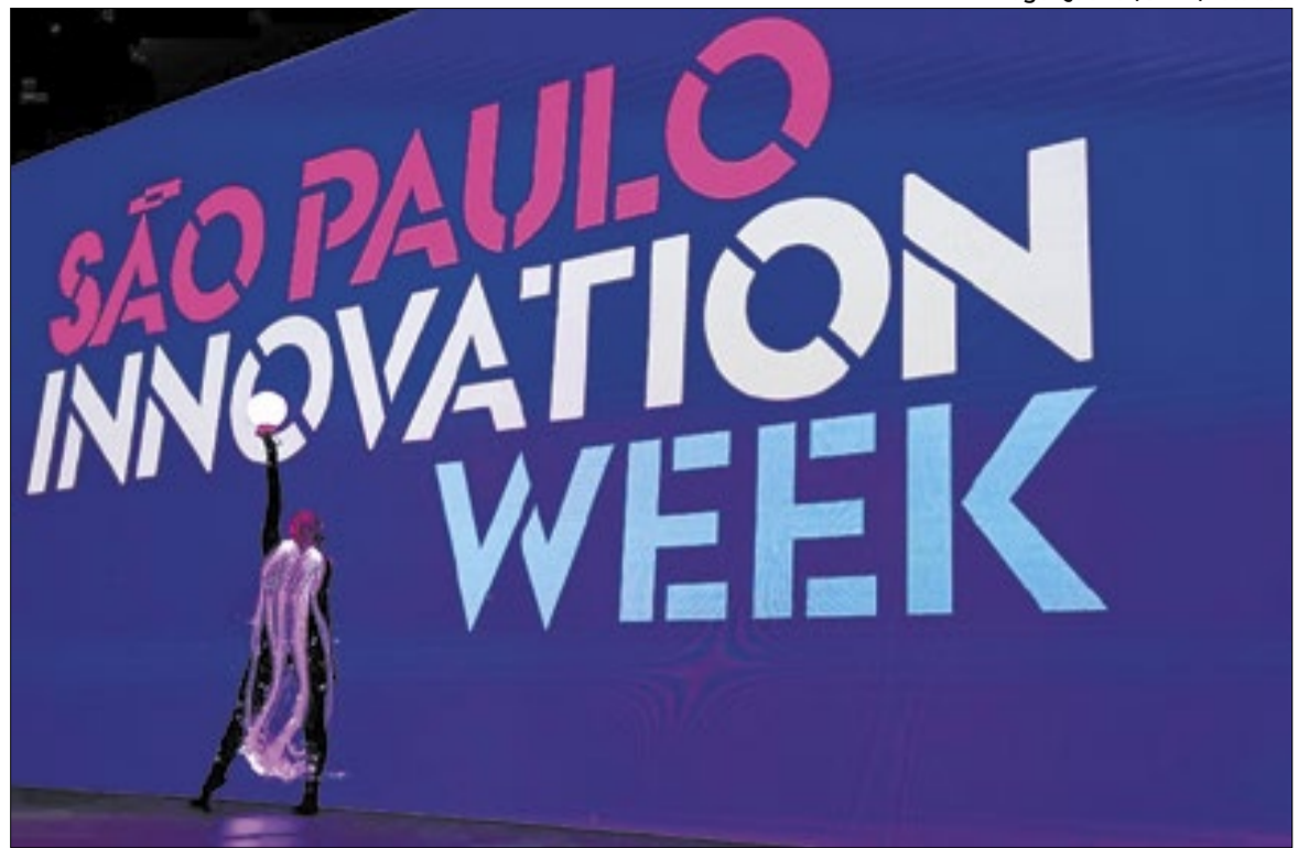
Organização espera receber 90 mil visitantes ao longo dos três dias de SP Innovation Week