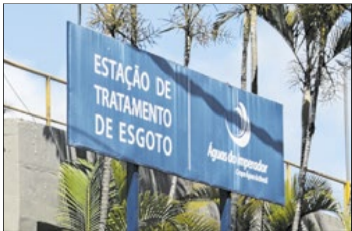
Município também pede anulação das multas impostas