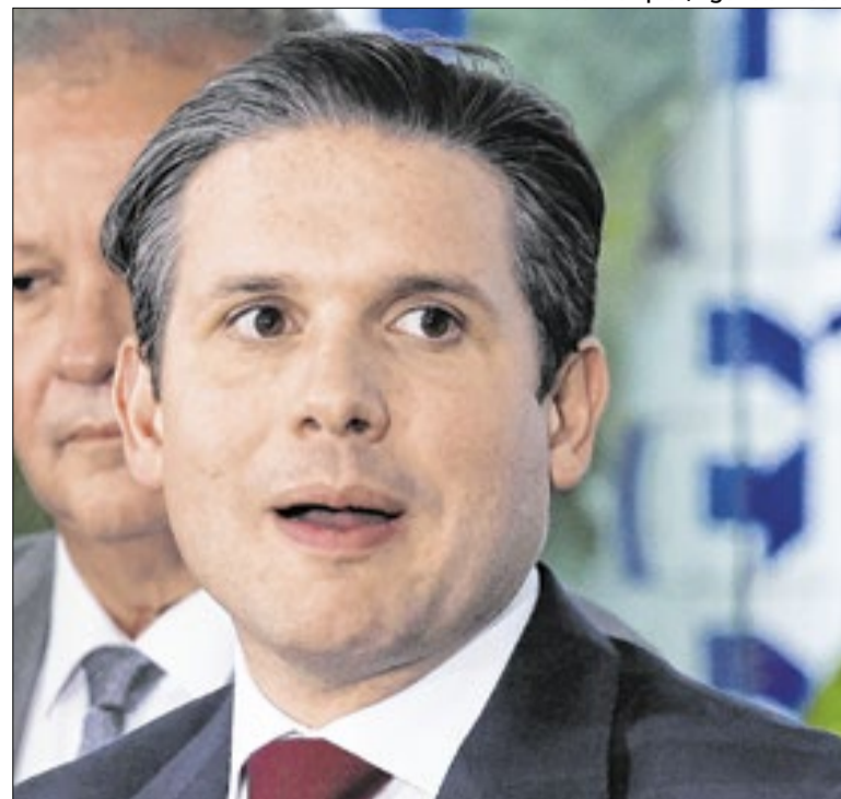
Motta: acordo com Lula para facilitar tramitação

A divulgação do escândalo complicou a vida do Datafolha, que havia iniciado na última terça entrevistas para uma pesquisa sobre eleição presidencial prevista para ser divulgada amanhã. A repercussão do fato e a eventual saída de Flávio da disputa tendem a contaminar a coleta de dados.