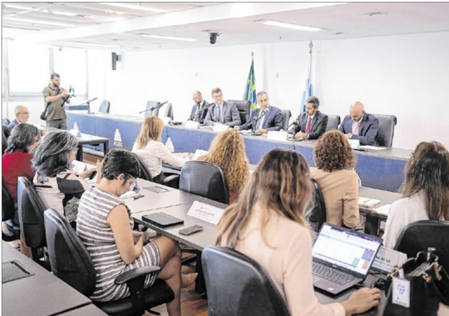
Governo prevê ganho de ICMS e de royalties do petróleo