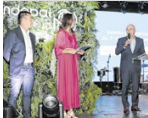
Evento é o principal encontro do trade de parques e atrações do país