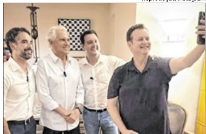
Governadores agora apoiariam Caiado