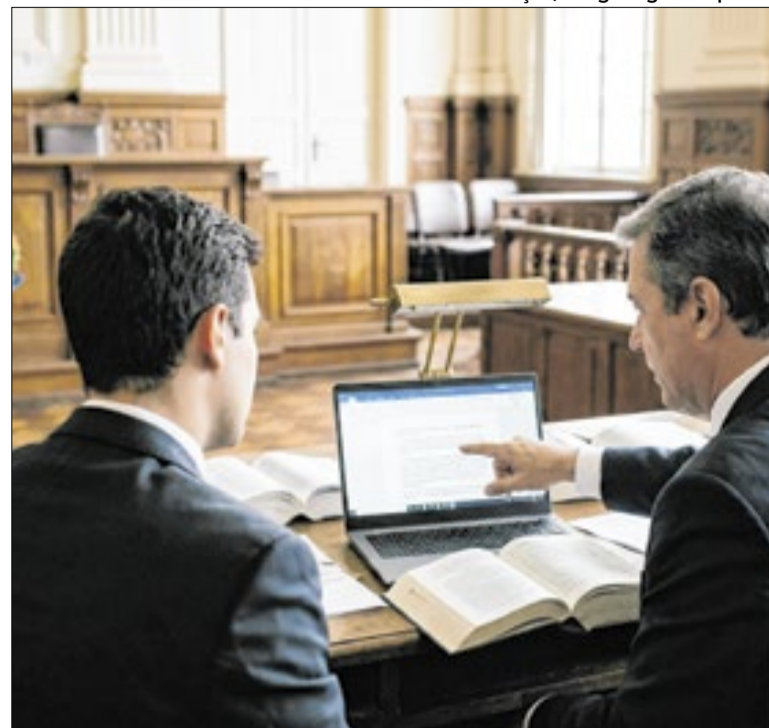
Proposta cria modelo de formação prática supervisionada

A minuta estabelece a conversão de 30 cargos vagos de juiz substituto em Segundo Grau em cargos de desembargador, sem a necessidade de ampliar a estrutura dos gabinetes dos futuros magistrados. Segundo o tribunal, a proposta foi precedida de estudo e não gera impacto orçamentário relevante.