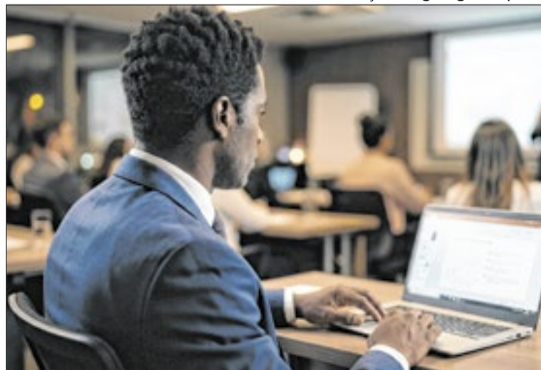
Escola quer formar 800 empreendedores negros em 2026

Nesse cenário, uma escola especializada em “Afronegócios” na cidade de São Paulo está promovendo nesta semana, de forma gratuita e online, uma formação voltada exclusivamente a empreendedores negros. A programação teve início na segunda-feira e termina nesta quinta (15), das 19h30 às 21h, com temas que abordam planejamento estratégico, gestão financeira, vendas, tecnologia e desenvolvimento de negócios. São cinco encontros com