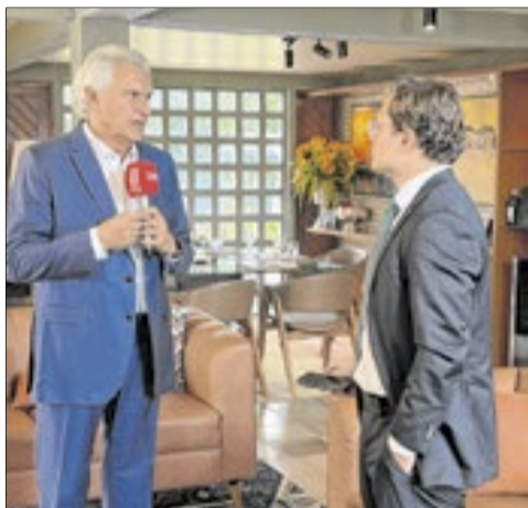
Nesta edição de fim de semana, uma entrevista exclusiva com Ronaldo Caiado, pré-candidato à Presidência