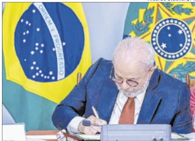
Medida Provisória foi assinada pelo presidente Lula na terça (12)

taxa. Consumidora frequente de sites estrangeiros ela conta que passou a evitar os aplicativos depois que os preços finais começaram a subir.