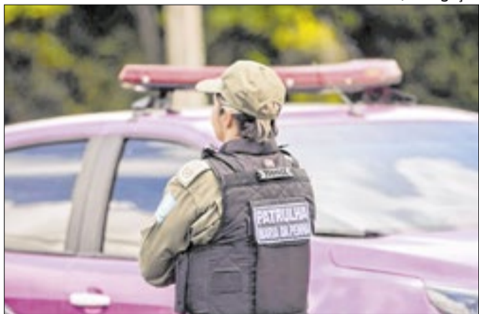
Atendimento on-line funciona desde dezembro de 2025