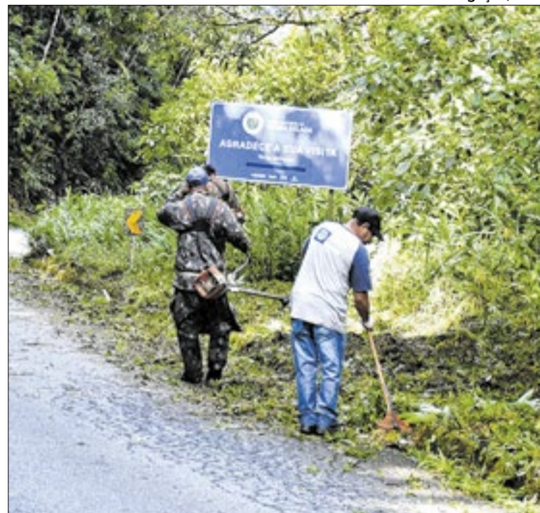
Rodovia estadual é de responsabilidade do DER-RJ

“A Lei do Aço foi construída para garantir competitividade e estimular investimentos no Rio de Janeiro. Hoje vemos os resultados dessa política pública na geração de empregos, no fortalecimento da indústria e no desenvolvimento econômico de várias cidades do interior, especialmente no Sul Fluminense”, afirmou.