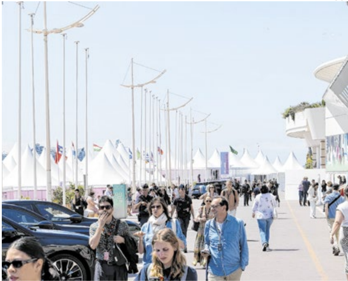
Cerca de 16 mil participantes são esperados pelo Marché du Film este ano, ao longo de dez dias

Área de negócios do maior festival do mundo, o Marché du Film é um mundo paralelo de Cannes, com exibições para distribuidoras e redes exibidoras em busca de lucro na arte