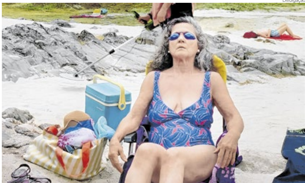
‘Algumas Coisas Que Acontecem Ao Lado De Um Rio’ concorre à Palma de curtas, via Portugal

Concorrem com “Algumas Coisas Que Acontecem Ao Lado de um Rio” nove curtas: “Dernier