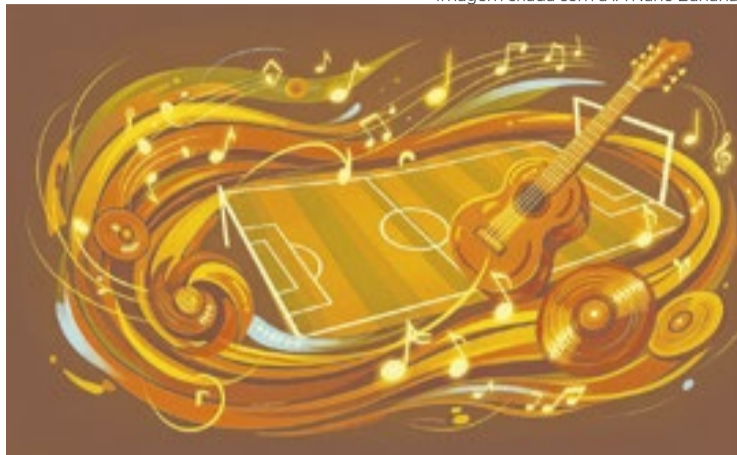
Imagem criada com a IA Nano Banana