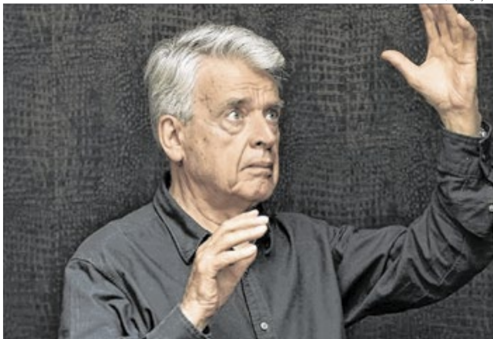
O nonagenário Alain Cavalier volta a Cannes pela Quinzena dos Cineastas

Nesta quinta-feira (14), Cannes tem um compromisso semiológico com o real, numa mistura de ensaio, documentário, diário filmado e fabulação chamada "Merci d'Être Venu" (título literalmente traduzível como "Obrigado Por Ter Vindo"), cujo diretor é um patrimônio (hoje nonagenário) do cinema francês: Alain Cavalier.