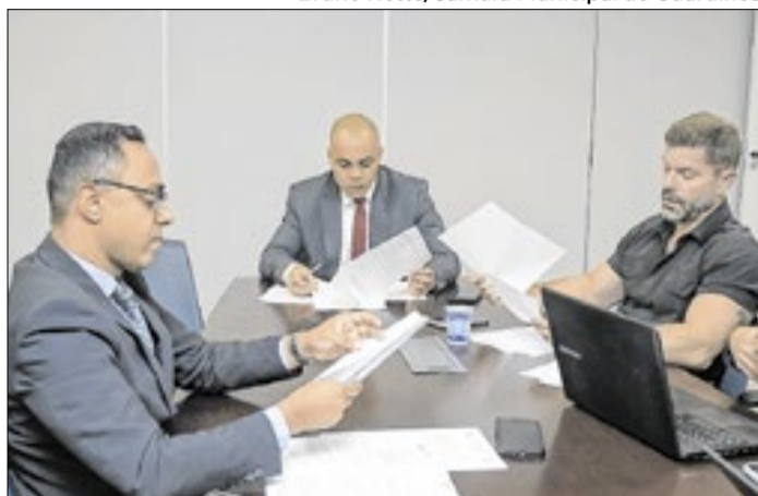
Os projetos tratam sobre a segurança da cidade