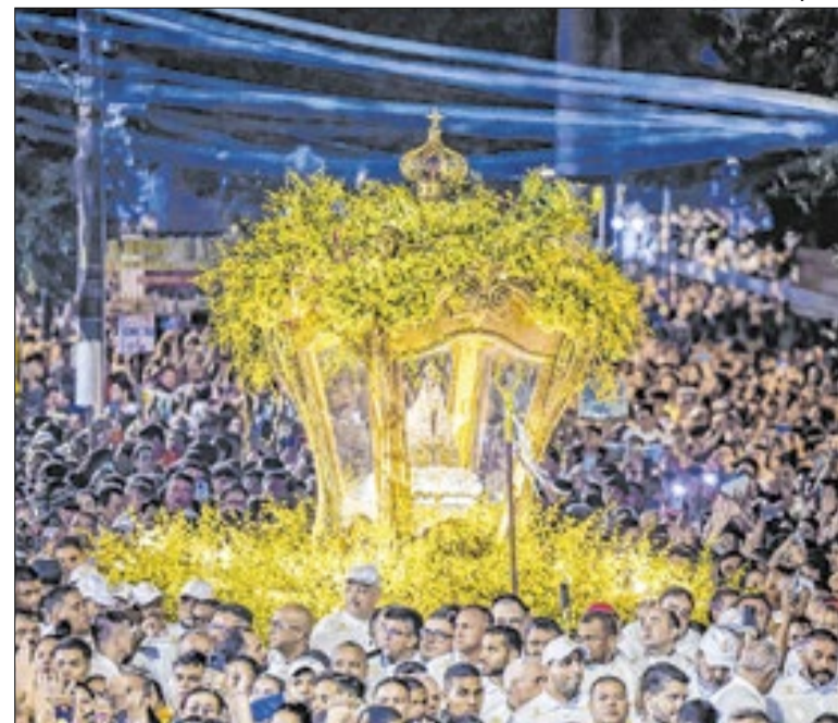
Círio de Nazaré, em Belém, é um dos símbolos do segmento

A Setur-DF lançou edital de até R$ 4 milhões para fortalecer a promoção turística da capital federal. A iniciativa prevê ações de marketing, press trips com jornalistas, famtours e divulgação das rotas turísticas, reforçando a aposta do Distrito Federal em posicionar a cidade de forma mais competitiva no mercado.