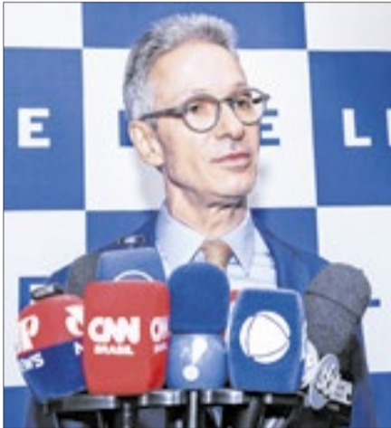
'O Brasil precisa de uma chacoalhada', diz ex-governador do MG Zema ao defender choque fiscal e privatizações