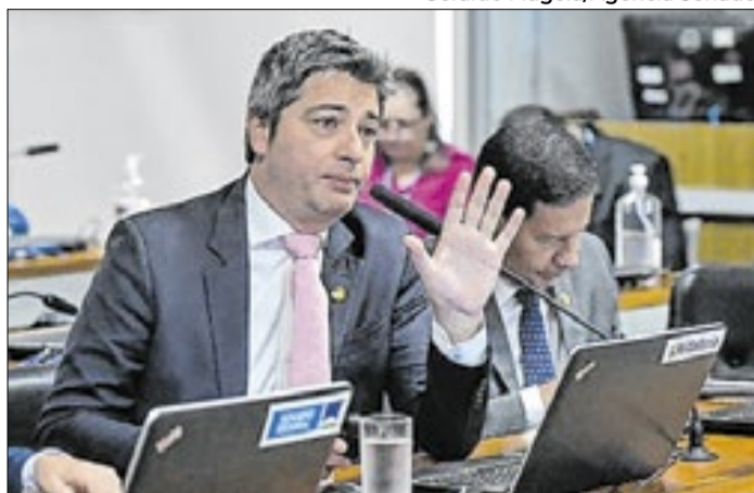
Portinho quer discutir mais fim da seis por um