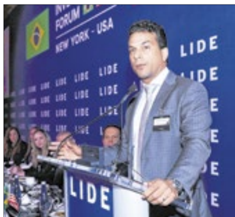
Senador Irajá defende cassinos e abertura do agro ao capital estrangeiro