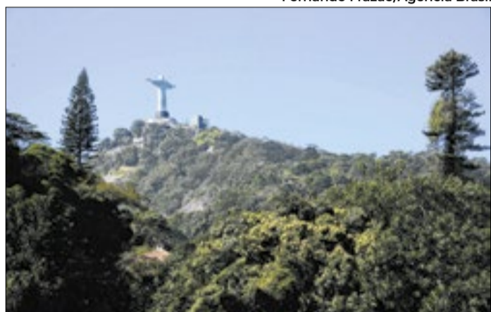
Parque Nacional da Tijuca é o que mais recebe turistas