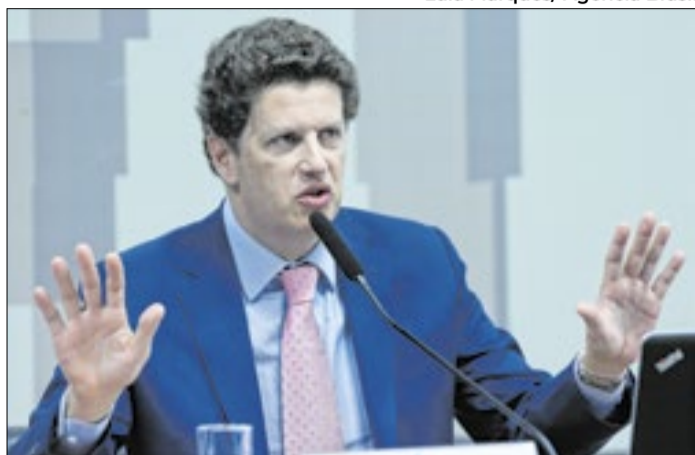
Salles não pretende recuar dos ataques a Valdemar