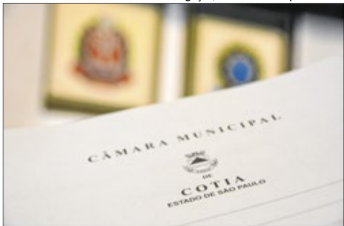
As propostas foram analisadas durante reunião