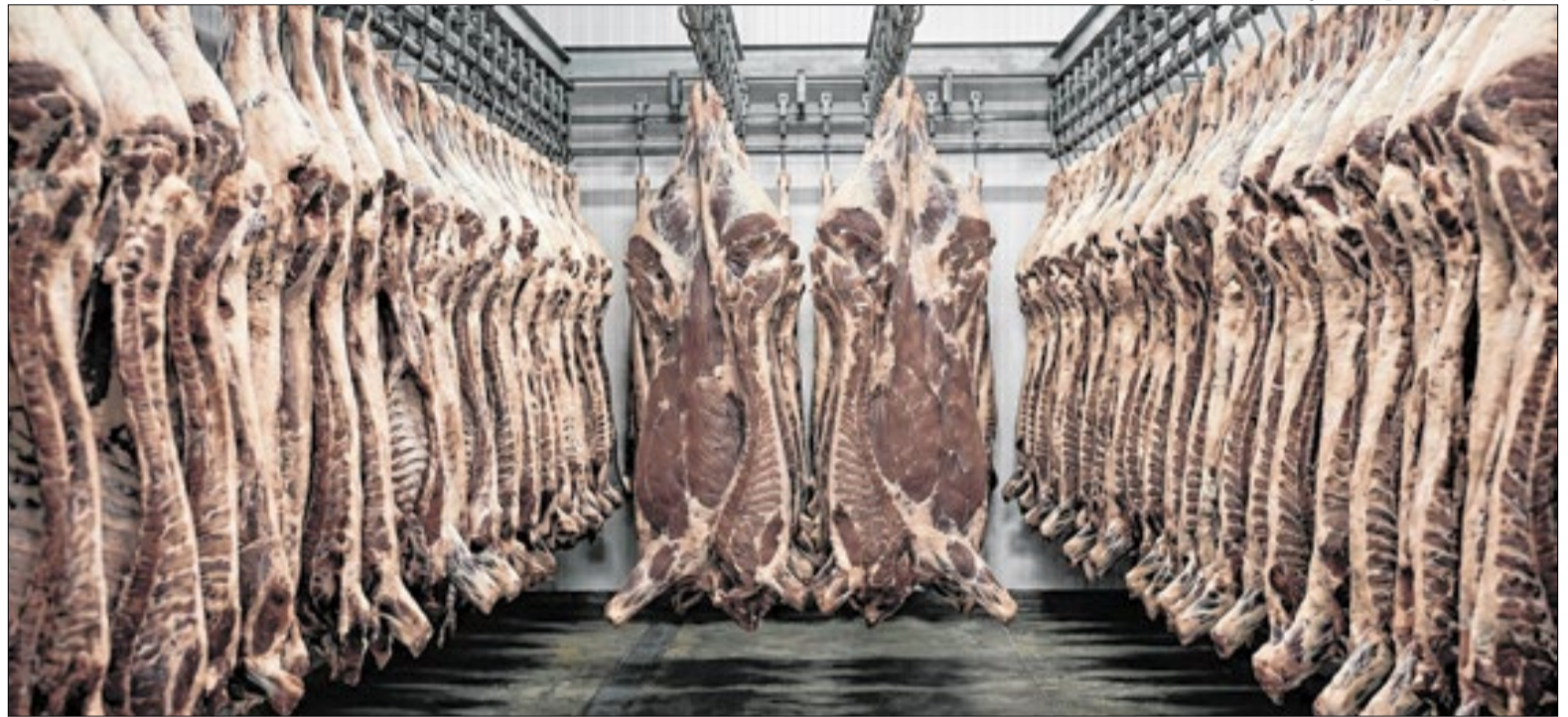
Decisão pode afetar frigoríficos e produtores brasileiros que exportam carne bovina e aves

Em nota conjunta, os ministros da Agricultura e Pecuária, das Relações Exteriores e do Desen-