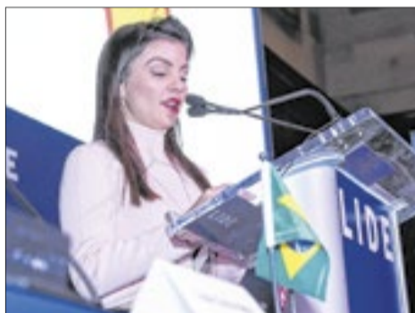
Deputada Marussa Boldrin: 'A maior pauta social é gerar emprego'