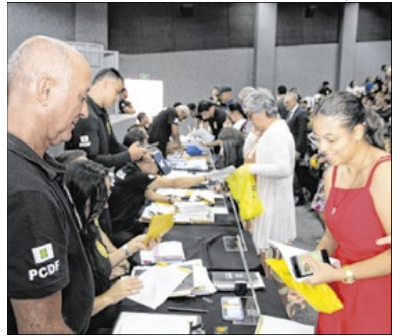
Aparelhos foram recuperados após furtos ou roubos

Em maio de 2025, a PCDF lançou a ferramenta Consulta IMEI no portal oficial da corporação. O serviço permite verificar, pela internet e com o número de identificação do aparelho, se há restrição por roubo ou furto.