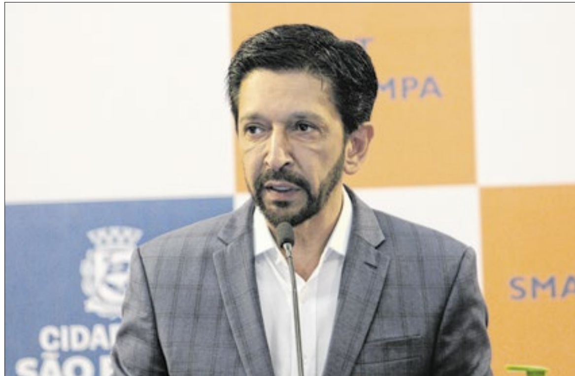
Nunes disse que a Companhia Sabesp deverá indenizar as vítimas da explosão no Jaguaré

Horas depois, a Sabesp informou a ampliação do auxílio para R$ 5 mil, pagos em parcela única. De acordo com a companhia, famílias