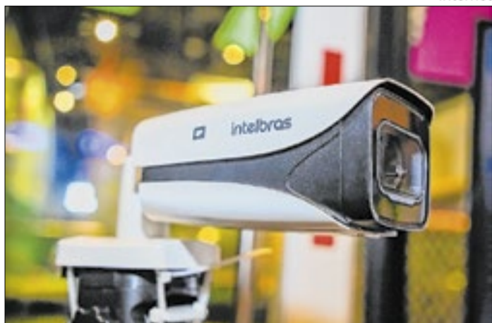
DF: Cerca de 800 condomínios usam portarias eletrônicas