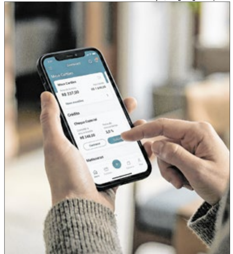
Cheque especial tem taxa média de 8% ao mês

O Procon-SP reforça a orientação para que consumidores comparem taxas entre bancos, analisem o Custo Efetivo Total (CET) e priorizem o planejamento financeiro antes de contratar empréstimos. O órgão alerta ainda para o risco de endividamento provocado pelo uso contínuo do cheque especial, considerado uma das modalidades mais caras do mercado.