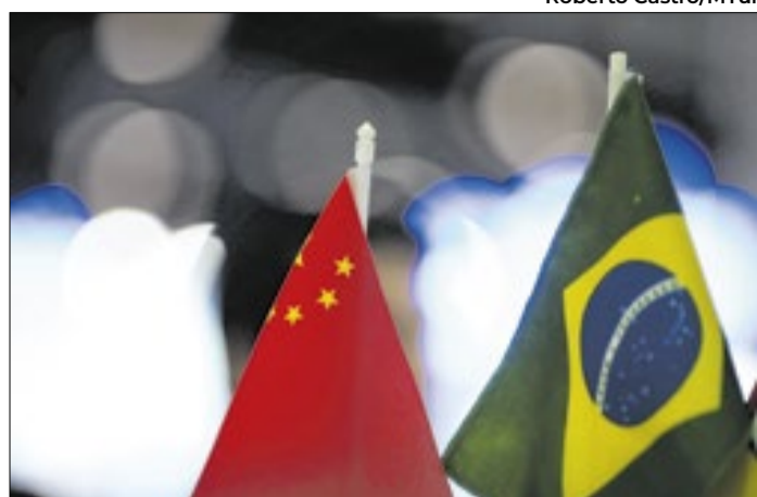
País asiático vira prioridade para o turismo brasileiro