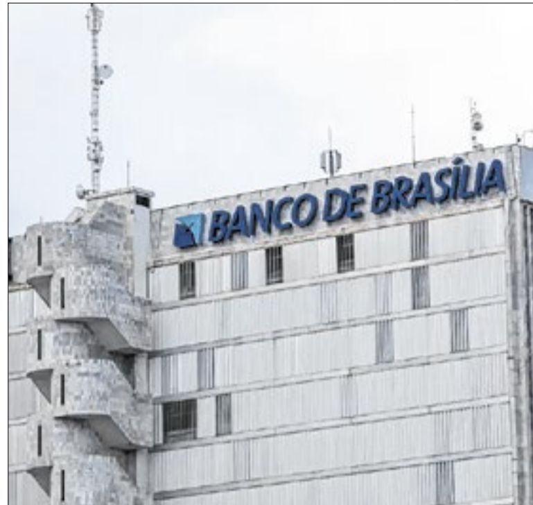
BRB enfrenta uma grave crise financeira grave

O grupo transportes recuou 1,32% e ajudou a conter o índice geral. Passagem aérea, gasolina, ônibus urbano e seguro de veículo tiveram queda, enquanto automóvel novo, óleo diesel e taxas de emplacamento subiram. O IPCA considera famílias com renda de 1 a 40 salários-mínimos e compara preços coletados entre 1º e 30 de abril.