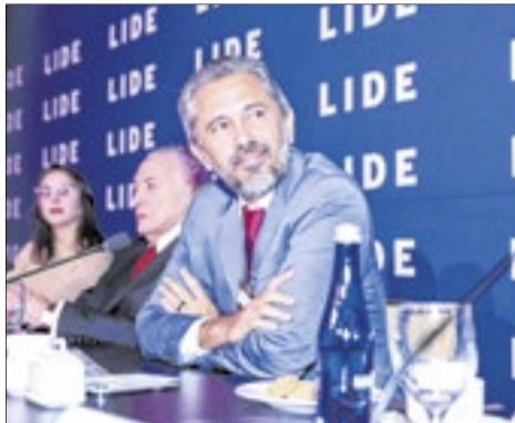
Elmano de Freitas, governador do Ceará: 'O Brasil é maior do que as nossas ideologias'