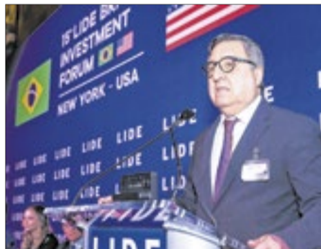
Deputado Danilo Forte: 'O mundo está ávido por soluções, e elas passam pelo Brasil'