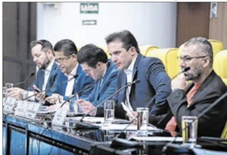
Parlamentares ouviram o presidente de uma construtora

Com a definição do cronograma para o relatório final, os traba-