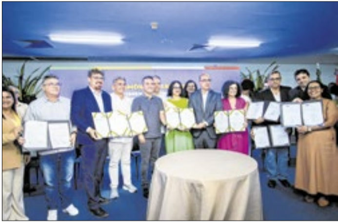
Também foi lançado também o Programa Mais Ciência