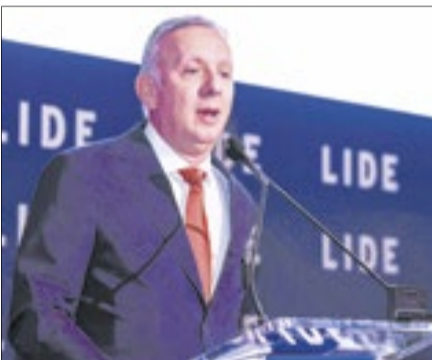
Deputado Aguinaldo Ribeiro: 'Precisamos discutir que país queremos construir'