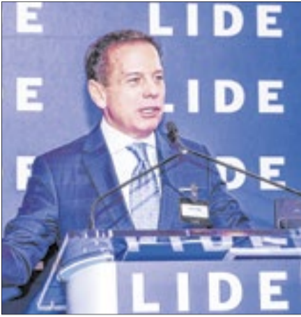
'O ódio destrói, o diálogo constrói', diz João Doria ao defender pacificação política no Brasil