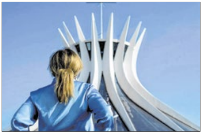
Amneres reúne dois livros, nessa nova publicação