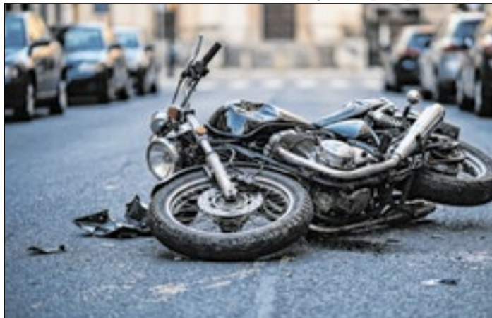
Homem roubou moto e sofreu acidente em seguida