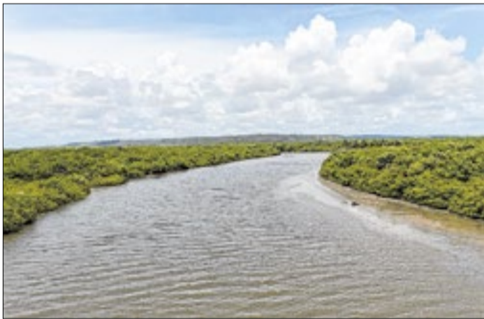
As inscrições estarão disponíveis até 11 de junho