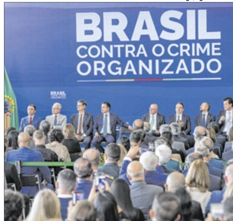
Lula informou que recriará Ministério da Segurança

Ricardo Salles deseja ser ele o candidato da direita na chapa pela reeleição de Tarcísio de Freitas (Republicanos) em São Paulo para o Senado. E o PL e Eduardo Bolsonaro querem André do Prado. Há, portanto, uma disputa política. Que Salles, porém, pontua ao Correio Político que é também ideológica.