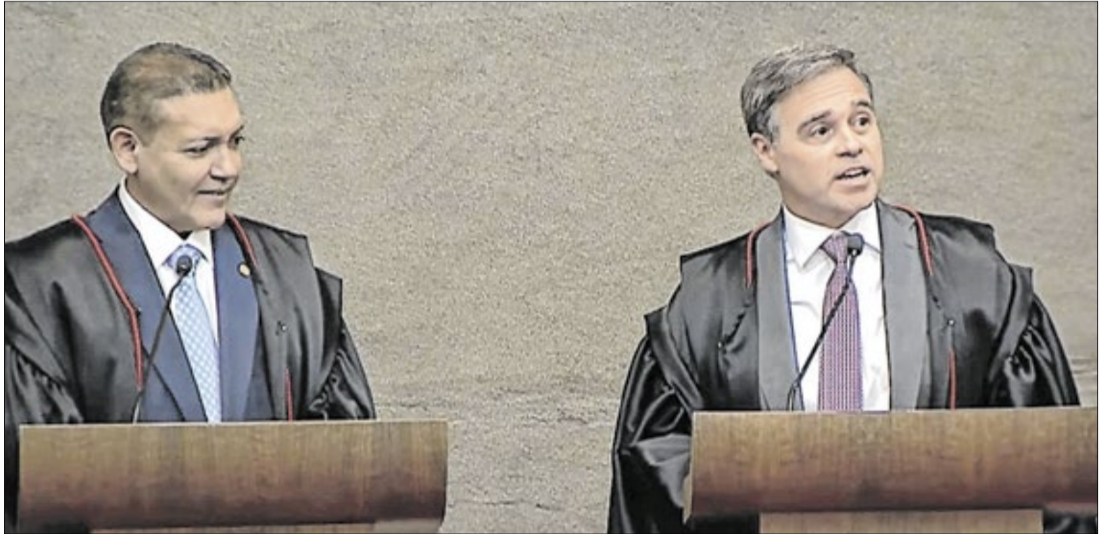
Nunes Marques e André Mendonça conduzirão eleições deste ano

“Esse será o ponto mais sensível nesse pleito. Principalmente direcionar as decisões, quais serão os mecanismos a serem enfrenta-