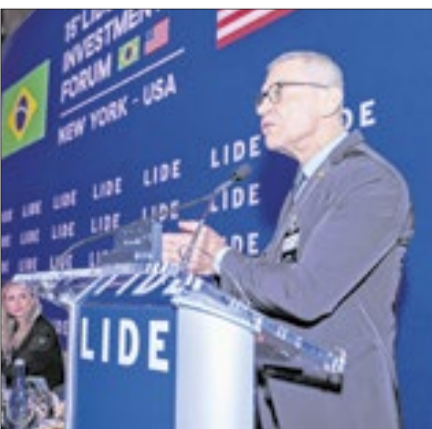
'Não legislar também é uma decisão', disse senador Contarato ao defender responsabilidade política