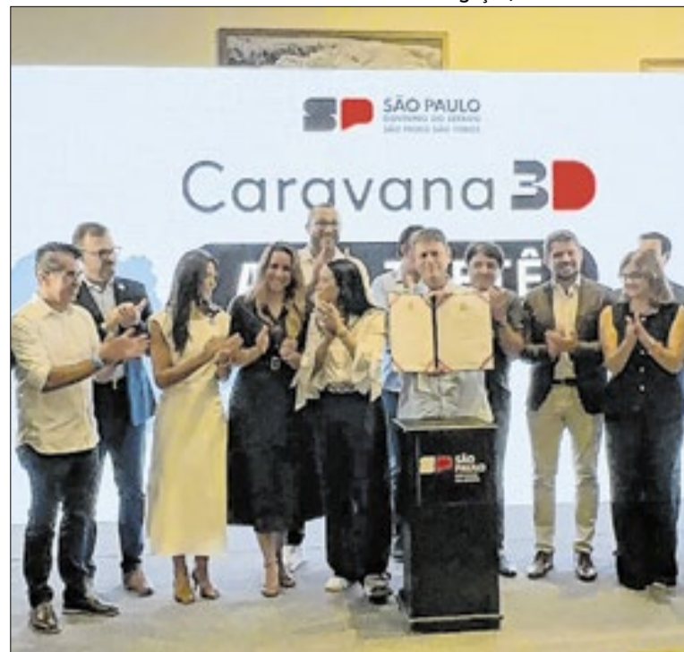
O Governador investirá em escolas e vias da cidade