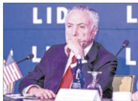
'Brasil é o país das oportunidades', disse ex-presidente Michel Temer ao defender otimismo diante de inflação e juros altos