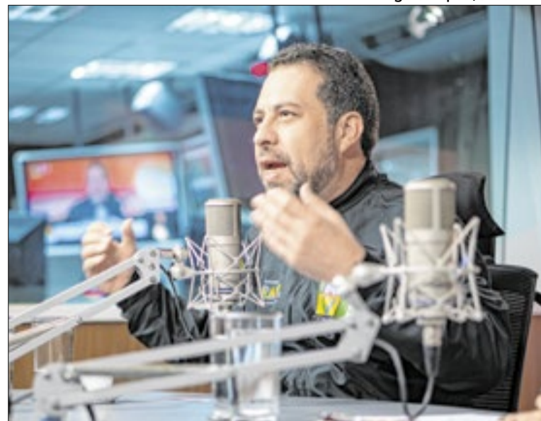
Correio da Manhã participou do programa ‘Bom dia, Ministro’

Pelo regimento, a instalação deveria ter ocorrido na sessão seguinte do Congresso. O tema, porém, foi ignorado pelo presidente do Senado, Davi Alcolumbre (União-AP). Segundo Jordy, Mendonça, relator da ação, mostrou-se “solícito e sensibilizado”, e falou que iria avaliar: “Estamos aguardando”, diz o deputado.