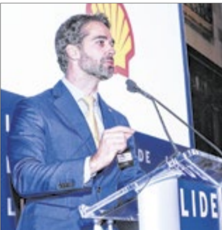
'Não existe lugar no mundo em que a sociedade tenha prosperado com um governo desajustado', disse o governador do RS, Eduardo Leite