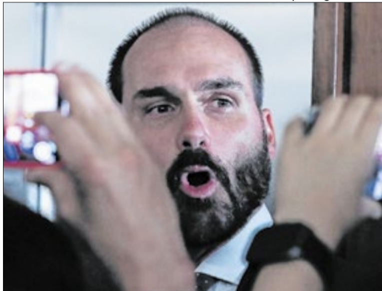
Para PGR, ações de Eduardo tiveram o propósito de coagir

Nas alegações, Gonet disse que Eduardo apresentou condutas criminosas ao realizar postagens nas redes sociais e conceder entrevistas à imprensa com o objetivo