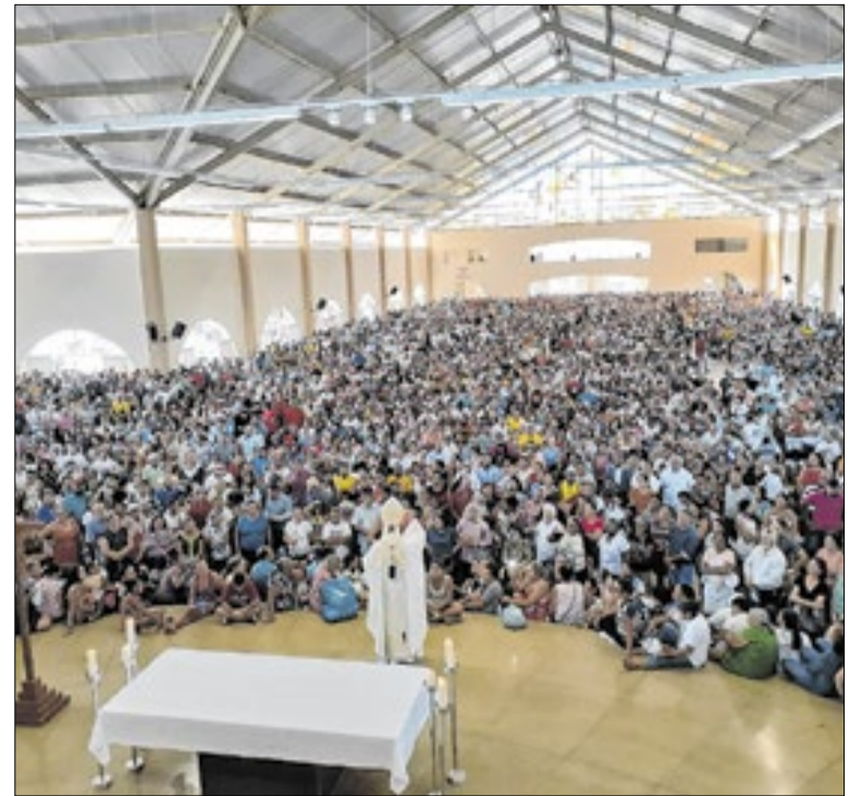
O segmento movimentou cerca de R$ 15 bilhões

O bairro Cidade Universitária, em Maceió, registrou 71 dias sem homicídios. A área, que compreende conjuntos como Eustáquio Gomes de Melo, Graciliano Ramos, Village Campeste e Jardim Royal, é patrulhada pelo 12º Batalhão de PM, subordinado ao Comando de Policiamento da Região Metropolitana.