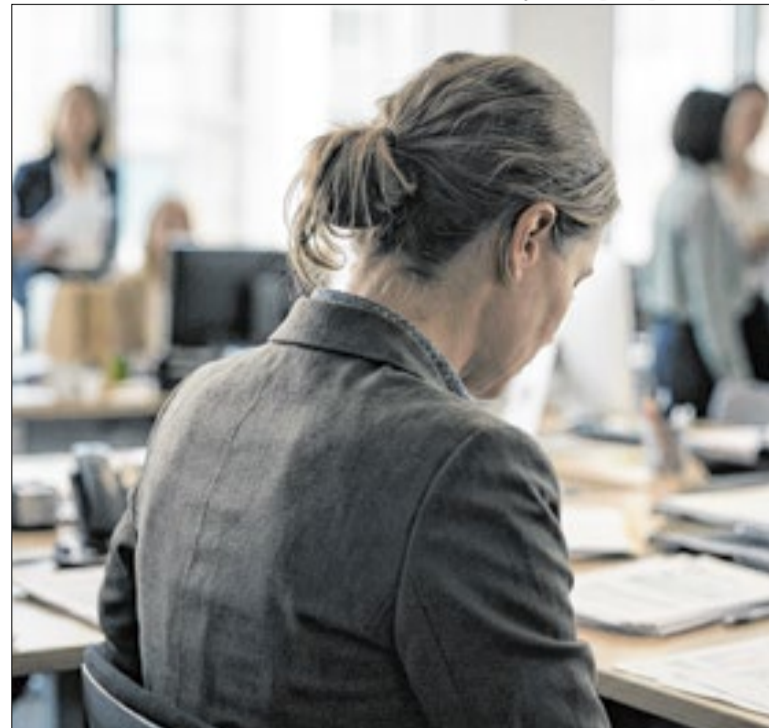
Prática pode gerar indenizações por danos morais

Antes, esse tipo de exame estava disponível no SUS apenas para três situações específicas. Com a nova norma, o acesso ao PET-CT foi ampliado, contribuindo para decisões terapêuticas mais precisas. A medida é resultado de esforços realizados pelo 4º Ofício da Procuradoria da República no Paraná.