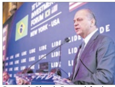
Deputado Ricardo Barros defende protagonismo do Brasil em crédito de carbono, IA e energia limpa