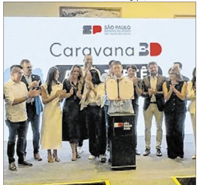
O Governador investirá em escolas e vias da cidade