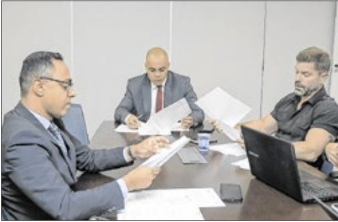
Os projetos tratam sobre a segurança da cidade