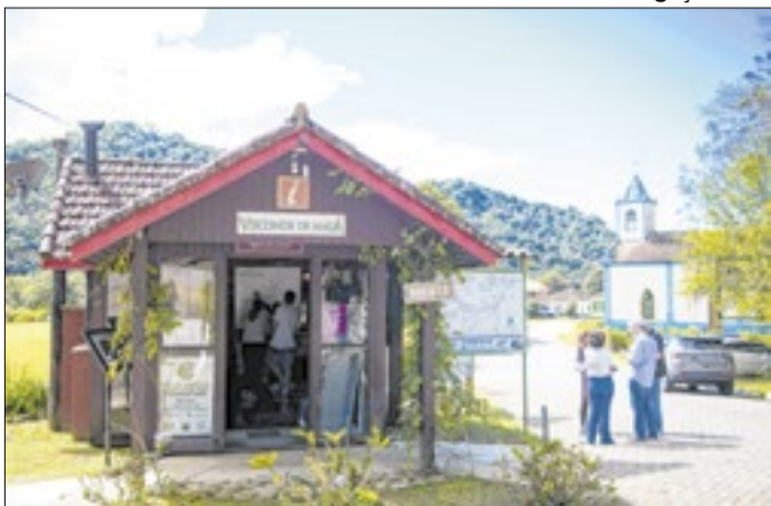
Vereadora quer novas obras em Visconde de Mauá