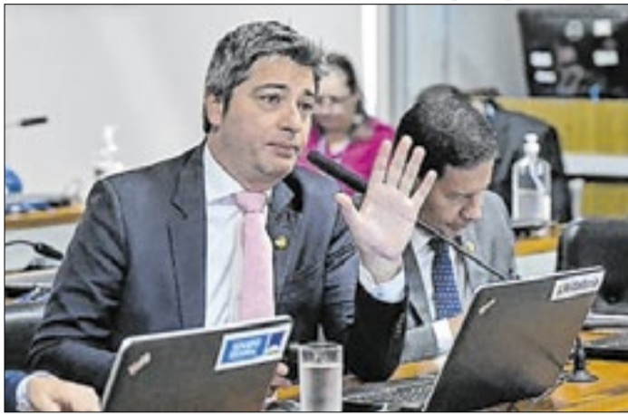
Portinho quer discutir mais fim da seis por um