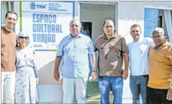
Prefeito Pezão em inauguração de espaço em Pirai