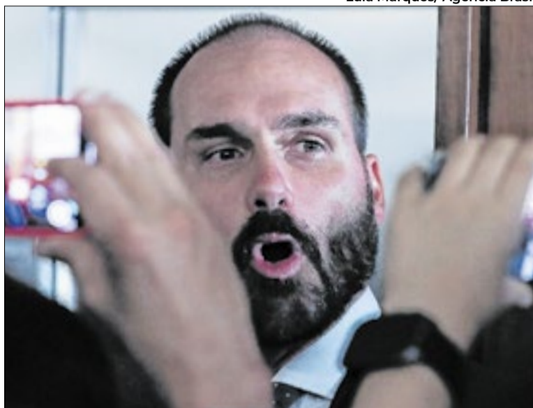
Para PGR, ações de Eduardo tiveram o propósito de coagir

Nas alegações, Gonet disse que Eduardo apresentou condutas criminosas ao realizar postagens nas redes sociais e conceder entrevistas à imprensa com o objetivo