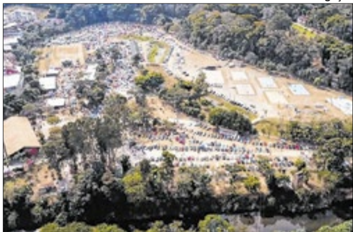
Projeto segue para sanção ou veto do prefeito