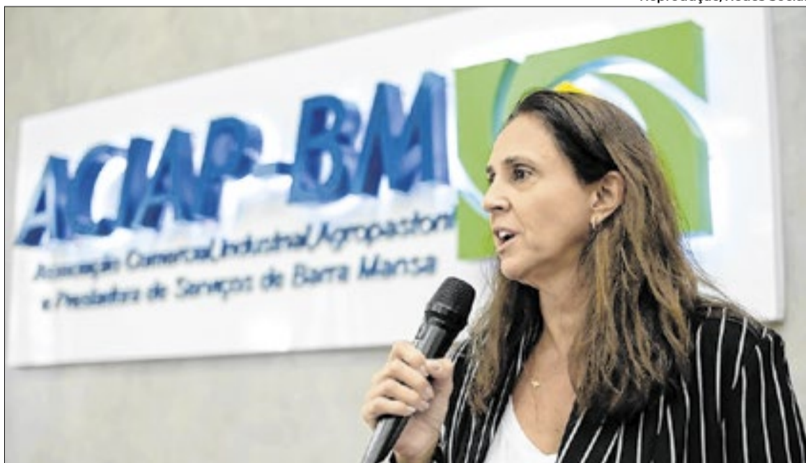
Presidente da Aciap-BM explica que entidade votou contra reajuste tarifário

nas a aplicação de reajustes anuais com base em índices inflacionários. Entre as medidas sugeridas, estaria a substituição do índice atualmente utilizado pelo IPCA, por entender que este reflete de forma mais adequada a realidade econômica.