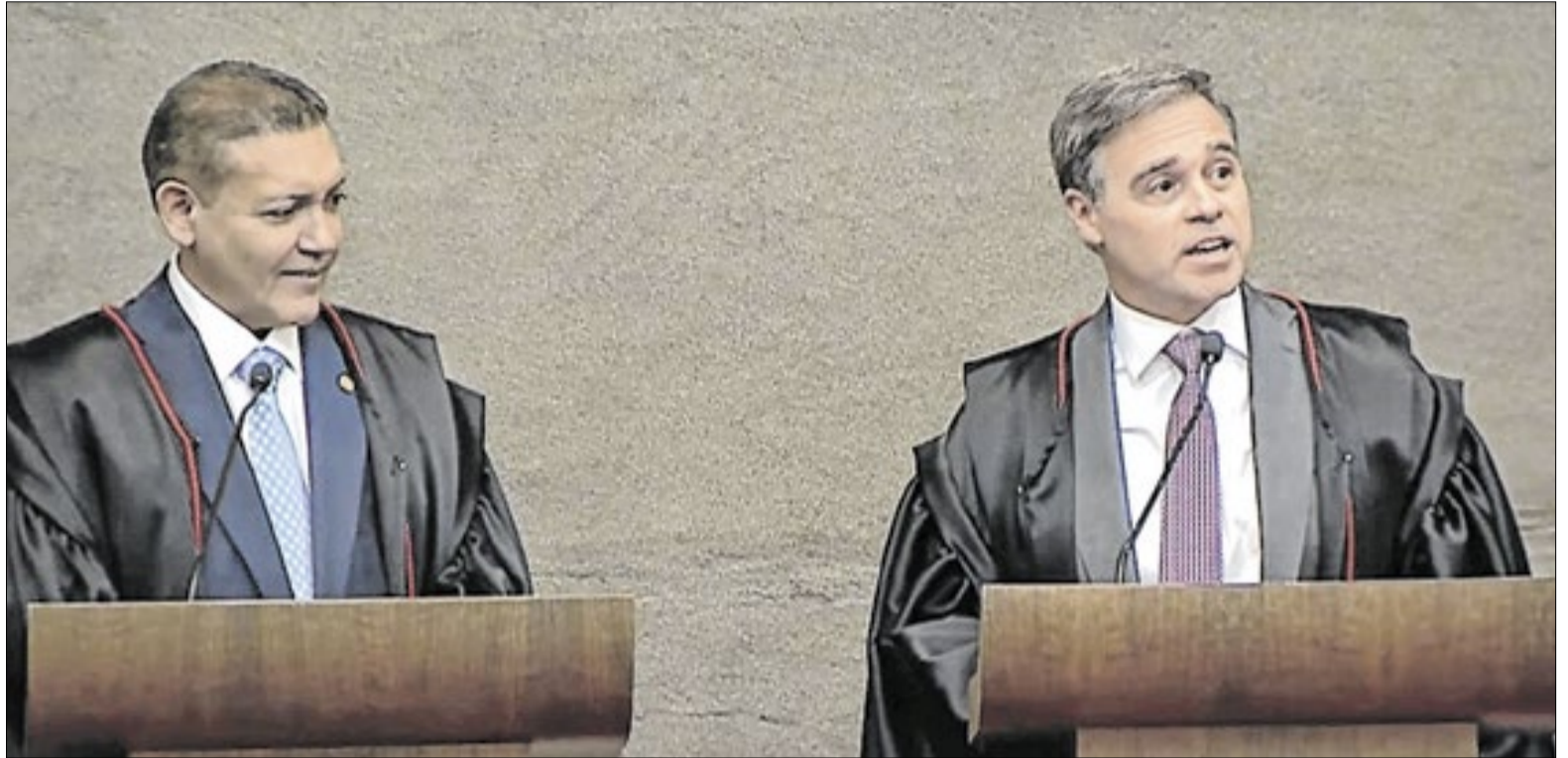
Nunes Marques e André Mendonça conduzirão eleições deste ano

“Esse será o ponto mais sensível nesse pleito. Principalmente direcionar as decisões, quais serão os mecanismos a serem enfrenta-