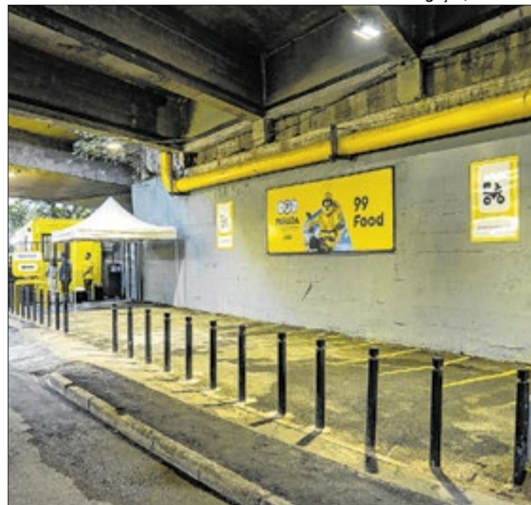
Parceria entre prefeitura e 99 inaugura ponto de apoio

Os ônibus do Rio deixarão de aceitar pagamento em dinheiro a partir do dia 30 de maio, conforme anunciado pela prefeitura nesta terça (12). No comunicado, a Secretaria Municipal de Transportes diz que a medida faz parte da modernização do transporte público municipal. O acesso será feito exclusivamente pelo Jaé ou pelo Riocard.