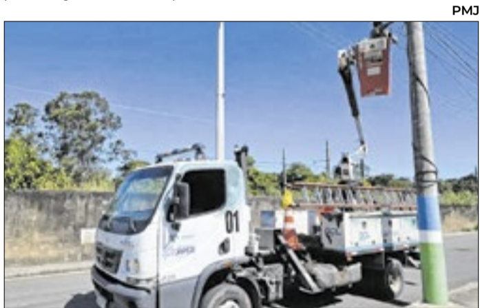
Equipes de instalação vêm atuando em dois turnos diários

A iniciativa faz parte de um trabalho contínuo, com equipes atuando diariamente em dois turnos. Em média, são atendidos de 25 a 35 pontos de iluminação por turno. Atualmente, o município registra uma demanda de 500 pontos já atendidos por toda a cidade.