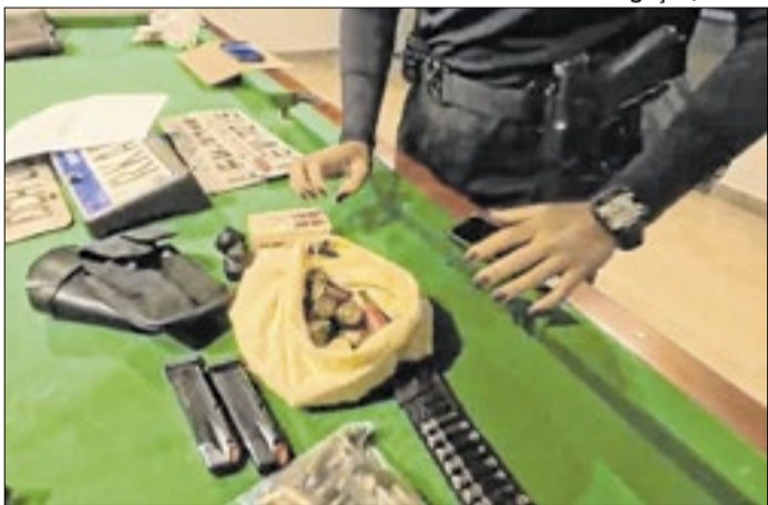
Polícia Civil realiza operação contra arsenal de CACs