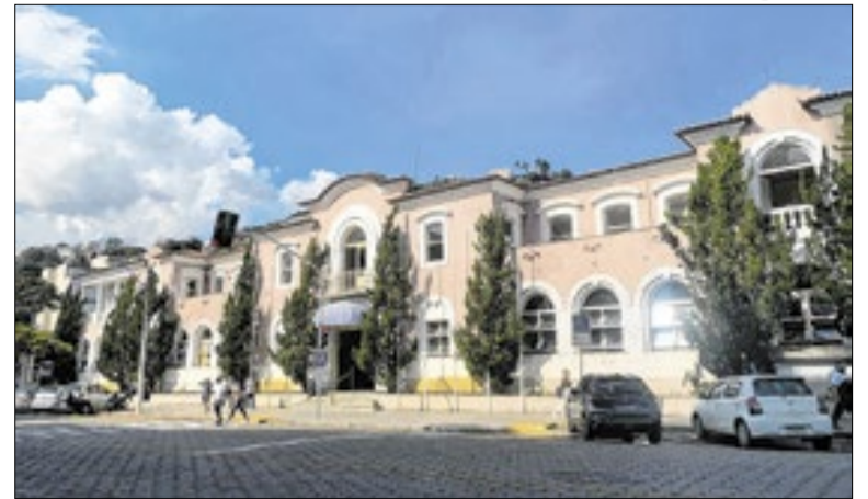
Município informou que já atua para melhorias na unidade

Durante o trajeto, os participantes contarão com distribuição de kits de frutas, entrega de panfletos informativos, orientações sobre saúde mental, aula funcional com profissional de educação física, aferição de pressão arterial e glicemia, além de orientações nutricionais sobre alimentação saudável.