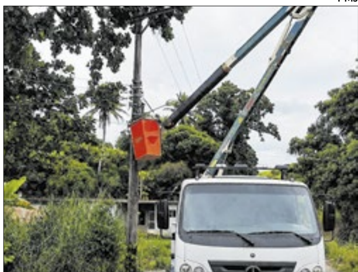
Prefeitura já realizou manutenção em diferentes bairros