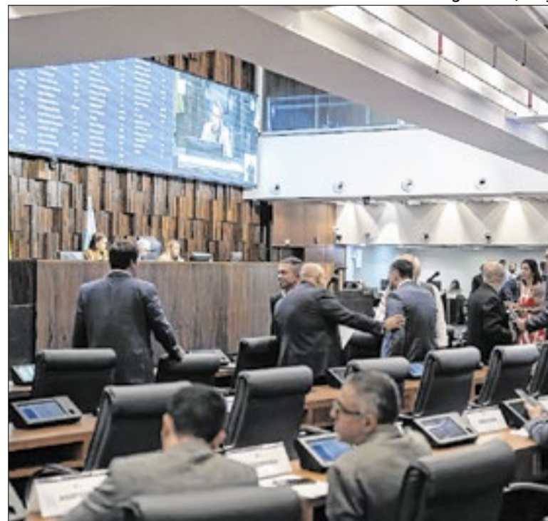
Alerj aprova projeto que seguiu para o Governo do Estado

Os valores arrecadados com as multas, que poderão começar no valor de 1.100 UFIR-RJ, o equivalente a R$ 5.456, e ser dobrado, serão destinados ao Fundo de Defesa Social e Defesa da Cidadania (FDSPC), em aplicação em programas de conscientização sobre os direitos das pessoas trans.