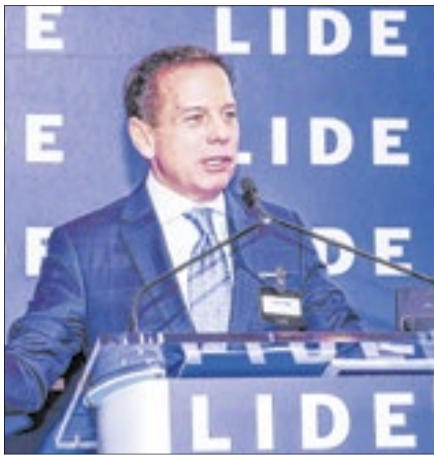
'O ódio destrói, o diálogo constrói', diz João Doria ao defender pacificação política no Brasil