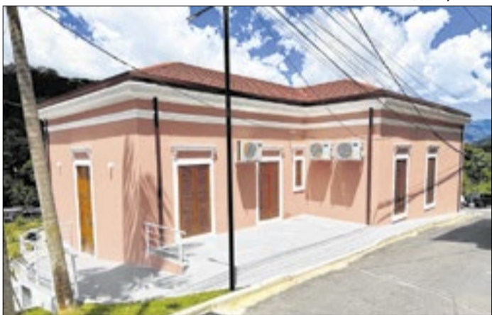
Casa de Cultura e Cidadania em Nova Friburgo (RJ)