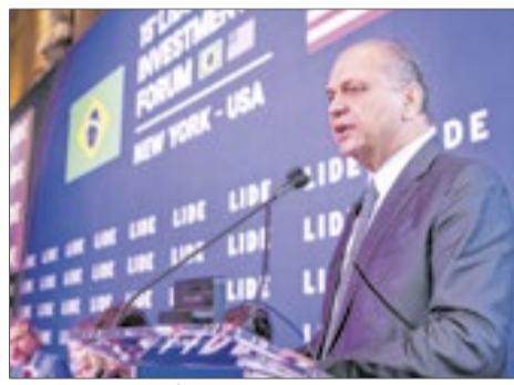
Deputado Ricardo Barros defende protagonismo do Brasil em crédito de carbono, IA e energia limpa