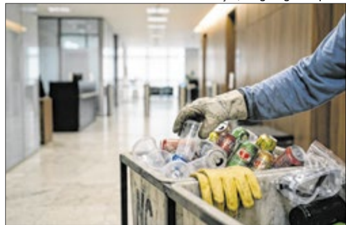
Diretrizes do CNJ reforçam a sustentabilidade no Judiciário.