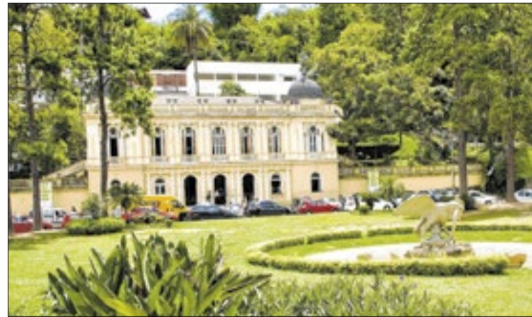
O processo segue em fase de instrução

Por conta da Festa de Nossa Senhora de Fátima, nesta terça-feira (13), haverá interdições no trânsito de veículos no entorno do Trono de Fátima. O acesso à Rua Padre Moreira será em mão única na subida pelo Valparaíso, na altura do Canto do Cemitério. Já a saída dos veículos acontecerá pelas ruas do Encanto ou Frei Ciríaco.