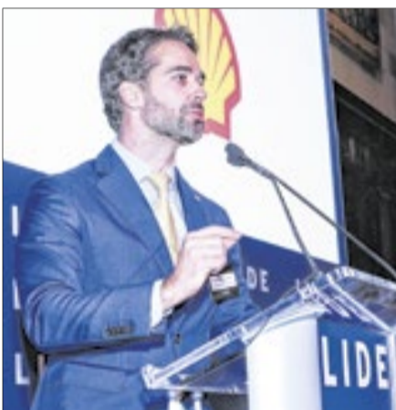
'Não existe lugar no mundo em que a sociedade tenha prosperado com um governo desajustado', disse o governador do RS, Eduardo Leite