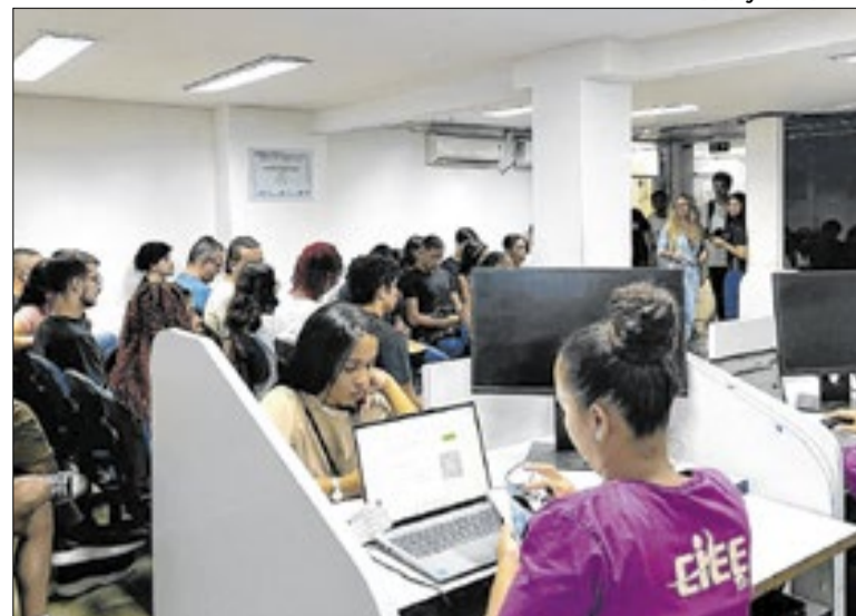
Jovens conheceram as vagas disponíveis e realizaram cadastro