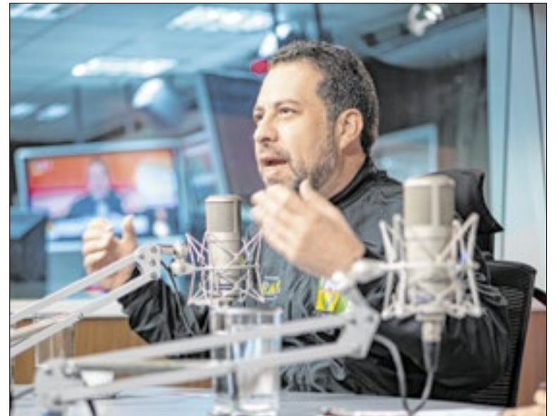
Correio da Manhã participou do programa ‘Bom dia, Ministro’

Pelo regimento, a instalação deveria ter ocorrido na sessão seguinte do Congresso. O tema, porém, foi ignorado pelo presidente do Senado, Davi Alcolumbre (União-AP). Segundo Jordy, Mendonça, relator da ação, mostrou-se “solícito e sensibilizado”, e falou que iria avaliar: “Estamos aguardando”, diz o deputado.