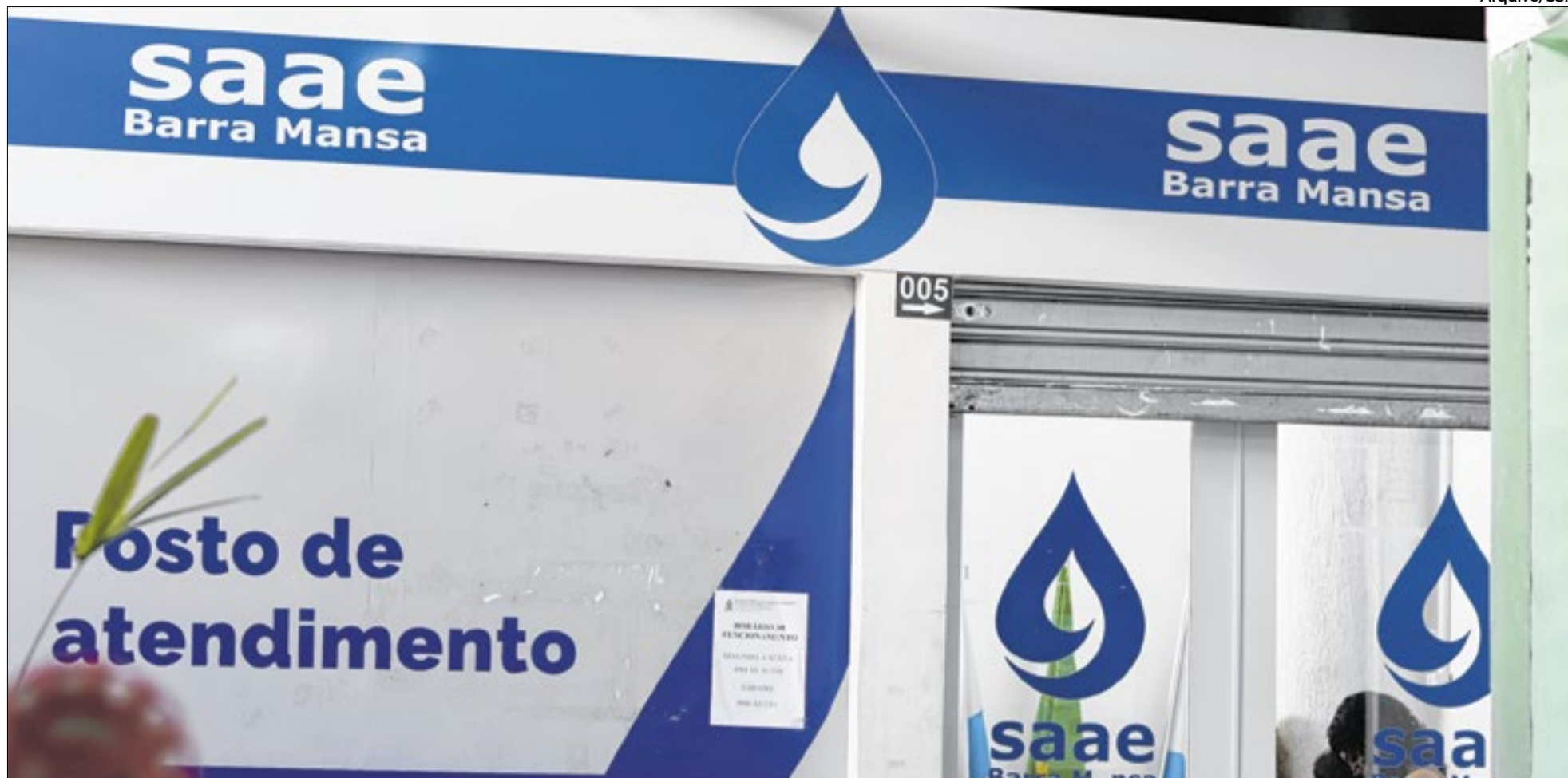
Além do aumento na tarifa, moradores da cidade também reclamam sobre qualidade da água e falta de abastecimento adequado