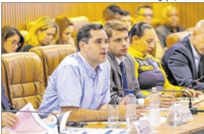
Anúncio da expansão da guarda armada para Bangu