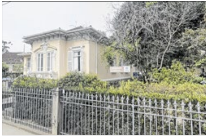
Ação pede despejo onde funciona a secretaria de Turismo