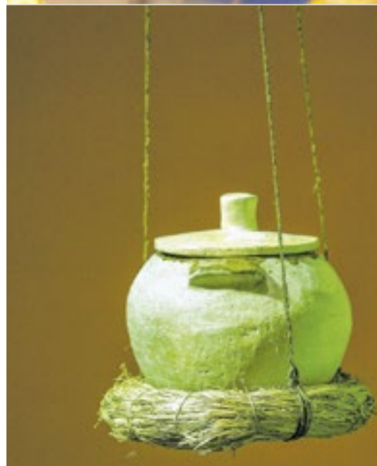
Cerâmicas coloridas estão entre as peças expostas