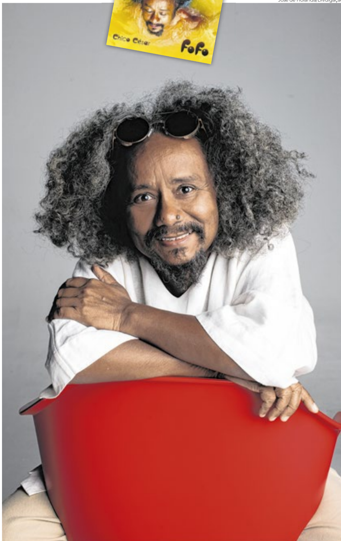
Em ‘Fofo’, Chico César preenche uma lacuna de sua trajetória como compositor ao resgatar as canções escritas em sua fase paraibana, antes do sucesso conquistado em São Paulo e no Brasil

estrada apresentando seu primeiro álbum quando percebeu que aquele repertório deixava de fora as canções da fase paraibana. O novo disco funciona, portanto, retoma uma história interrompida, aproximando o ouvinte do jovem e inquieto artista que começava a se desenvolver como compositor.