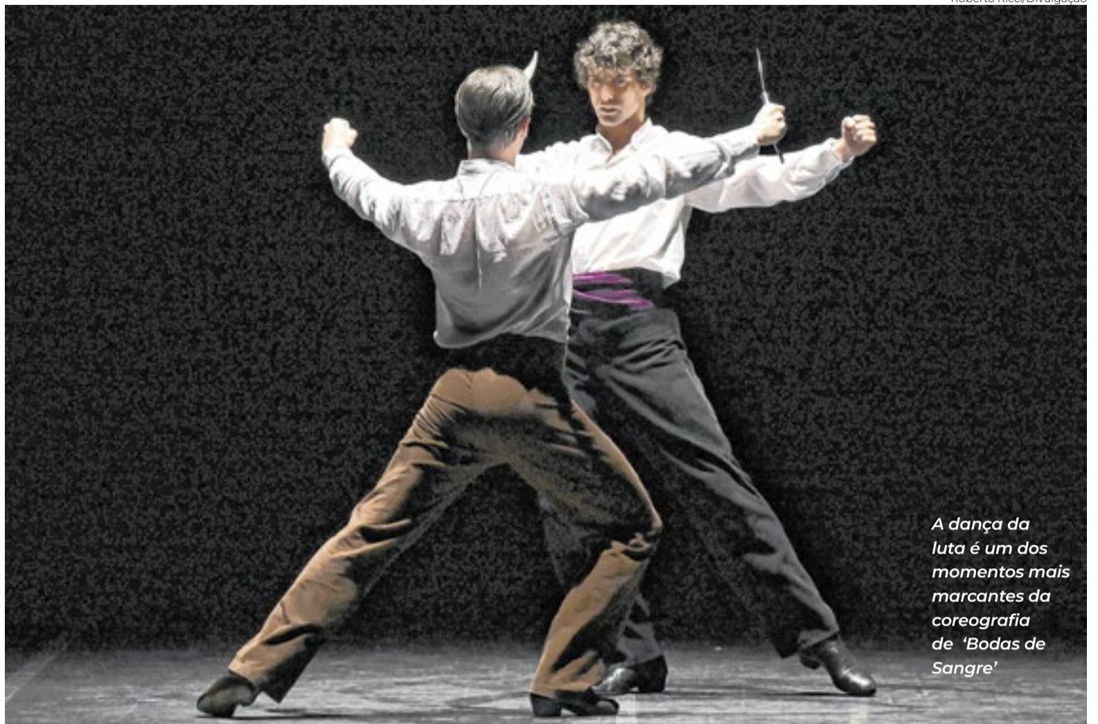
A dança da luta é um dos momentos mais marcantes da coreografia de ‘Bodas de Sangre’

“Suite Flamenca” é uma colagem de sete peças do cancionero tradicional — “Soleá”, “Farruca”, “Alegrías”, “Seguiriyá”, “Bulerías”, “Tanguillo” e “Rumba” — que Gades começou a construir a partir de 1963, quando iniciou sua carreira solo, e que cinco anos depois ganharam forma definitiva. A montagem revela um Gades inquieto e renovador, nas palavras do El País, e oferece ao público a chance de ver as raízes do que hoje se entende como flamenco narrativo e coreográfico. O El Mercurio recomenda: “Que as novas gerações assistam e possam compreender que não se trata apenas de sapatear incansavelmente ou fazer