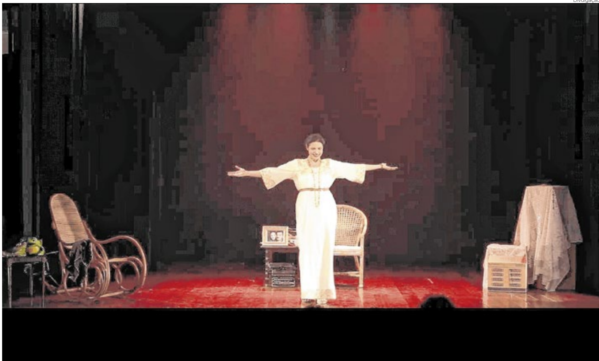
A cenografia recorre a caixas de papelão que guardam as memórias de Zélia Gattai, que começou a escrever aos 63 anos