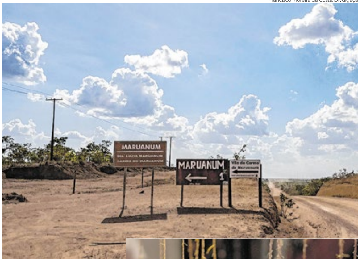
Placas no caminho para o distrito de Maruanum, na área rural do Amapá

O processo criativo desses artistas envolve um sistema complexo: barro do solo amazônico, cinzas da queima da casca da árvore caripé e resina de jatobá. Cada etapa segue regras precisas, especialmente na retirada do barro e na queima. O momento ritual mais importante acontece após extrair o barro: as mulheres modelam pequenas peças e as depositam no buraco de origem,