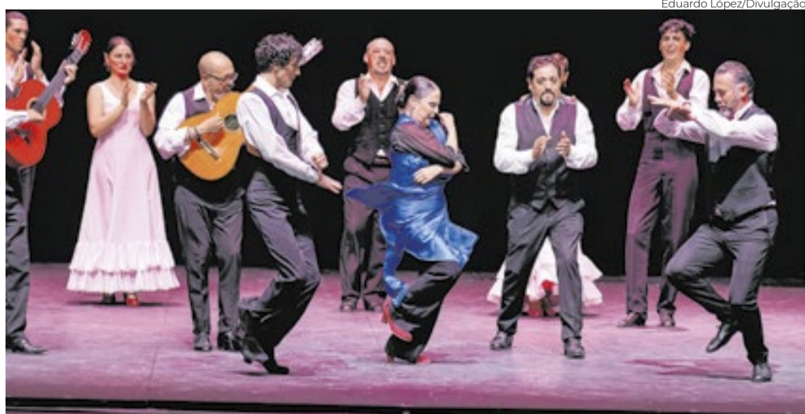
‘Suite Flamenca’ é composta por coreografias criadas para sete clássicos do repertório flamenco

acrobacias.” Com 55 minutos sem intervalo, a coreografia e iluminação são de Antonio Gades, com coreografias adicionais (“Soleá”, “Bulerías” e “Tanguillo”) de Cristina Hoyos e