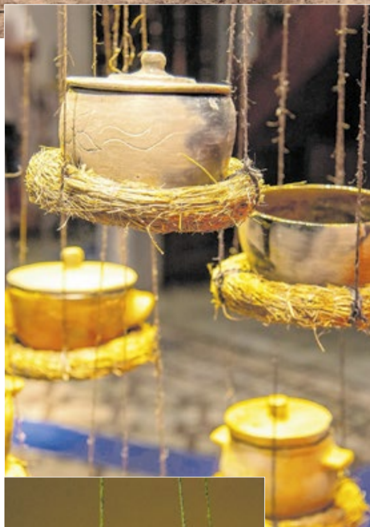
Panelas de barro de diversas formas se destacam na exposição

Museu de Folclore Edison Carneiro (Rua do Catete, 179) Até 1/7, de terça a sexta (10h às 18h), Sábados, domingos e feriados (11h às 17h) Entrada franca