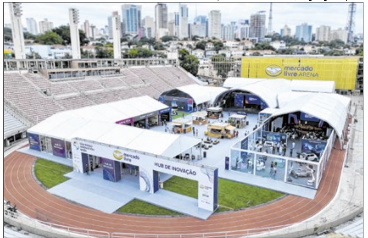
Evento será realizado entre os dias 13 e 15 de maio na Mercado Livre Arena Pacaembu

Durante o São Paulo Innovation Week, o grupo Correio da Manhã fará o lançamento de seu novo portal de notícias, com leiaute moderno e responsivo. A iniciativa integra a estratégia de expansão digital da empresa.