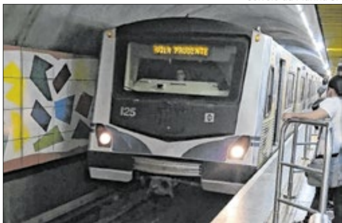
Metroviários soltam nota pedindo Catracas Livres