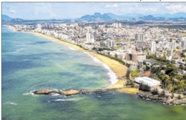
Vagas são destinadas a candidatos com diversas escolaridade

A Secretaria Municipal de Trabalho e Renda de Macaé anuncia, nesta semana, 781 vagas de emprego para diferentes níveis de escolaridade e áreas de atuação. As oportunidades contemplam setores como offshore, construção civil, hotelaria, comércio, alimentação, logística, transporte e serviços gerais, além de vagas destinadas a pessoas com deficiência (PCD). Entre os destaques estão vagas para camareira, com 70 oportunidades ofertadas; auxiliar de serviços gerais, com 50 vagas; auxiliar de cozinha e chefe de cozinha, com 30 vagas cada; auxiliar de operações logísticas, com 20 oportunidades; governança hoteleira, também com 20 vagas; além de taifeiro e motorista em diferentes categorias.