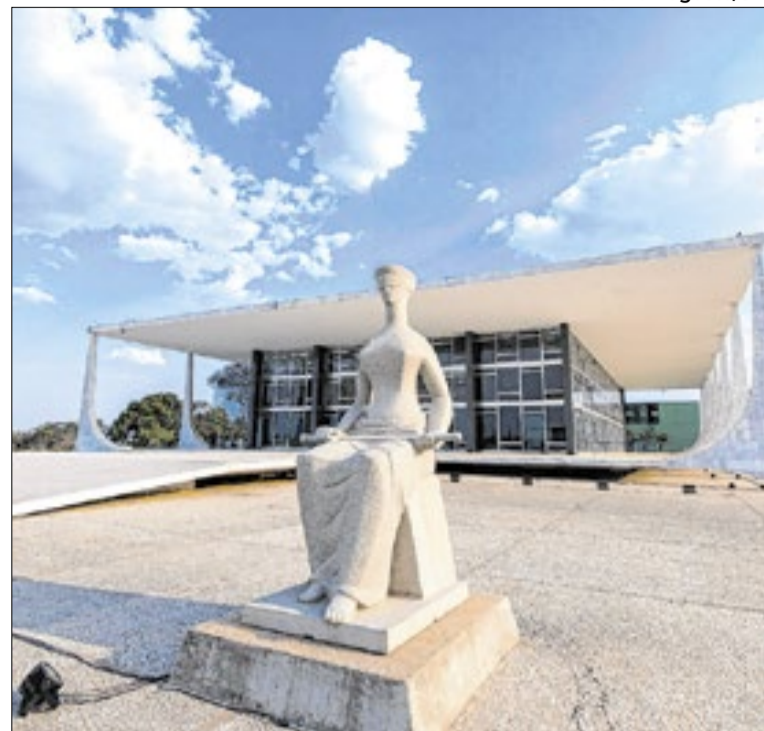
Ministros assinaram Resolução e despachos contra adicionais

O Ministério da Justiça e Segurança Pública abriu uma pesquisa nacional para mapear desigualdades de gênero nas instituições de segurança pública. Servidores da área foram convidados a participar do levantamento, que busca subsidiar políticas de equidade, valorização profissional e combate à discriminação.