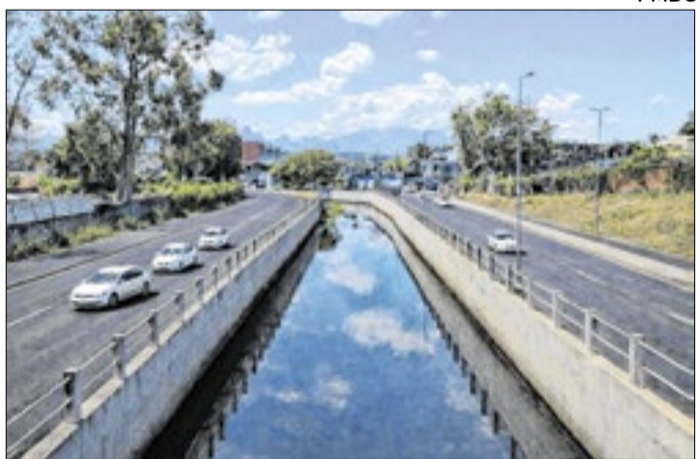
Obras de macrodrenagem ganharam destaque no painel