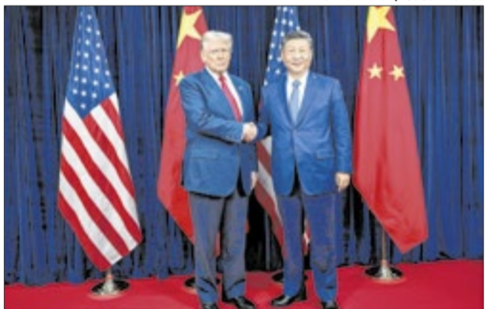
Xi Jinping vai receber Donald Trump ainda nesta semana