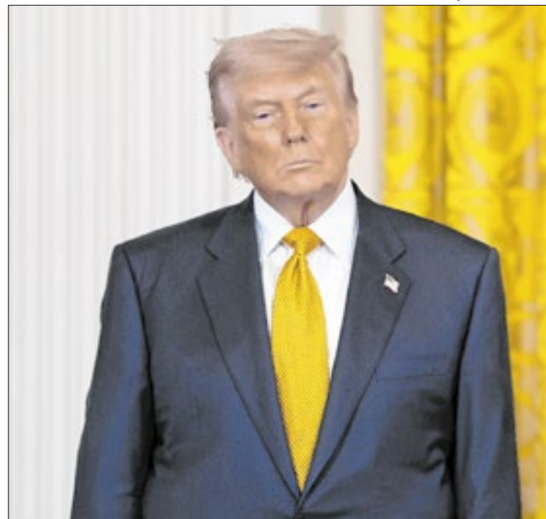
Resposta iraniana priorizava o fim do conflito no Golfo