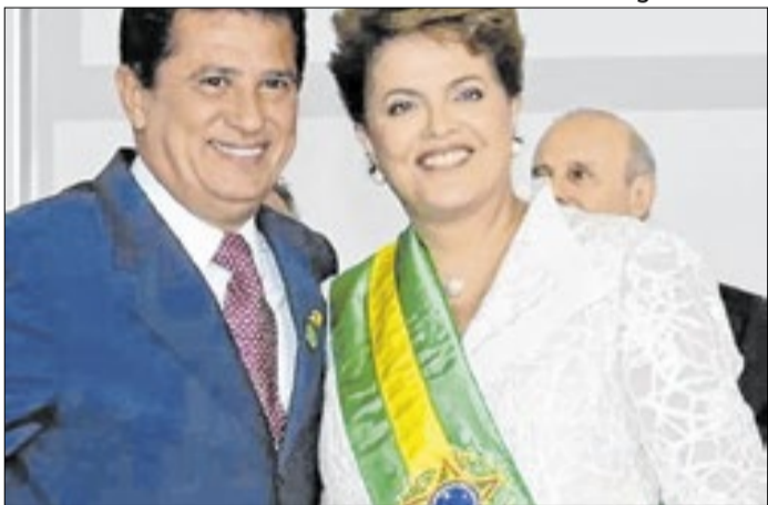
Alfredo Nascimento acabou demitido por Dilma Rousseff