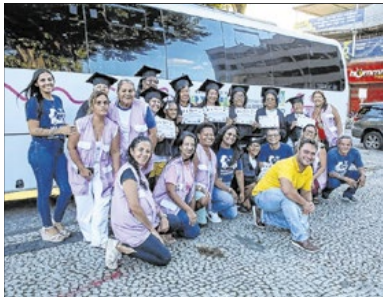
Aulas foram realizadas em uma unidade móvel adaptada