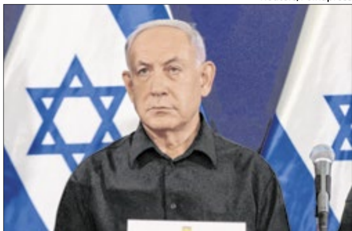
Binyamin Netanyahu não vê o fim da guerra próximo