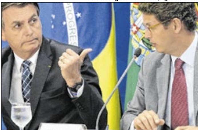
Salles e Bolsonaro: outros tempos e outros humores