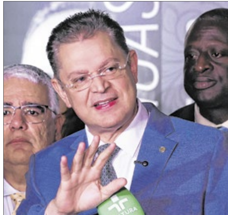
Sóstenes: retorno da "anistia ampla, geral e irrestrita"

O comandante pediu comida caseira, e Marisa fez um bife rolê. Mas alguém na cozinha resolveu cortar as pontas dos palitos que seguravam a carne. Fidel meteu tudo na boca e se engasgou com o palito, ficou roxo, sem respirar. Um segurança saltou sobre a mesa e arrancou o pedaço de carne da garganta do chefe.