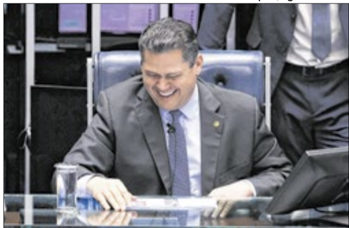
Presidente do Senado: na Copa, bola pro lado