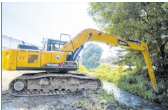
Painel explicou possíveis impactos de eventos climáticos