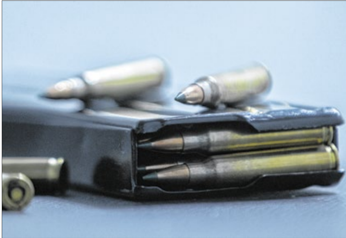
Mais de 40% dos brasileiros sentem o crime muito próximo de suas vidas

serão investidos na medida, R$ 1 bilhão será oriundo do Orçamento deste ano e os outros R$ 10 bilhões via empréstimo do Banco Nacional de Desenvolvimento Econômico e Social (BNDES) para os estados.