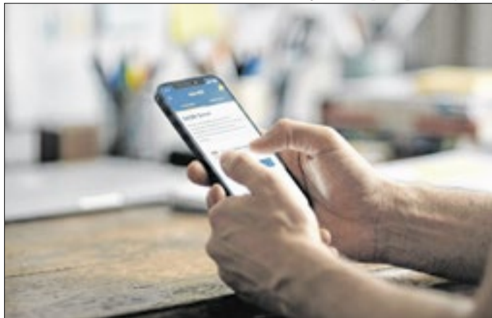
Ilustração / Imagem gerada por IA

Receita Federal espera 16,7 milhões de declarações