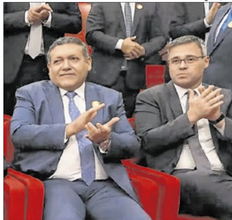
Nunes Marques e Mendonça assumem o comando do TSE

Essas brigas estreitam a formação dos palanques regionais. A sorte de Flávio Bolsonaro é que isso também vem acontecendo com o presidente Luiz Inácio Lula da Silva, com brigas como a do Maranhão, que já contamos. Há um estranho clima de UFC na disputa eleitoral. E só cabem dois no octógono.