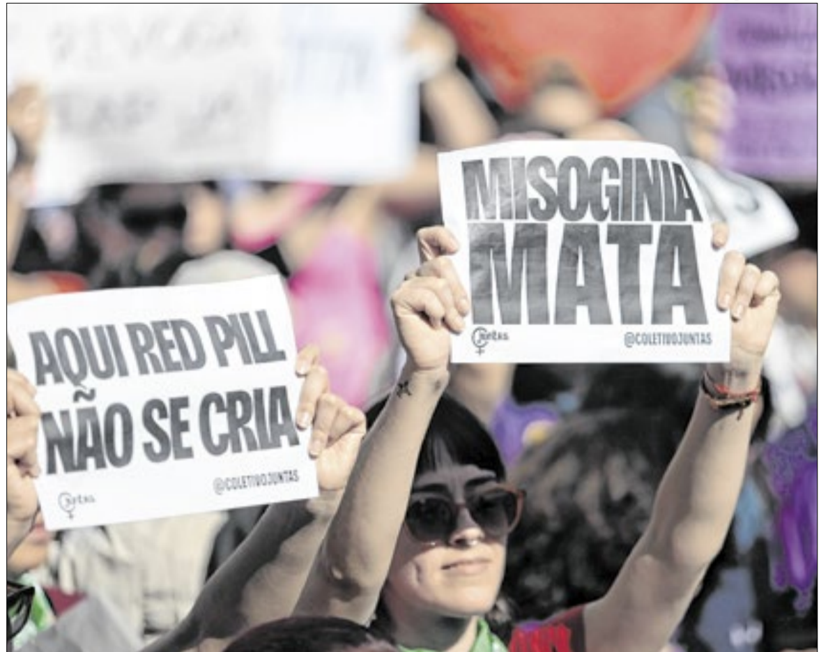
Projeto define misoginia como "a conduta que exterioriza ódio ou aversão às mulheres"

O parlamentar associou ao PL da Misoginia trechos de outro projeto de lei, o PL 4224/2024, da senadora Ana Paula Lobato, que tratava da Política Nacional de Combate à Misoginia, mas que não fazia parte do texto aprovado no Senado.