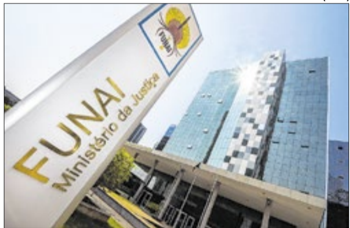
Seleção para a FUNAI terá análise curricular e entrevista.