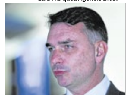
Flávio Bolsonaro faz nova ofensiva

Com esse requerimento, a proposta pode ser levada diretamente ao plenário, sem passar por todas as etapas regimentais. Para isso, é necessário o apoio de senadores ou líderes que representem a maioria da Casa, o que equivale a 41 assinaturas. Mesmo assim, a PEC ainda precisará de 49 votos favoráveis. A proposta foi apresentada por Flávio em 2019 e voltou ao debate após a repercussão de um caso recente de estupro envolvendo menores de idade.