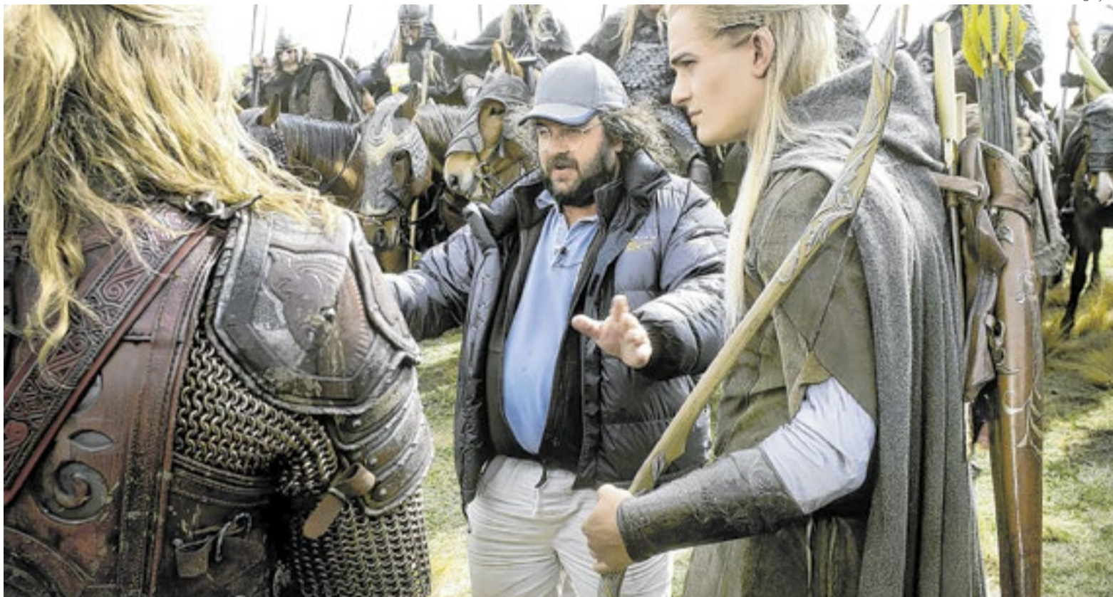
Peter Jackson nos sets de ‘O Senhor dos Anéis’. Cineasta pode renovar sua investida no universo Tolkien

Estima-se que o tempo do realizador anda dedicado, parcialmente, a uma investigação documental sobre o quadrinista belga Hergé (1907-1983), de quem está adaptando uma aventura do jornalista Tintin. O novo longa ficcional de Jackson deve ser uma animação baseada no gibi “Os Prisioneiros do Sol”. Mas há quem diga que algo