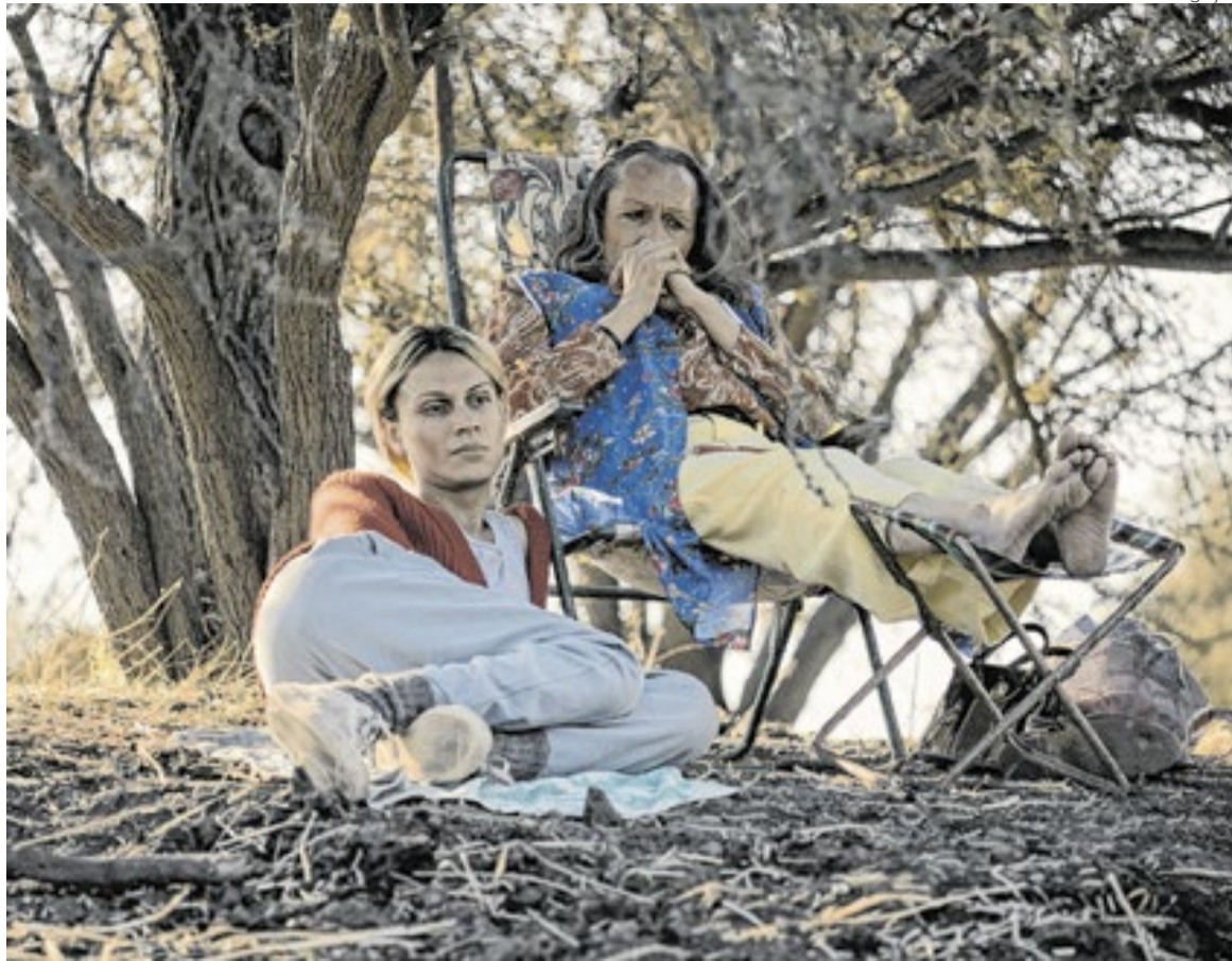
“O Olhar Misterioso do Flamingo” saiu de Cannes, em 2025, com o Prix Un Certain Regard