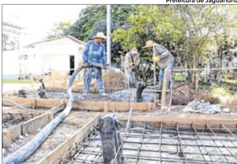
Prefeitura de Jaguariúna

O SAAEJA afirma que a reforma é essencial para ajustar o sistema ao crescimento