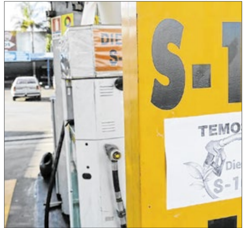
Guerra no Oriente Médio vem se mostrando lucrativa

A capacidade do Reino Unido de integrar uma eventual missão será limitada pelas restrições enfrentadas pela Marinha Real, atualmente sobrecarregada e muito menor do que em décadas anteriores. Atualmente, a Marinha britânica conta com 38 mil militares e opera dois porta-aviões e uma frota de 13 destróieres e fragatas.