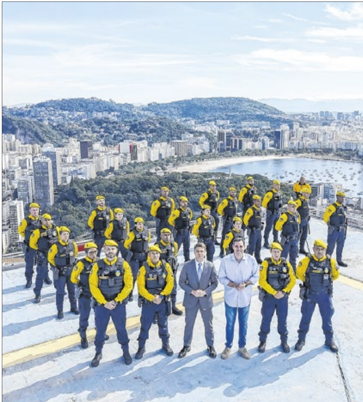
Apresentação dos agentes foi no heliponto do Shopping Rio Sul

E em Botafogo, o policiamento será realizado em três perímetros: Rua Lauro Müller x Rua General Severiano x Av. Vences-