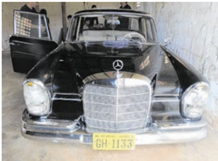
A reluzente Mercedes-Benz 1963 de JK faz parte do acervo