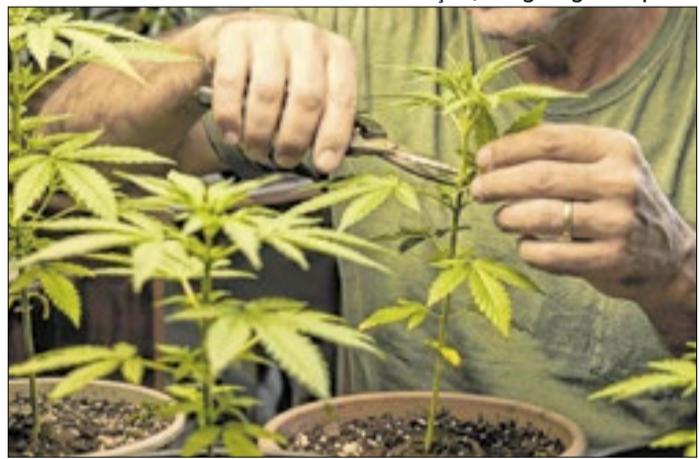
Judiciário não pode autorizar o cultivo