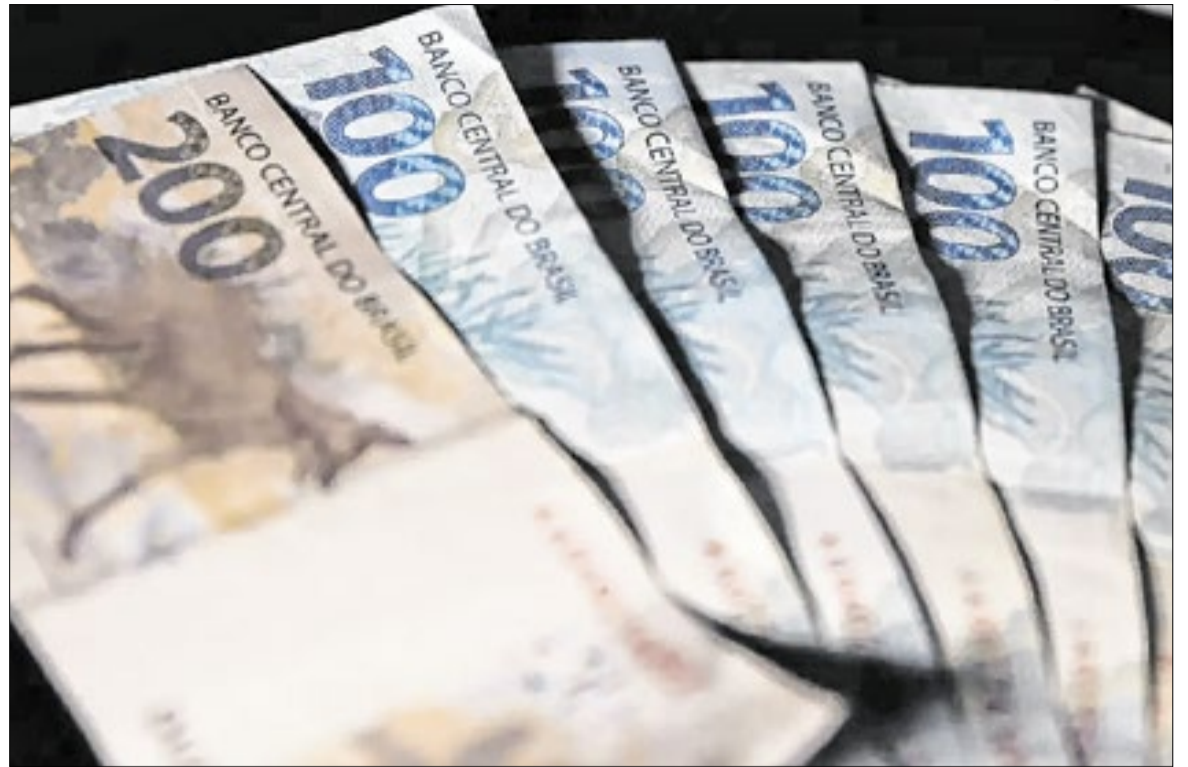
Resultado mostra crescimento de 5,4% em relação a 2024 - expansão pelo quarto ano seguido

Segundo o IBGE, os 10% da população brasileira com maior rendimento domiciliar per capita detinha, em 2025, 40,3% do total da massa de rendimentos domici-