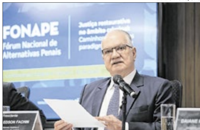
Presidente do STF, ministro Edson Fachin, no Fonape