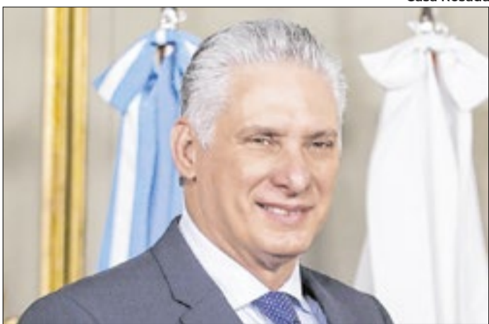
Miguel Díaz-Canel teve de lidar com ameaças de Trump