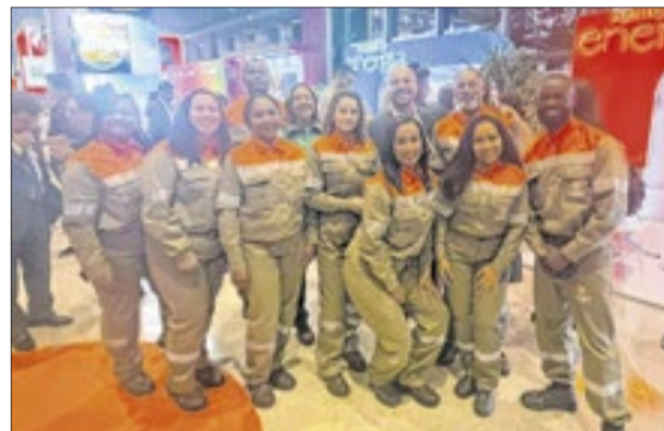
Funcionários da Light, no Centro Internacional de Convenções do Brasil (CICB), comemoraram garantia do emprego