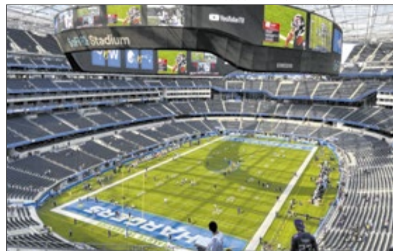
Irã jogará duas partidas no moderno So-Fi Stadium