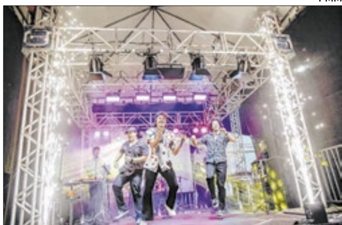
Festival será realizado neste final de semana, em Magé