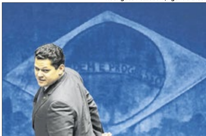
Presidente do Senado entrou em campo