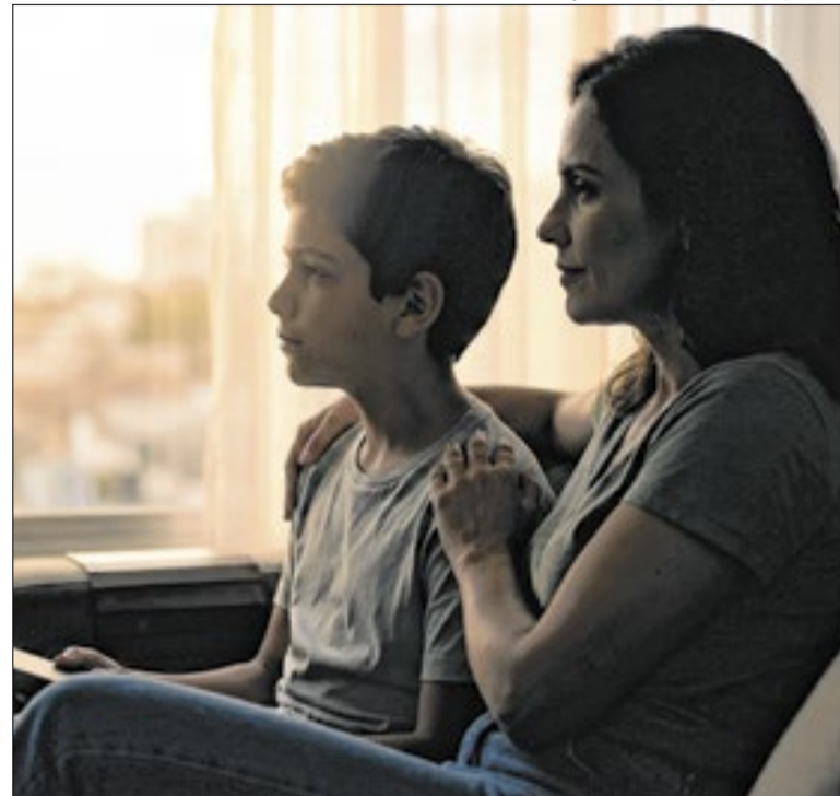
Termo é usado para crianças acima de 2 anos e adolescentes

A Procuradoria Federal dos Direitos do Cidadão (PFDC), do MPF, defendeu ampliar o conceito de assédio judicial contra jornalistas e comunicadores. Em nota técnica, o órgão afirma que ações abusivas, pedidos de indenização excessivos e tentativas de censura podem ser usados para intimidar e silenciar a imprensa.