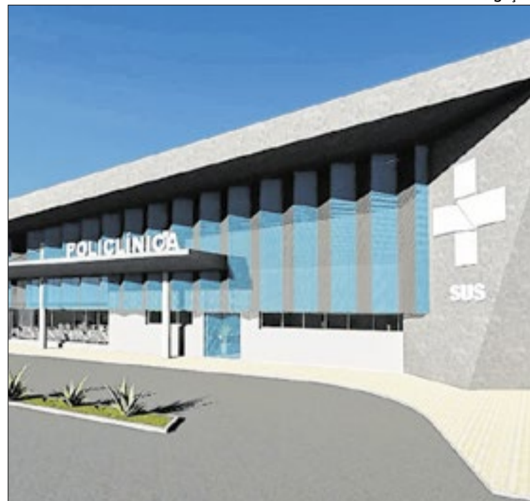
Investimento traz policlínica e Unidades Básicas de Saúde

Macaé reforça em maio as ações de combate ao abuso e exploração sexual de crianças e adolescentes. A campanha Maio Laranja orienta sobre sinais de alerta e canais de denúncia, como o Disque 100. Unidades de saúde distribuem materiais educativos para fortalecer a rede de proteção e conscientizar sobre o tema.