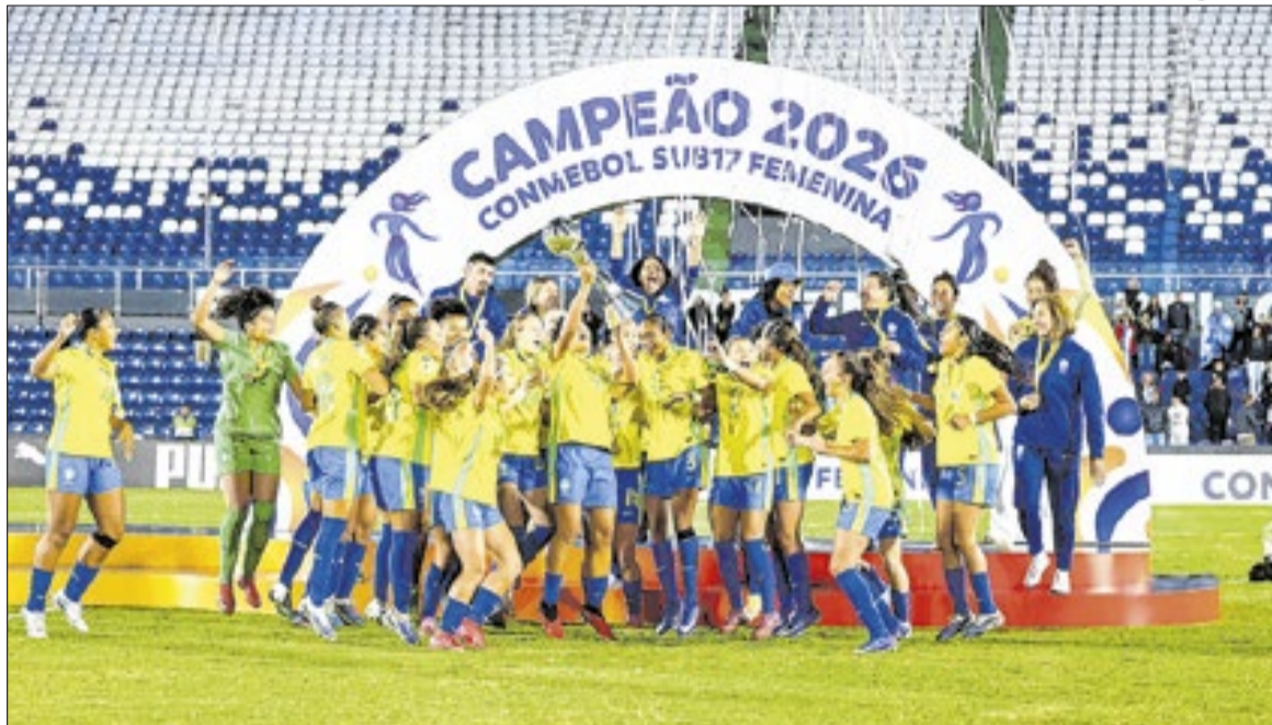
Seleção Brasileira Feminina Sub-17 venceu a Argentina em final com virada emocionante

do a conquista de seu primeiro título como técnica da Seleção Feminina Sub-17, o hexacampeonato continental, analisou o confronto decisivo e elogiou o trabalho de todo o grupo.