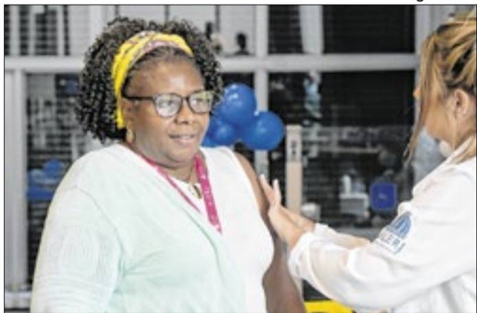
Parlamento deve ser exemplo de conscientização