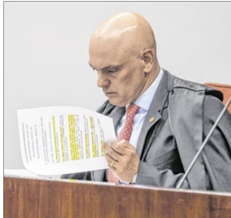
Moraes suspendeu dosimetria até julgamento final do STF

Há a alegação de que a definição de AH/SD como “condição do neurodesenvolvimento” não é consensual. Isso geraria problemas conceituais, patologização, exigência de laudos e criação de barreiras. Há também críticas à não obrigatoriedade de adoção de políticas por estados e municípios.