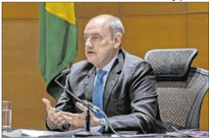
Presidente do TJ-RJ, Couto segue no governo do estado