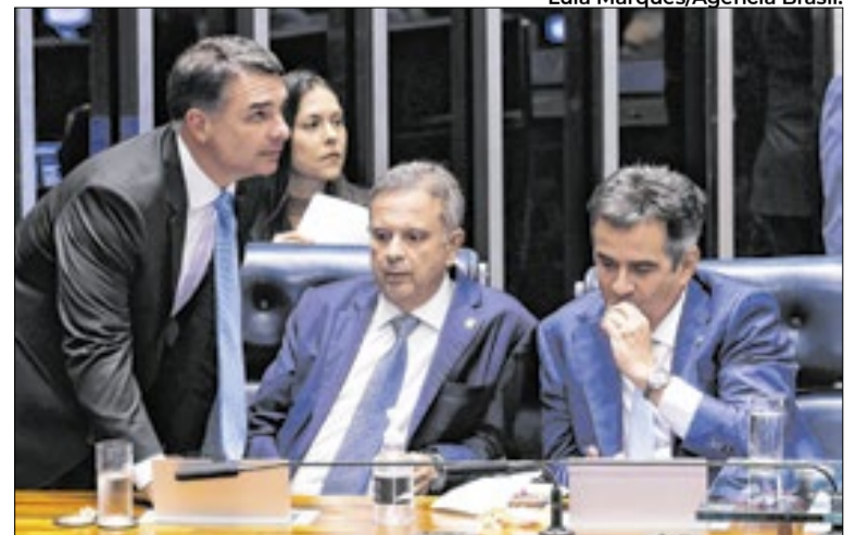
Ciro Nogueira é um dos principais nomes da oposição ao governo