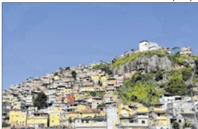
Morro da Providência, Zona Portuária do Rio