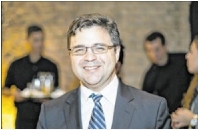
Zúñiga integrou Conselho de Segurança da gestão Obama