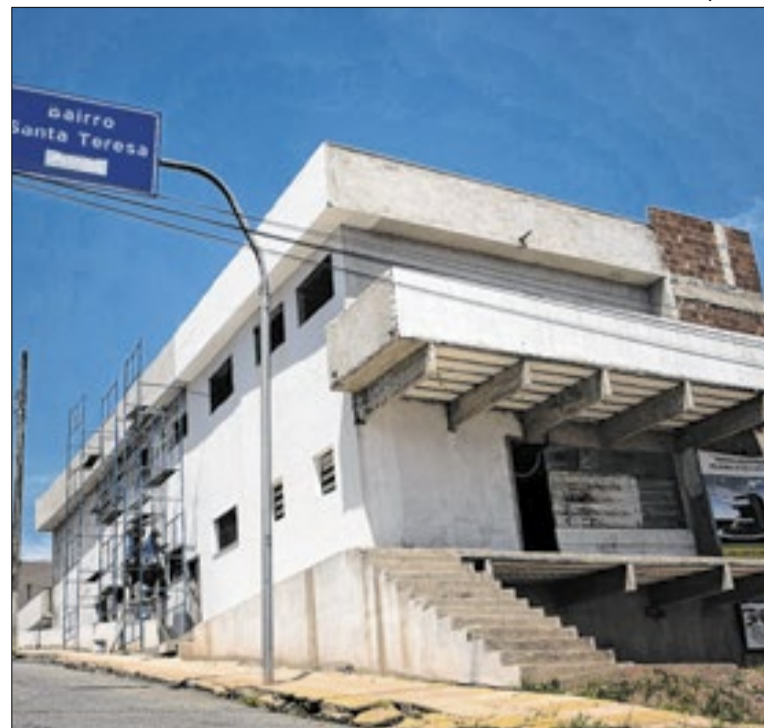
Empresa responsável abandonou obra da unidade no Rústico