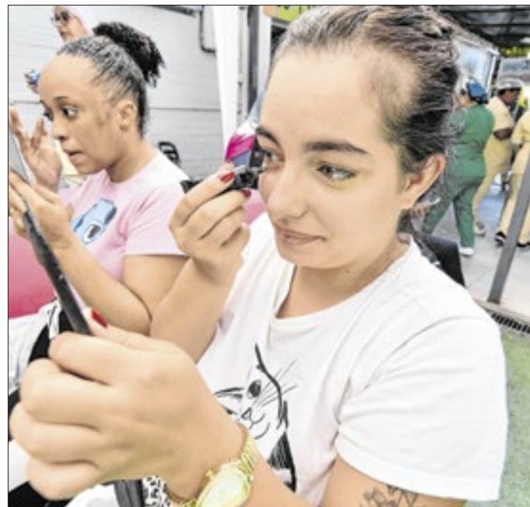
Mães e acompanhantes tiveram dia especial em Nova Iguaçu

Todos os alunos receberam o mesmo Kit escolar distribuído aos alunos da Rede Municipal de ensino, contendo cadernos de capa dura, estojos de lápis, lápis de cor, apontador, borracha, entre outros itens. As aulas terão metodologia diferenciada, com linguagem popular, aproveitando a experiência de vida do grupo.