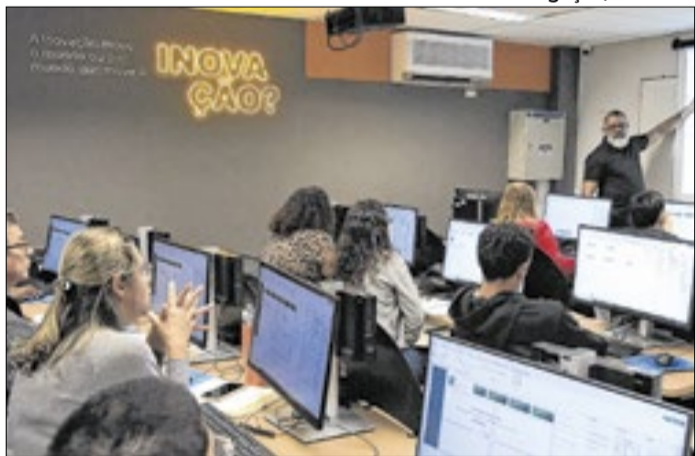
Senac oferece 5 mil vagas em cursos gratuitos