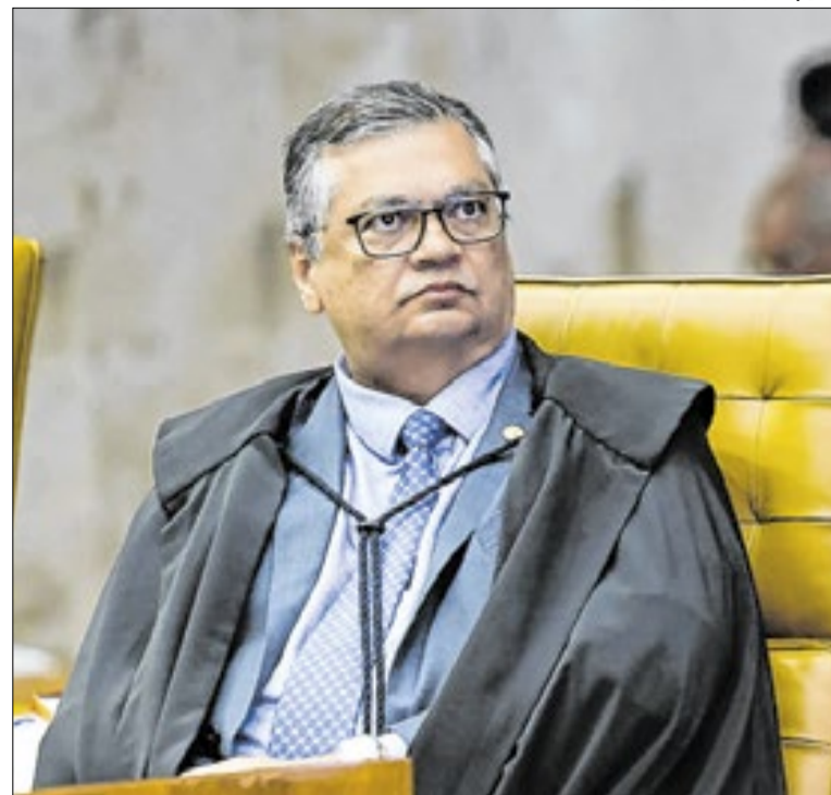
Ministro Flávio Dino pediu destaque na sexta-feira (8)

Programas sociais tiveram participação de 1,2%, abaixo do registrado em 2024.