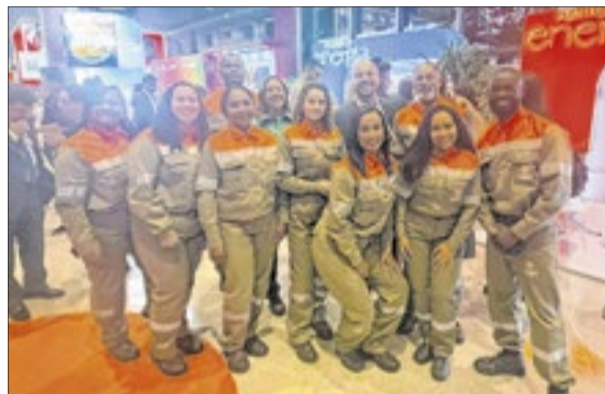
Funcionários da Light, no Centro Internacional de Convenções do Brasil (CICB), comemoraram garantia do emprego