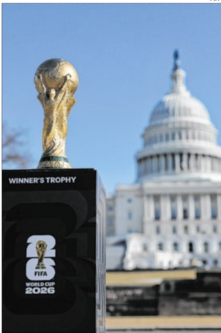
Viajar para a Copa do Mundo vai custar uma pequena fortuna

A reportagem fez um orçamento de quanto custaria passar