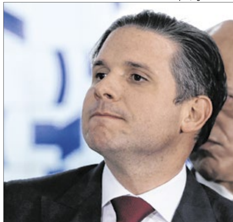
Segundo Motta, fim da 6x1 é "prioridade" na Câmara

Outra má notícia para bolsonaristas: a Anvisa determinou o recolhimento de lotes de detergente, sabão líquido e desinfetante da marca Ypê : todos oferecem risco de contaminação. Quatro integrantes da família Beira , dona da Ypê, doaram um total de R$ 1,5 milhão para a campanha de Bolsonaro em 2022.