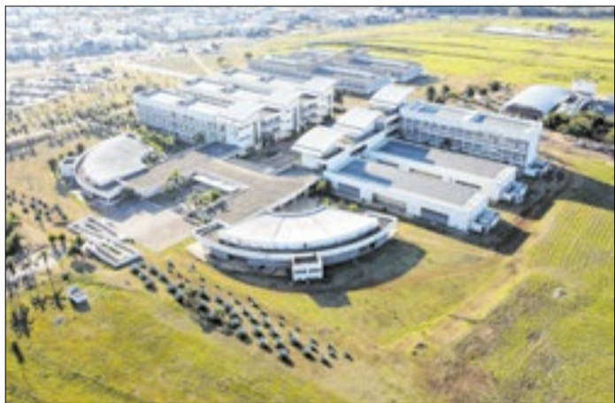
Paralisação reúne cerca de 3 mil estudantes