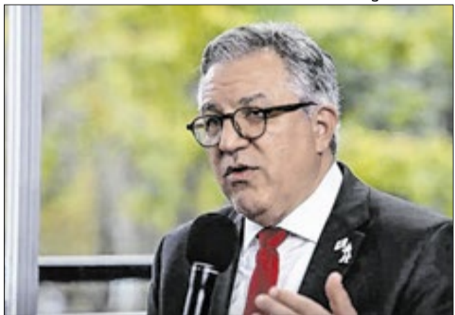
Assim como Tourinho, Padilha também é médico