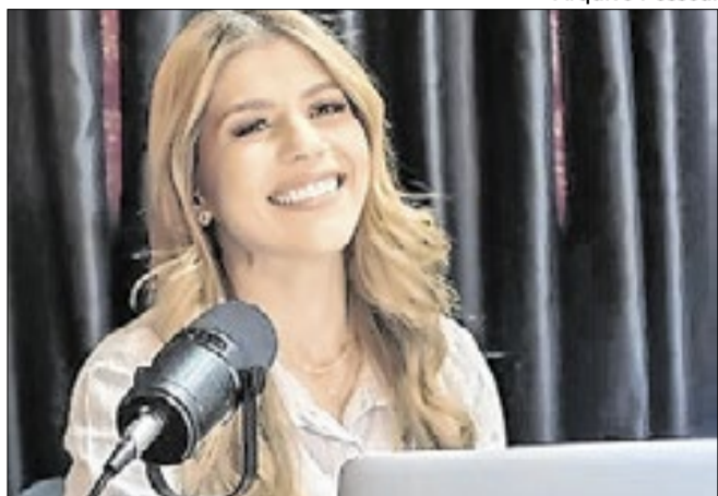
Pastora tem quase 30 mil seguidores no Instagram