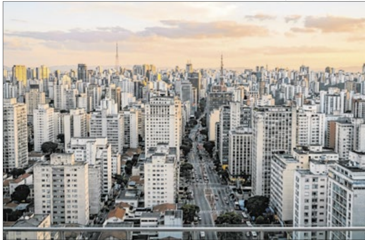
São Paulo registrou desaceleração em 12 meses (de 4,16% em março para 0,86% em abril)

São Paulo registrou a menor variação mensal entre as capitais pesquisadas, com alta de 0,32% em abril. Em março, a capital paulista havia registrado avanço de 1,06%. Segundo a FGV, a cidade apresentou a desaceleração mais intensa no ritmo de aumento dos aluguéis no período analisado. No acumulado de 12 meses, São Paulo foi a única