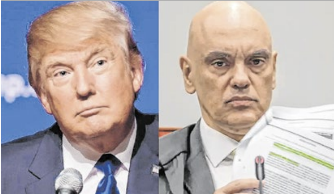
Governo de Donald Trump monitora inquérito aberto pelo ministro Alexandre de Moraes

@realdonaldtrump e Valter Campanato/Ag. Brasil