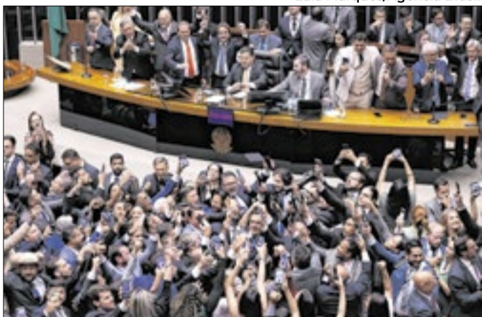
Comemoração após a derrubada do veto