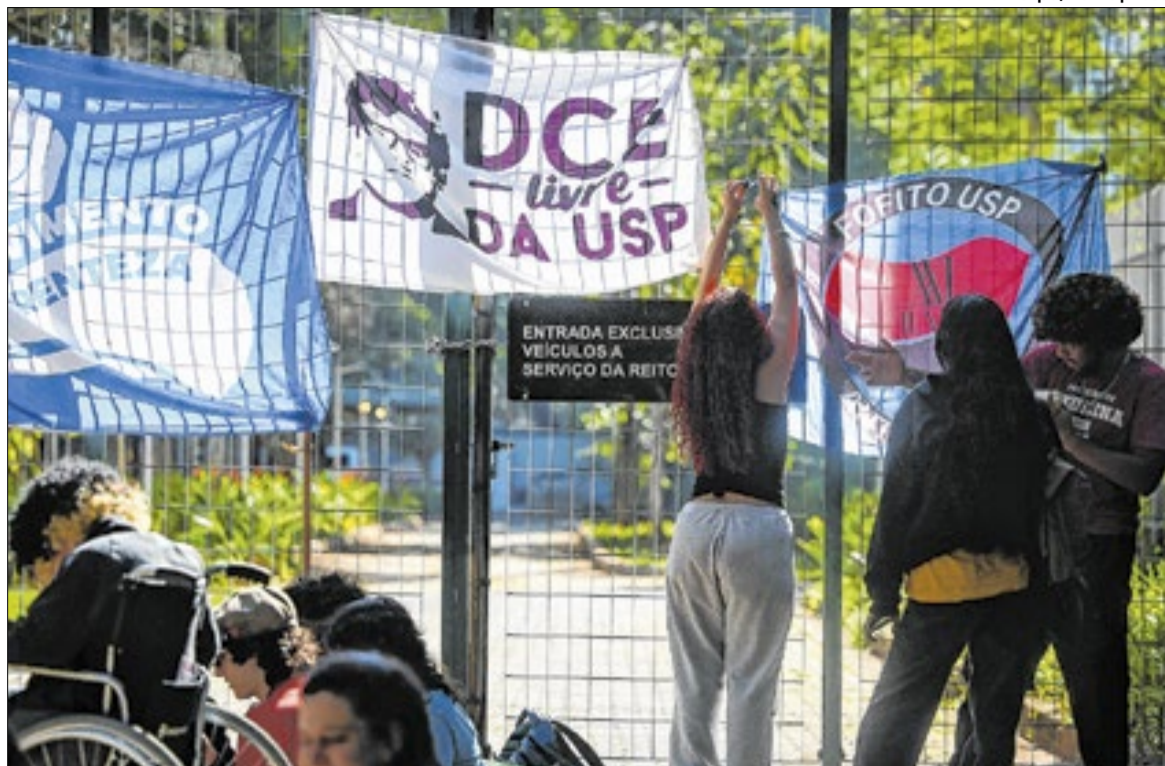
Todas as entradas da reitoria da universidade, na capital paulista, ficaram bloqueadas

Movimento cobra retomada das negociações sobre greve