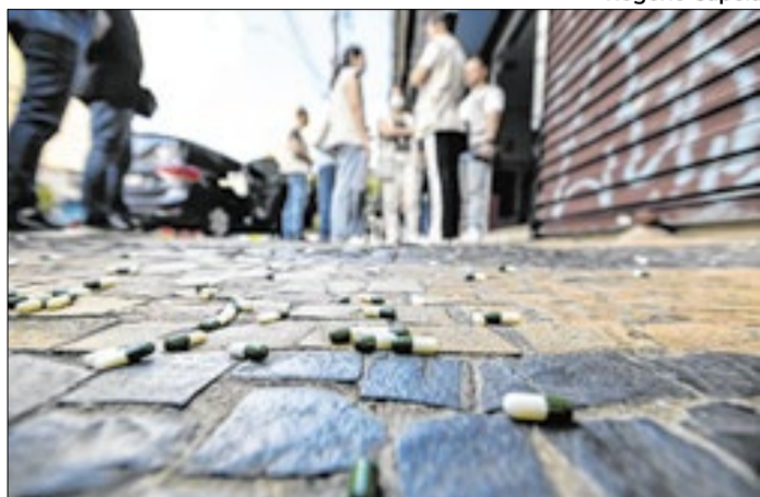
Operação surpresa mobiliza 380 auditores