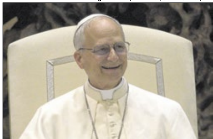
Papa recebeu o secretário de Estado americano em Roma