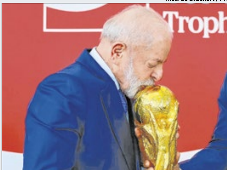
"Vamos aí para ganhar a Copa", disse o presidente Lula

Terminada a reunião de quase três horas na Casa Branca, em Washington, houve espaço para os presidentes conversarem sobre o evento