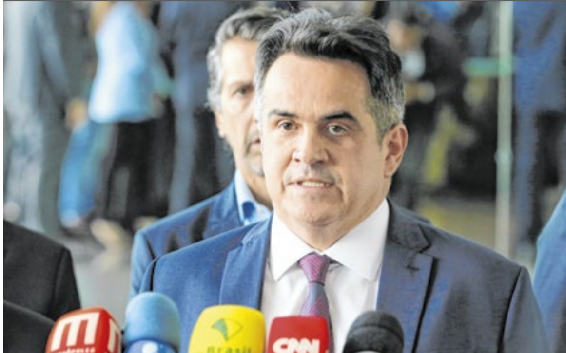
Investigação aponta Ciro Nogueira como uma espécie de braço político de Vorcaro

Em contrapartida, Ciro atuaria politicamente em favor dos interesses de Vorcaro . Entre os exemplos citados no documento está a Emenda nº 11 à Proposta de Emenda à Constituição (PEC) nº 65/2023, que ficou conhecida como “Emenda pró Master”, que determinava o aumento da cobertura do Fundo Garantidor de Crédito (FGC) de R$ 250 mil para R$ 1 milhão por depositante. O FGC funciona como um seguro para correntistas e investidores que oferece proteção de até R$ 250 mil por CPF/CNPJ e por instituição financeira em