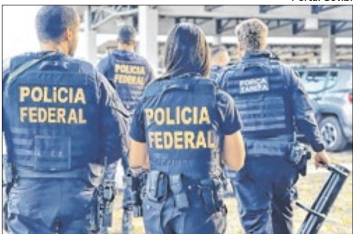
Polícia Federal ganhou muito mais independência