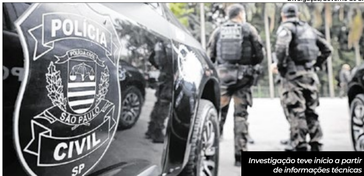
Investigação teve início a partir de informações técnicas

Segundo a Corregedoria, a investigação teve início a partir de informações técnicas que indicaram a extração, manutenção e possível comercialização de dados institucionais por um profissional de tecnologia da informação. O suspeito estaria negociando informações em