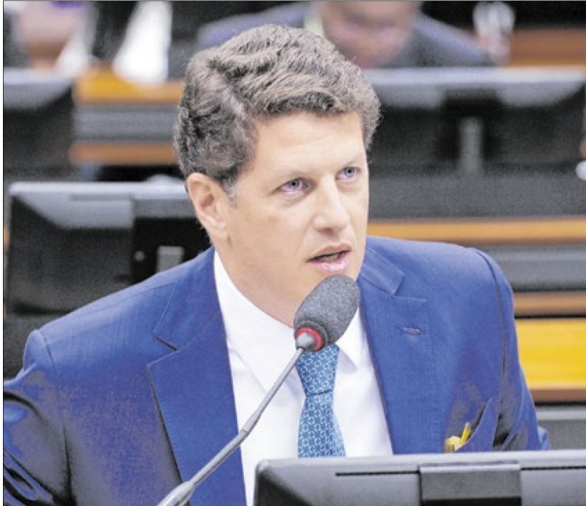
Salles afirmou que não considera André do Prado um representante legítimo da direita

Durante transmissão ao vivo nas redes sociais, Salles afirmou que não considera André do Prado um representante legítimo da direita e associou o parlamentar ao chamado Centrão. Segundo o deputado do Novo, o presidente da Alesp não possui histórico político alinhado ao campo ideológico conservador. Salles reagiu às declarações de Eduardo Bolsonaro, que havia afirmado que a divisão de candidaturas poderia favorecer nomes ligados à esquerda