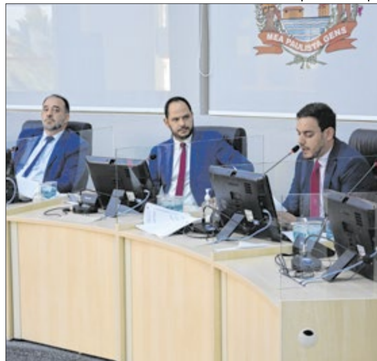
Vereadores analisam documentos e discutem regras da CPI

Mais de um ano após ser multada pela Cetesb, a prefeitura de Iracemápolis (SP) ainda não resolveu o problema do único ecoponto da cidade, que segue acumulando lixo. A gestão municipal contratou empresa especializada, removeu 8,5 mil toneladas e aplica multas por descartes irregulares, mas admite que o problema persiste.