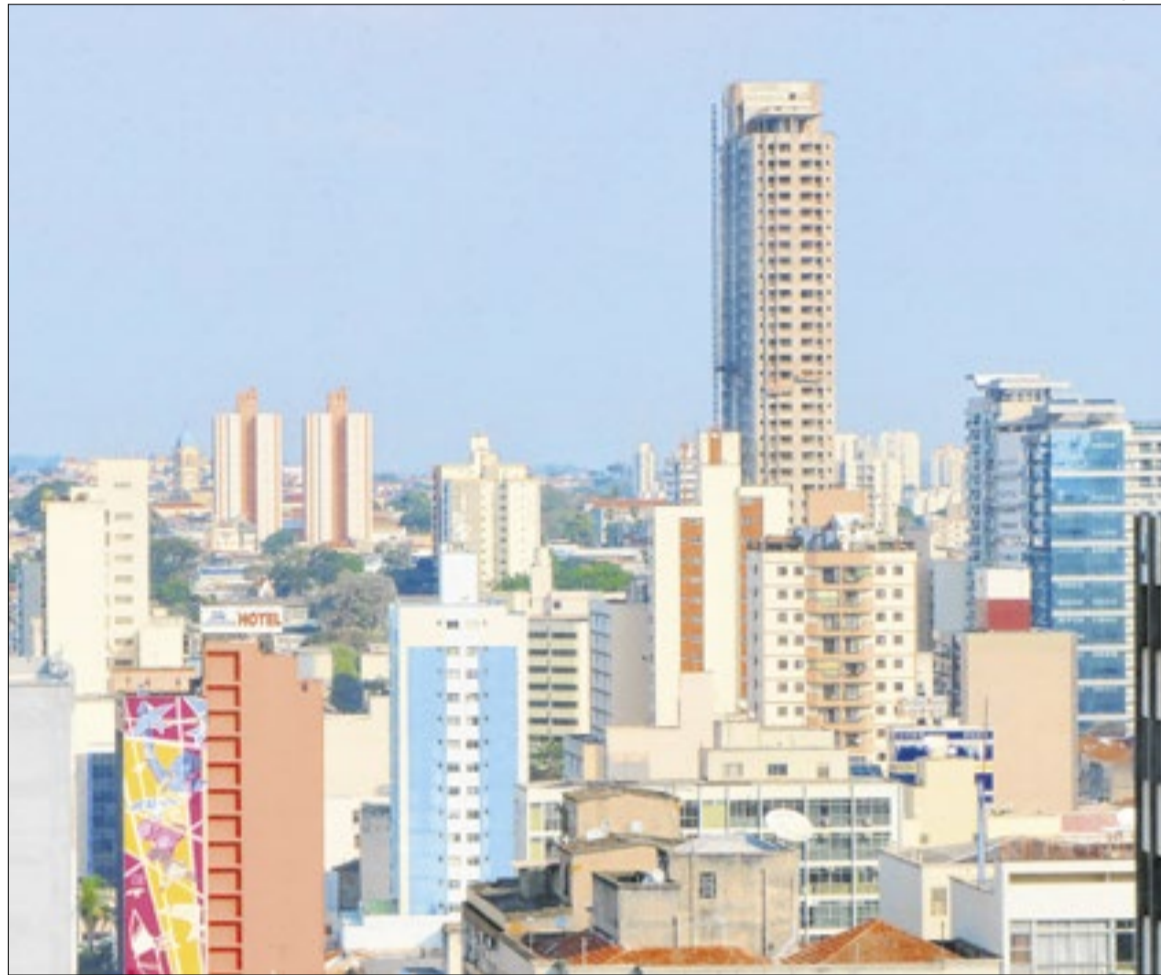
Prefeitura de Campinas

Simulações feitas pelo Poder Executivo mostram que a economia para o construtor será real: em um exemplo no distrito do Campo Grande, uma taxa que poderia chegar a quase R$ 3 milhões cairia para cerca de R$ 487 mil. No bairro Nova Europa, a re-