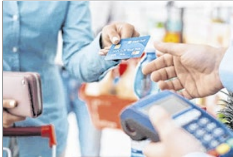
Cartão de crédito segue como a principal dívida dos brasileiros

A pesquisa também mostra diferenças entre as faixas de ren-