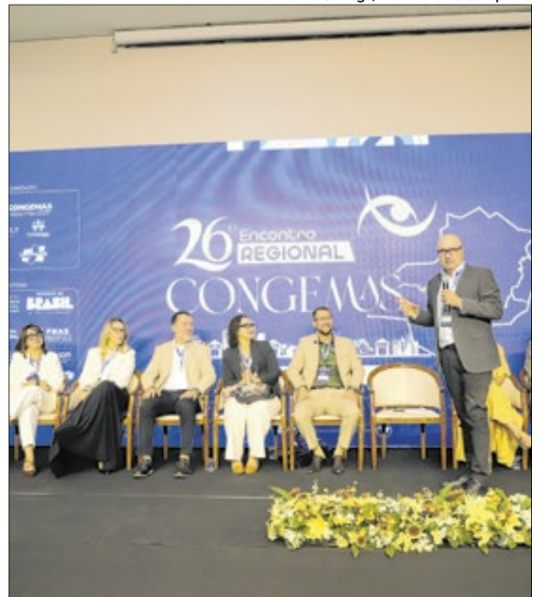
Campinas sediou abertura do Encontro Regional do Congemas

Na prática, esse financiamento pode dar mais estabilidade a serviços voltados a famílias em situação de vulnerabilidade, pessoas idosas, crianças, adolescentes, pessoas com deficiência, população em situação de rua e vítimas de violações de direitos.