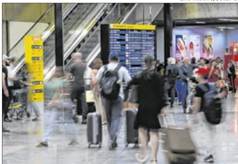
Desembarque internacional no Aeroporto de Guarulhos

Durante o período de retenção, os quatro permaneceram hospedados em um hotel localizado dentro da área restrita de embarque do aeroporto, sem autorização para circu-