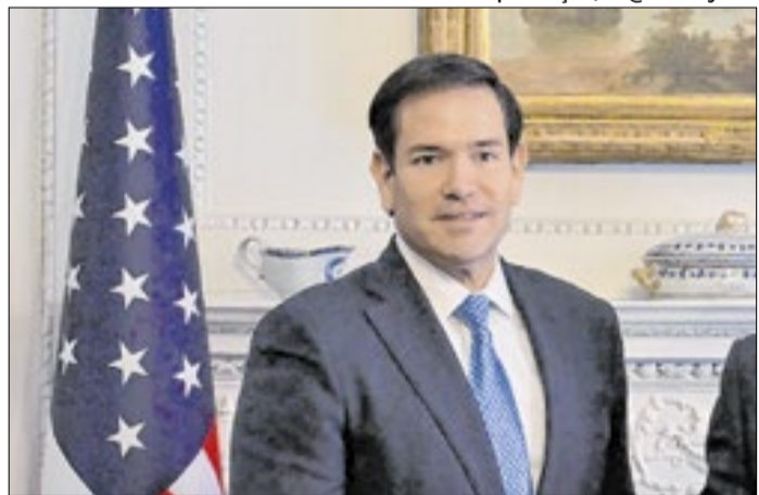
Católico, Marco Rubio expôs visão dos EUA sobre guerras