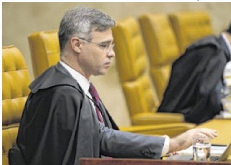
Operação foi autorizada por André Mendonça

caso de falência ou intervenção do Banco Central (BC).