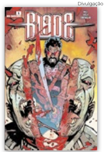
Wesley ajudou a reformular o personagem nas HQs

Curta com o ator vira cult no IndieLisboa, em Portugal, e amplia a fama de seu personagem mais icônico, Blade, o caçador de vampiros da Marvel, que ganhou nova leva de HQs