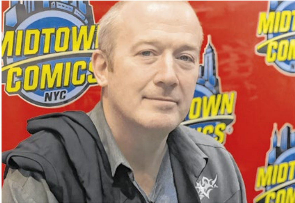
Sem qualquer subserviência à correção política, Garth Ennis virou um sinônimo de HQ autoral nos anos 1990

Quadrinhos de Garth Ennis, o criador da saga 'The Boys' - transformada em série na Prime Video - infestam livrarias e bancas, nos exterior e no Brasil, renovando seu prestígio autoral