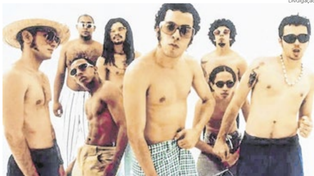
A Nação Zumbi segue honrando o legado de Chico Science, voz e rosto do movimento manguebeat nos 30 anos de 'Afrociberdelia'