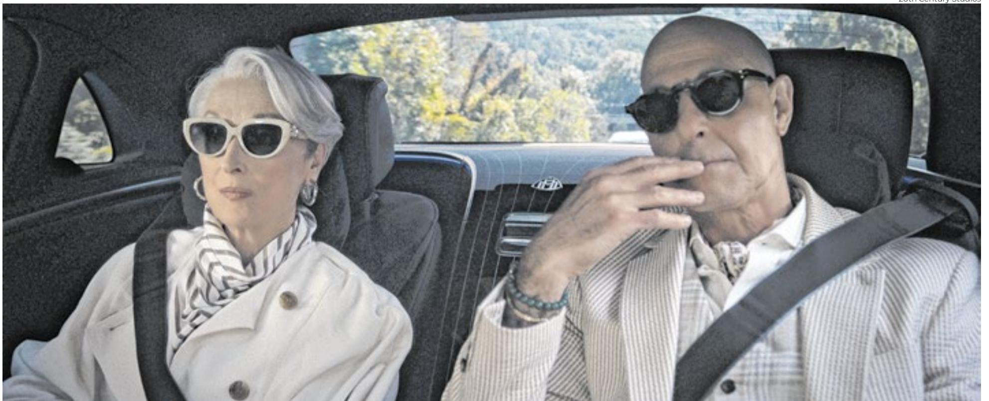
Até Meryl Streep e Stanley Tucci se surpreendem com o tanto de lucro que O Diabo Veste Prada 2 tem dado ao circuito