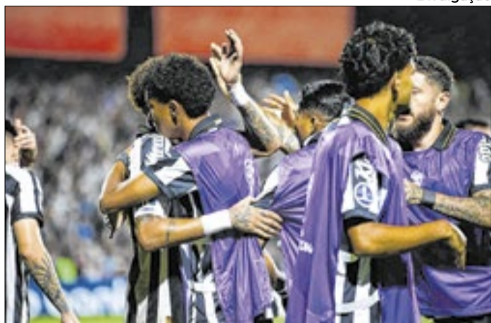
Neymar pediu desculpas publicamente após briga