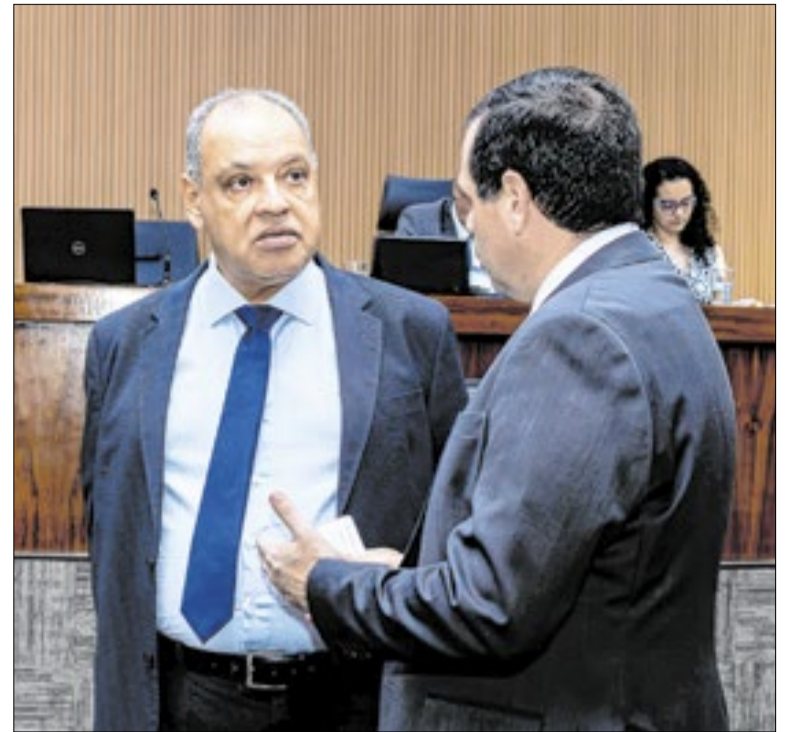
Abertura da comissão foi rejeitada por unanimidade

É urgente que a Prefeitura mude esse histórico. A ampliação de escopo não pode ser muleta para a ineficiência. Campinas precisa entregar o que promete no prazo estabelecido por ela mesma. Respeitar o cronograma é, antes de tudo, respeitar o erário e a dignidade de quem sofre com enchentes há décadas.