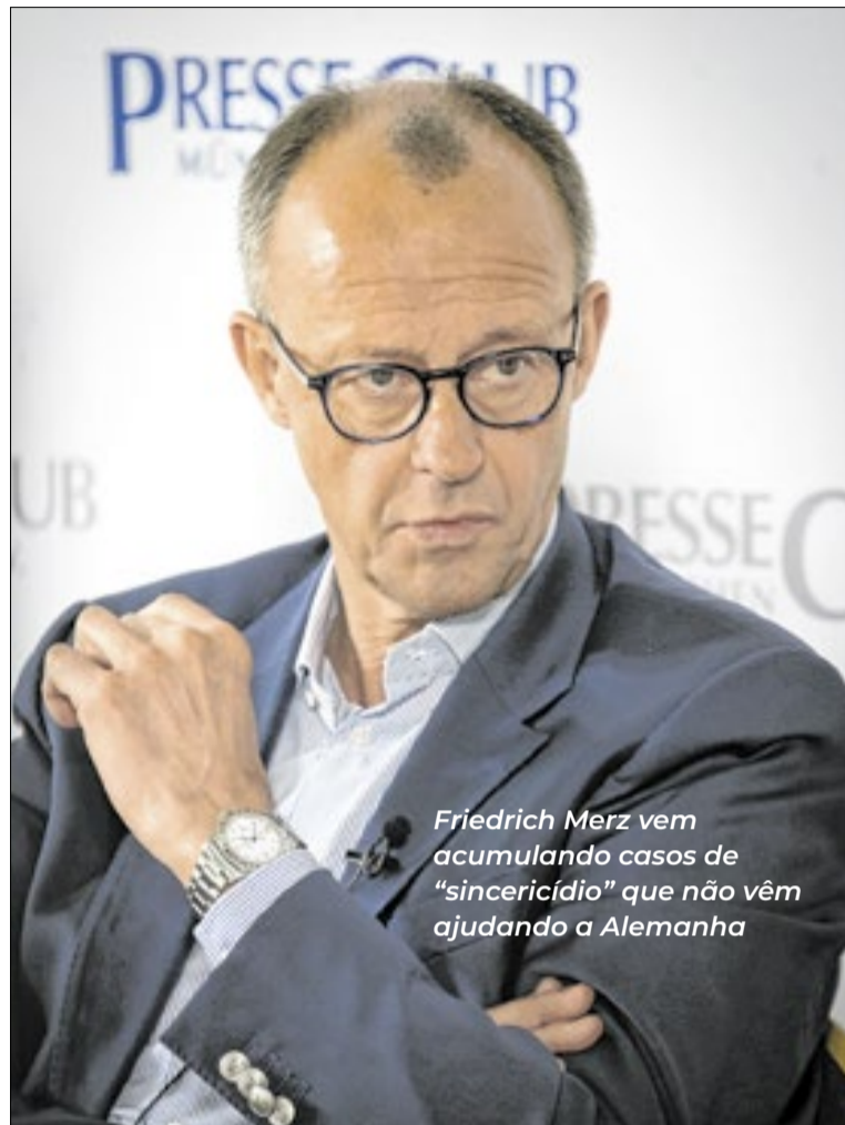
Friedrich Merz vem acumulando casos de “sincerídio” que não vêm ajudando a Alemanha

Fazer a coalizão funcionar é um imperativo para o primeiro-ministro. Além da impopularidade do governo, as pesquisas mostram que uma nova eleição alçaria a Alternativa para a Alemanha (AfD), a sigla de