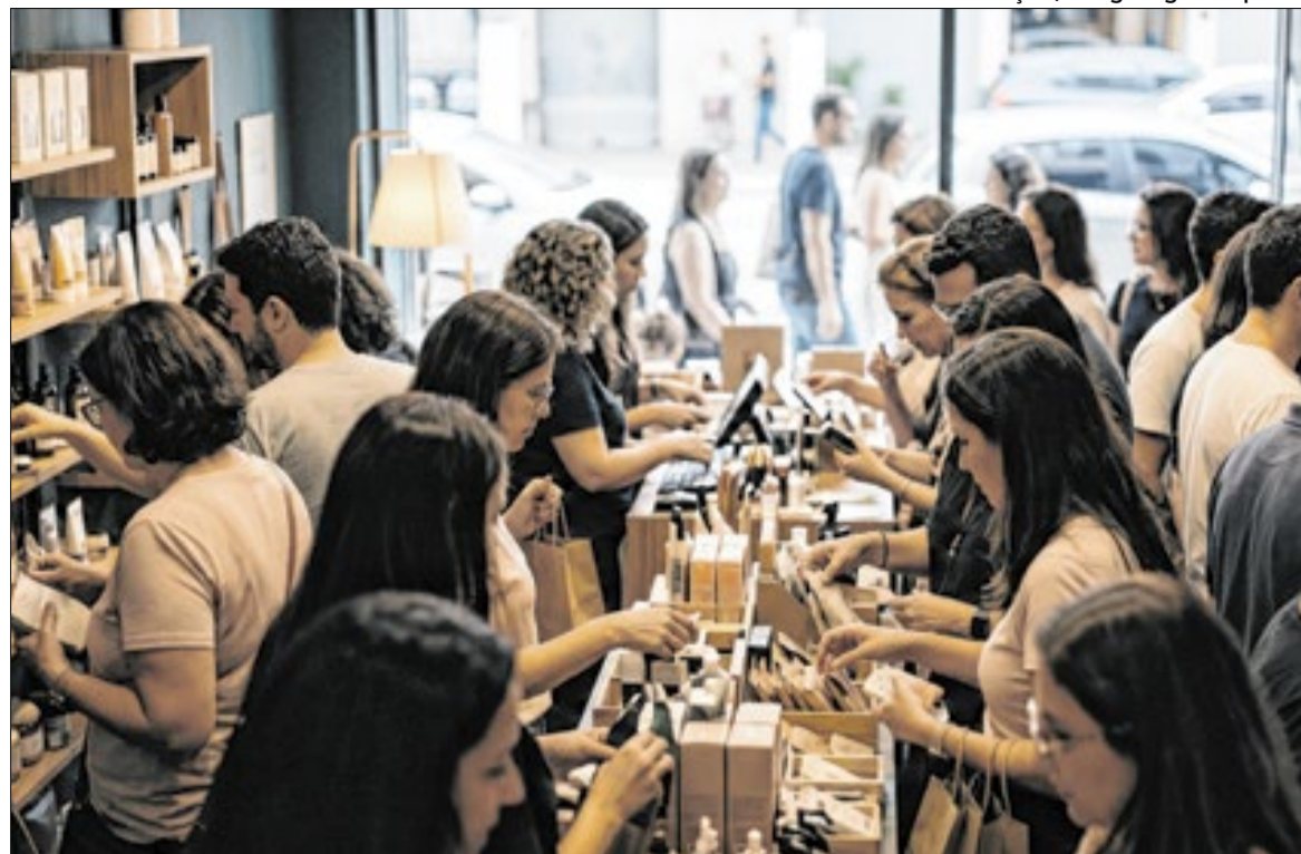
Gasto médio por pessoa deve ser de R$ 250, aponta Sebrae-SP

O comportamento de compra também aponta para planejamento antecipado. Cerca de 63% dos consumidores afirmam que pretendem organizar as compras com antecedência, enquanto 39% devem realizar as aquisições entre sete e 14 dias antes da data. Esse padrão influen-