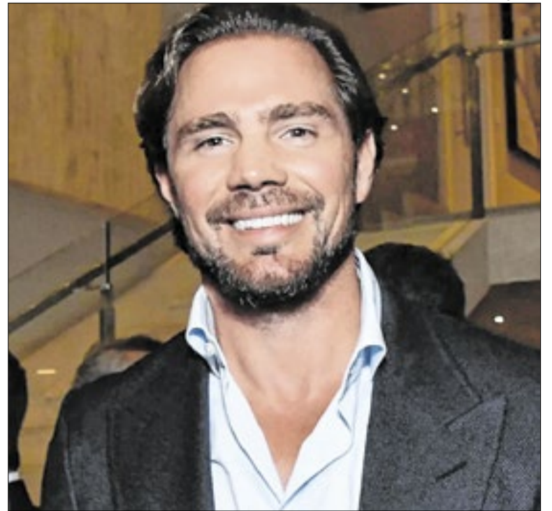
Vorcaro agora negocia condições da delação

Em seus despachos, os ministros afirmam que as decisões tomadas ontem foram motivadas por “inúmeras notícias veiculadas pela mídia”. Desde a limitação desse tipo de pagamento que diversos veículos têm publicado medidas que procuram contornar a limitação de salários estabelecida pelo STF.