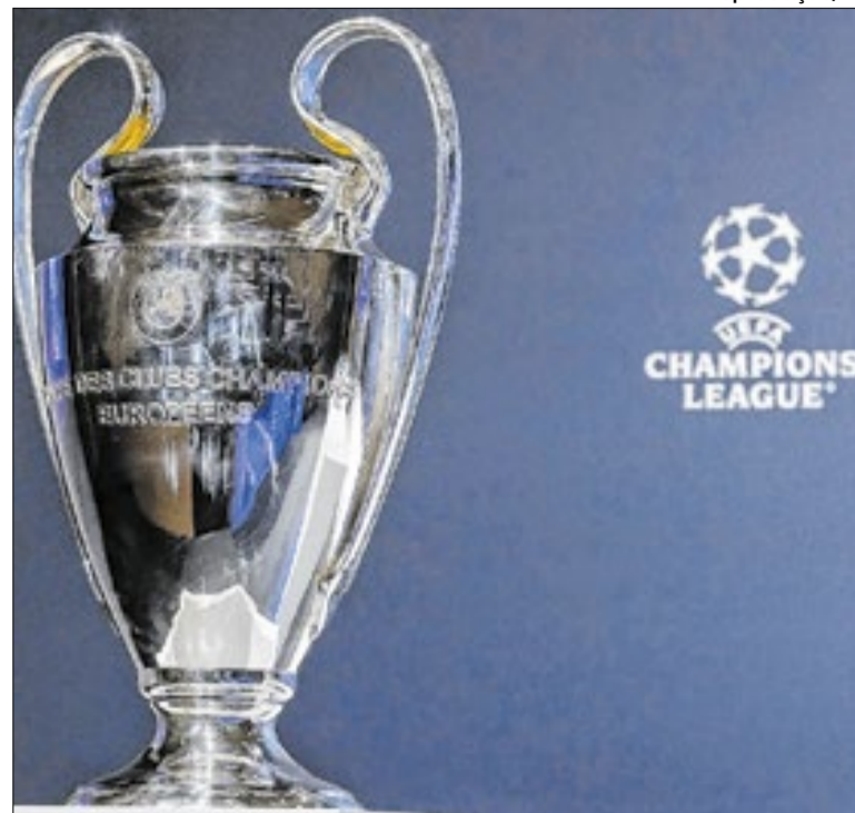
Final da Champions League será disputada no sábado (30)

A prática substituiu o uso de rojões, proibido por lei há sete anos. Por causa dos shows, o Tricolor disputou as últimas partidas como mandante fora do Morumbis. O clube espera que o gramado esteja recuperado até 19 de maio, quando recebe o Millonarios, pela Copa Sul-Americana, e volta a jogar em casa.