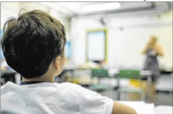
Uniformes, materiais e estoques têm irregularidades