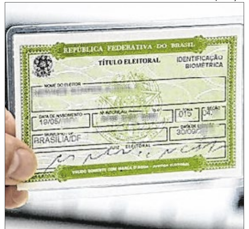
Causas para invalidação inclui a ausência não justificada

Em Sumaré, no Jardim Cidade Nova, uma mulher de 33 anos foi abordada após atitude suspeita. Contra ela, os policiais encontraram um mandado de prisão em aberto pelo crime de tortura, com validade até 2046. Todos os capturados foram encaminhados aos plantões policiais e permanecerão à disposição da Justiça.