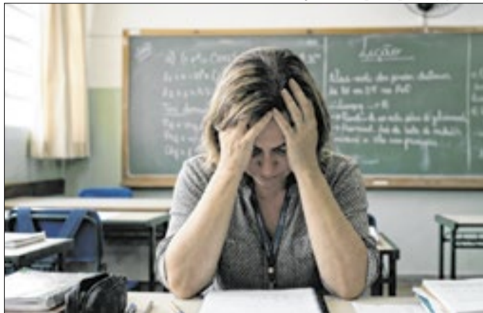
Ilustração / Imagem gerada por IA

29,8% dos profissionais da educação afirmam ter depressão