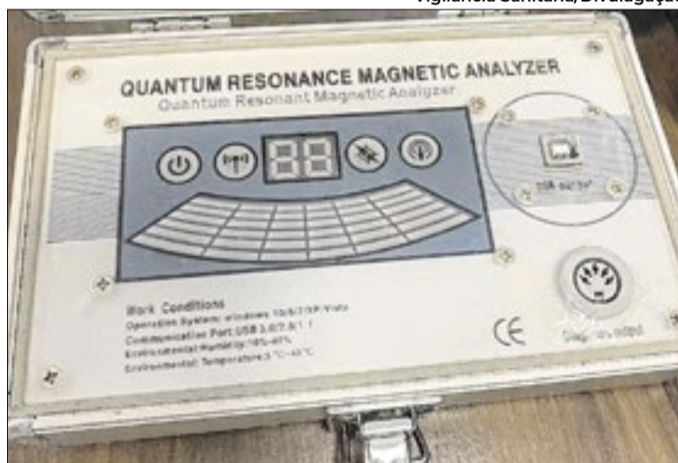
Equipamento de biorressonância encontrado no local

A responsável apresentou apenas um certificado de tecnó-