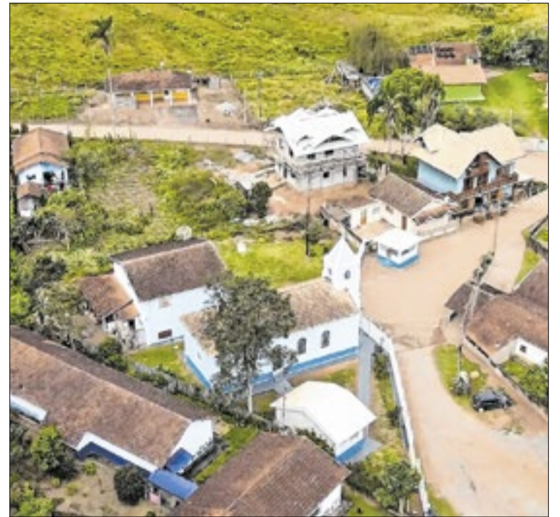
Bairro Cantagalo não tinha acesso à água potável

Os estudantes do Ensino Fundamental funcionarão na sede da Secretaria de Educação, no Parque Cidade, em 12 turmas. Já a turma de Educação Infantil será alocada na Emeief Major José Levy Sobrinho, no Jardim Esteves. Merenda, mobiliário e material didático já estão sendo providenciados.