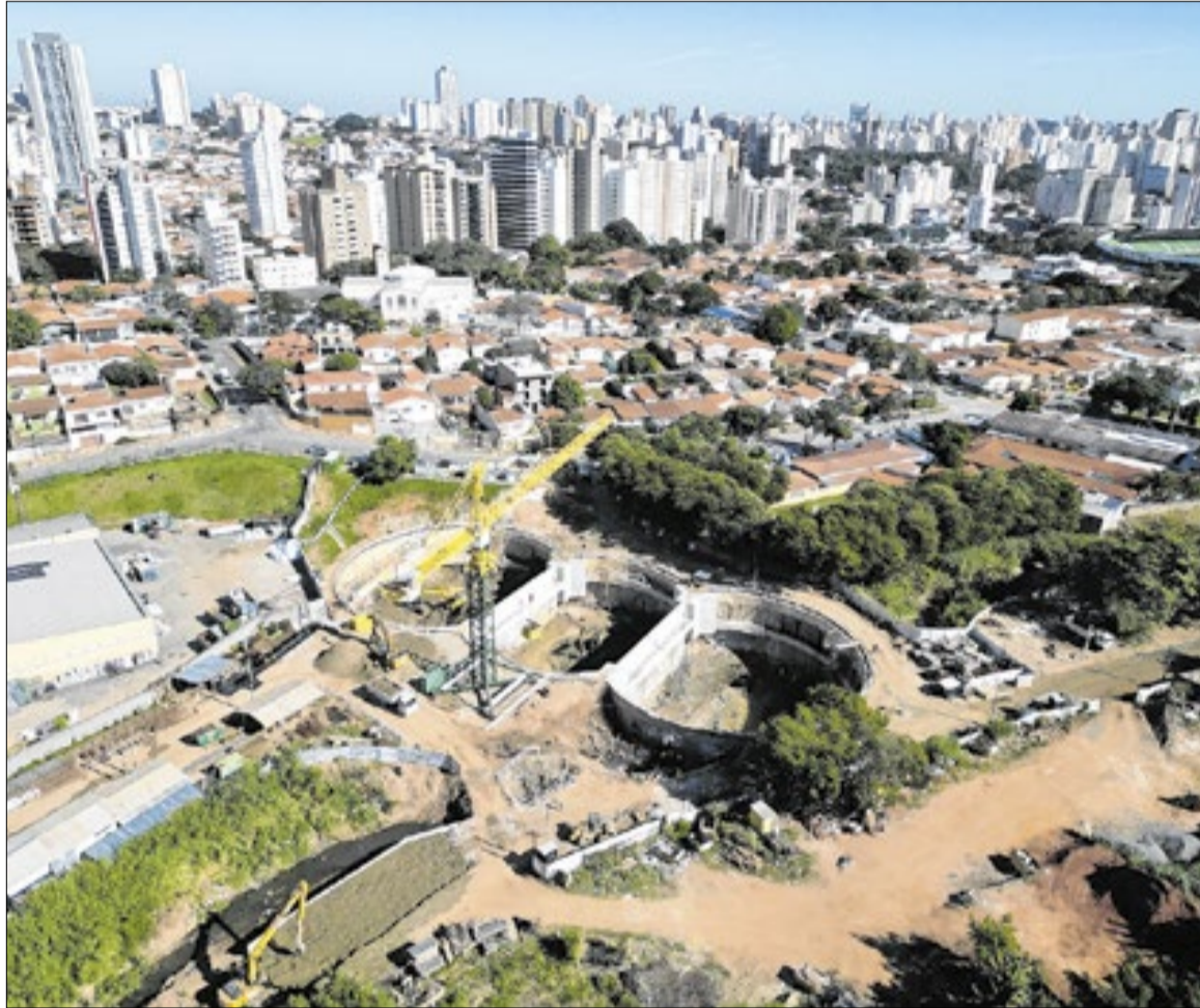
Vista aérea das obras do Reservatório RP-1, da Praça de Esportes Paranapanema

A conclusão é considerada fundamental pela Prefeitura para a estabilidade do escoamento pluvial no Centro e para a proteção das áreas afetadas historicamente pelas cheias do Ribeirão Anhumas.