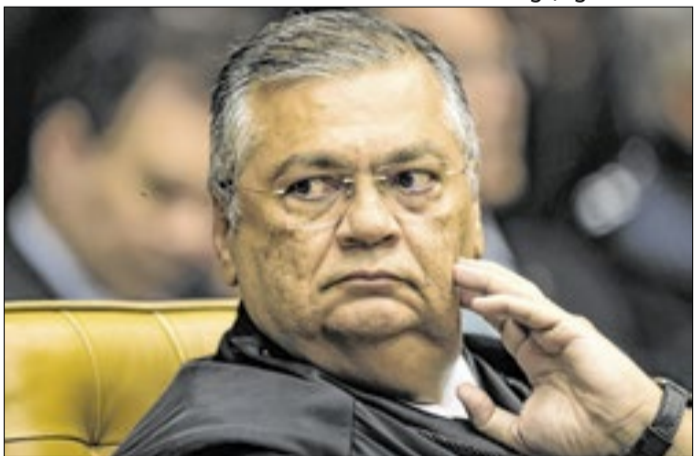
Flávio Dino é quem costurou o acordo no Maranhão