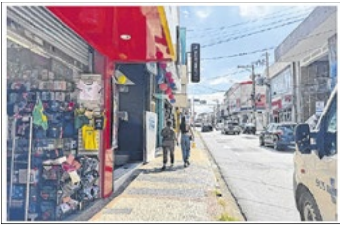
ACIL lança campanha com R$ 50 mil em vales-compra