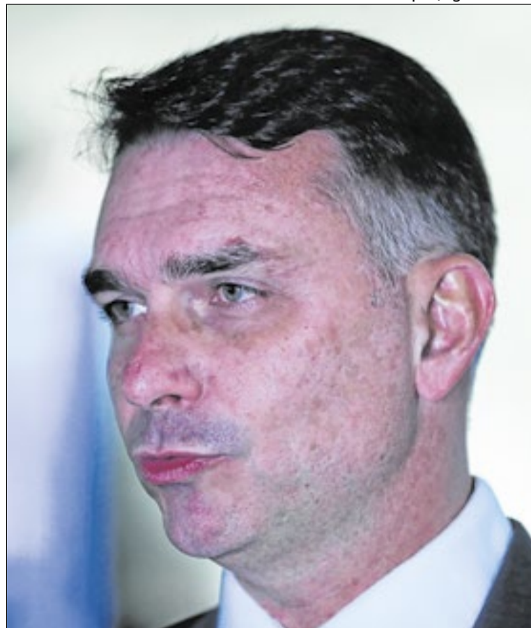
Pesquisa aponta maior grau de certeza no voto em Flávio

Essa cristalização fica ainda mais evidente quando se vê a baixa performance dos demais candidatos à Presidência, todos correndo mais no mesmo campo conservador de Flávio Bolsonaro. No primeiro turno, de acordo com a pesquisa estimulada, Lula teria 40% das intenções de voto. Flávio vem