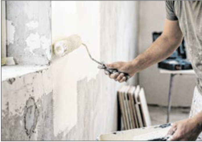
Ilustração / Imagem gerada por IA

Programa oferece de R$ 5 mil a R$ 30 mil para reformas