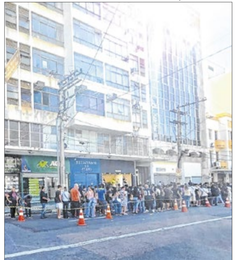
Fila para regularizar título na rua General Osório, Centro

Já os títulos que foram cancelados pertencem a eleitores que deixaram de votar, não justificaram a ausência em três eleições consecutivas e não pagaram as multas correspondentes. O cancelamento também atinge quem não compareceu à revisão biométrica obrigatória em municípios onde houve convocação entre 2010 e 2019.