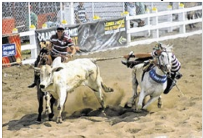
Estatuto de Campinas proíbe rodeios na cidade