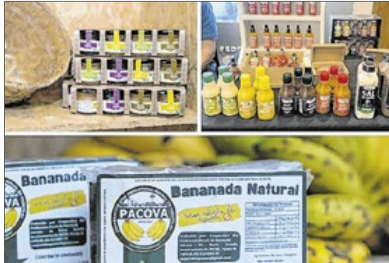
Doces, mel, cafés e castanhas estão na lista de produtos

clusão de agricultores familiares no Cadastro de Prestadores de Serviços Turísticos (Cadastur), o que amplia o acesso a políticas públicas, crédito e ações de promoção. A medida contribui para a formalização do tu-