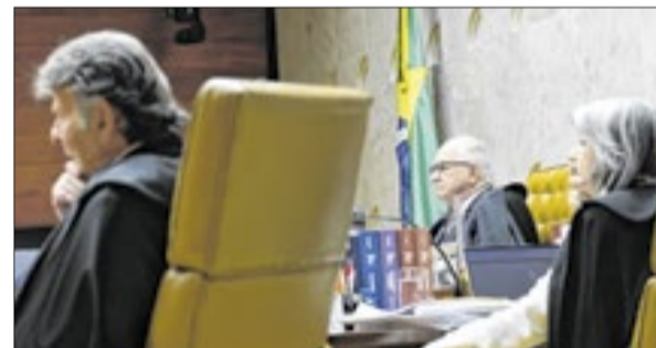
O ministro Luiz Fux, o único do Rio no STF com a relatora Cármen Lúcia e o presidente Edson Fachin