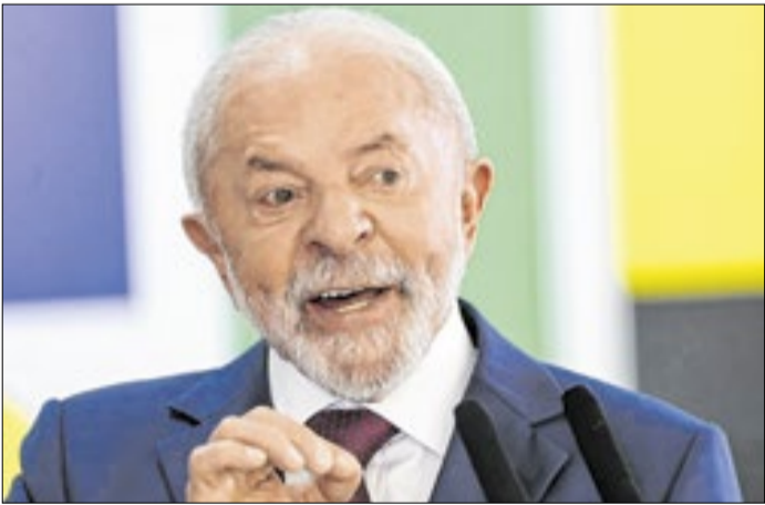
Lula deverá anunciar medidas na próxima semana