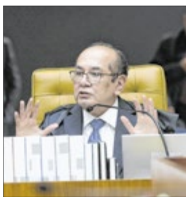
Gilmar Mendes estranhou chuva de processos de municípios no TRF-1