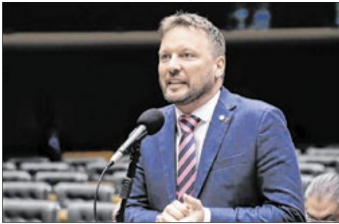
Proposta de Marcon flexibiliza horas de trabalho