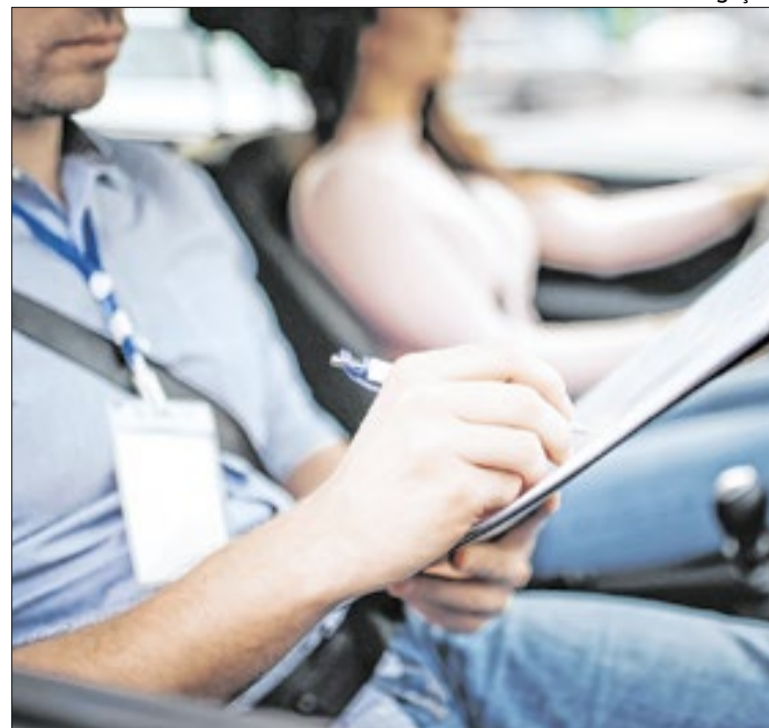
O registro das aulas práticas serão realizadas pelo instrutor

A Prefeitura de Niterói planeja transformar o antigo Hotel Panorama, abandonado há 50 anos no Morro da Viração, em um complexo de turismo ecológico. O projeto prevê 275 quartos e um possível teleférico ligando Charitas ao local. A proposta, em fase de licenciamento, gera debates sobre a proteção da vegetação nativa.