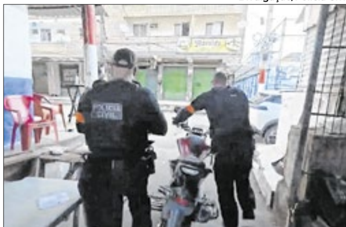
Polícia Civil realiza operação no complexo da Maré