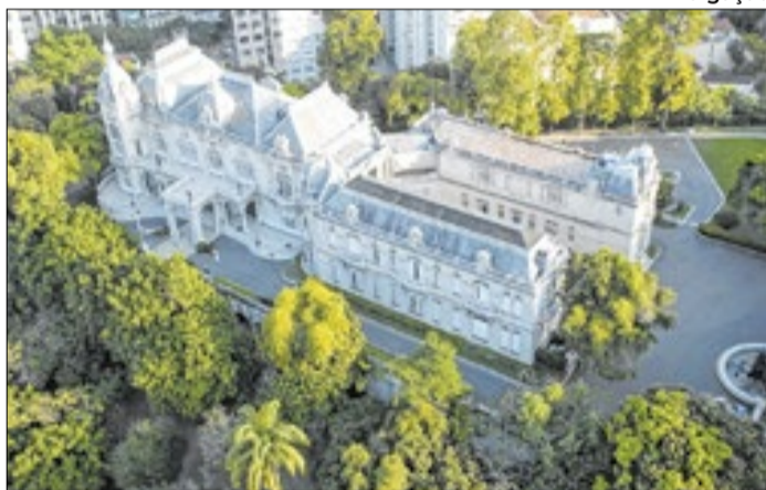
O Palácio das Laranjeiras foi construído entre 1909 e 1913