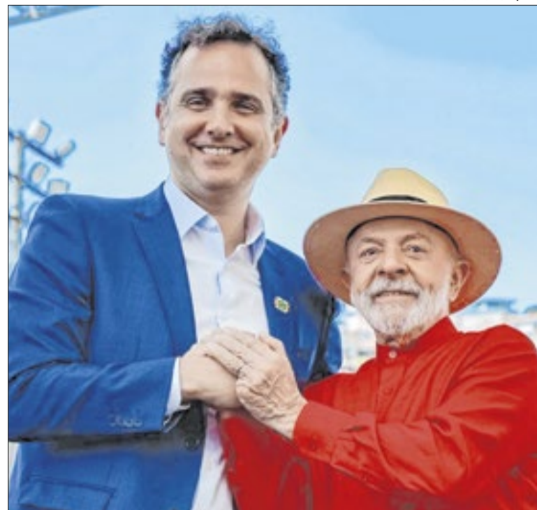
Lula quer Pacheco, mas situação ficou mais difícil

Assim, a avaliação do PT é que uma união de forças agora seria importante, especialmente para Lula, que teria um palanque consolidado no DF, fortalecendo-se. E para os partidos aliados a ele que, diante do quadro de confusão que o caso Master/BRB, teriam agora uma janela de oportunidade.