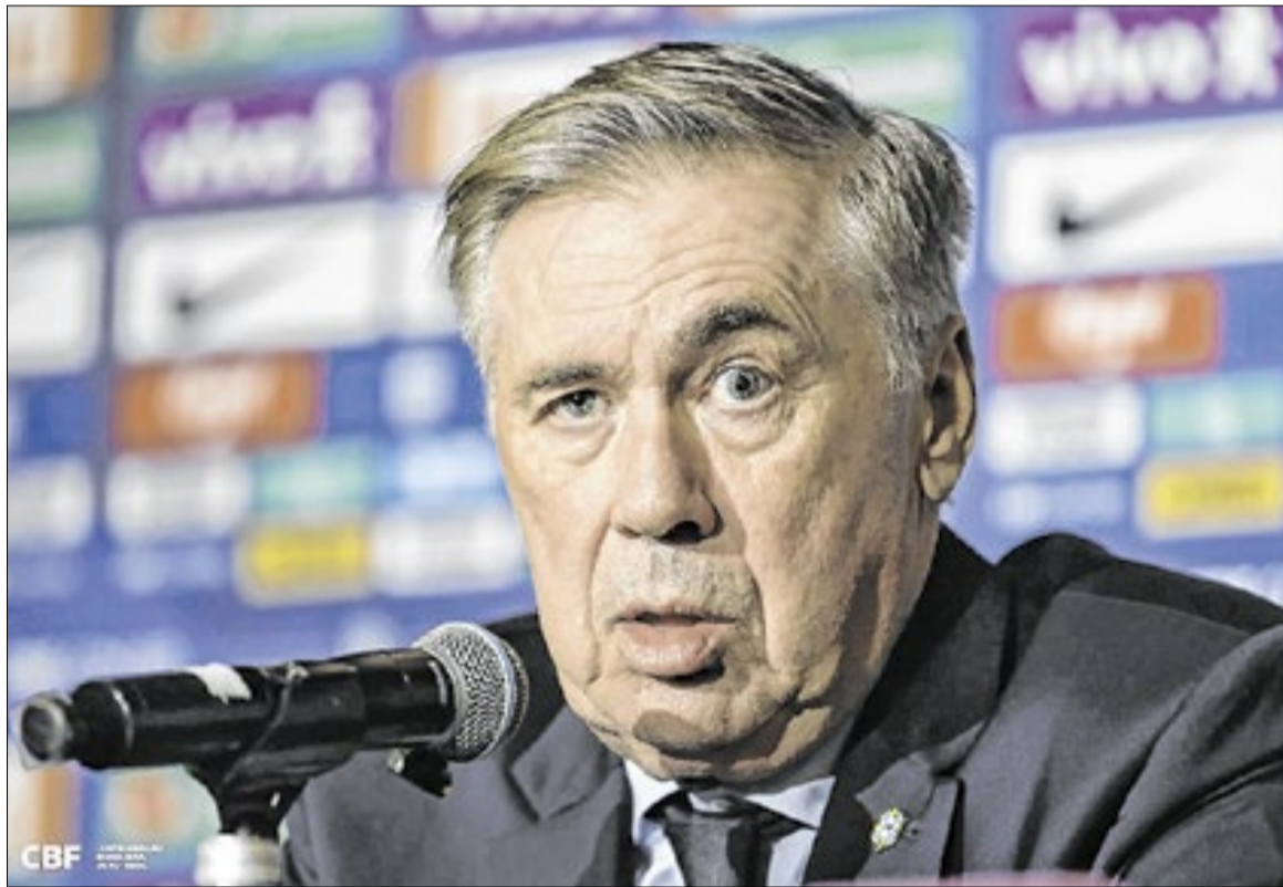
Bons desempenhos dos atacantes poderiam causar dúvidas na lista final de Carlo Ancelotti

Dos principais atacantes cotados para Copa, apenas Neymar e Gabriel Martinelli não marcaram, mas também não foram a campo. O camisa 10 do Santos foi poupado da partida contra o Palmeiras, enquanto o jogador do Arsenal não saiu do banco contra o Fulham.