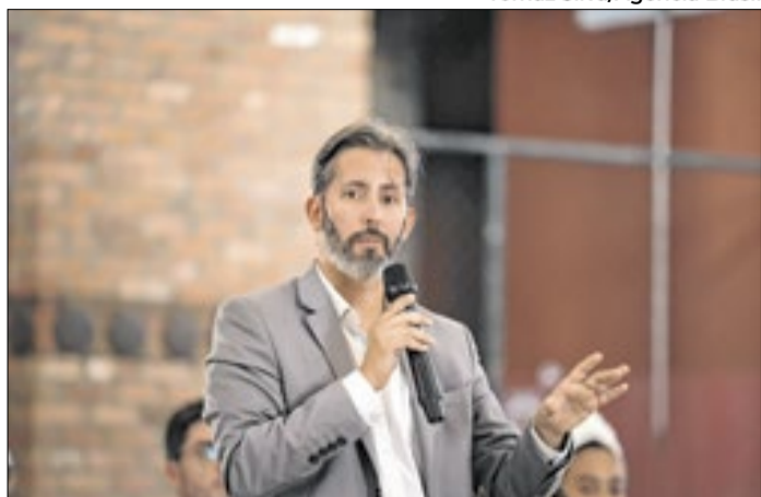
Grass ainda guarda vice para o PSB