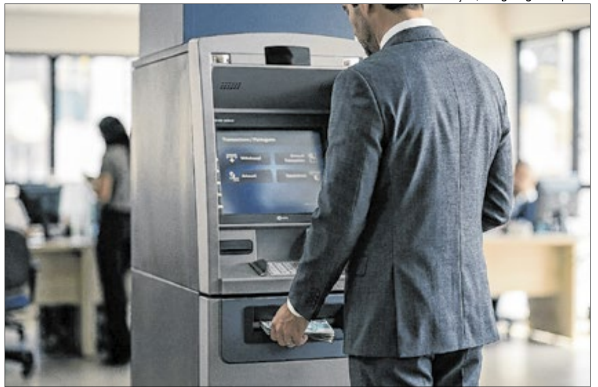
Em 2026, emendas parlamentares somam cerca de R$ 61 bilhões - equivalente a 1% do Orçamento

Isso impõe às instituições financeiras o dever de monitorar essas movimentações e comunicar operações suspeitas ao Conselho de Controle de Atividades Financeiras (Coaf).