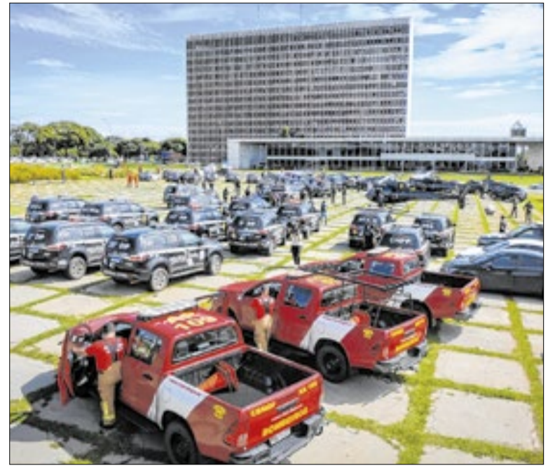
Dados indicam redução de crimes e foco em prevenção

O anuário mostra ainda que o DF registra a menor taxa de mortes por intervenção legal no país. Em 2025, foram contabilizadas 15 ocorrências. O resultado mantém o histórico de baixa letalidade policial e está associado a medidas como capacitação contínua, uso progressivo da força e protocolos operacionais.