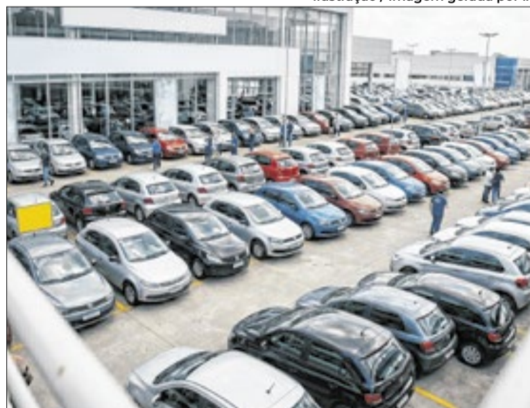
Gol foi o veículo mais vendido: 61.175 unidades em abril

O relatório também destaca a melhora da confiança do consu-