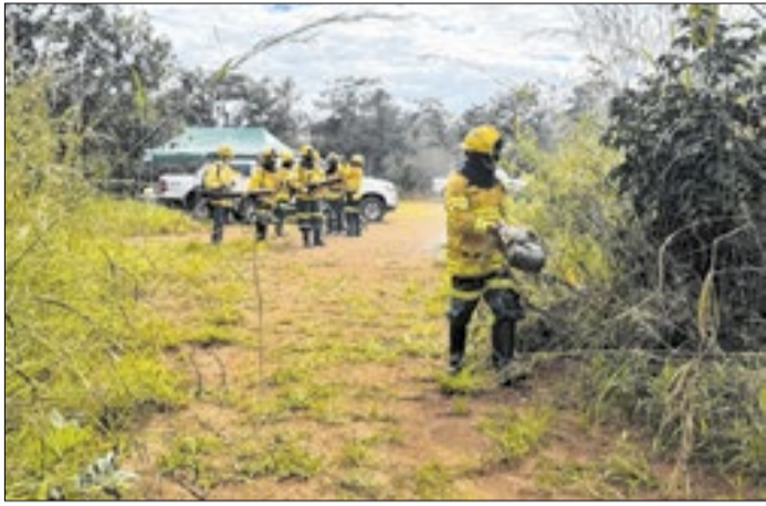
Prevenção reduz biomassa que pode alimentar incêndios