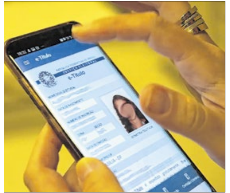
Quem não cumprir o prazo ficará impedido de votar

A Polícia Científica (PCI-MS) e a Polícia Penal (PPMS) de Mato Grosso do Sul realizaram, nos últimos dias, cerca de 300 coletas de material biológico na Penitenciária Estadual Masculina de Regime Fechado da Gameleira II, em Campo Grande (MS). A ação integra a Operação Codesul Perfil Genético.