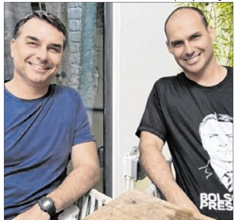
Eduardo: camisa que mistura rostos de Flávio e Bolsonaro

Especialistas da área de segurança repetem que mais importante do que aumentar penas é ter um sistema policial e judicial que impeça a impunidade. Mas, diante do projeto apresentado pela oposição, Lula ficou sem alternativas. Se fosse vetá-lo, seria chamado de protetor de bandidos.