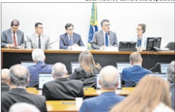
Reunião da comissão que discute fim da seis por um