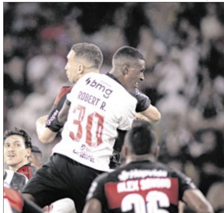
Gols do Vasco vieram de "bolas aéreas" na defesa rubro-negra