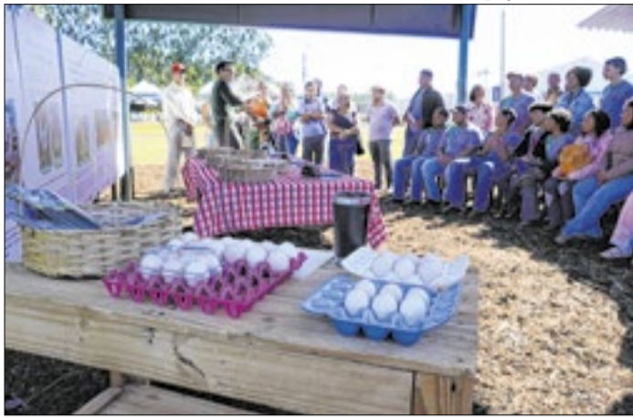
O circuito sobre avicultura abordará a produção de ovos