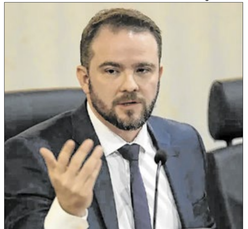
Durigan diz que BRB não é assunto do governo federal

Os filmes não precisam ser inéditos, mas devem ter sido concluídos a partir de 2025. Obras inscritas no ano passado e não selecionadas podem tentar novamente. Os títulos disputarão o prêmio de melhor filme, escolhido pelos júris popular e oficial, além de nove categorias técnicas, como direção, atuação e trilha sonora.