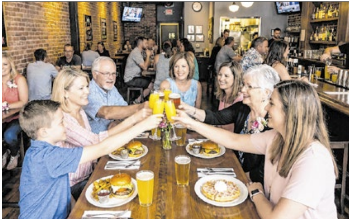
A data recebe clientes que valorizam a experiência, sendo necessário um bom planejamento

Para ele, como o cliente valoriza a experiência nessa data, surgem grandes oportunidades para os estabelecimentos que realizam um bom planejamento.