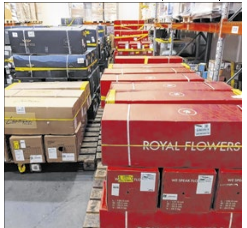
Viracopos: operação de recebimento de flores importadas

O aumento da demanda reflete a confiança do cidadão em um sistema que agora entrega resultados práticos. O exemplo de Campinas reforça que o bom jornalismo deve registrar quando a máquina pública funciona de fato em prol do cidadão.