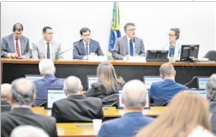
Reunião da comissão que discute fim da seis por um