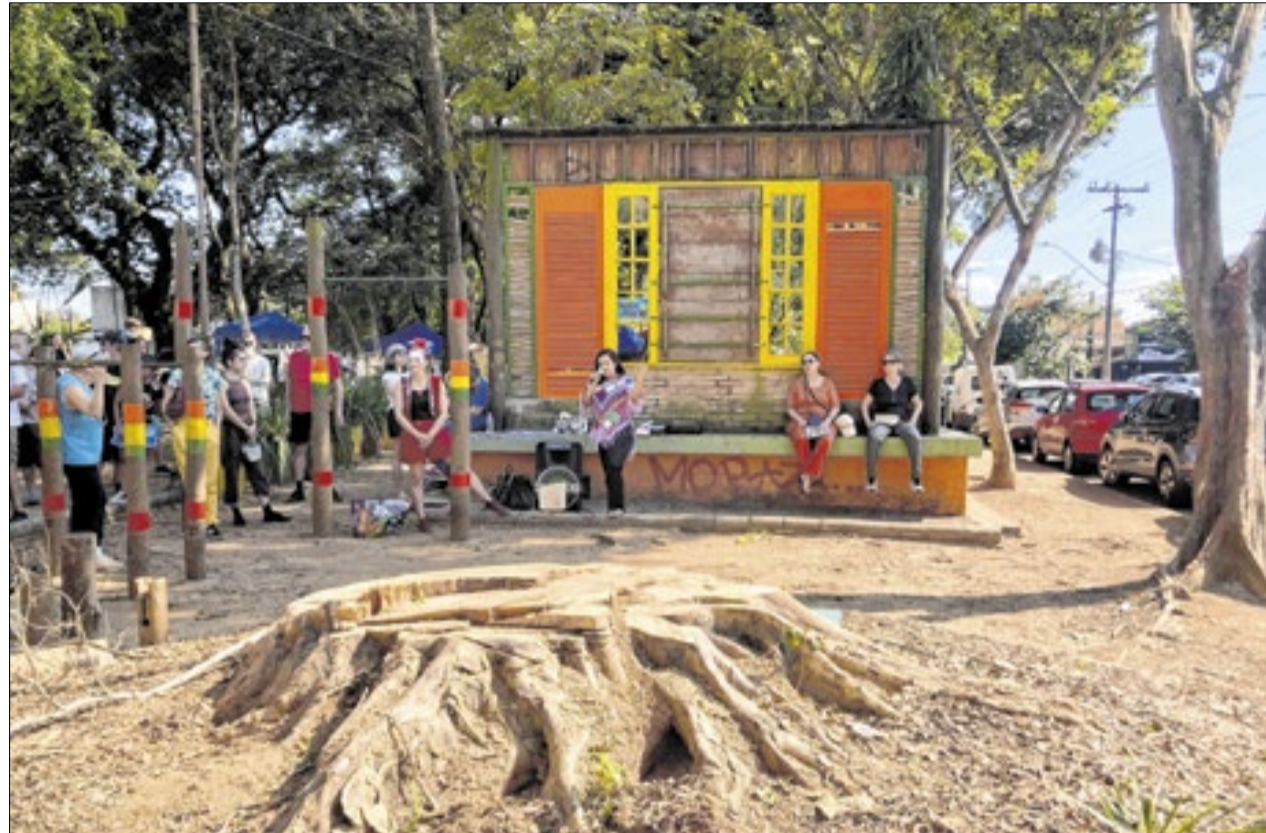
Análises apontam que árvores da Praça do Coco tinham condições de preservação

Segundo ele, o estudo utilizou duas metodologias independentes (uma conduzida por engenheiros e técnicos do Condema e da USP e outra por pesquisadores, professores e engenheiros da Unicamp)