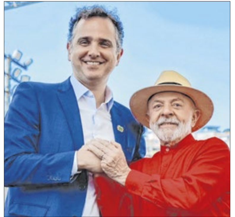
Lula quer Pacheco, mas situação ficou mais difícil

Assim, a avaliação do PT é que uma união de forças agora seria importante, especialmente para Lula, que teria um palanque consolidado no DF, fortalecendo-se. E para os partidos aliados a ele que, diante do quadro de confusão que o caso Master/BRB, teriam agora uma janela de oportunidade.