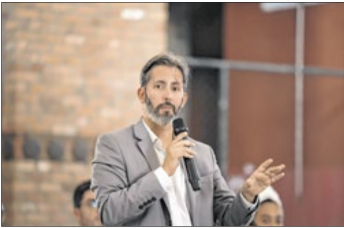
Grass ainda guarda vice para o PSB