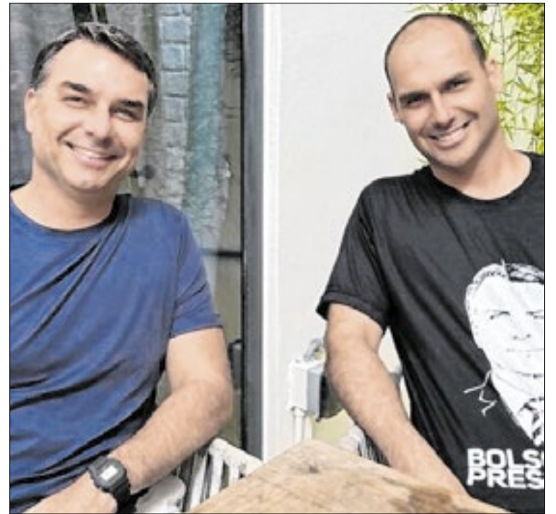
Eduardo: camisa que mistura rostos de Flávio e Bolsonaro

Especialistas da área de segurança repetem que mais importante do que aumentar penas é ter um sistema policial e judicial que impeça a impunidade. Mas, diante do projeto apresentado pela oposição, Lula ficou sem alternativas. Se fosse vetá-lo, seria chamado de protetor de bandidos.