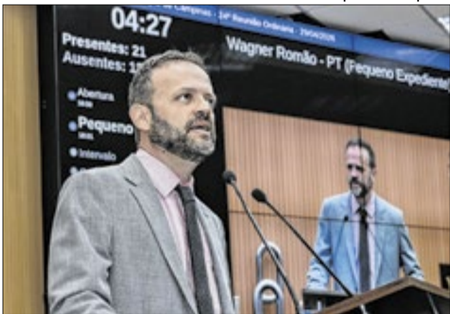
Vereador fica na liderança até agosto de 2027