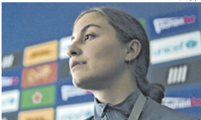
'A Conference of The Birds': Alemanha na competição lusitana