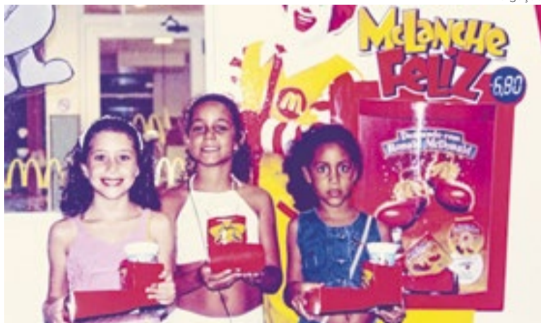
'Os Arcos Dourados de Olinda' venceu o É Tudo Verdade 2026