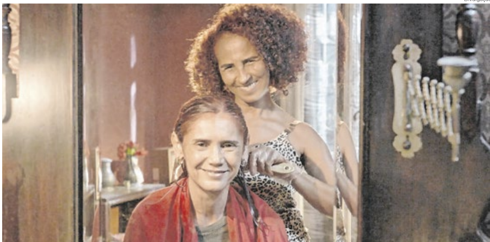
'Fiz Um Foguete Imaginando Que Você Vinha' passou pela Berlinale e saiu de lá com uma láurea da imprensa alemã