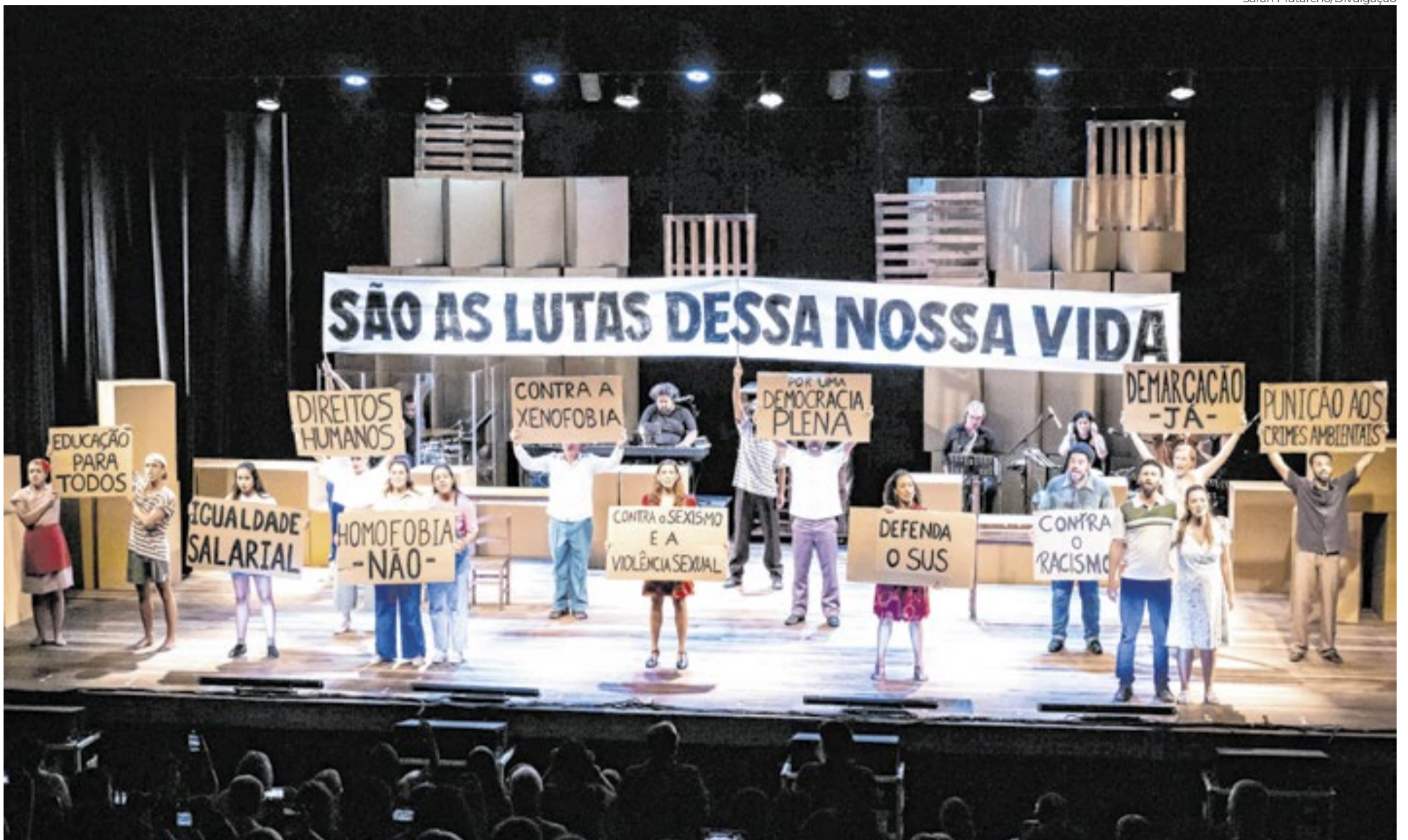
O espetáculo 'Cartas para Gonzaguinha' atualiza as lutas da sociedade brasileira, pois o artista estraia envolvido nelas

H á mais de quarenta anos, Gonzaguinha (1945-1991) lançou uma pergunta ao público: "O que é a vida?". As respostas que recebeu viraram versos de um clássico da música popular brasileira. Agora, o musical "Cartas para Gonzaguinha" traz novamente essa conversa entre o artista e o povo brasileiro para o palco do Teatro João Caetano, em curta temporada.