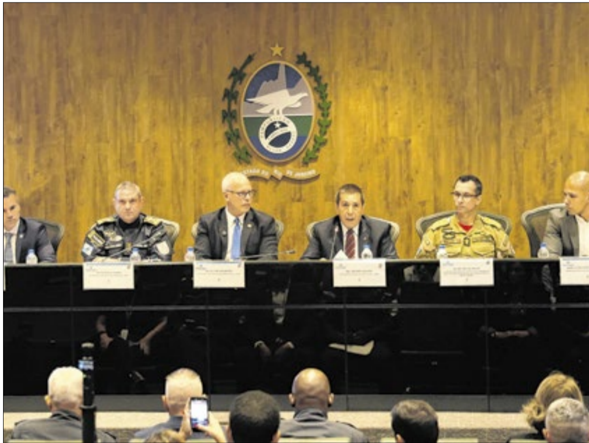
Forças de Segurança na coletiva de divulgação dos números do show