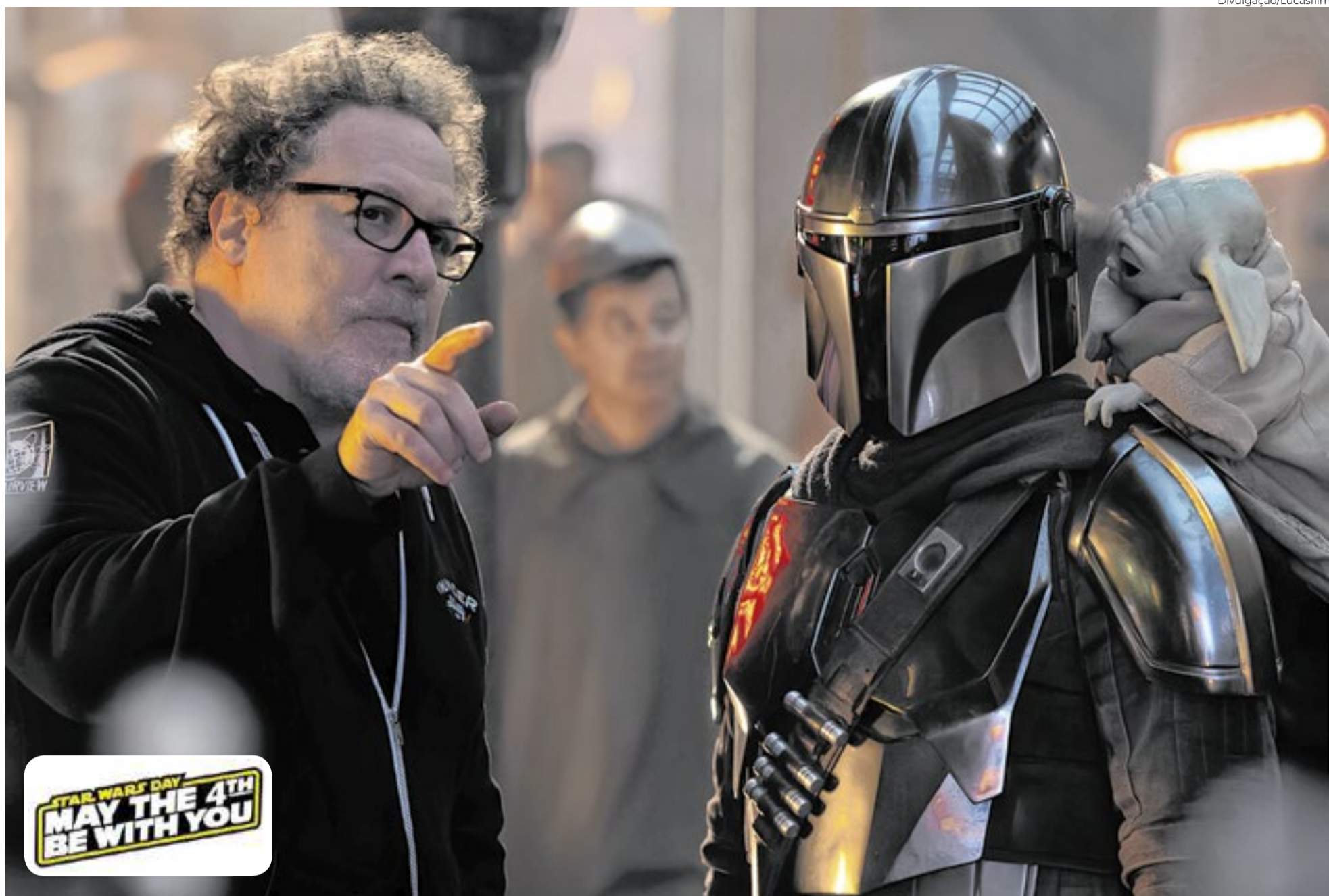
Jon Favreau dirigindo o ator Pedro Pascal (Mandaloriano) e o pequeno Grogu animatrônico nos sets de filmagem de 'Star Wars: O Mandaloriano e Grogu'