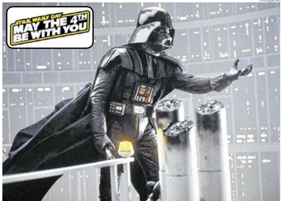
O malvado Darth Vader em cena de 'O Império Contra-Ataca', de 1980

A fim de manter a lei no cosmos, apesar do domínio do Império, Lawson participa da cruzada de vingança de um caído Lorde Sith (um Jedi do mal), que usa um sabre de luz de duas lâminas. Foi Maul quem matou Qui-Gon Jin (Liam Neeson) em "A Ameaça Fantasma" (1999), o longa-metragem que abriu a segunda trilogia de "Star Wars", que vai do fim dos anos 1990 até 2005 – embora, cronologicamente, sua trama