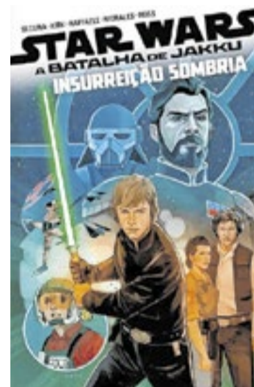
Em meio à celebração do 4 de Maio, o Dia de Guerra nas Estrelas, tem gibi, bonequinho, caneca, pantufa, camiseta e até pipoqueira temática

Quando passou pelo Festival de Cannes de 2012, para a exibição de "Esquadrão Red Tails" (do qual foi produtor), George Walton Lucas Jr. anunciou sua aposentadoria do