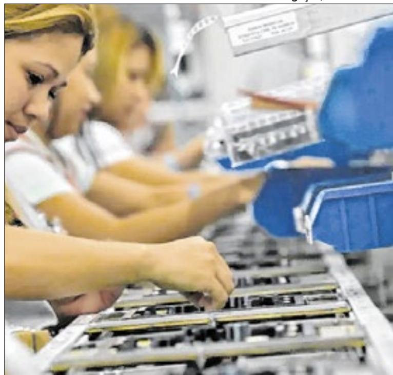
O valor contempla mais de 70 categorias profissionais

Inscrições para transferência externa da USP seguem abertas até terça-feira (5), com taxa de R$ 228. São 933 vagas, sendo 124 do PEC-G. A prova ocorre em 17 de maio, com 80 questões de múltipla escolha. O processo tem duas etapas: pré-seleção pela Fuvest e seleção pelas unidades. Resultado sai no dia 26 de maio.