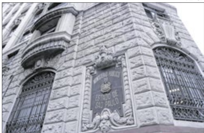
Obras foram vistas em caçambas, o que levantou suspeitas