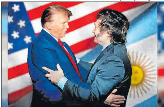
Estratégia de Milei é comparada à de Donald Trump