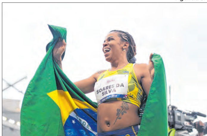
Atleta soma dois ouros e mira Jogos de 2028