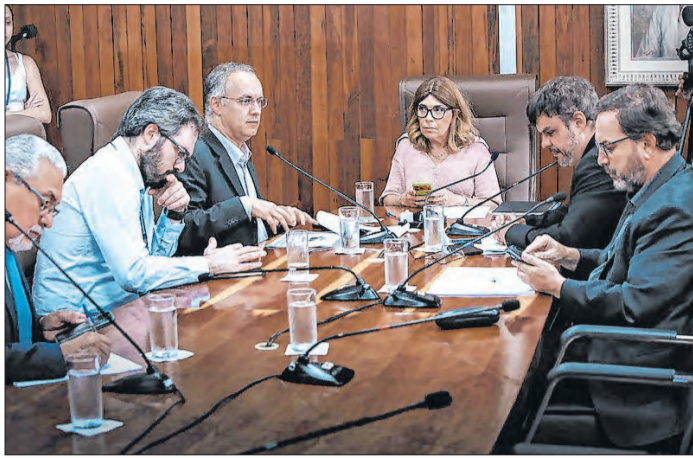
Debate atende a um artigo da Lei Orgânica do Município