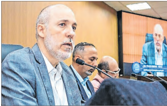
Gaspar se posicionou sobre decisão do Senado