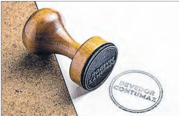
Ilustração / Receita Federal

Contribuintes com dívidas milionárias no radar da RF