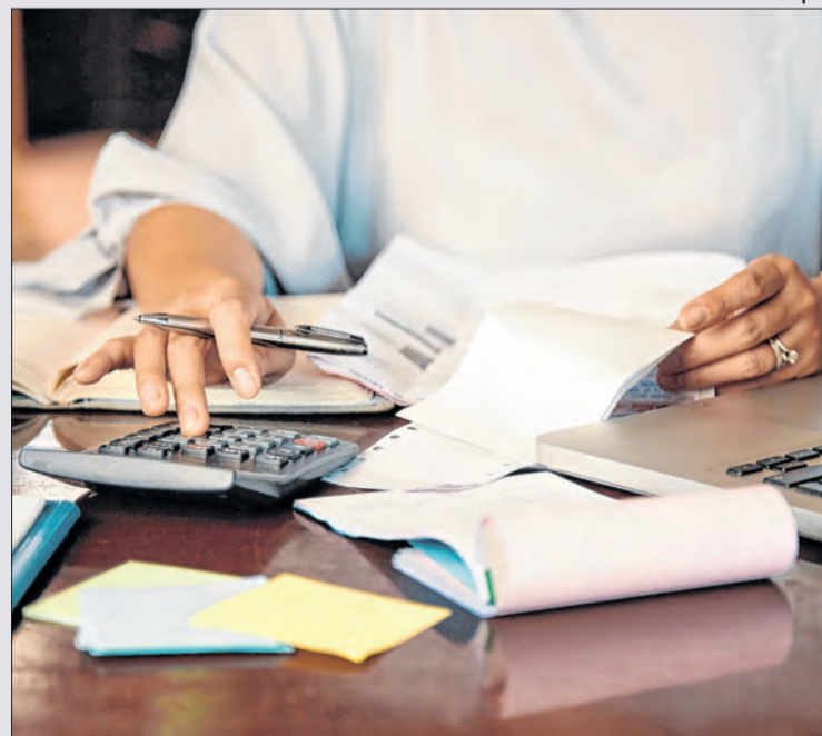
Empresas e governos ajustam sistemas ao novo modelo