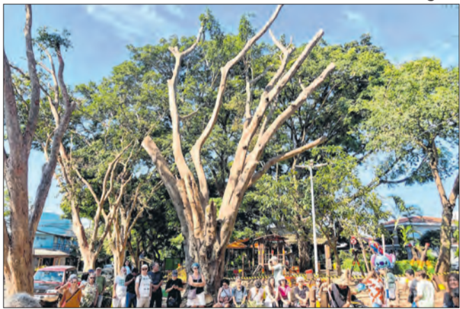
Funcionário da Prefeitura defende corte das árvores