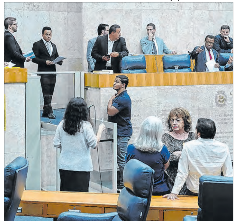
CPI vai investigar inadimplentes do IPTU, ISS e outros tributos