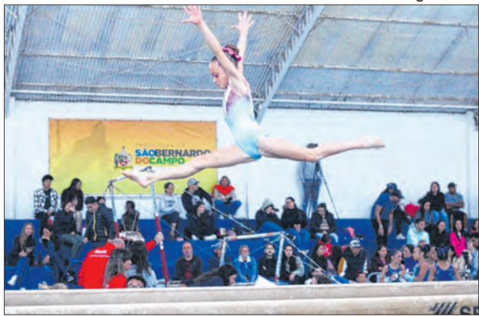
Evento reúne 500 jovens ginastas de todo o estado