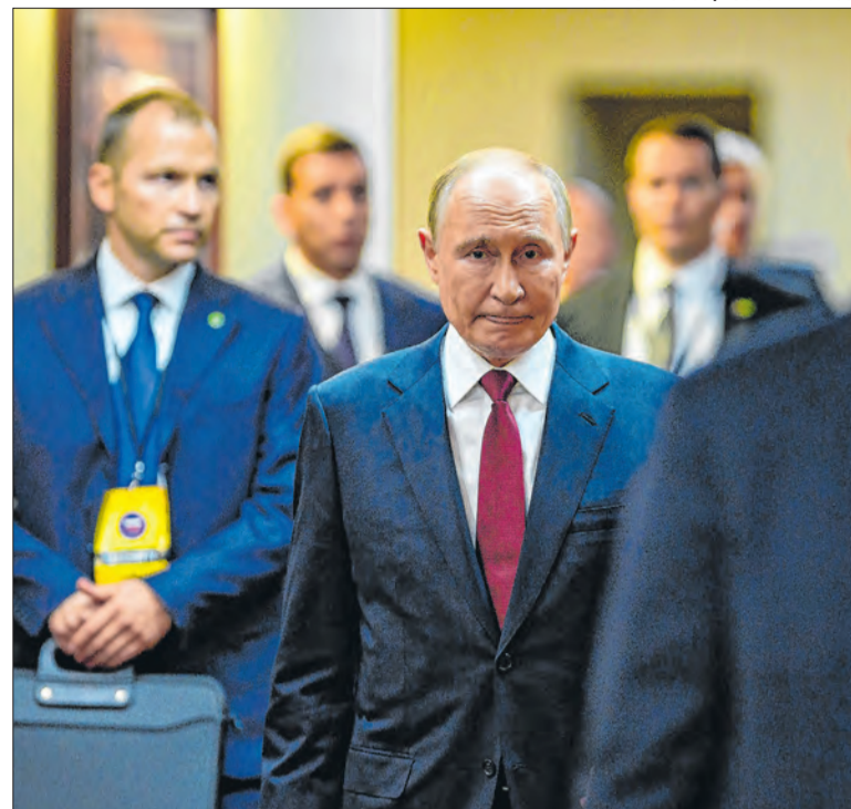
Ataques russos contra a Ucrânia tiveram mais de 6 mil drones

Após nova disparada dos preços do petróleo e o aumento do risco de interrupções prolongadas no fornecimento mundial da commodity, os EUA tentam novamente formar uma coalizão internacional com o objetivo de reabrir o estreito de Hormuz, uma das principais rotas de energia do mundo.