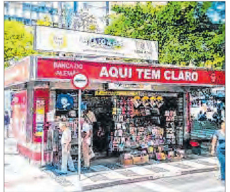
Banca do Alemão, uma das mais tradicionais do Centro

A decisão de priorizar a história dos Pracinhas em detrimento a homenagens inócuas atende ao anseio de seriedade na gestão da memória pública. É imperativo que o reconhecimento de feitos históricos de tamanha magnitude prevaleça e seja transmitido às futuras gerações campinenses