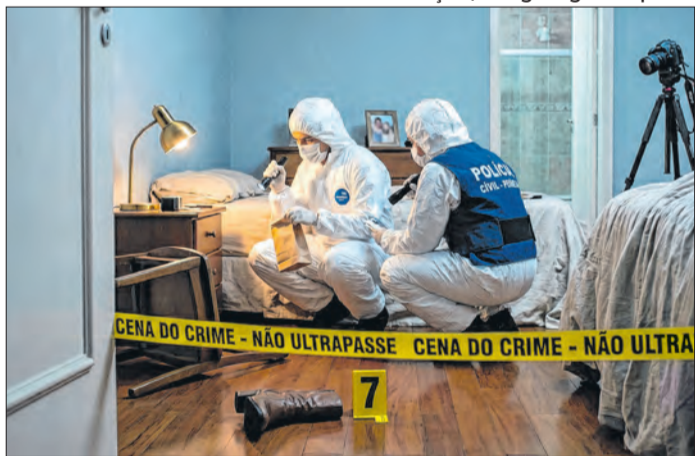
Ilustração / Imagem gerada por IA

Caso de feminicídio ocorreu em ambiente doméstico