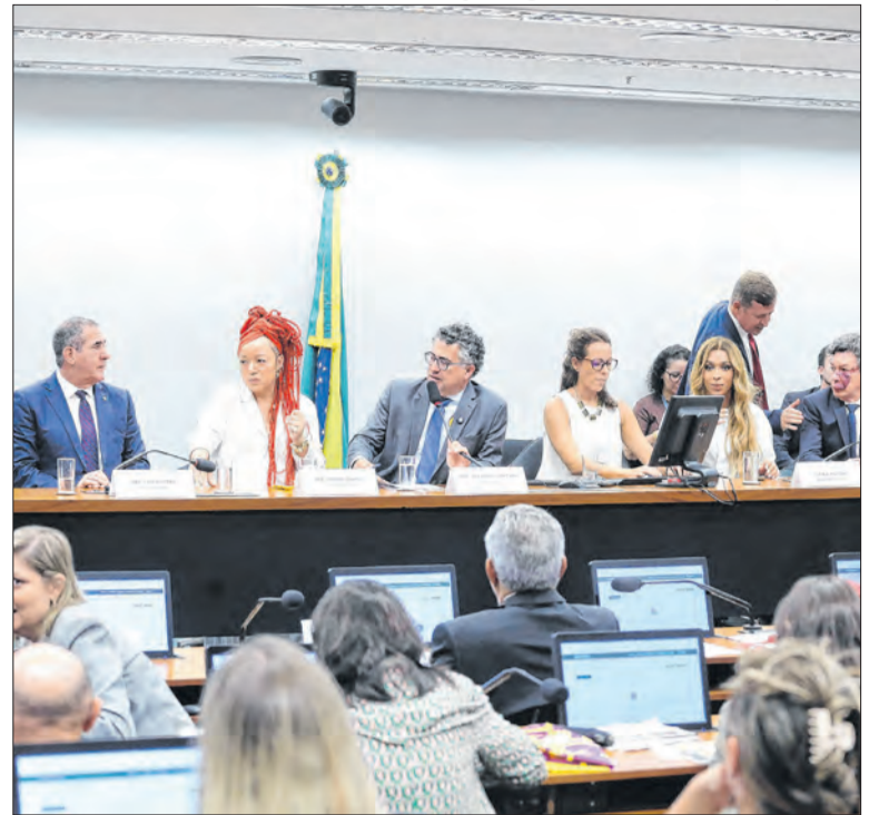
Comissão do fim da 6x1 apresentará seu plano de trabalho