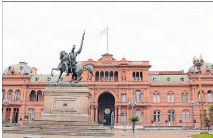
Gestão Milei levou a Argentina a queda drástica no índice