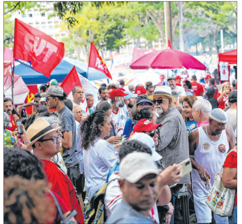
Manifestação em Brasília no Primeiro de Maio

“O STF, acuado, vai bancar?”, pergunta. Para ele, se derubar o projeto, a corte dará ao Congresso o discurso de necessidade de eleição de senadores capazes de decretar impeachment de ministros. Se não bancar, garante a ajuda a Bolsonaro e dá aos parlamentares o discurso de vitória sobre o STF.