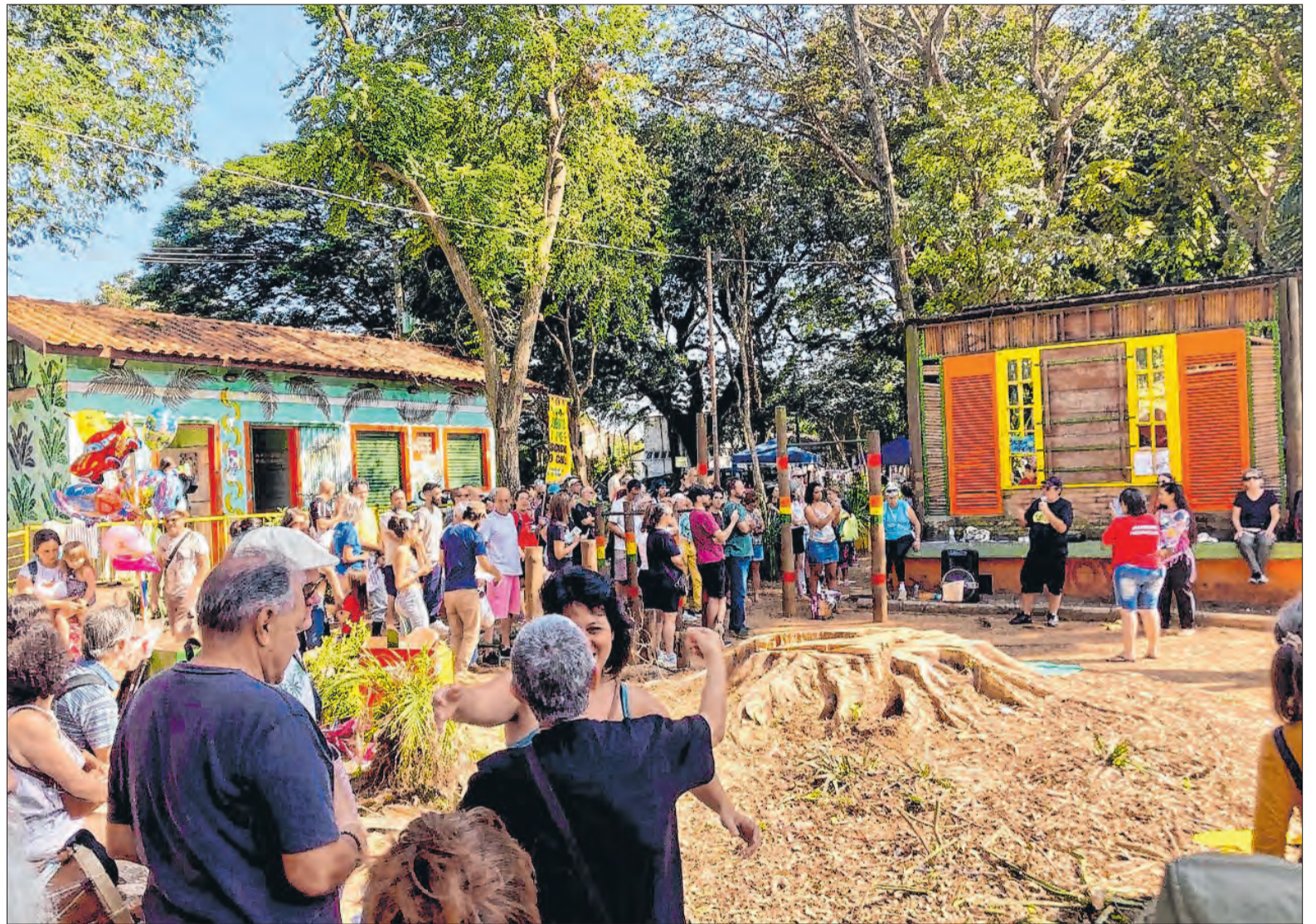
Manifestantes reunidos em volta do que restou de uma das árvores extraídas pela Prefeitura na última semana