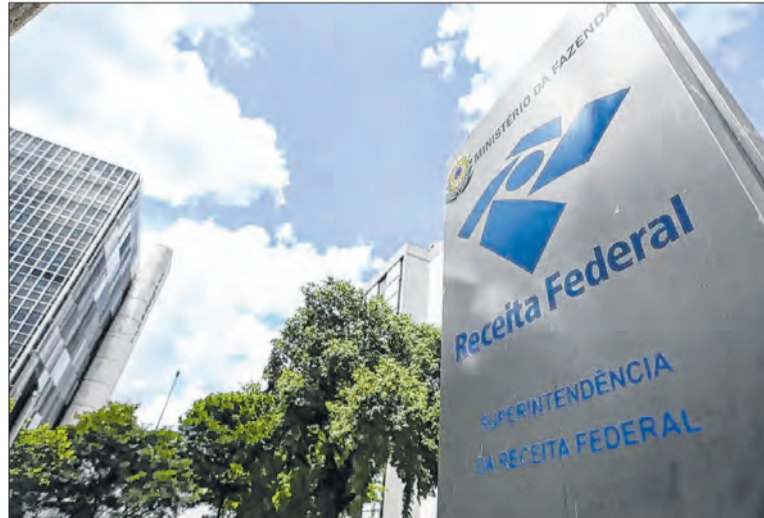
Receitas do governo federal somaram R$ 777,1 bi no 1º trimestre

A arrecadação é acompanhada de perto pelo mercado financeiro por servir como termômetro da atividade econômica e por influenciar o cumprimento das metas fis-