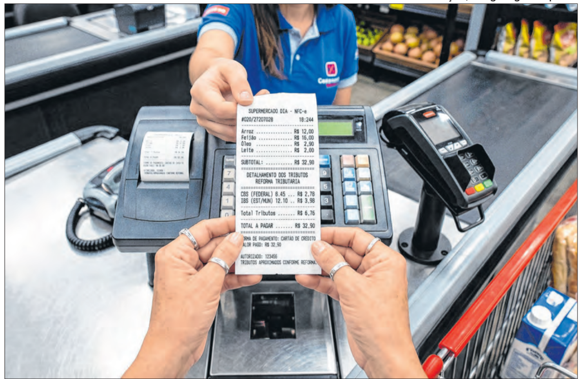
Para 2026 está prevista fase de testes com alíquotas simbólicas e adaptação de sistemas.

As empresas terão de adaptar sistemas de emissão de nota fiscal, programas de contabilidade, cadastros de produtos, formas de calcular tributos e envio de dados ao poder público. Softwares usados no dia a dia precisarão ser atualizados para incluir os novos impostos e suas regras. Grandes companhias e pequenos negócios deverão rever