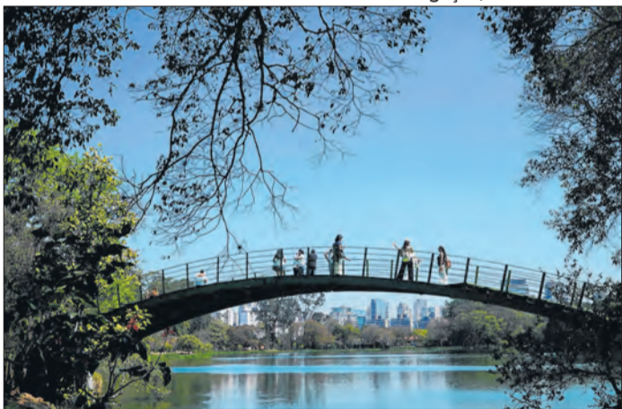
Parque Ibirapuera, na Zona Sul da capital paulista