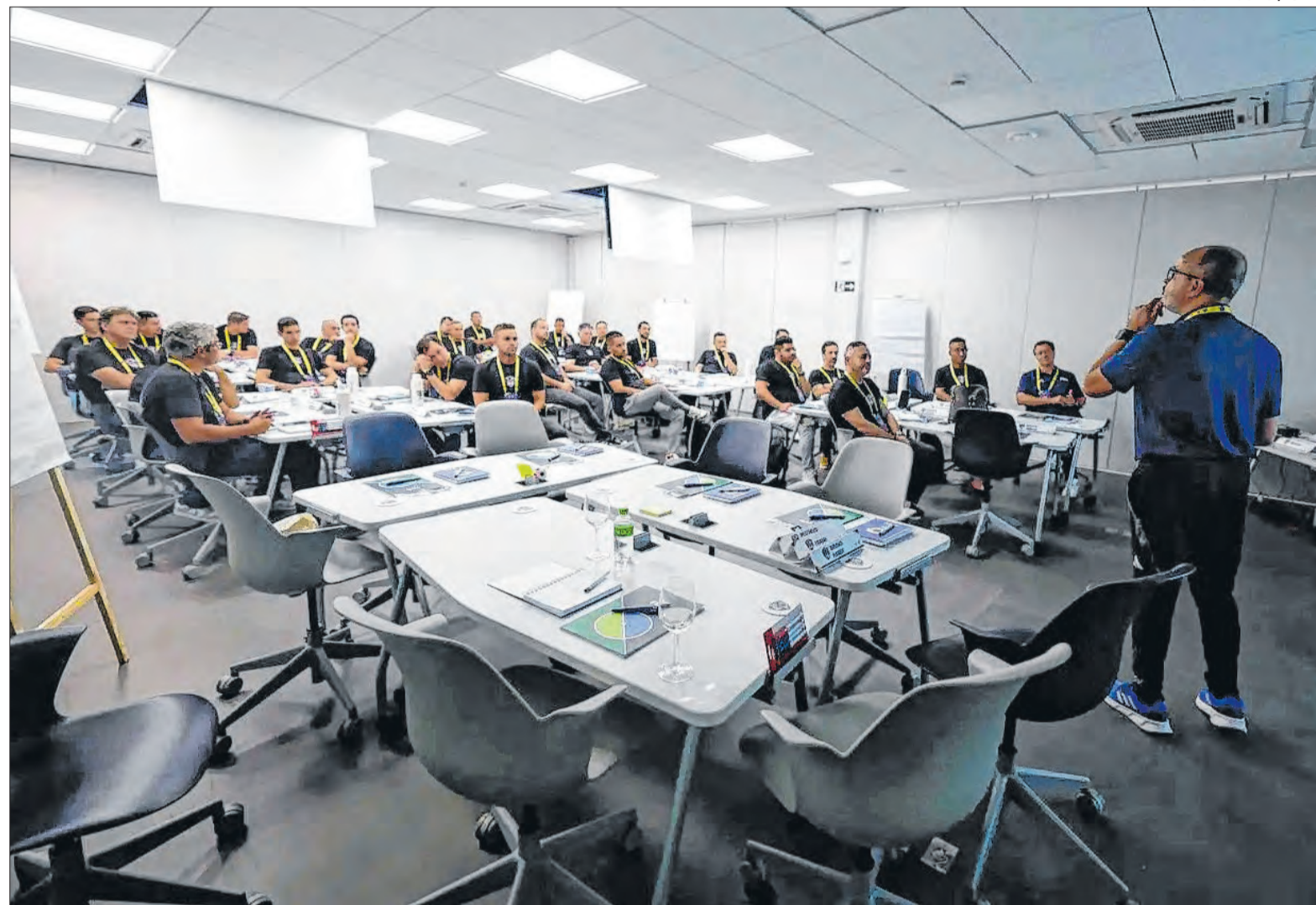
Evento realizado na Granja Comary teve como pauta o desenvolvimento das categorias de base do futebol brasileiro

“Por trás de um grande profissional, há uma grande figura