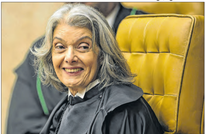
Cármén Lúcia: a mais bem avaliada