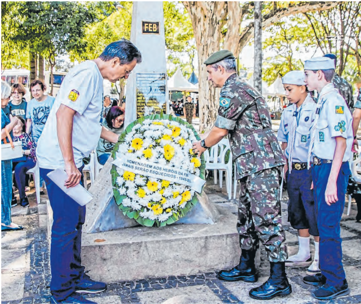
Semana é promovida pela Associação dos Expedicionários Campineiros (AExpCamp)