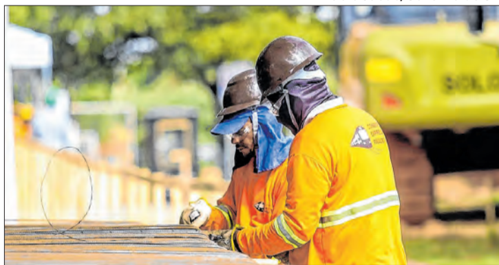
Projeto prevê aumento e amplia diferença frente ao federal