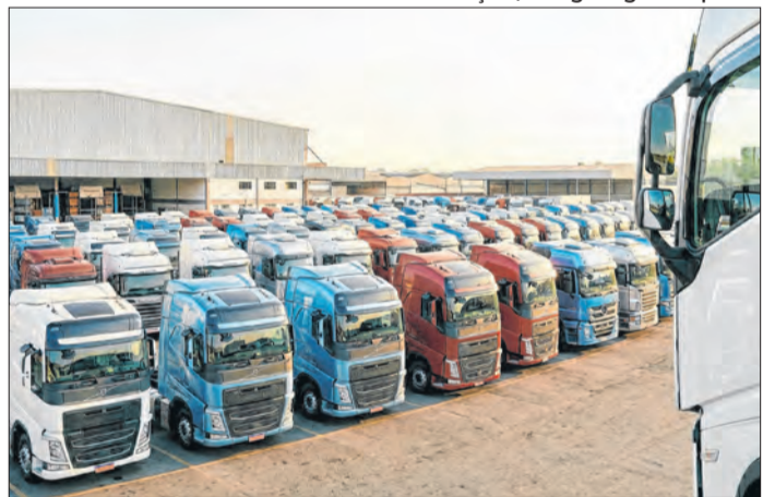
Ilustração / Imagem gerada por IA

Medida busca renovar a frota de ônibus e caminhões