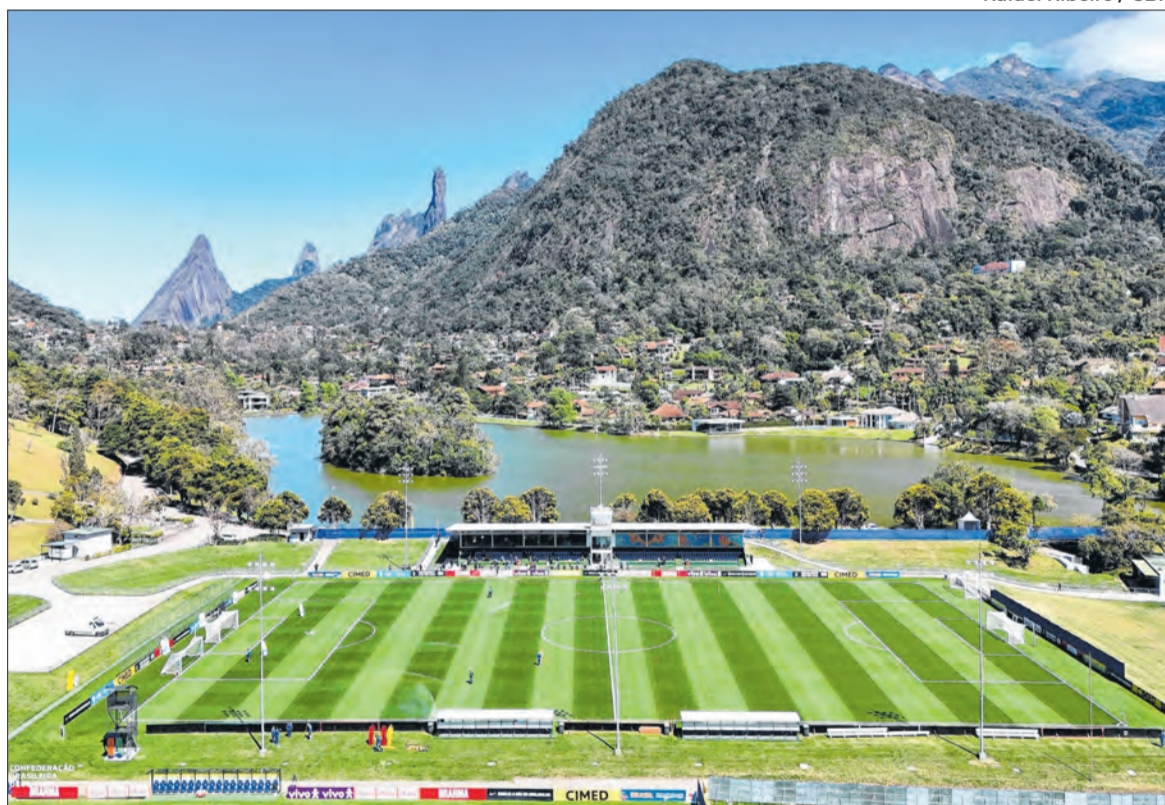
Centro de Treinamento da Seleção, a Granja Comary foi palco do workshop da FIFA com a CBF

A coordenação do evento ficou a cargo de Cícero Souza,