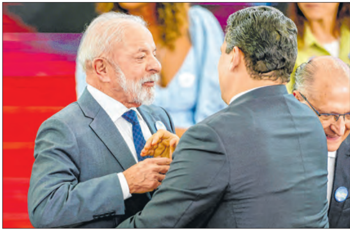
Lula e Alcolumbre: "camadas de constrangimento"