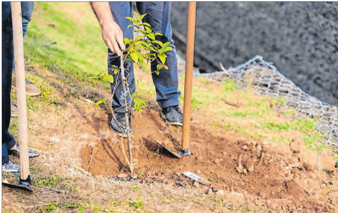
Prefeitura de Vinhedo

Como contrapartida pelo volume de material processado,