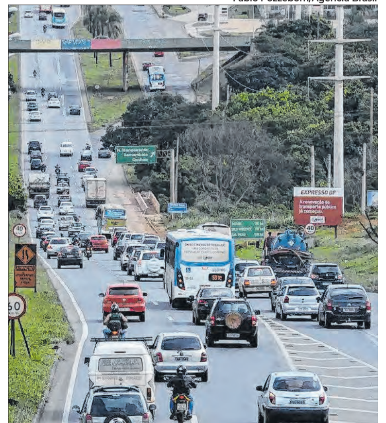
Comparação foi feita com o mesmo período do ano passado

Os dados reforçam uma tendência de redução dos crimes patrimoniais no estado, segundo a secretaria, com expectativa de manutenção dos índices ao longo do ano, a partir da continuidade das ações integradas e do uso de tecnologia no monitoramento.