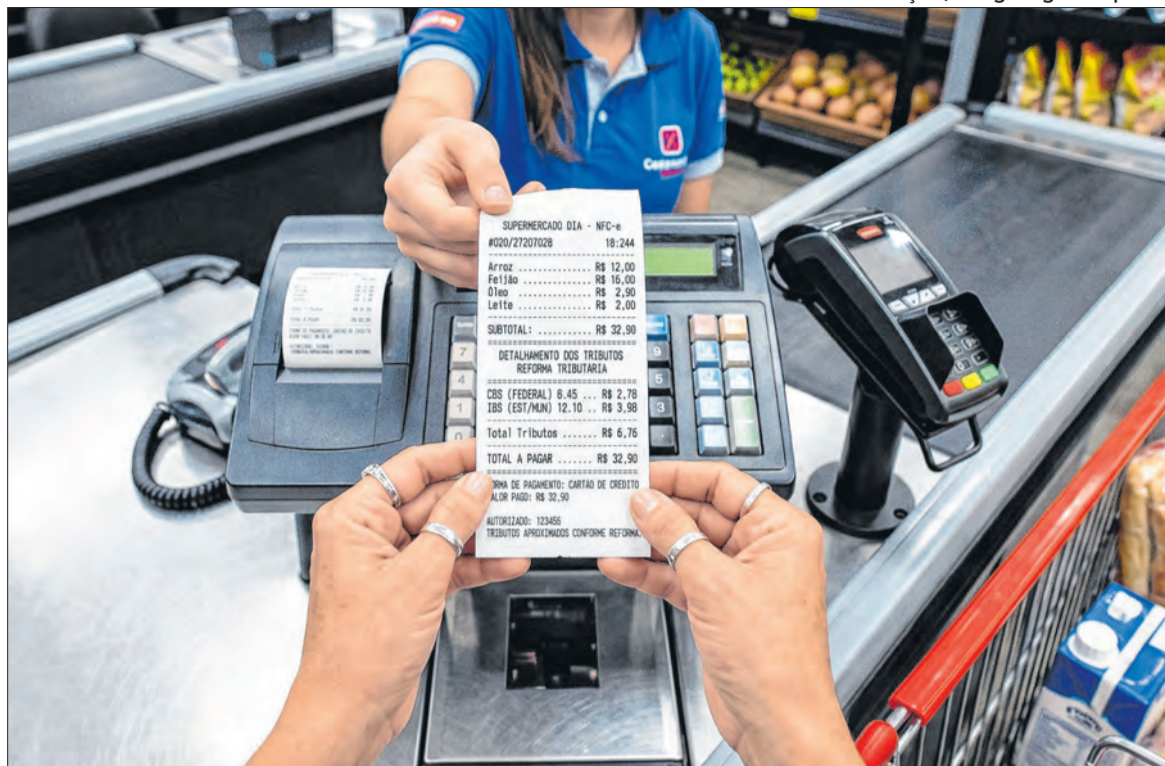
Para 2026 está prevista fase de testes com alíquotas simbólicas e adaptação de sistemas.

As empresas terão de adaptar sistemas de emissão de nota fiscal, programas de contabilidade, cadastros de produtos, formas de calcular tributos e envio de dados ao poder público. Softwares usados no dia a dia precisarão ser atualizados para incluir os novos impostos e suas regras. Grandes companhias e pequenos negócios deverão rever