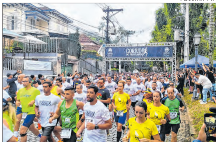
Tradicional corrida do Dia do Trabalhador nesta sexta (01)