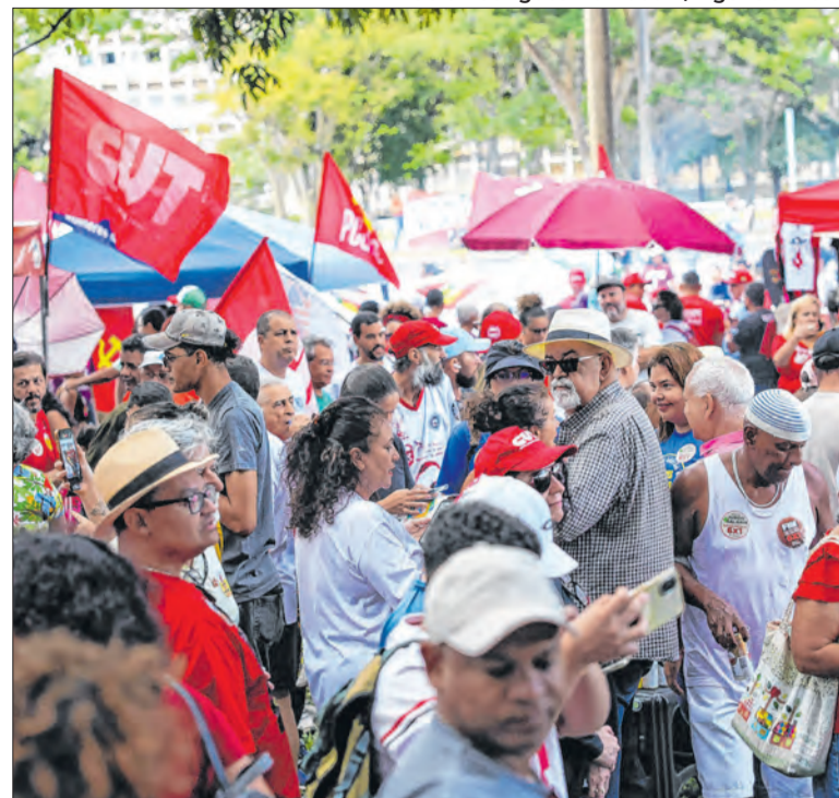
Manifestação em Brasília no Primeiro de Maio

“O STF, acuado, vai bancar?”, pergunta. Para ele, se derubar o projeto, a corte dará ao Congresso o discurso de necessidade de eleição de senadores capazes de decretar impeachment de ministros. Se não bancar, garante a ajuda a Bolsonaro e dá aos parlamentares o discurso de vitória sobre o STF.