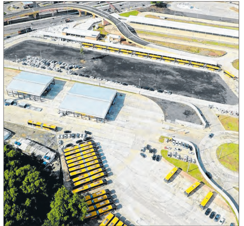
Novas dez linhas de ônibus estão fazendo parada no terminal