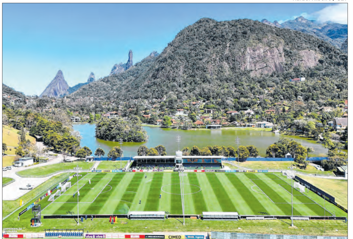
Centro de Treinamento da Seleção, a Granja Comary foi palco do workshop da FIFA com a CBF

A coordenação do evento ficou a cargo de Cícero Souza,