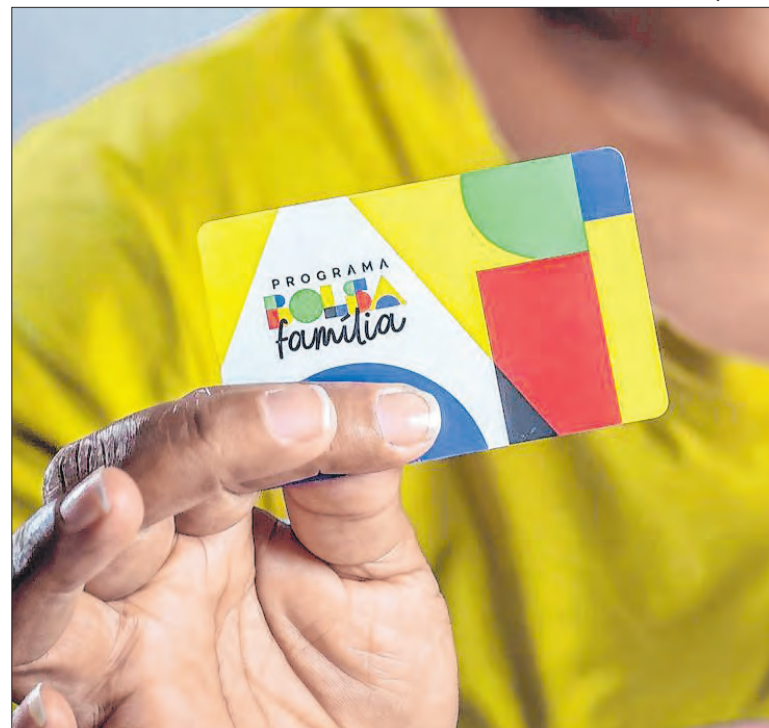
Cerca de 17,5 mil famílias do município recebem o Bolsa Família