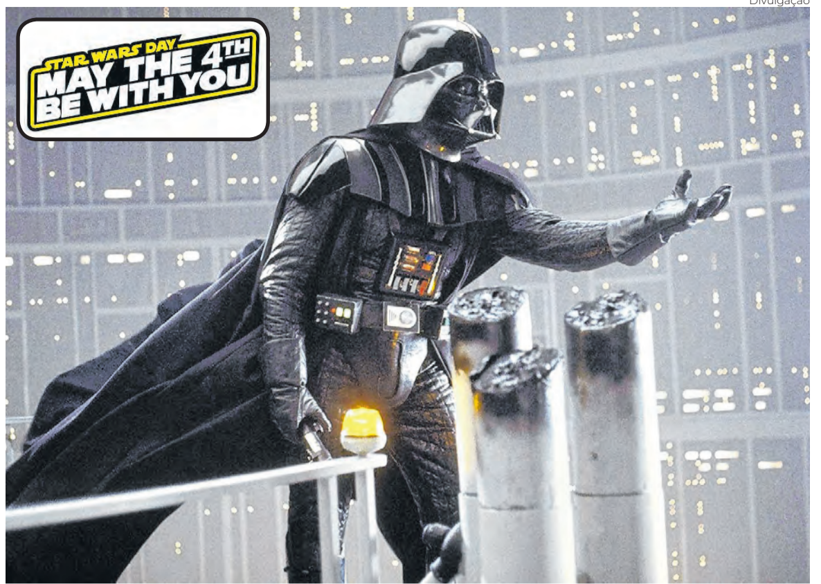
O malvado Darth Vader em cena de 'O Império Contra-Ataca', de 1980

Mercado se inunda de colecionáveis baseados na saga estelar de George Lucas, nos festejos do 'Dia Star Wars', com filme novo, série com Wagner Moura e muitos quadrinhos dos Jedi