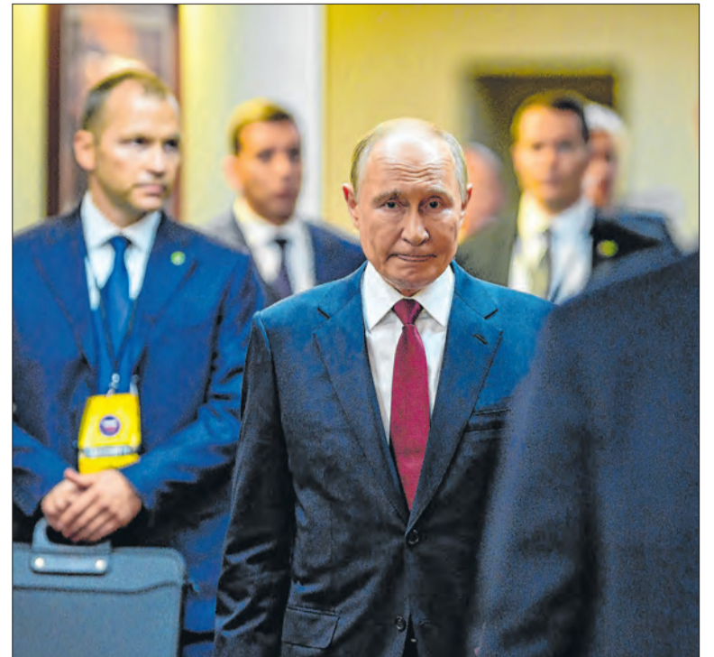
Ataques russos contra a Ucrânia tiveram mais de 6 mil drones

Após nova disparada dos preços do petróleo e o aumento do risco de interrupções prolongadas no fornecimento mundial da commodity, os EUA tentam novamente formar uma coalizão internacional com o objetivo de reabrir o estreito de Hormuz, uma das principais rotas de energia do mundo.