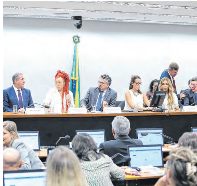
Comissão do fim da 6x1 apresentará seu plano de trabalho