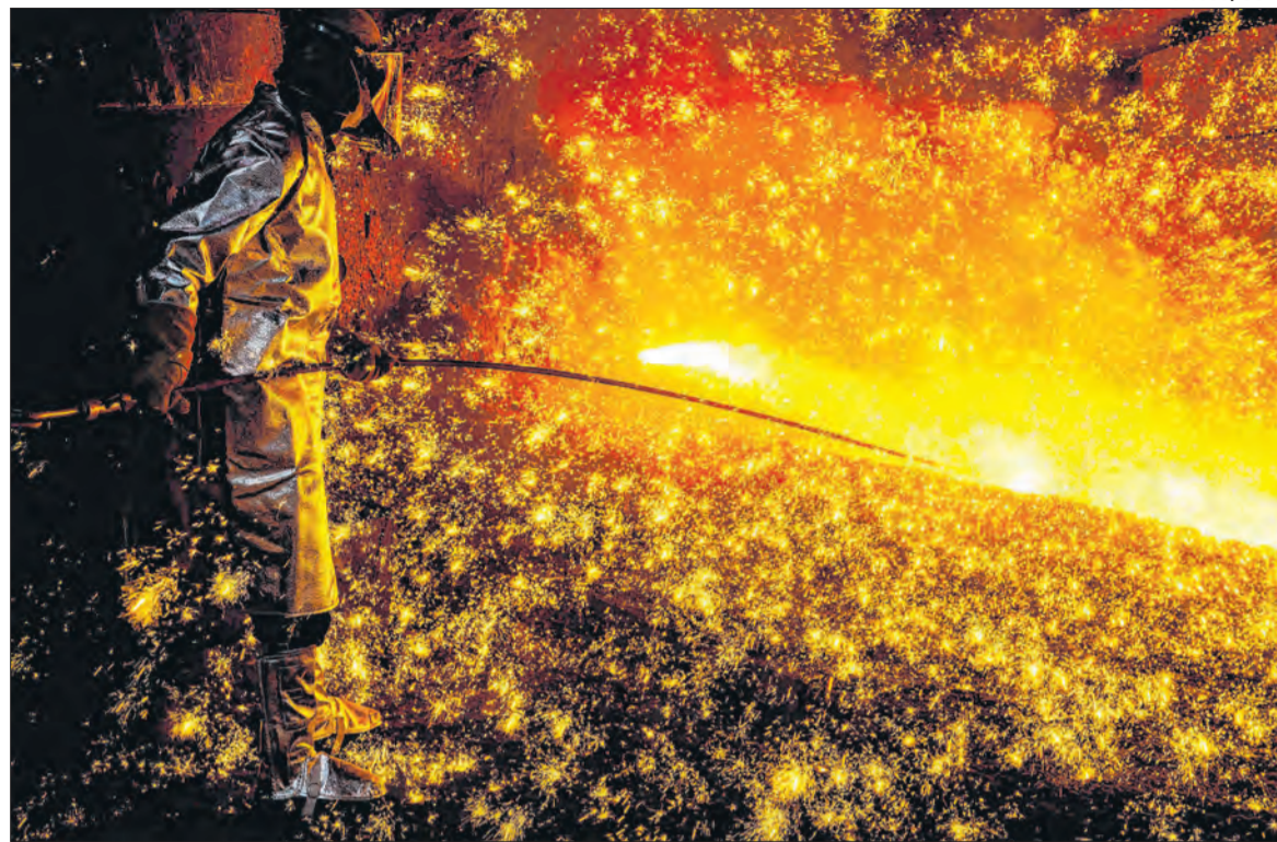
Usina Presidente Vargas onde a CSN concentra o coração de sua produção siderúrgica

Os resultados de 2025 mostram que a companhia já iniciou um ajuste na estratégia comer-