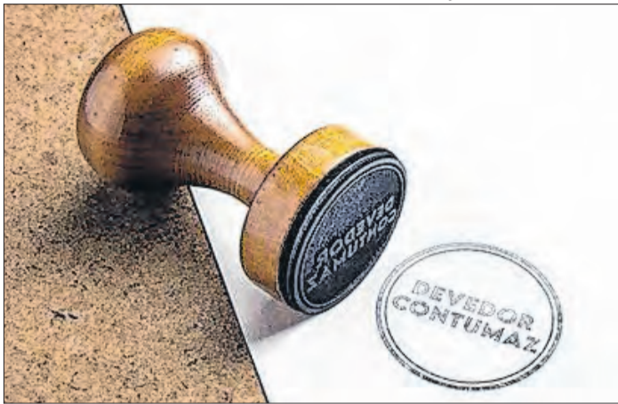
Ilustração / Receita Federal

Contribuintes com dívidas milionárias no radar da RF