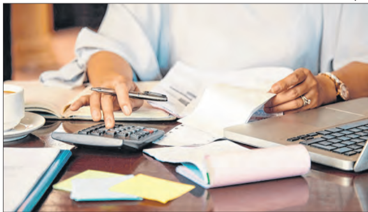
Empresas e governos ajustam sistemas ao novo modelo