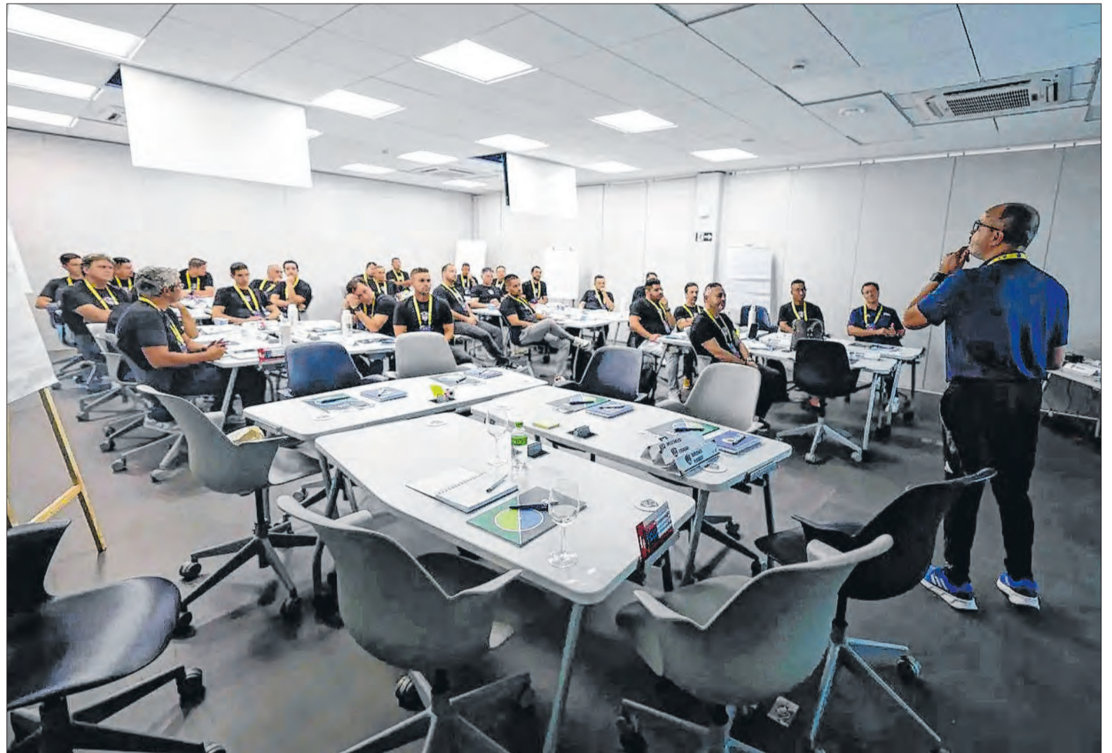
Evento realizado na Granja Comary teve como pauta o desenvolvimento das categorias de base do futebol brasileiro

“Por trás de um grande profissional, há uma grande figura