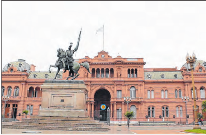
Gestão Milei levou a Argentina a queda drástica no índice