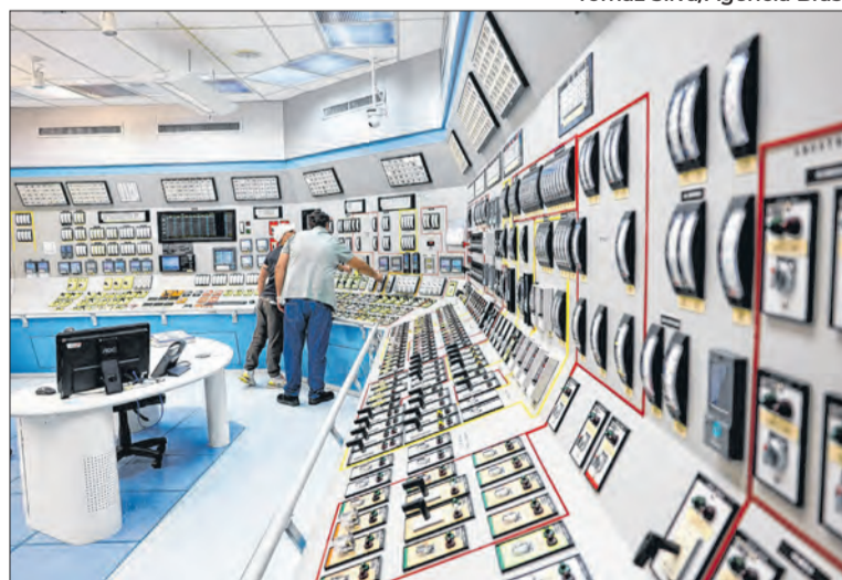
Eletronuclear opera usinas nucleares de Angra dos Reis

A sequência de mudanças na presidência da Eletronuclear evidenciou uma crise interna que vai além de disputas administrativas e atinge o coração do setor nuclear brasileiro. Em meio a pressões políticas, questionamentos