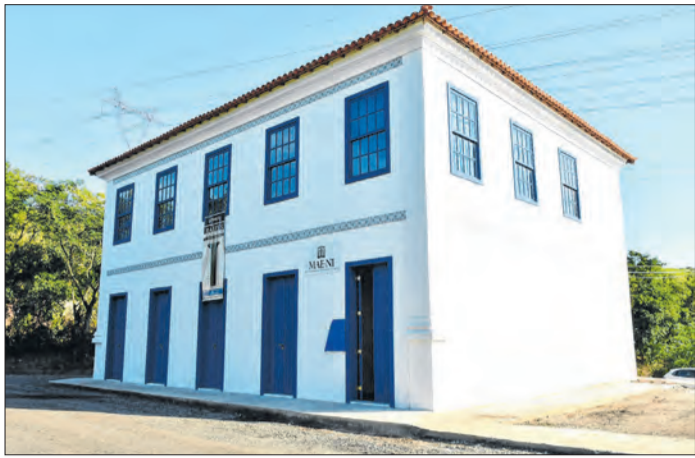
Museu está instalado em um parque arqueológico