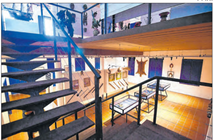
Espaço mistura a tradição com uma estrutura moderna