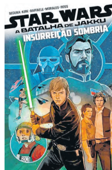
Em meio à celebração do 4 de Maio, o Dia de Guerra nas Estrelas, tem gibi, bonequinho, caneca, pantufa, camiseta e até pipoqueira temática

Quando passou pelo Festival de Cannes de 2012, para a exibição de "Esquadrão Red Tails" (do qual foi produtor), George Walton Lucas Jr. anunciou sua aposentadoria do