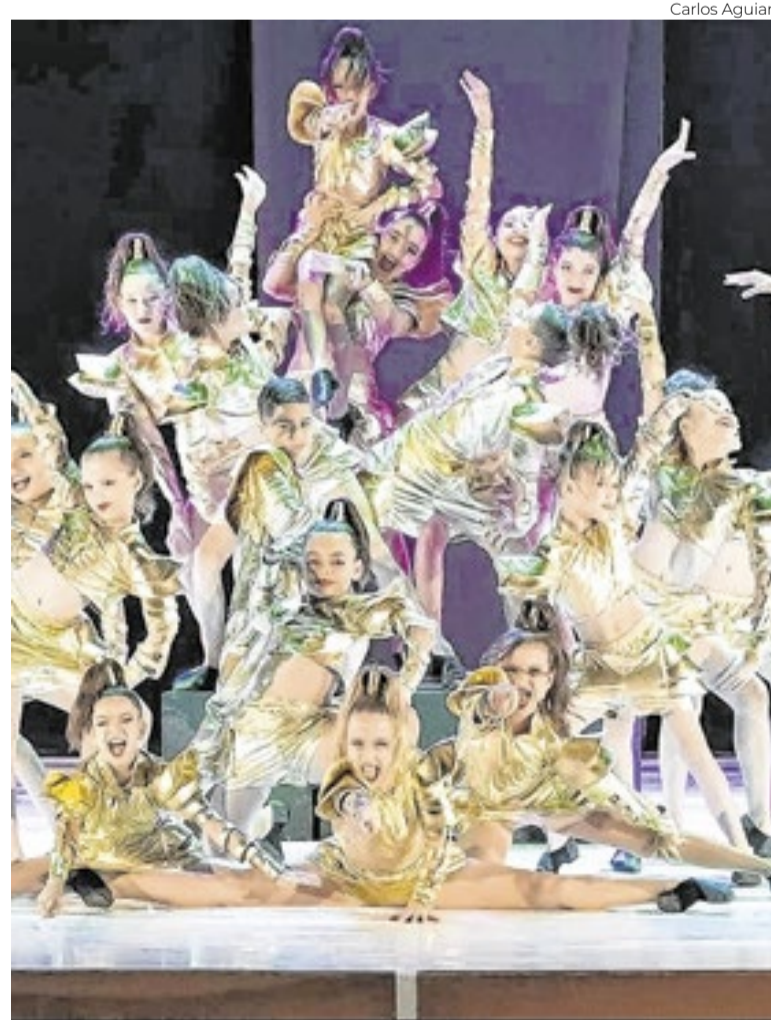
Festival consolida-se na cena da dança brasiliense

“O Festival vem abrindo portas para os fazedores da dança no Distrito Federal. Por muito tempo, Brasília estava carente no que diz respeito a festivais de dança e eventos do gênero. Esse evento gerou grande movimentação cultural, possibilitando novas experiências”.