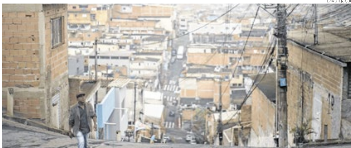
‘Vou-me Embora’ é um retrato das migrações numa grande metrópole

fotografia de Alziro Barbosa, concorreu na seção Novos Diretores do Festival de San Sebastián, na Espanha, em 2012.