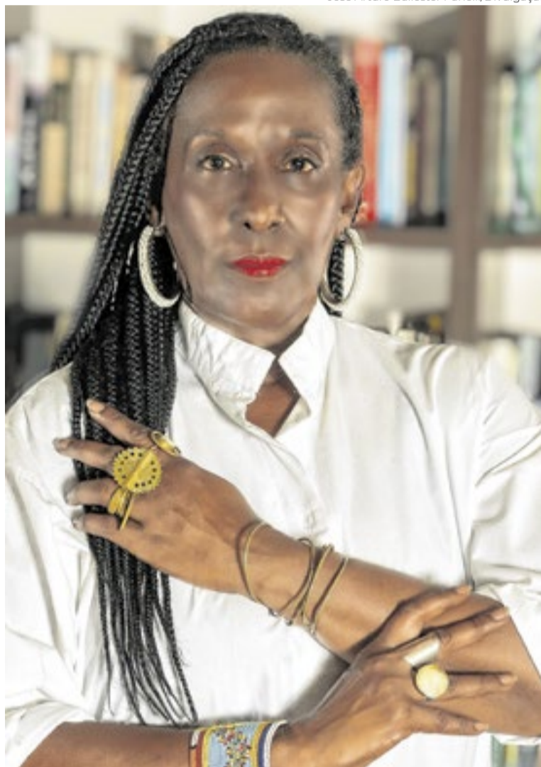
Mayra Santos-Febres é uma das vozes mais decisivas da literatura caribenha contemporânea