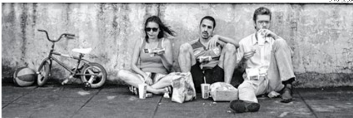
O belíssimo ‘Cores’ levou o Brasil à competição Novos Diretores de San Sebastián

Cinema da Praça Roosevelt, em São Paulo, promove maratona de curtas e longas nacionais que não tiveram, em circuito, um espaço à altura de suas ousadias e de suas investigações