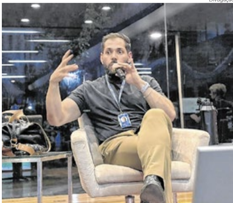
Distrito Drag e UDF oferecem atendimento psicológico gratuito

culo, em duas sessões especiais entre 30 de abril e 6 de maio, celebrando os 20 anos da série literária que marcou uma geração. Lançado em 2009, o longa acompanha Bella Swan após a partida de Edward Cullen e sua aproximação com Jacob Black, ampliando os conflitos entre vampiros e lobisomens. A programação inclui ainda a estreia do documentário Manguêbit, sobre o movimento manguêbeat, e a permanência de filmes como Suspiria, Cinco Tipos de Medo e Super Mario Galaxy: O Filme, além de sessões gratuitas do BIFF 2026.