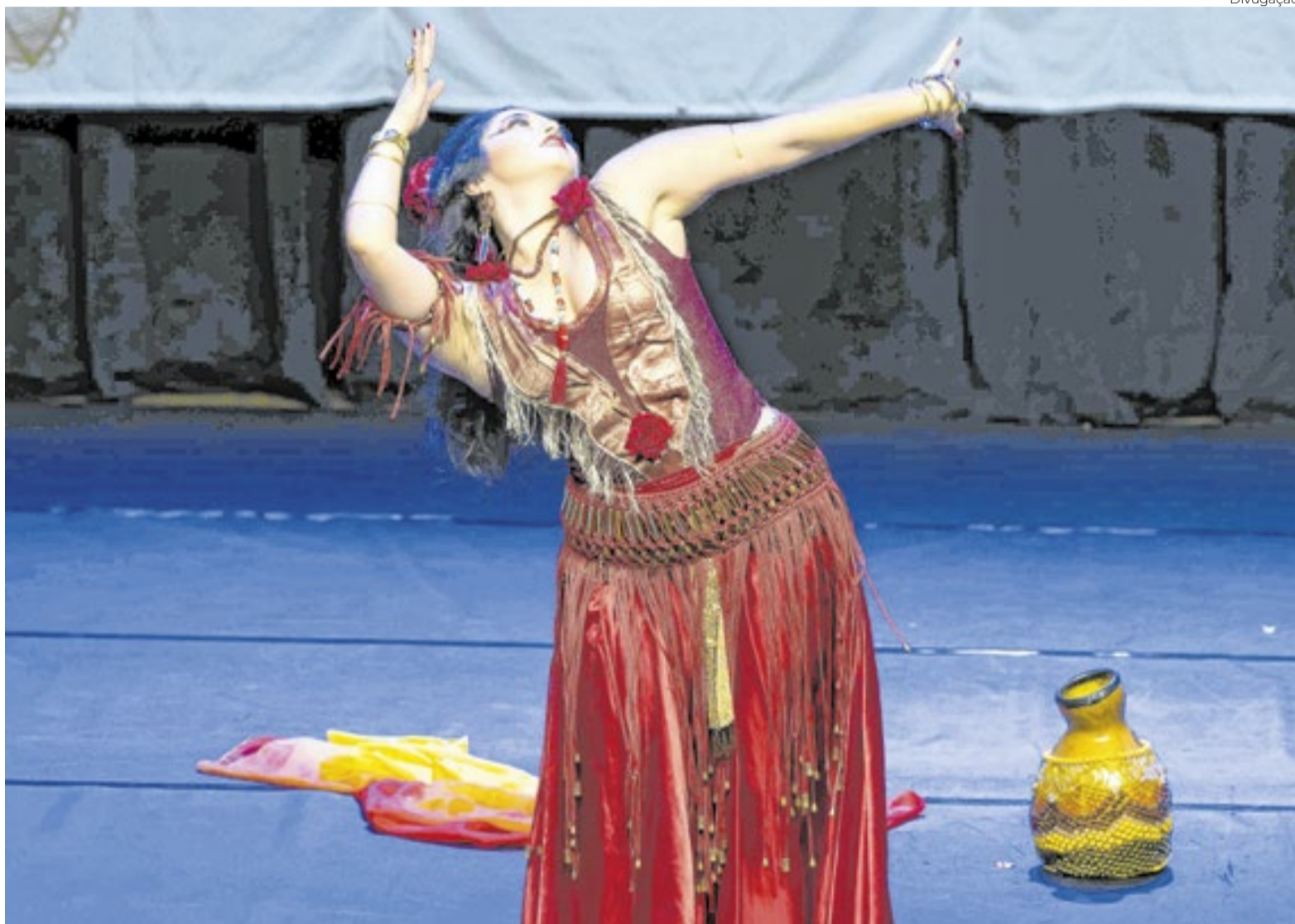
Projeto Cultural é destaque em Brasília

✳O Cine Brasília recebe o relançamento de "Lua Nova", segundo filme da saga Crepúsculo, em duas sessões especiais