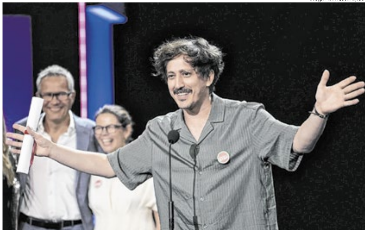
O diretor Simón Mesa com o diploma do prêmio Horizontes Latinos em San Sebastián

Vencedor da mostra Horizontes Latinos de San Sebastián e premiado em Cannes, ‘Um Poeta’ leva para as plataformas nacionais de streaming a força do cinema produzido na Colômbia