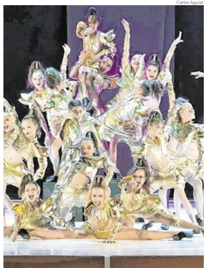
Festival consolida-se na cena da dança brasiliense

“O Festival vem abrindo portas para os fazedores da dança no Distrito Federal. Por muito tempo, Brasília estava carente no que diz respeito a festivais de dança e eventos do gênero. Esse evento gerou grande movimentação cultural, possibilitando novas experiências”.