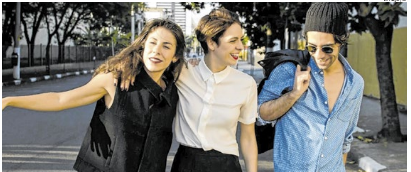
‘Amores Urbanos’ é um poema sobre afetos em SP