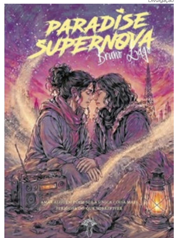
Paradise Supernova está disponível em versão impressa e digital

A obra já se encontra em circulação nos canais de venda indicados, integrando as listas de lançamentos de ficção brasileira do primeiro semestre de 2026. O autor não confirmou até o momento se haverá uma continuação para o universo de “Paradise Supernova” ou se seu próximo projeto seguirá a mesma linha temática das obras anteriores que mesclam a ficção científica com a natureza humana.