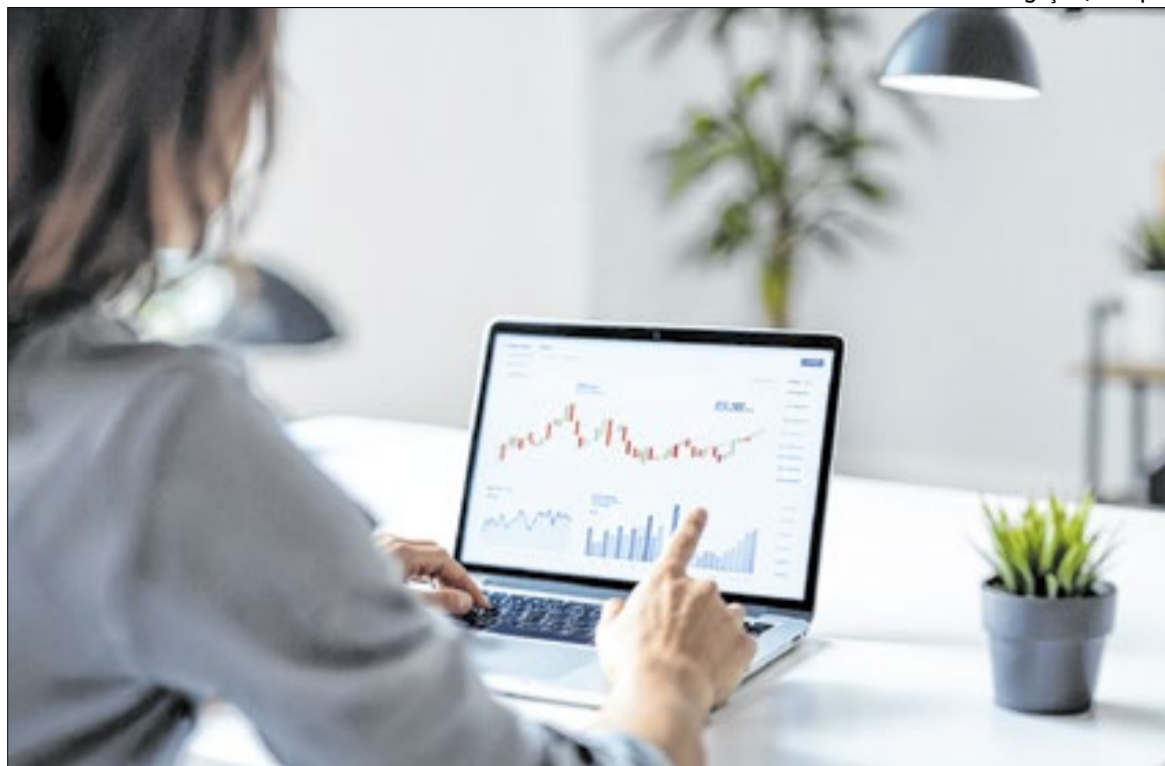
Em 2025, 6% dos brasileiros investiram em ações e fundos imobiliários alcançaram 3%

A principal barreira continua sendo a renda. Em 2025, 82% dos que não conseguem poupar apontam dificuldades financeiras como motivo, aumento em relação a 2021, quando esse índice era de 75%. O dado reforça a influência das condições econômicas sobre o comportamento financeiro. Entre aqueles que conseguem economizar, o padrão de comportamento também apresenta mudanças ao longo do tempo. Cortar gastos com lazer segue como principal estratégia, citado por 44% dos entrevistados, em linha com anos anteriores. Já o hábito de guardar parte do salário cresceu de 11% em 2021 para 20% em 2025, mostrando maior presença de planejamento financeiro.