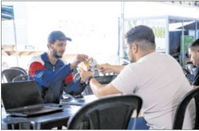
Mutirão reúne empregos, serviços jurídicos e de saúde