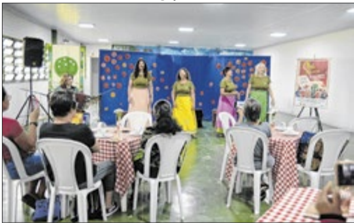
Atividade gratuita é voltada à terceira idade