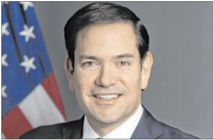
Marco Rubio acredita em um avanço por um acordo