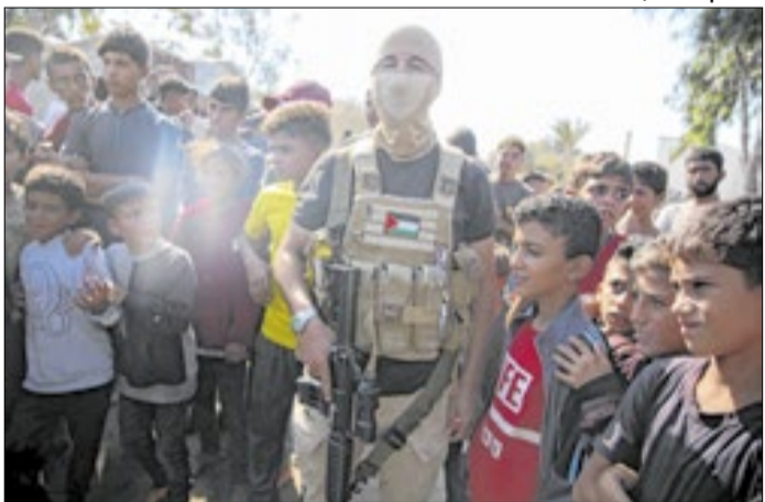
Acordo só acontecerá se houver desarmamento do Hamas