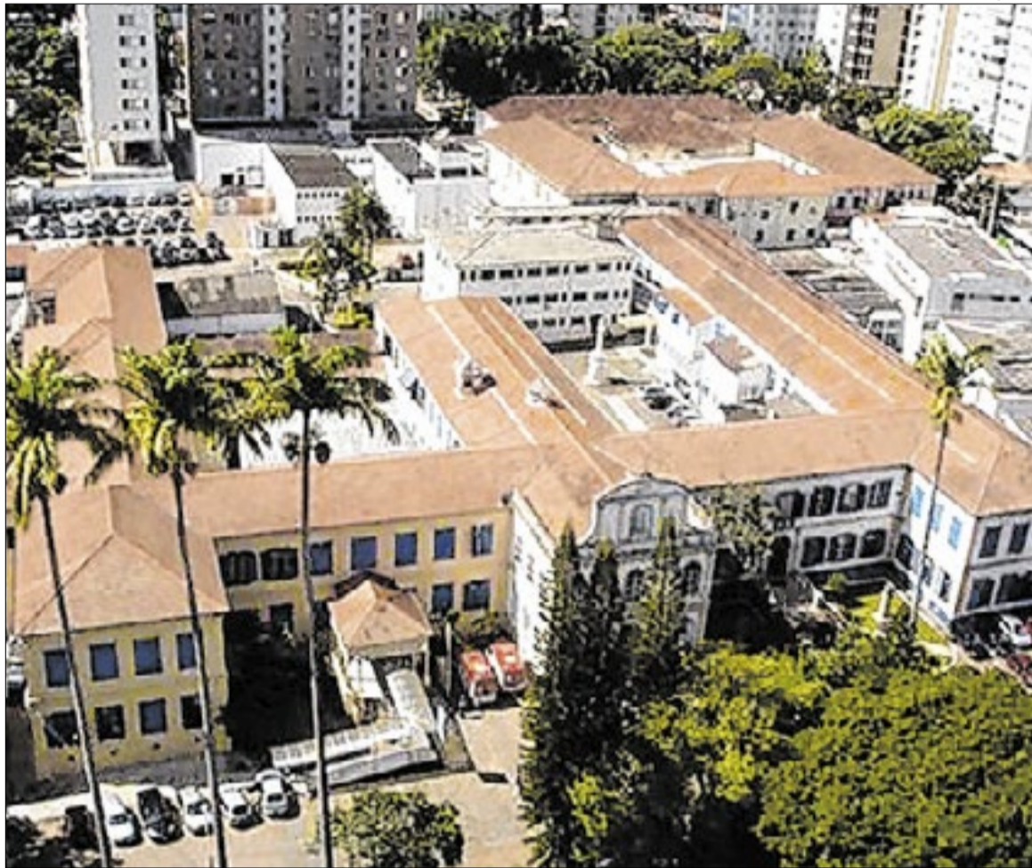
Irmandade de Misericórdia de Campinas

Para integrantes do grupo Santa Causa, que integra uma das chapas na disputa e que foi quem entrou com a ação no Judiciário,