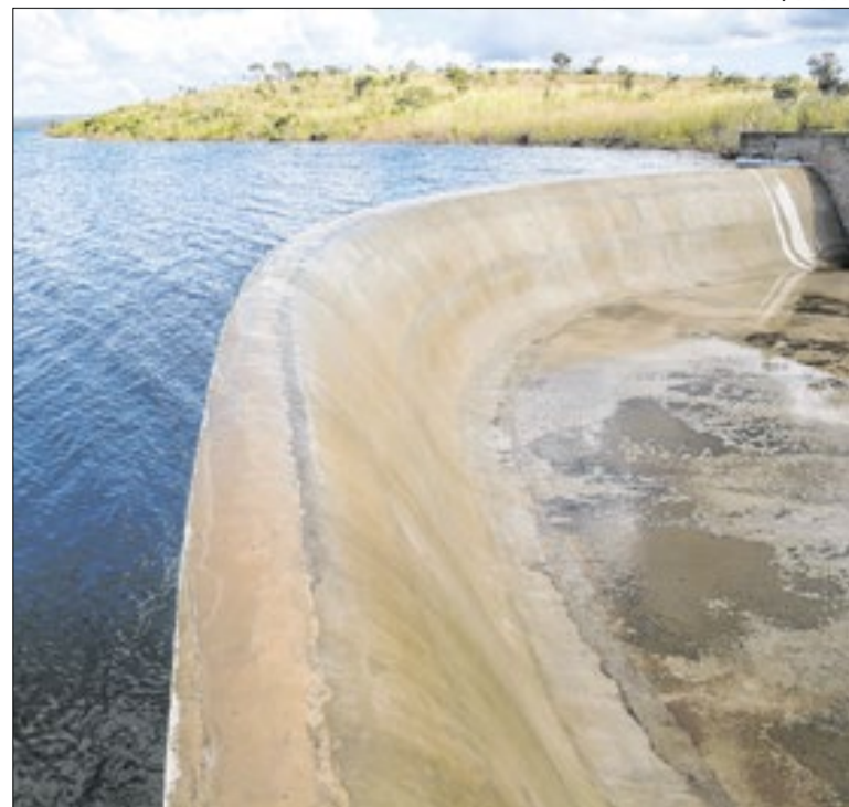
Após quatro anos, barragem volta a transbordar

O estudo destaca que o problema não é o tamanho da folha, mas a rigidez do gasto.