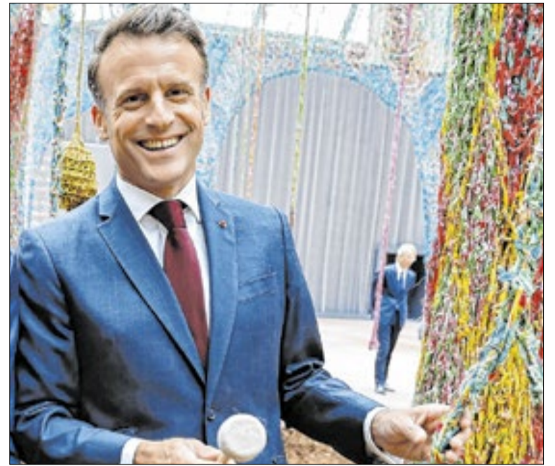
Macron prestou "total apoio" ao presidente Donald Trump

Dois tornados atingiram o norte do Texas (EUA) e deixaram pelo menos duas pessoas mortas, seis feridas e dezenas de famílias desalojadas. Tempestades severas atingiram os condados de Wise e Parker no sábado. O fenômeno deixou um rastro de destruição e forçou a saída de ao menos 20 famílias de suas casas.