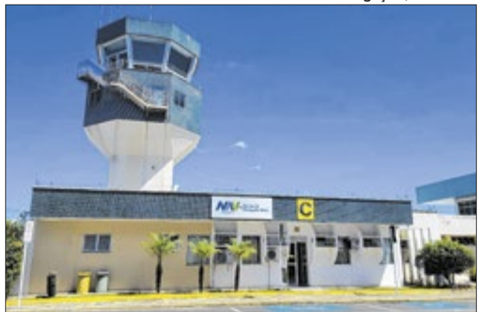
Empresa é vinculada ao Ministério de Portos e Aeroportos.