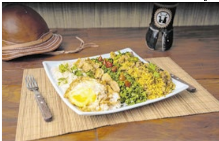
Cada estabelecimento irá representar um país diferente

Podem participar restaurantes, cafeterias, sorveterias, pizzarias, hamburguerias, lanchonetes e outros estabelecimentos do segmento de alimentação fora do lar. As inscrições seguem abertas até 10 de maio e o festival será realizado de 1º a 31 de julho. Durante o período, os participantes irão oferecer, em seus próprios espaços, pratos exclusivos de-