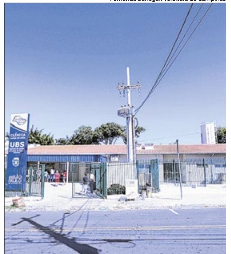
CS São José foi fechado no final da manhã desta segunda (27)

O Centro de Saúde Acylyno de Souza Santos - São José, fica na Avenida José Carlos do Amaral Galvão, 184 - Jardim São José.