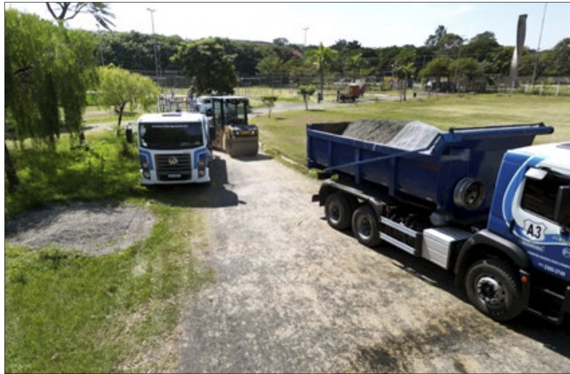
Asfalto é aplicado na pista de caminhada do Parque Linear do Capivari, na Lagoa do Mingone

Do ponto de vista ambiental, especialistas alertam que o asfalto