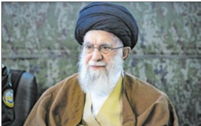
Ali Khamenei foi morto pelos ataques dos EUA e de Israel