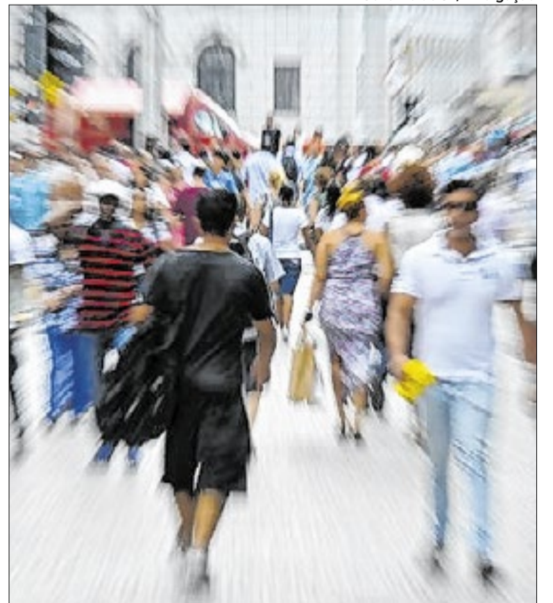
População feminina é 51% do total do estado, e masculina é 49%

Em 2025, São Paulo soma 46,077 milhões de habitantes e concentra 22% da população brasileira. O maior grupo etário é o de pessoas com 60 anos ou mais, com 8,074 milhões, seguido pelas faixas de 40 a 49 anos, com 7,276 milhões, e de 30 a 39 anos, com 7,237 milhões. As mulheres são maioria no estado, com 51% dos moradores, ante 49% de homens no total.