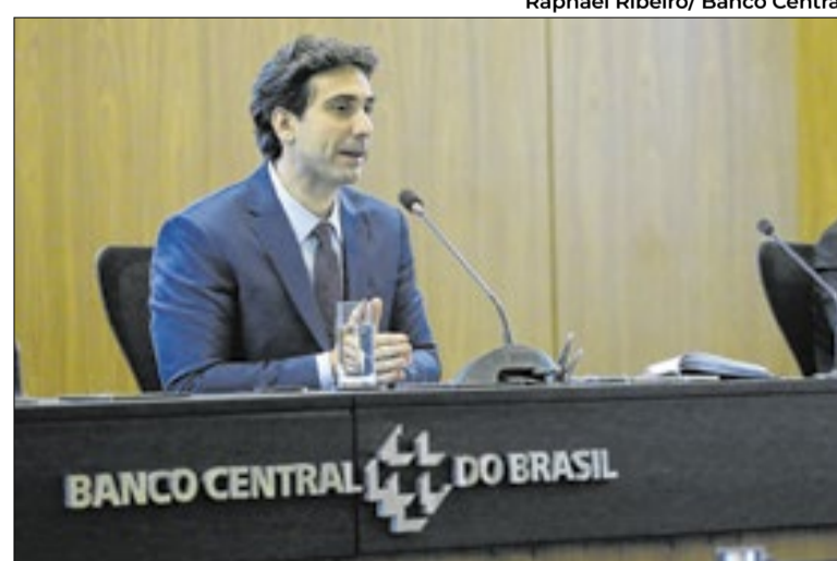
Dados foram divulgados pelo Presidente do BC, Gabriel Galípulo

Outro fator de pressão foi a conta de renda primária, que inclui remessas de lucros, dividendos e juros ao exterior. O déficit chegou a