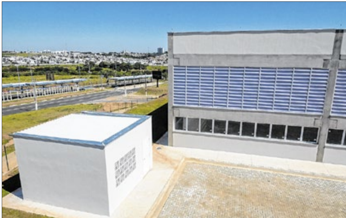
Anexos seguem padrão com foco em sustentabilidade, tecnologia e modernidade

O espaço destinado à equipe operacional possui 600 metros quadrados de área construída e 495 metros quadrados de estacionamento. A estrutura receberá 26 servidores, incluindo agentes de trânsito e equipes responsáveis pela implantação de sinalização vertical, horizontal e semafórica.