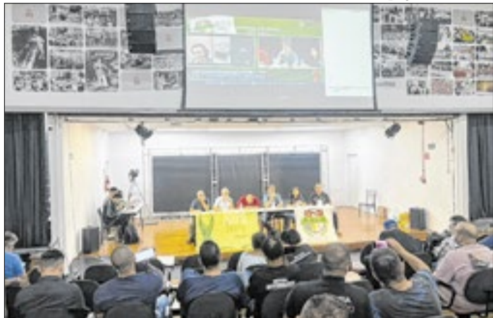
Fundação Casa tem cerca de 10 mil servidores em SP