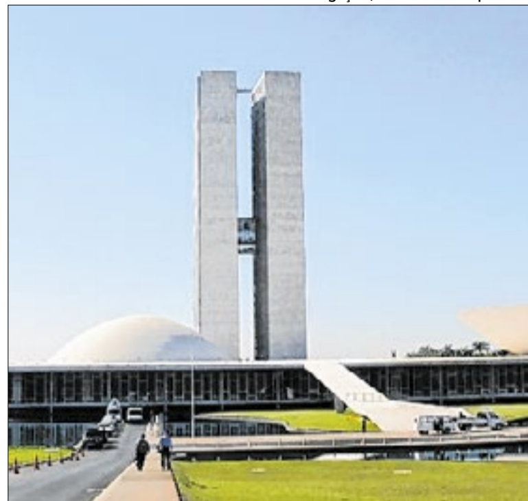
Negociação coletiva no serviço público tem Pedido de Urgência

Os acordos firmados em 2024 previram reajuste em duas parcelas: 9% em janeiro de 2025 e 5% em abril de 2026, índices aplicados sobre a remuneração total. Além dos reajustes salariais, os acordos também garantiram avanço nos benefícios, com destaque para auxílio-alimentação, que passará para R$ 1.192,00.