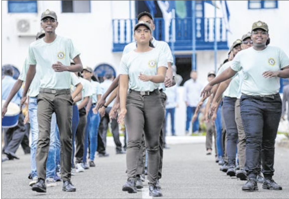
Vagas em programas sociais são para jovens de 6 a 17 anos

Nesta última segunda-feira do mês (27), o Espaço da Oportunidade de Campos está disponibilizando 240 oportunidades de emprego. São vagas de trabalho destinadas a pessoas com 18 anos de idade ou mais, com diferentes níveis de escolaridade, algumas podendo exigir experiência na área para fazer o cadastro. Os interessados possuem várias opções, podendo acessar o site do Espaço da Oportunidade, ou recorrer à unidade da secretaria e aos números de contato.