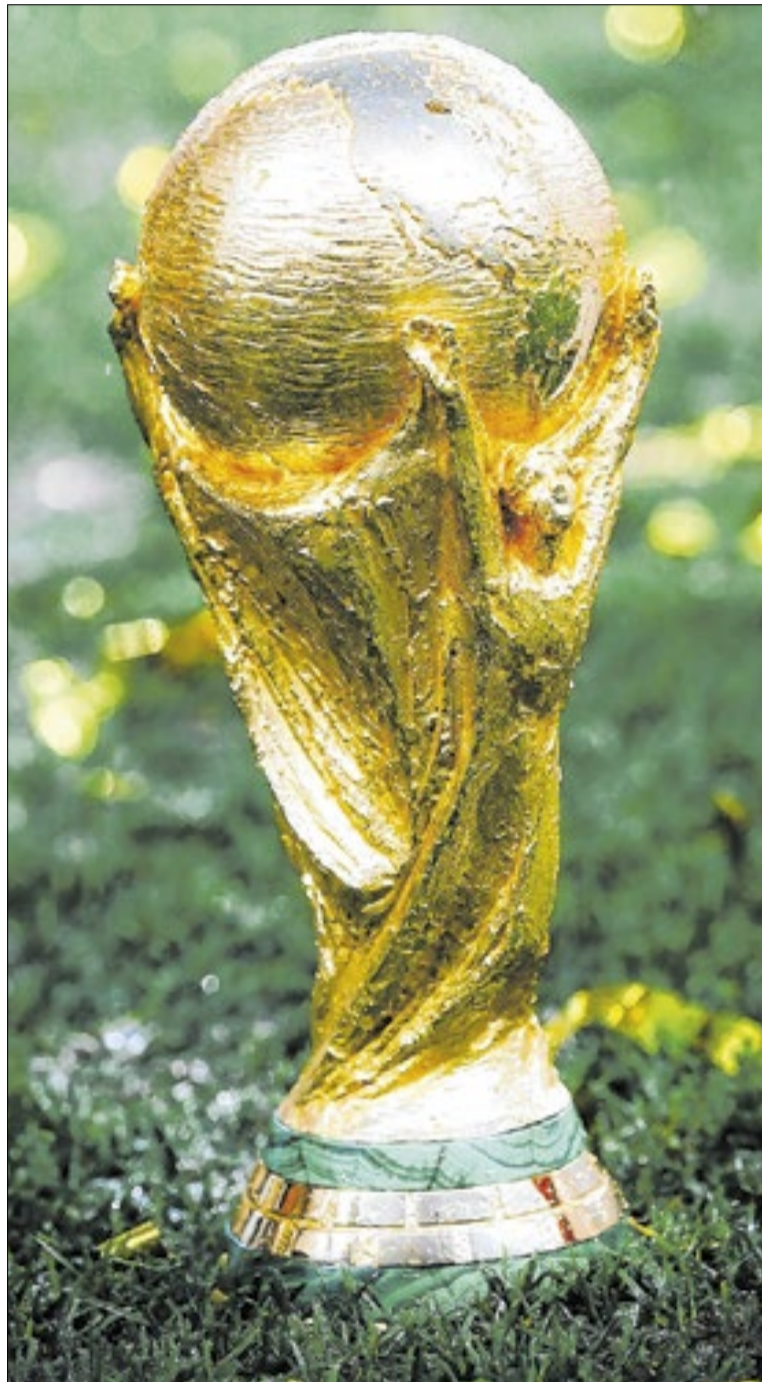
Torcedores que vão para a Copa do Mundo deverão tomar a vacina para prevenção contra o sarampo

Os três países se encontram com surtos ativos de sarampo,