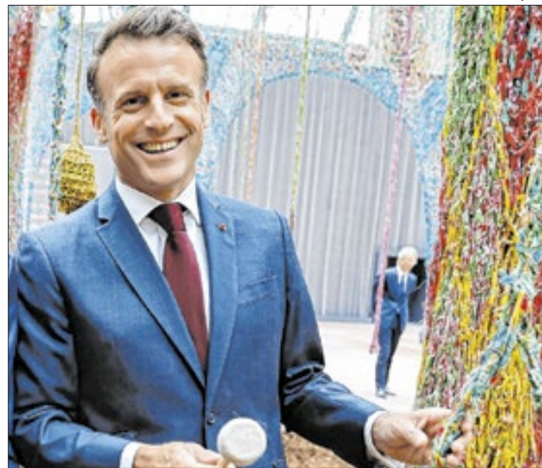
Macron prestou "total apoio" ao presidente Donald Trump

Dois tornados atingiram o norte do Texas (EUA) e deixaram pelo menos duas pessoas mortas, seis feridas e dezenas de famílias desalojadas. Tempestades severas atingiram os condados de Wise e Parker no sábado. O fenômeno deixou um rastro de destruição e forçou a saída de ao menos 20 famílias de suas casas.