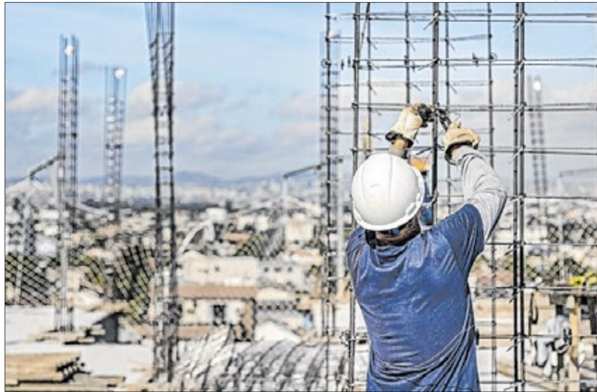
Apesar da alta em abril, taxa está 6,28% em 12 meses, abaixo dos 7,52% registrados em 2025.

No grupo Serviços, a alta passou de 0,24% para 0,97% no período. O avanço foi influenciado pelo item aluguel de máquinas e equipamentos, que saiu de 0,05% para 1,87%. O resultado mostra aumento de custos operacionais nos canteiros de obras, como em ativi-