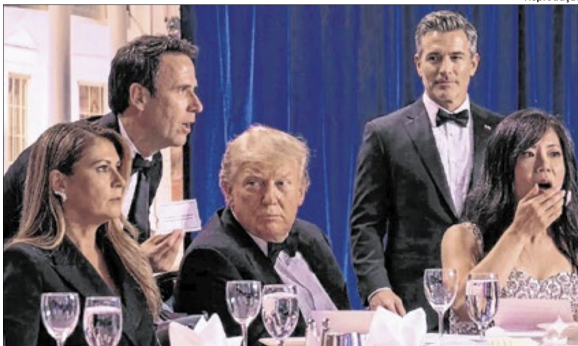
Tiroteio aconteceu enquanto um mágico fazia truques para Melania e Donald Trump

Cole Thomas Allen foi indiciado pela promotoria do caso em três crimes