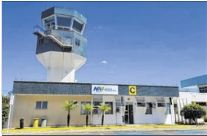
Empresa é vinculada ao Ministério de Portos e Aeroportos.