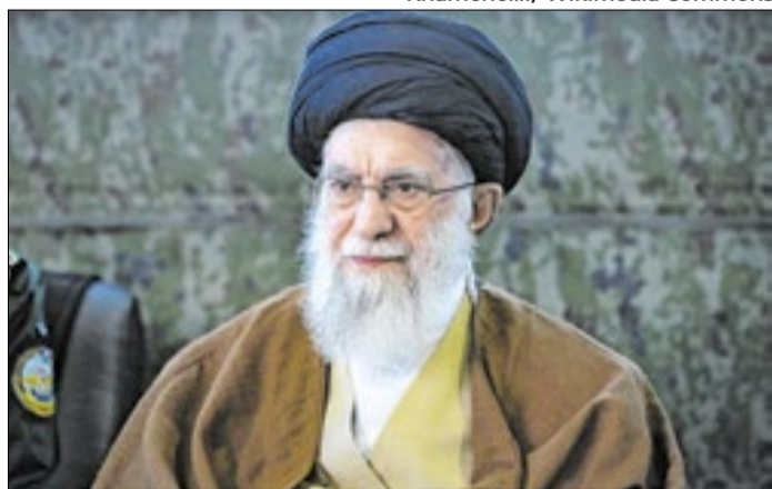
Ali Khamenei foi morto pelos ataques dos EUA e de Israel