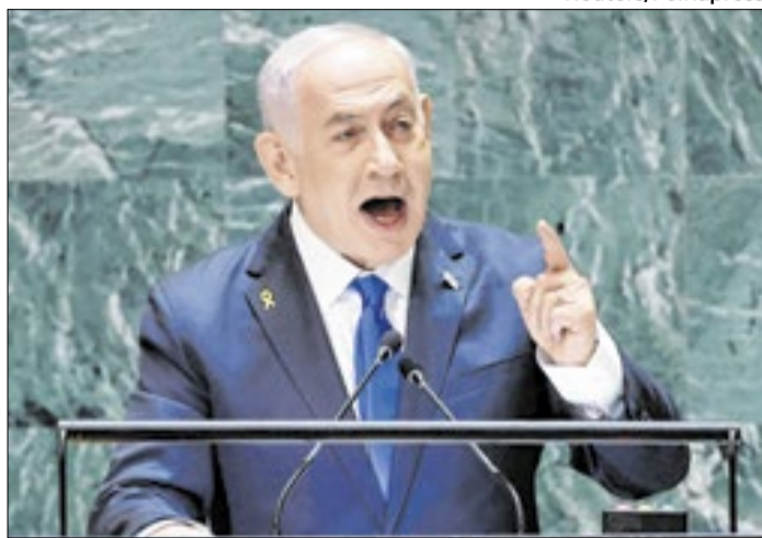
Israel segue desrespeitando o cessar-fogo com ataques