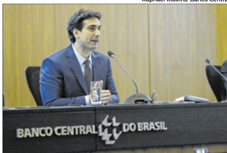
Dados foram divulgados pelo Presidente do BC, Gabriel Galípolo

Outro fator de pressão foi a conta de renda primária, que inclui remessas de lucros, dividendos e juros ao exterior. O déficit chegou a