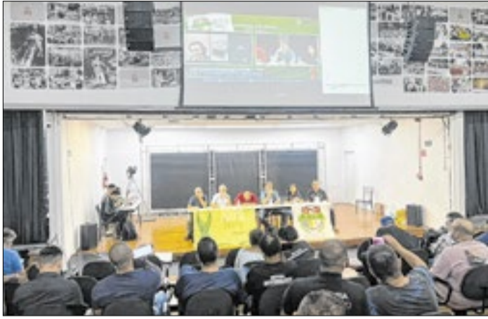
Fundação Casa tem cerca de 10 mil servidores em SP