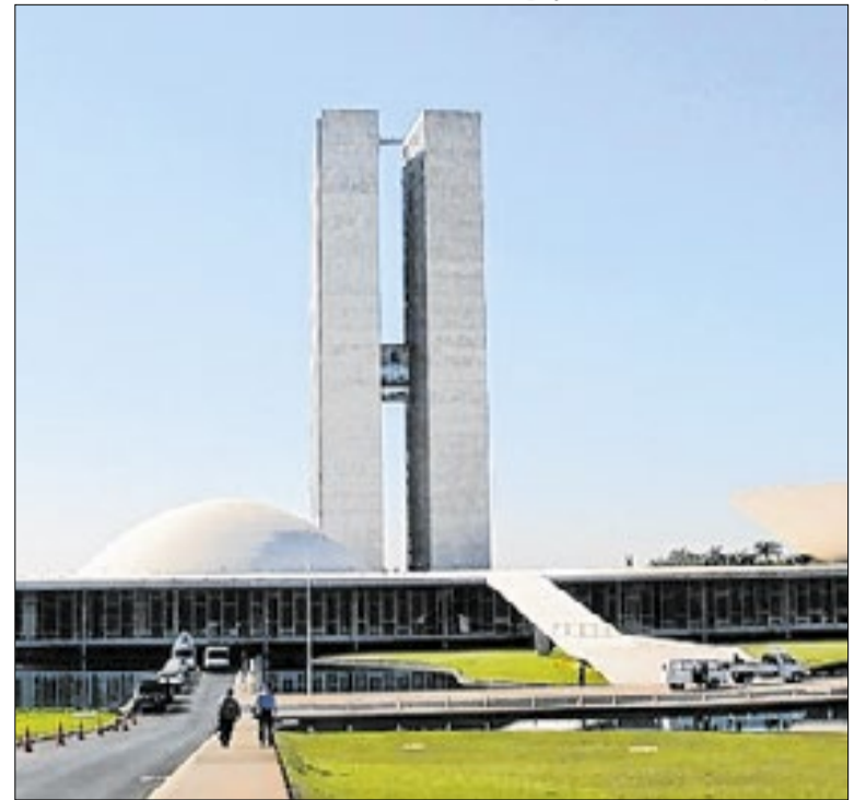
Negociação coletiva no serviço público tem Pedido de Urgência

Os acordos firmados em 2024 previram reajuste em duas parcelas: 9% em janeiro de 2025 e 5% em abril de 2026, índices aplicados sobre a remuneração total. Além dos reajustes salariais, os acordos também garantiram avanço nos benefícios, com destaque para auxílio-alimentação, que passará para R$ 1.192,00.