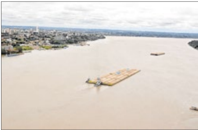
Hidrovia do Madeira é essencial para o transporte