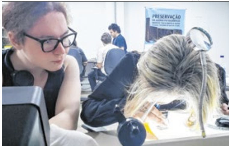
O projeto também foca em imagens do cotidiano da cidade

Parte do conjunto integra o fundo Novacap, reconhecido