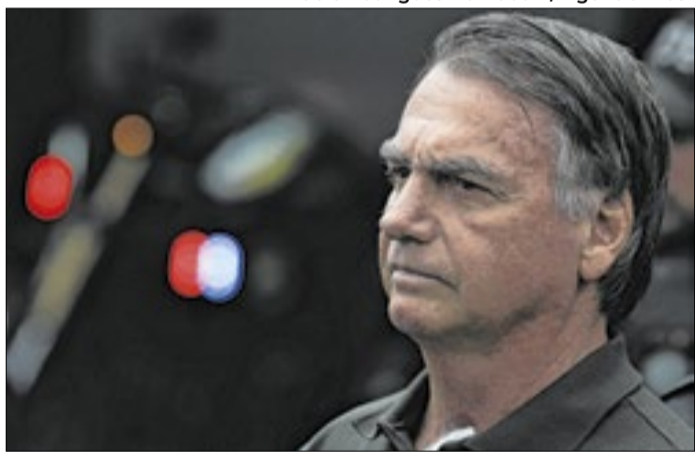
Bolsonaro lançou o filho para derrubar votação da ex