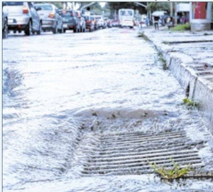
Período de chuvas aumenta incidência da doença

As chuvas ainda não pararam no Distrito Federal com o início da seca. Assim, a Saúde do DF alerta para a incidência da leptospirose