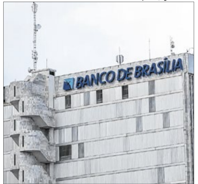
BRB enfrenta rombo após realizar operações com o Master

O Brasília Game Hub completou um ano de funcionamento consolidado como um dos principais polos de desenvolvimento de jogos eletrônicos da América Latina. Nesse período, o projeto atraiu R$ 35 milhões em potenciais investimentos e incubou 14 estúdios na capital federal. A iniciativa também realizou uma maratona de desenvolvimento que reuniu mais de quatro mil participantes e recebeu reconhecimento da International Game Developers Association. Além disso, foram promovidas mais de 250 rodadas de negócios, que resultaram em R$ 7,5 milhões em conexões entre desenvolvedores e investidores. A estrutura do hub opera em quatro frentes integradas: criação de jogos, incubação presencial de empresas, capacitação para o mercado global e ações de acesso comercial, como demodays e premiações. Para 2026, as metas foram ampliadas, com previsão de acompanhar 2.500 profissionais, incubar 20 estúdios e realizar uma semana de conexões com investidores internacionais.