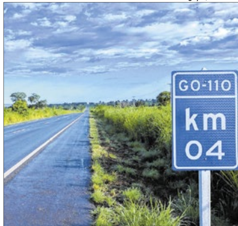
Sistema reúne dados atualizados sobre ações em execução

Mato Grosso do Sul registrou 3.490 casos confirmados de chikungunya em 2026, segundo o boletim da Secretaria de Saúde. O estado soma 7.599 suspeitas e 13 mortes em cidades como Dourados, Bonito, Jardim e Fátima do Sul. O documento indica ainda 52 registros em gestantes e dois óbitos em investigação.