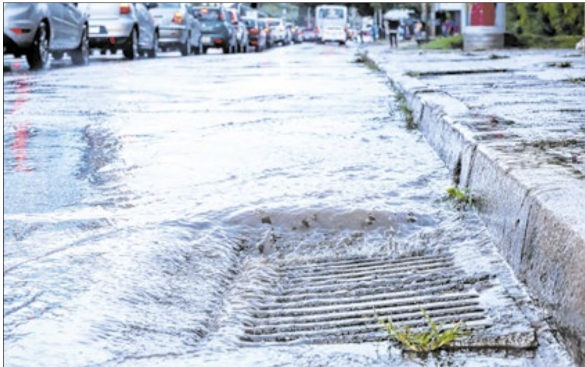
No período de chuvas, é comum o surgimento de poças d'água e extravasamento de esgoto

De acordo com a Fiocruz, a doença apresenta uma letalidade média de 9%. No Brasil, a leptospirose é uma doença endêmica, tornando-se epidêmica em pe-