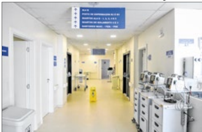
Encontro trata do planejamento e dos impactos do projeto