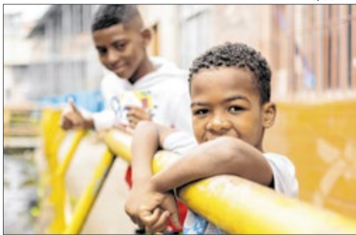
Atualmente é executado por 371 municípios