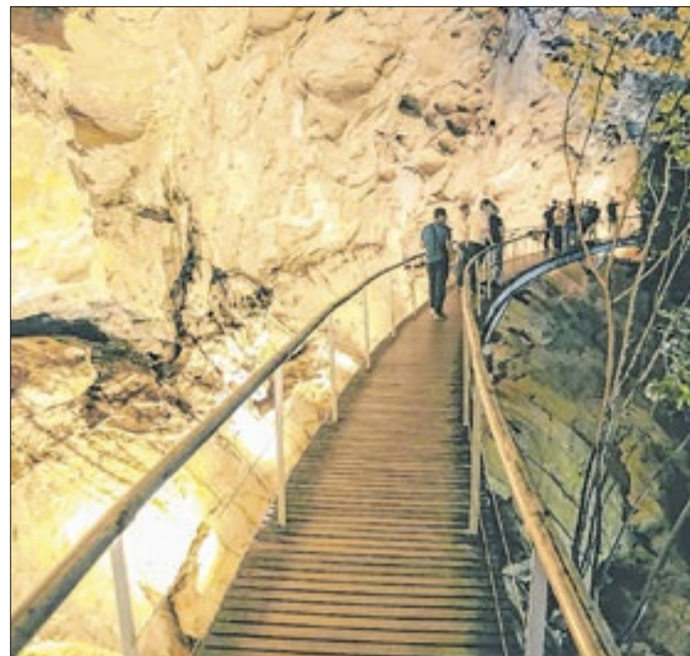
Parque Nacional Serra da Capivara

A Polícia Civil do Estado do Ceará (PCCE) cumpriu, na manhã da última quinta-feira (23), um mandado de prisão preventiva em desfavor de um homem suspeito de estupro de vulnerável contra a própria sobrinha. A captura ocorreu em Croatá, na Área Integrada de Segurança Pública 27 (AIS 27) do Ceará.