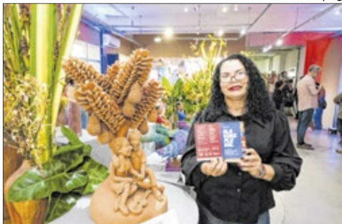
Sil ficou conhecida por suas jaqueiras de barro