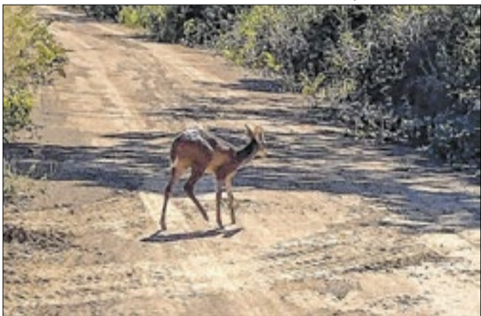
A fêmea de veado-catingueiro ( Mazama gouazoubira )