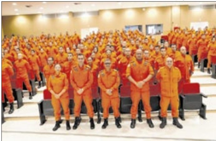
Militares lotados em funções administrativas