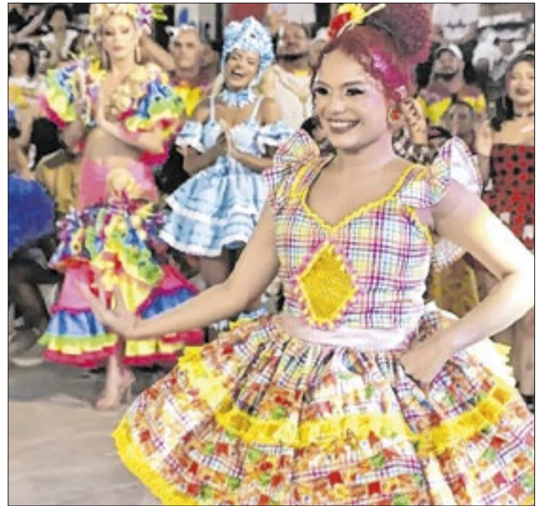
Projeto visa valorizar a festa junina de Macapá

A prefeitura de Boa Vista (RR) conquistou o Prêmio Sebrae Prefeitura Empreendedora com os projetos Sistema de Irrigação Fotovoltaica e Centro de Difusão Tecnológica (CDT), nesta quinta-feira, 23. A cerimônia ocorreu no Centro Amazônico de Fronteiras (CAF) da Universidade Federal de Roraima (UFRR).