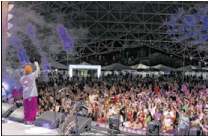
Chimarruts agitou primeira noite do festival