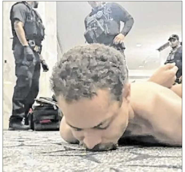
Foto do invasor, compartilhada por Donald Trump

Durante a viagem do presidente colombiano, seu país viveu mais um dia de violência política. A explosão de um possível carro-bomba atingiu o entorno de um batalhão na cidade de Cali. Informações preliminares falam em um ferido. O atentado ocorre há um mês das eleições presidenciais no país.