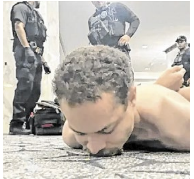
Foto do invasor, compartilhada por Donald Trump

Durante a viagem do presidente colombiano, seu país viveu mais um dia de violência política. A explosão de um possível carro-bomba atingiu o entorno de um batalhão na cidade de Cali. Informações preliminares falam em um ferido. O atentado ocorre há um mês das eleições presidenciais no país.