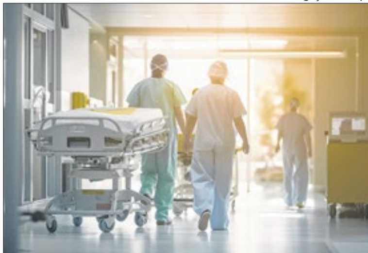
Superfaturamentos e fraudes em contratos reforçam dados