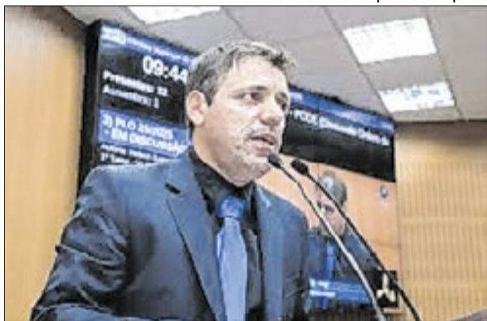
Proposta visa conscientização desde a infância