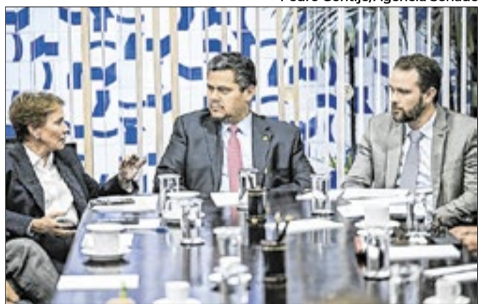
Tereza alertou Alcolumbre e Durigan