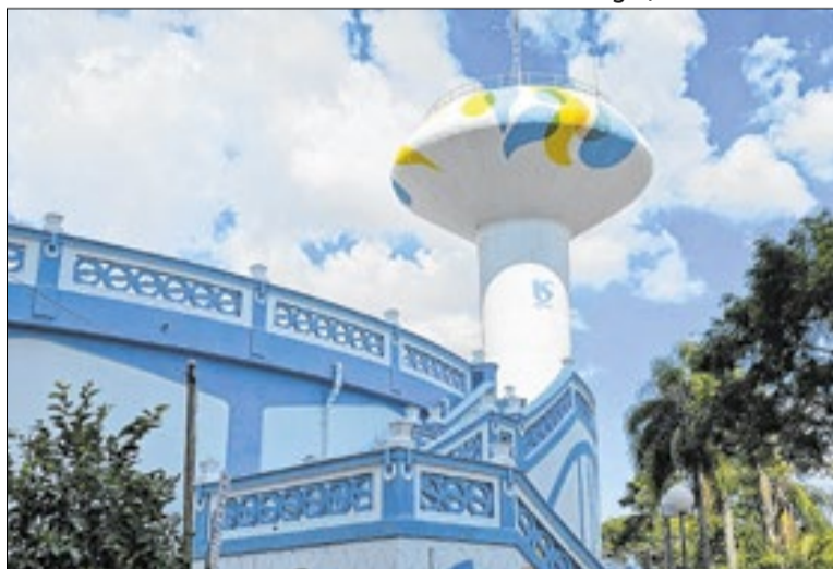
Caixa d'água da Sabesp no bairro da Vila Mariana

A Sabesp poderá ser penalizada pela pintura realizada no conjunto do Reservatório de Água da Vila Mariana, área protegida como patrimônio cultural na capital paulista. Uma vistoria técnica da Prefeitura indicou que a intervenção foi feita sem autorização e pode ter alterado características originais do local.