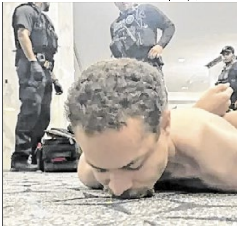
Foto do invasor, compartilhada por Donald Trump

Durante a viagem do presidente colombiano, seu país viveu mais um dia de violência política. A explosão de um possível carro-bomba atingiu o entorno de um batalhão na cidade de Cali. Informações preliminares falam em um ferido. O atentado ocorre há um mês das eleições presidenciais no país.