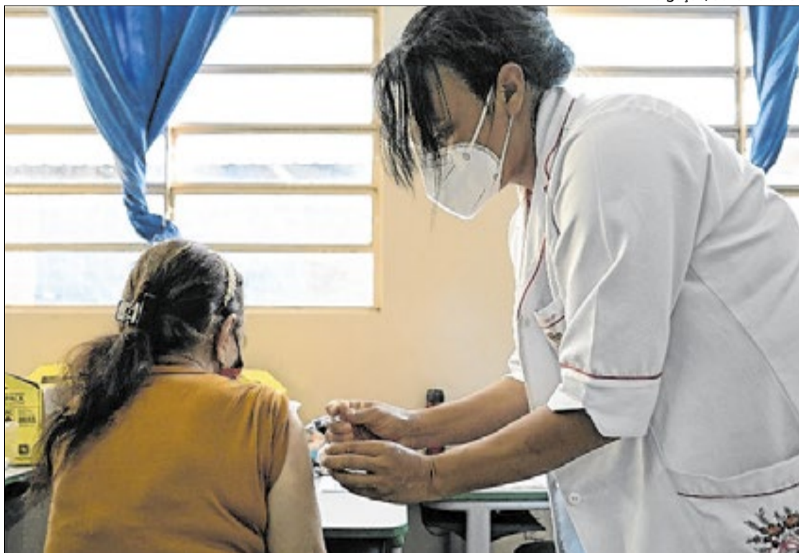
Nova vacina possui um adjuvante em sua composição com o objetivo de aumentar a proteção

O estudo será realizado em outros cinco municípios do estado de São Paulo (Campinas, Valinhos, Ribeirão Preto, Serrana e São José do Rio Preto), e deve contemplar um total de 6.900 voluntários. Metade dos participantes receberá a vacina adjuvada do Butantan e outra metade receberá uma vacina da gripe de alta dose, atualmente disponível na rede privada e indicada para o público 60+, permitindo a comparação entre os imunizantes. Os participantes serão acompanhados durante seis meses, com monitoramento contínuo.