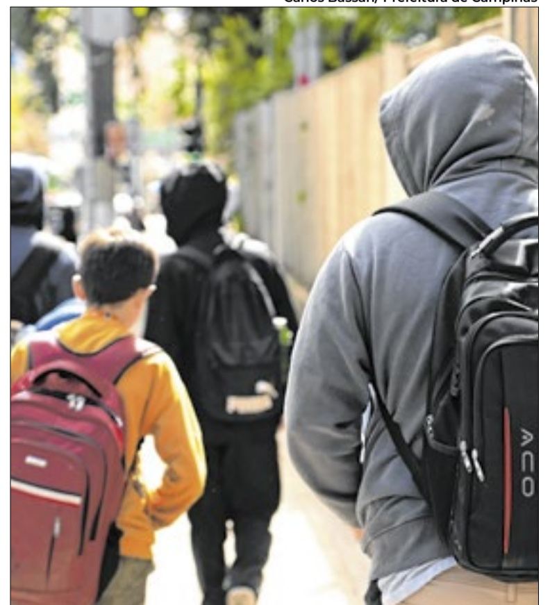
Previsão é de que temperaturas fiquem entre 16°C e 22°C

Segundo Climatempo, uma nova frente fria avançará sobre o Sul em 30 de abril e passará pelo litoral de São Paulo em 1º de maio, provocando pancadas de chuva no Estado paulista.