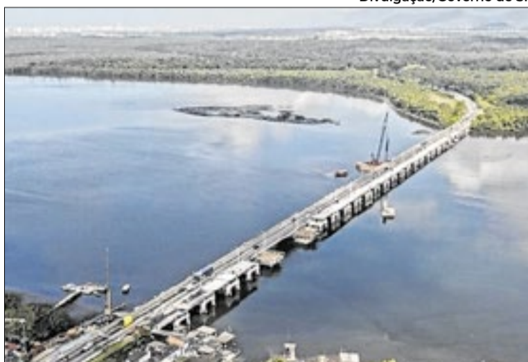
Investimento para obras e supervisão, soma R$ 215 milhões

Atualmente, os trabalhos incluem serviços de aterro, contenção e concretagem, fundamen-