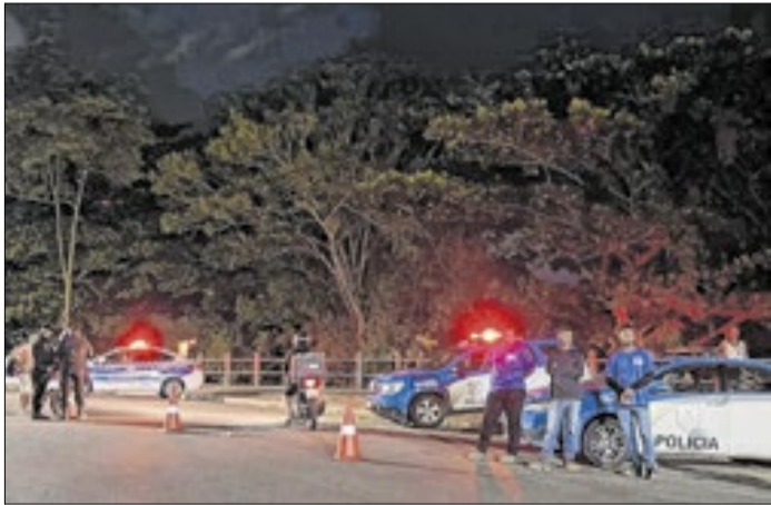
Prefeitura reforça apoio em fiscalização no trânsito