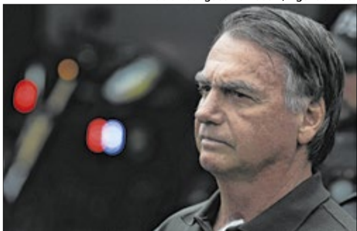
Bolsonaro lançou o filho para derrubar votação da ex