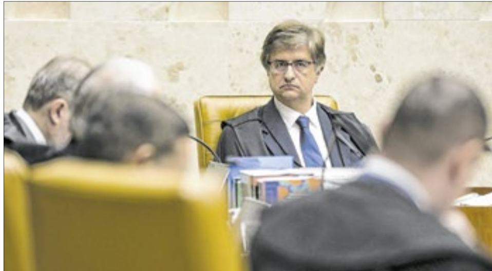
Procurador-Geral de República, Paulo Gonet apontou erros na decisão do STF contra magistrados e procuradores

Entidades da classe alertaram para o risco de paralisação de serviços públicos e uma onda de ações judiciais, já que verbas consolidadas há anos foram cortadas abruptamente por falta de lei formal.