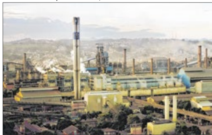
Negociação inicia faltando apenas 4 dias para data-base