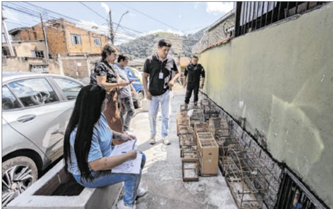
Animais foram encontrados em residência no bairro Santo Agostinho