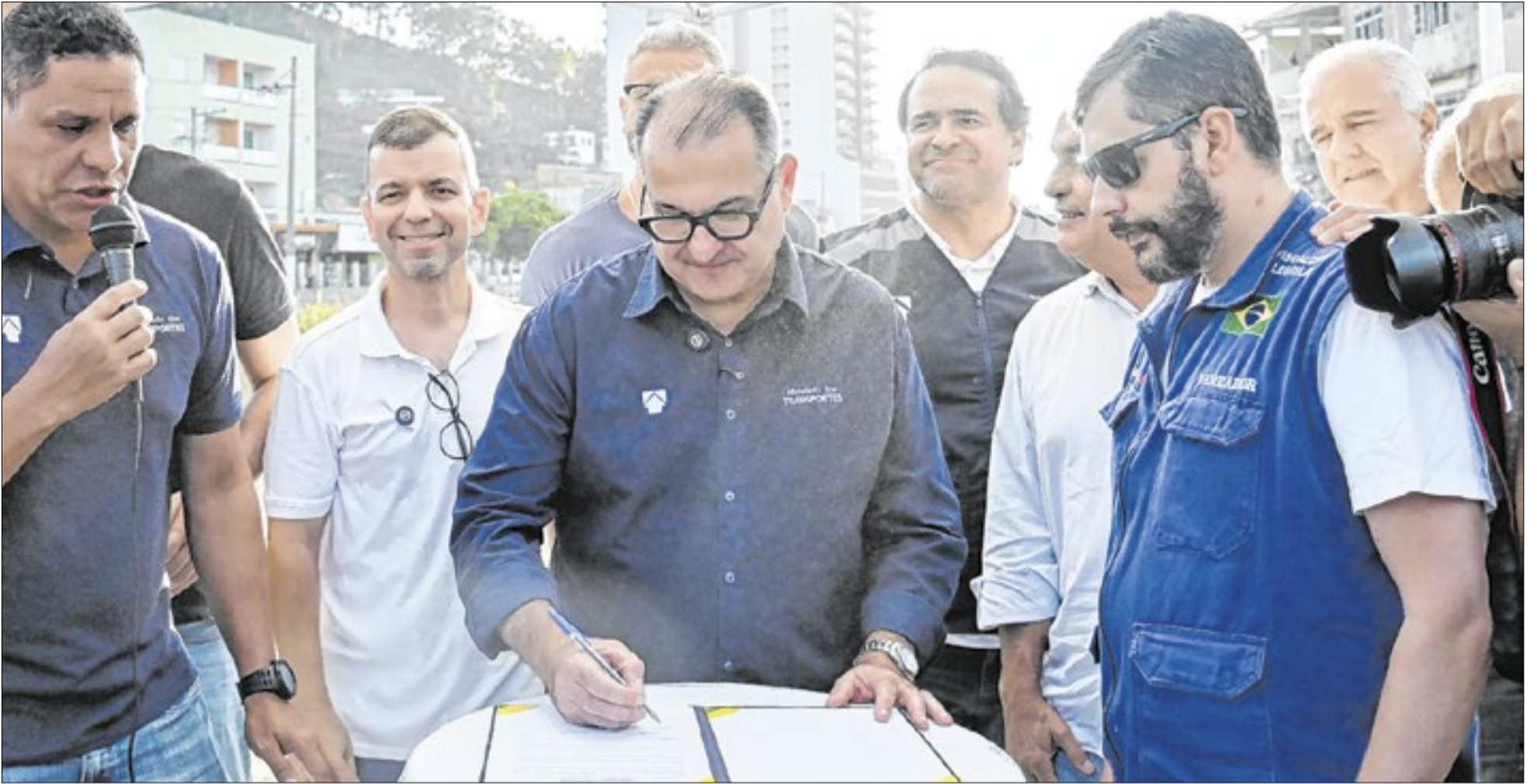
Barra Mansa recebe nova fase de obras no pátio ferroviário, com investimento federal e previsão de melhorias na mobilidade