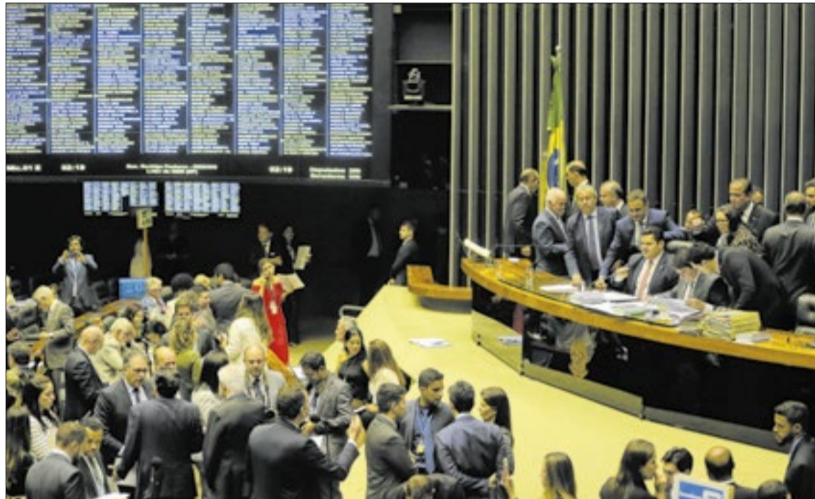
Congresso se reúne na terça para analisar veto ao PL da Dosimetria

“O tema é altamente polarizado. Os governistas defendem a punição exemplar pelos atos de 8 de janeiro, oposição e parte do Centrão defendem a revisão das penas, alegando que há excessos. O custo político é elevadíssimo, derrubar o veto pode ser interpretado como flexibilização de punição por ataques à democracia, manter o veto pode gerar atrito com a base parlamentar, que aprovou o projeto”, ele disse.