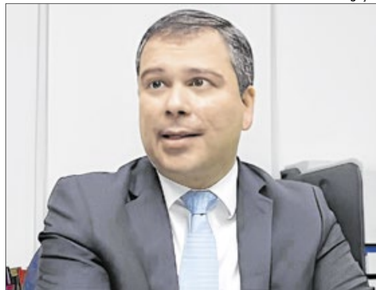
Manutenção da prisão aponta para negociação de delação

Motoristas de carros comuns se aproximam de passageiros que esperam veículos de aplicativos, se apresentam como vinculados à Uber e se oferecem para fazer corridas. Vale lembrar: carros de aplicativos são pedidos pelo celular; embarcar num veículo qualquer é um risco absurdo para o passageiro.