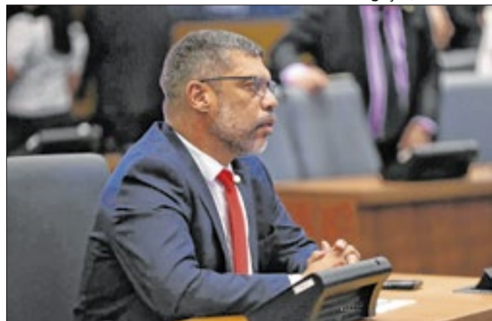
Deputado estadual cobra esclarecimentos e regularização