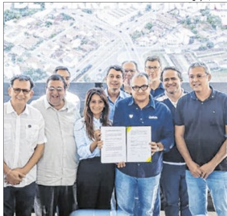
Assinatura aconteceu durante evento na sexta-feira (24)

“A ideia é evitar o deslocamento de pacientes de Resende por meio do TFD apenas para a retirada de medicamentos. Assim, vamos reduzir o desgaste físico dessas pessoas e racionalizar o uso dos recursos públicos, reservando o programa apenas para o atendimento médico”, explicou o vereador.