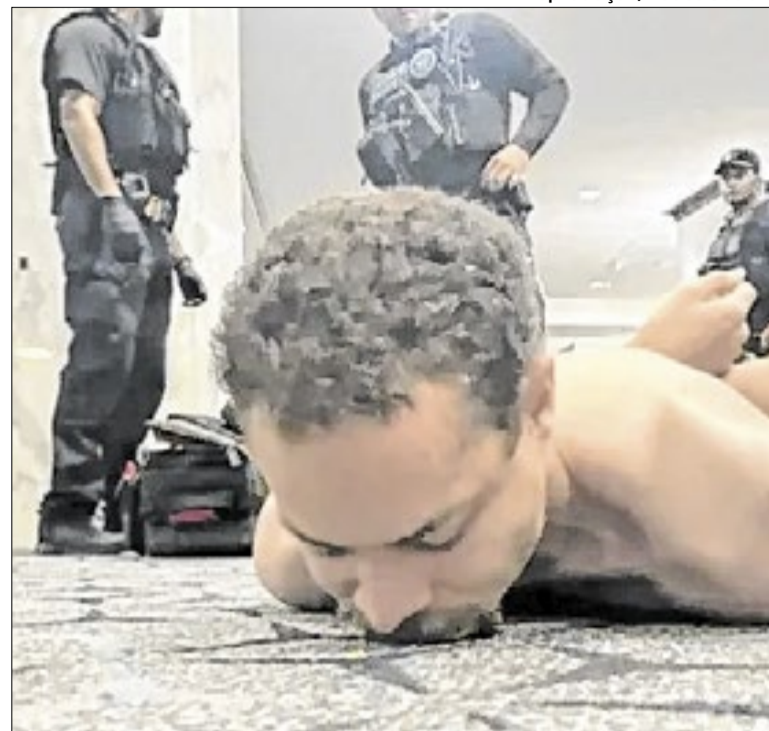
Foto do invasor, compartilhada por Donald Trump

Durante a viagem do presidente colombiano, seu país viveu mais um dia de violência política. A explosão de um possível carro-bomba atingiu o entorno de um batalhão na cidade de Cali. Informações preliminares falam em um ferido. O atentado ocorre há um mês das eleições presidenciais no país.