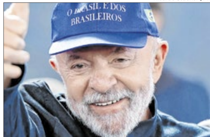
Lula: discurso nacionalista não resolve tudo