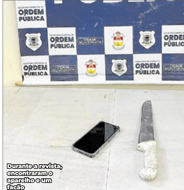
Durante a revista, encontraram o aparelho e um facão

Diante dos fatos, a equipe deu voz de prisão em flagrante ao autor do furto, conduzindo-o e o outro homem à delegacia para apresentação à autoridade policial. Um deles permaneceu preso por furto, enquanto o outro foi ouvido e liberado. O celular foi recuperado e devolvido.