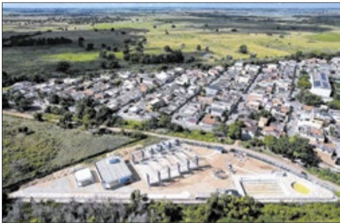
Secretaria avança com a construção de Vilas Olímpicas