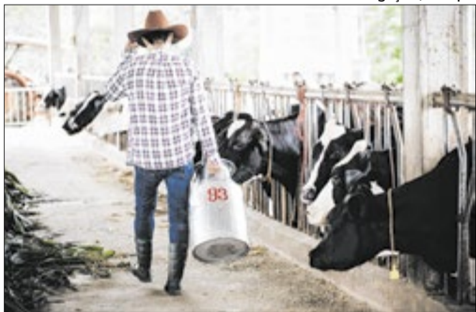
Medida busca reforçar o caixa das cooperativas de leite.