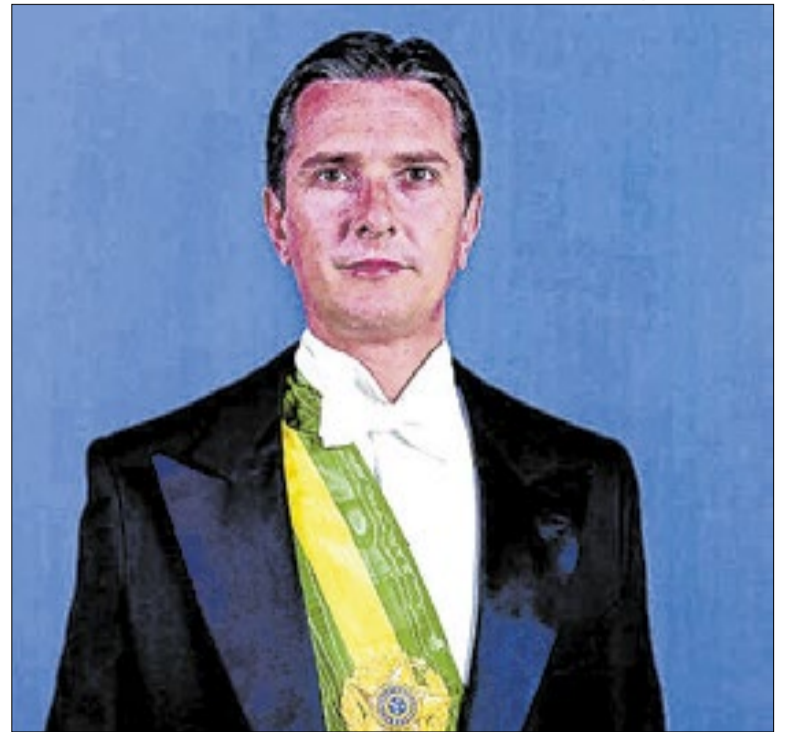
Confisco da poupança ocorreu um dia após a posse de Collor.

A resolução também obriga instituições enquadradas em limites de alavancagem a manter parte dos recursos aplicada em títulos públicos federais. A exigência será implementada gradualmente entre 2026 e 2028, aumentando liquidez, disciplina prudencial e segurança no mercado financeiro.