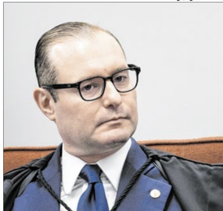
Após Toffoli se declarar suspeito, ação ficou para Zanin

No dia 1º de Maio, entra em vigor o acordo entre a União Europeia e o Mercosul. E o governo aposta muito nele também para compensar perdas. Ocorre, porém, que o acordo entra de forma provisória. Há ainda resistência de países, como a França e a Polônia. O acordo foi judicializado. Nada foi, portanto, resolvido.