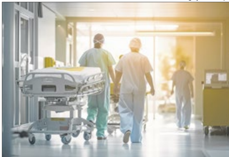
Superfaturamentos e fraudes em contratos reforçam dados