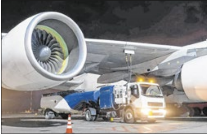
Aéreas poderão usar recursos do Fundo de Aviação Civil