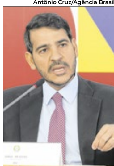
Sabatina de Messias será na quarta

Um dia antes da sessão conjunta do Congresso, na quarta-feira (29), a Comissão de Constituição e Justiça (CCJ) do Senado realizará a sabatina do indicado do presidente Lula, o advogado-geral da União (AGU), Jorge Messias, para assumir a cadeira no Supremo Tribunal Federal. Caso Messias consiga 14 votos favoráveis na CCJ, a votação seguirá para o plenário da Casa e, caso ele consiga ao menos 41 votos a favor de sua indicação, ele será o novo ministro da Corte.