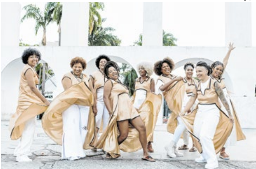
O Jazz das Minas define sua sonoridade como ‘jazz de terreiro’

Banda formada por mulheres, Jazz das Minas apresenta seu álbum ‘Ayé Orun’