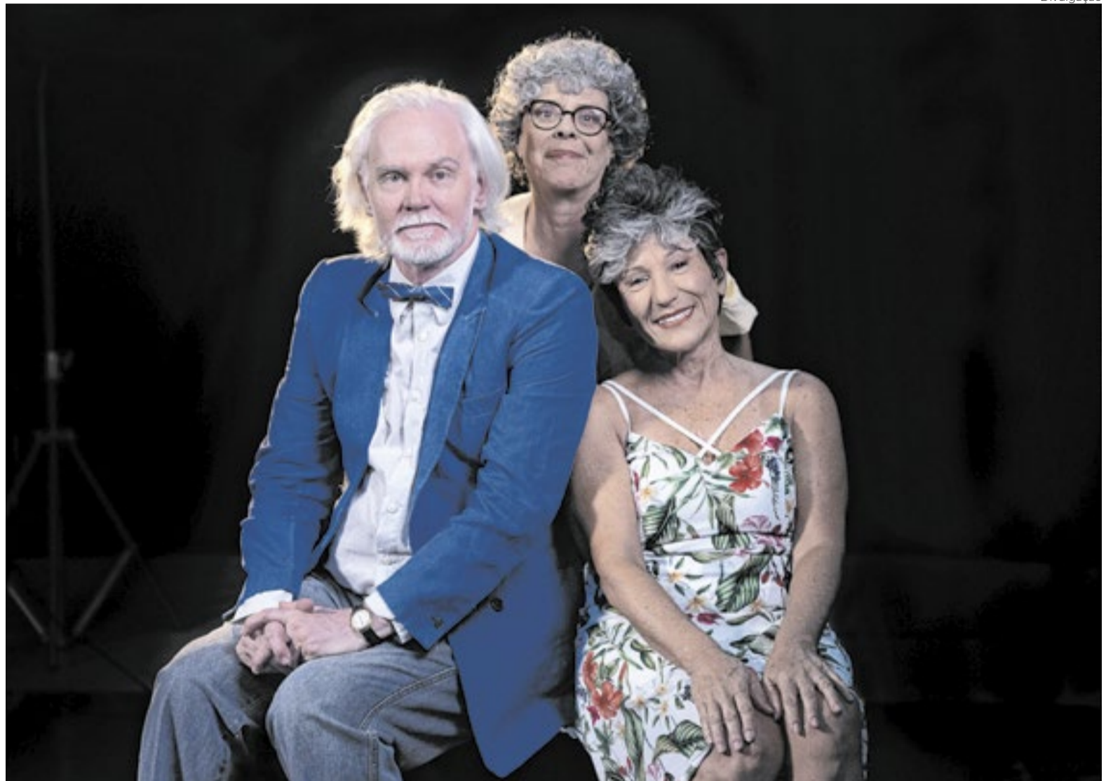
Espectáculo “Jogo da memória” fala sobre envelhecimento