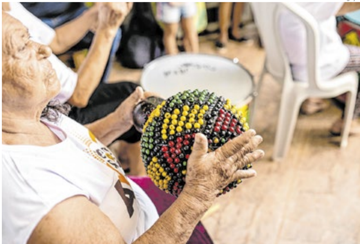
Projeto visa criar integração e ocupação para quem tem mais de 60

Projeções indicam que idosos serão mais de 30 milhões no Brasil