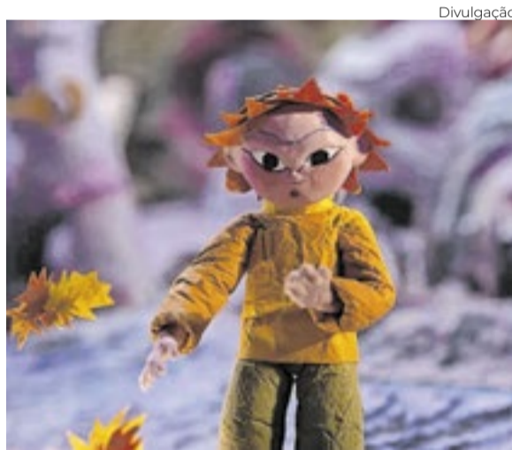
Fire In My Pocket