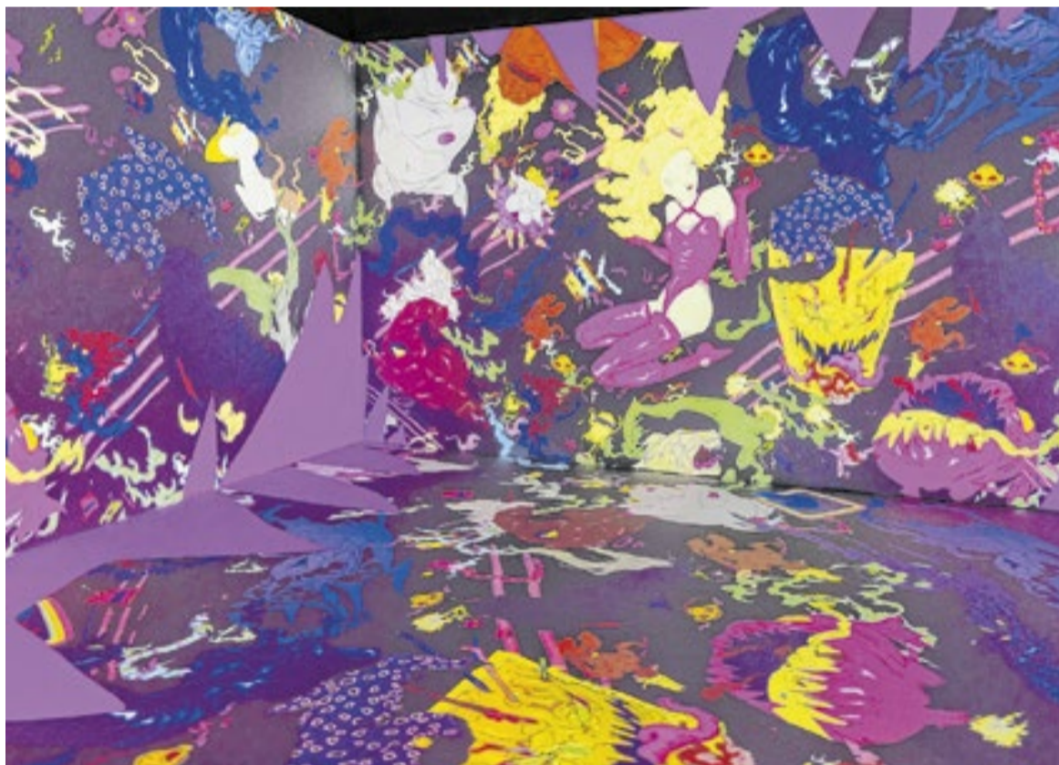
A sala imersiva ‘Candy Girl’

Yoshitaka Amano começou a carreira no lendário Tatsunoko Studio, berço do ‘Speed Racer’ e ‘Gatchaman’