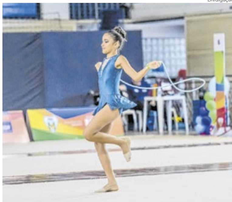
Copa Brasília de Ginástica

2026 será realizada nos dias 23 e 24 de maio, no Colégio Marista, em Brasília, consolidando-se em sua 41ª edição como uma das principais vitrines da modalidade no país. Promovido pela Federação Brasileira de Ginástica, o evento reúne atletas, técnicos e equipes de apoio, movimentando também setores como comércio, transporte e alimentação. Desde 2022, a competição cresceu de cerca de 700 para mais de 3.600 participantes.