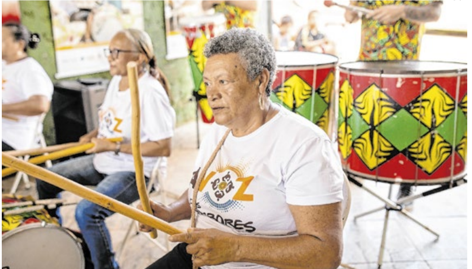
Projeto é gratuito, e voltado para quem tem mais de 60 anos

De acordo com a organização, a metodologia adotada parte