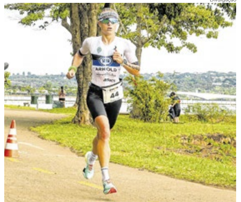
Corrida IRONMAN em Brasília

*Após reunir mais de 2 mil pessoas na estreia da temporada de Páscoa, a Orquestra