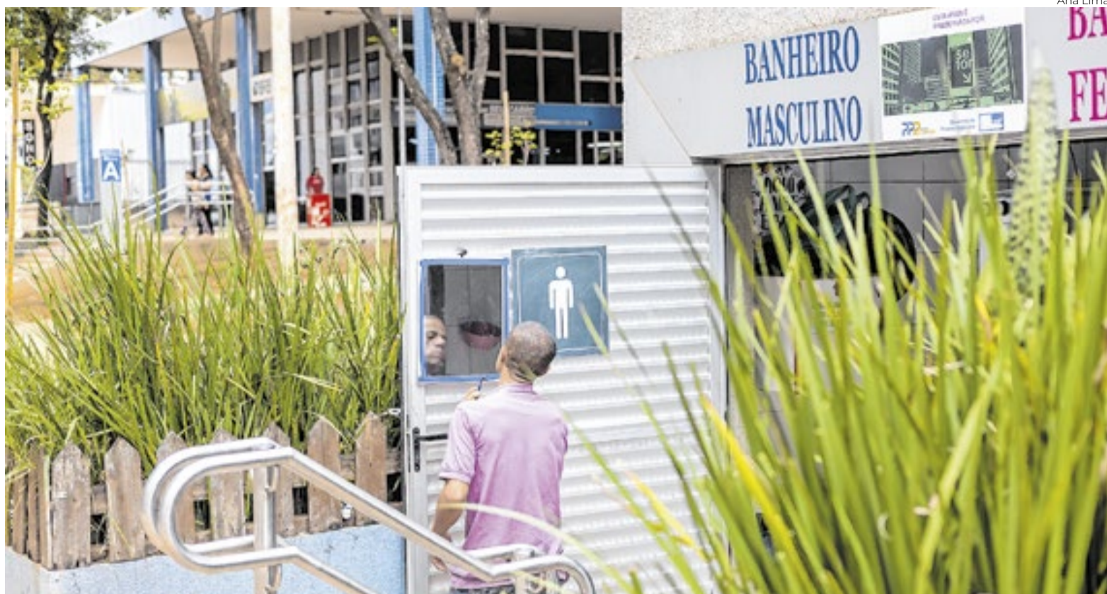
Um único banheiro para milhares: descaso com os “invisíveis”

O equipamento público foi reformado durante a pandemia de Covid-19, após permanecer fechado por cerca de duas décadas. Desde a reabertura, passou a atender aproximadamente mil pessoas por semana, segundo a organização responsável. O fun-