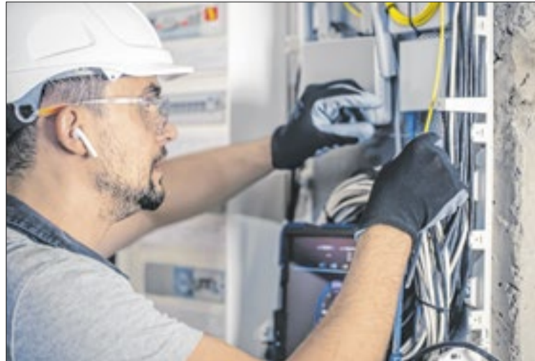
Sector de informação e comunicação teve alta de 1,1%.

No acumulado do primeiro bimestre de 2026, o setor de serviços cresceu 1,9% frente ao mesmo