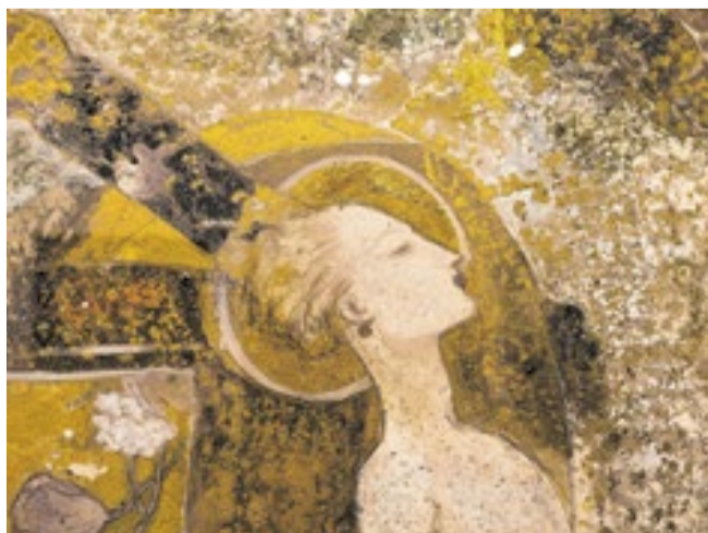
Detalhe de ‘Japan’ (1994)

A exposição chega ao CCBB Rio após alcançar 118 mil visitantes em Belo Horizonte. Segue para o CCBB Brasília após a temporada carioca, que vai até 22 de junho de 2026.