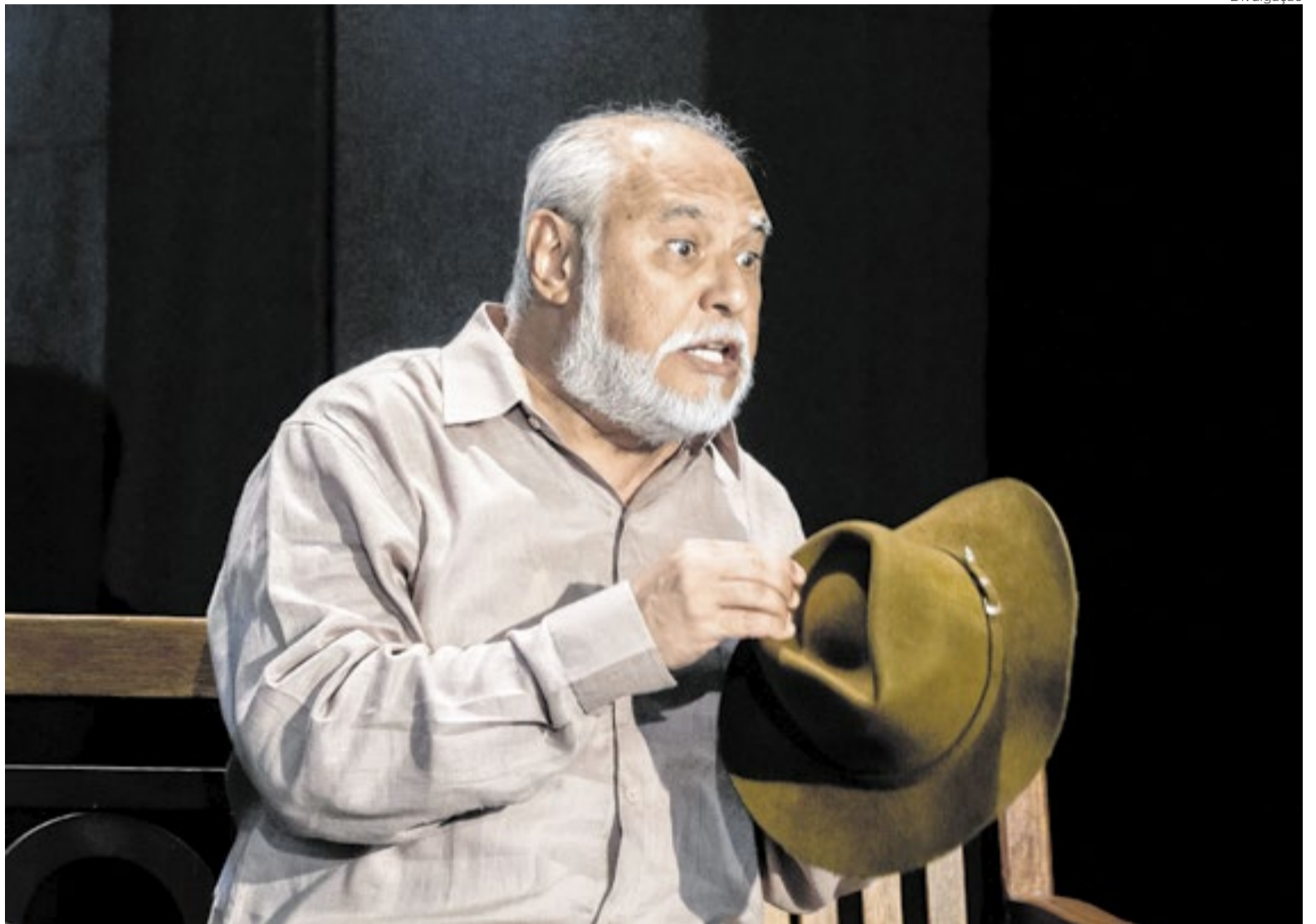
O Julgamento de Zé Bebelo