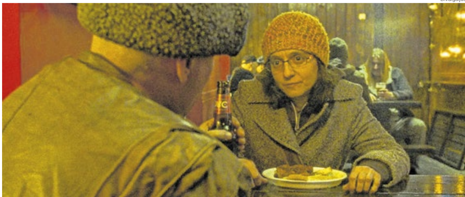
Sorella di Clausura

Dramédia à romena, comédia brasileira, terror do Cazaquistão, uma animação húngara com bonequinhos: diversidade é o que não faltou aos títulos mais badalados do festival argentino