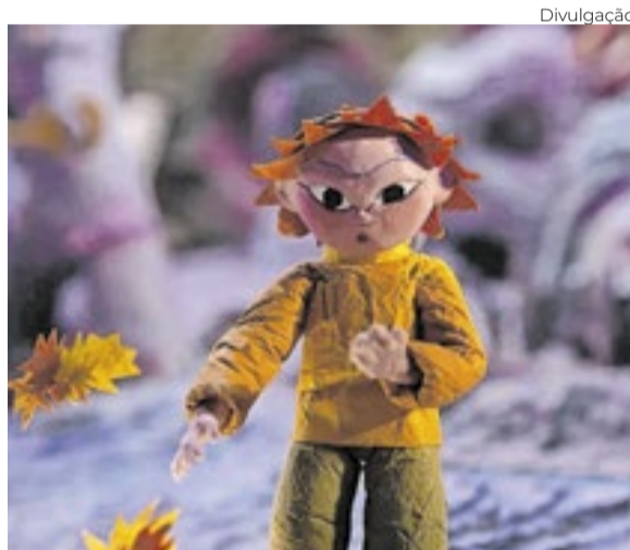
Fire In My Pocket