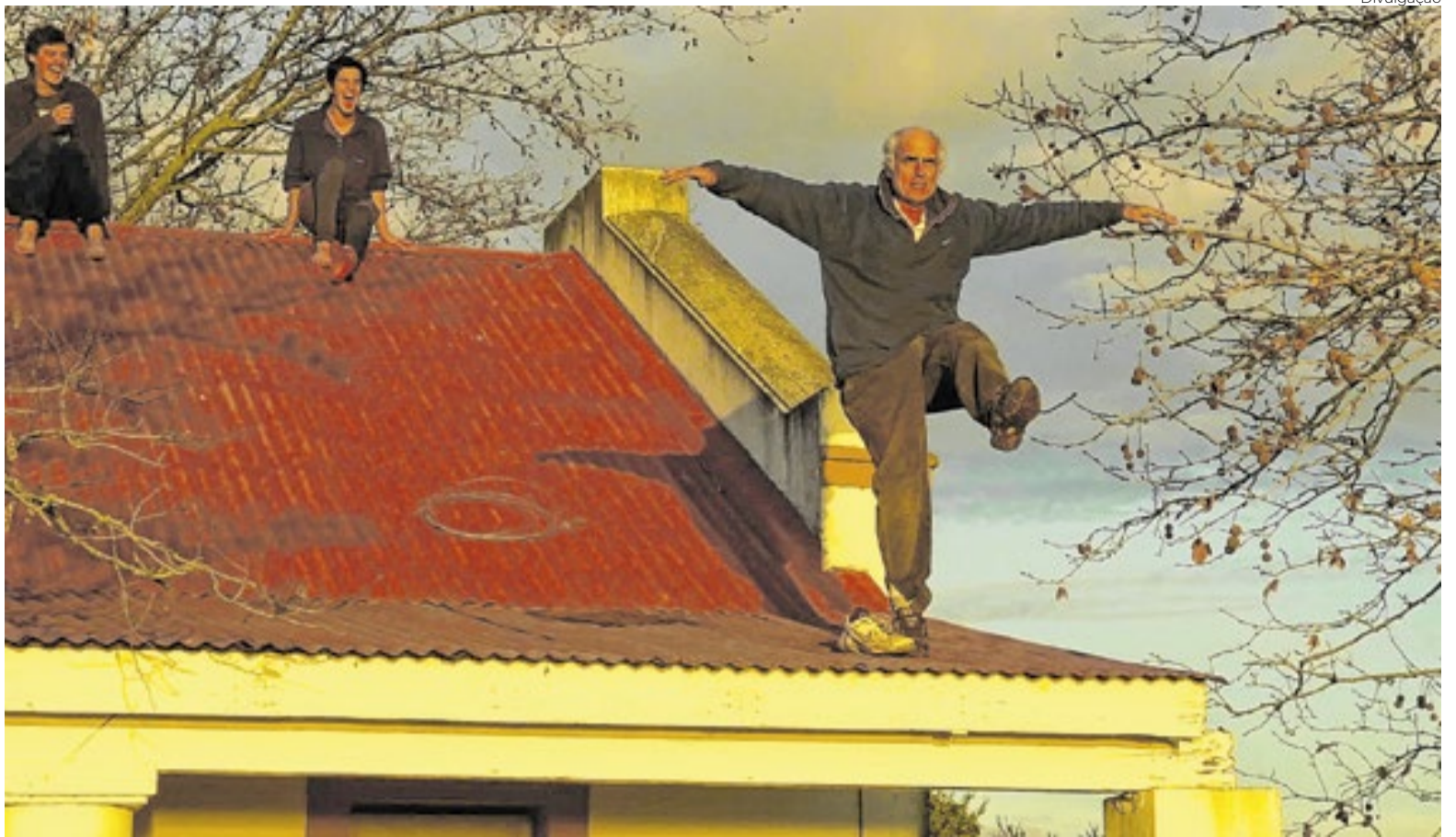
'En El Campo Los Días Son Más Largos' narra ritos de aproximação de uma família com a natureza

Apesar das políticas avessas a cinema do atual presidente argentino, a produção de 'nuestros hermanos' inunda o Festival de Buenos Aires de coragem e de ousadas narrativas