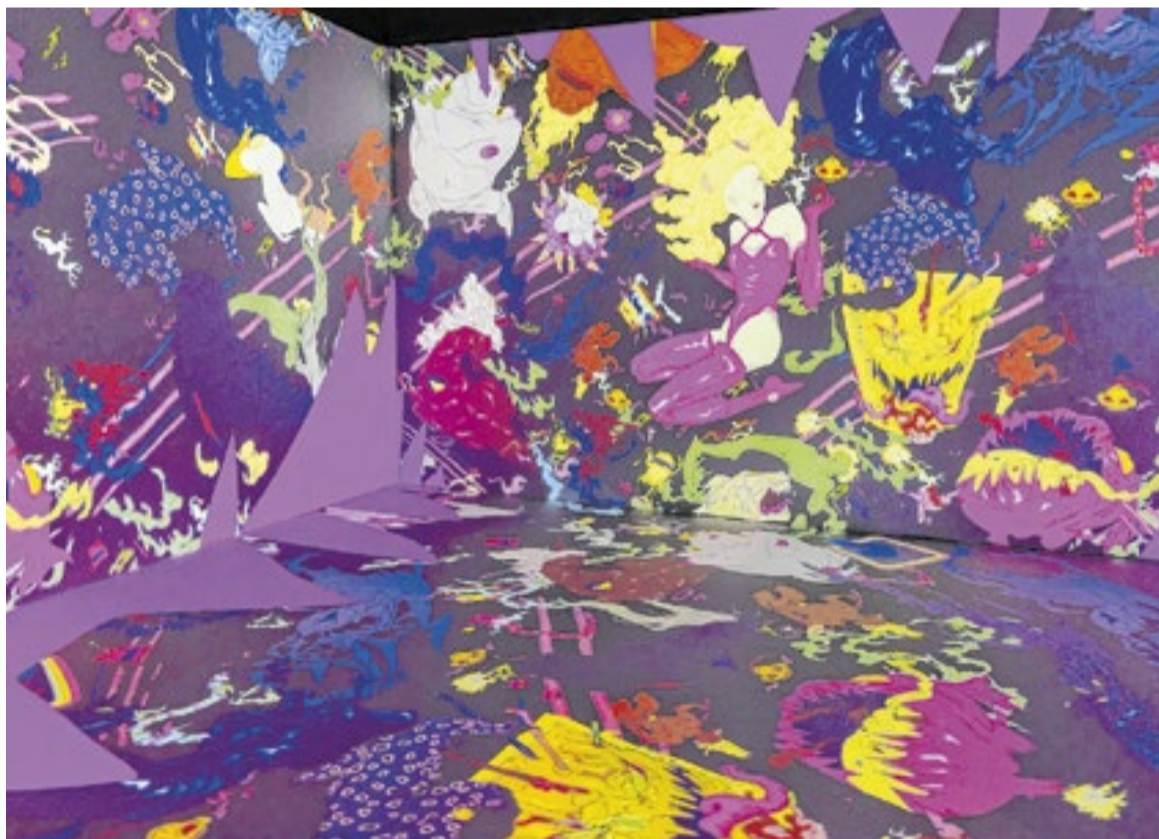
A sala imersiva ‘Candy Girl’

Yoshitaka Amano começou a carreira no lendário Tatsunoko Studio, berço do ‘Speed Racer’ e ‘Gatchaman’