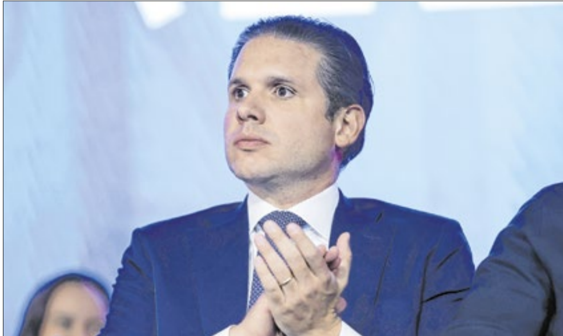
Motta tem pressa para instalar a comissão especial

Contudo, já circulava no poder Legislativo duas PECs que determinavam o fim da escala 6X1, mas reduzindo a jornada de trabalho para 36 horas semanais. A diferença é que uma propõe o prazo de dez anos de adaptação para instalar o novo modelo (PEC 221/2019) e a outra propõem a redução imediata da escala de trabalho (PEC 8/2025). O relatório do deputado Paulo Azi (União-BA) na CCJ apeensou as duas PECs. Diante das duas possibilidades, Motta adiantou que a Câmara priorizará a discussão para aprovar a PEC, já que esta altera diretamente a Constituição e tende a ter um resultado mais duradouro.