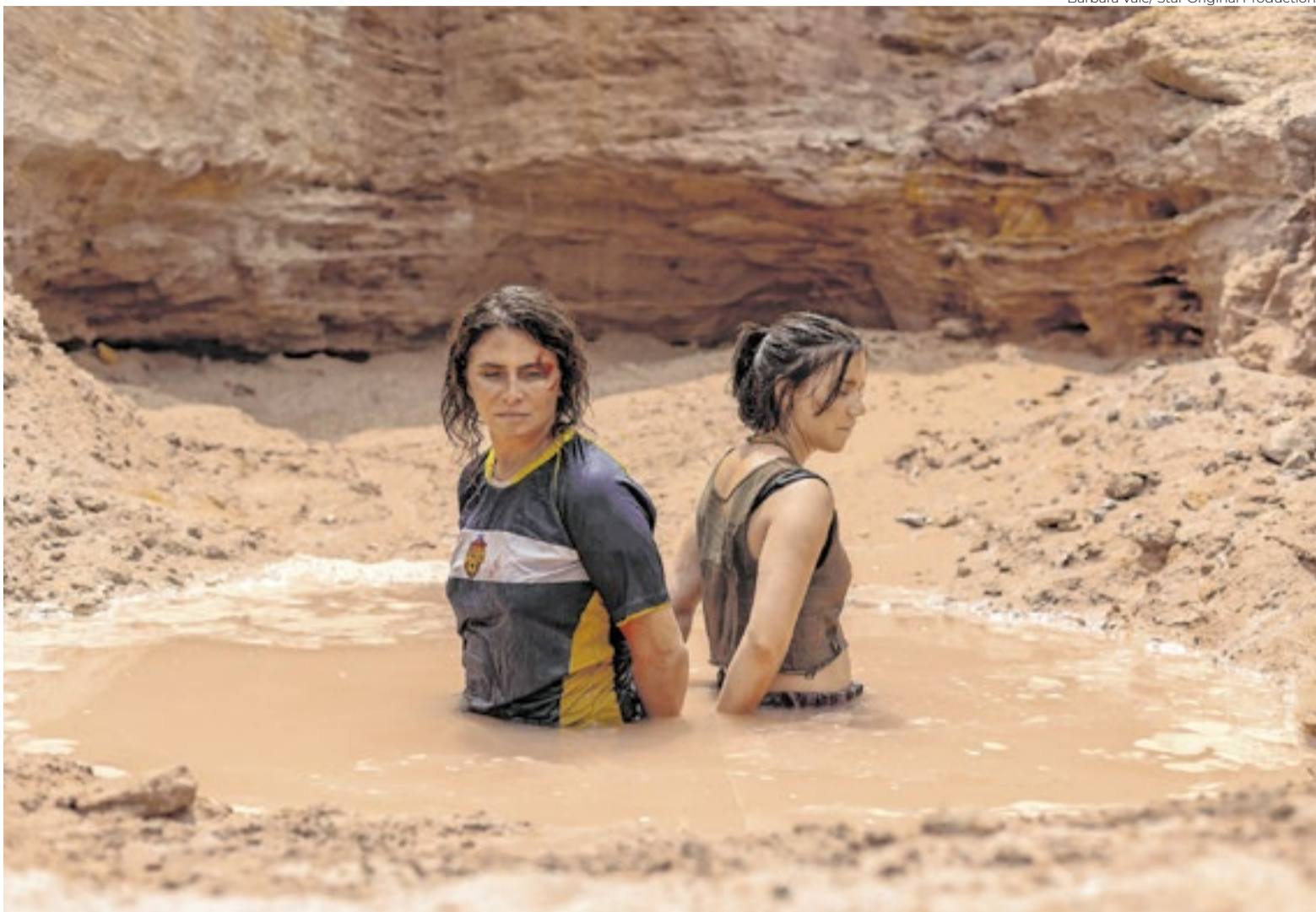
Barbara Vale/Star Original Productions