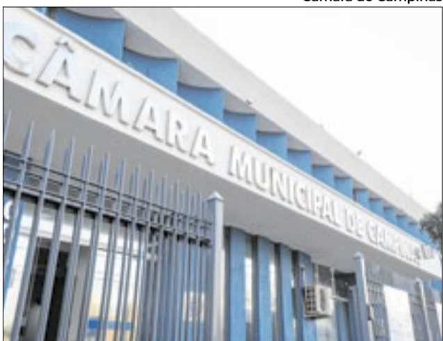
Votação nesta quarta-feira (22) é em definitivo