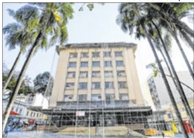
Imóvel será rebatizado como Palácio da Cidade