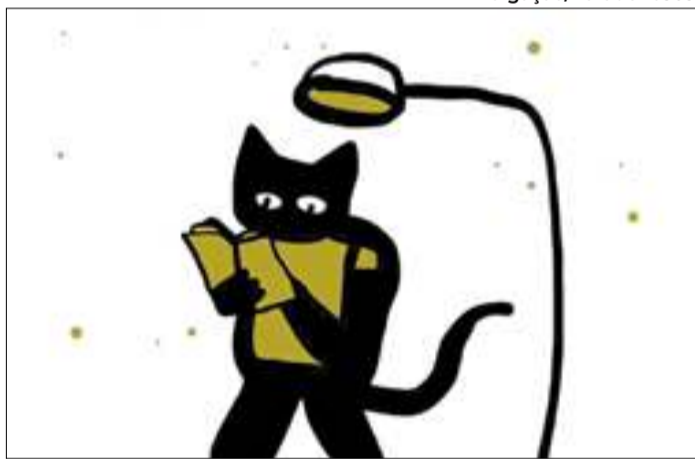
Evento promove criação de publicações independentes