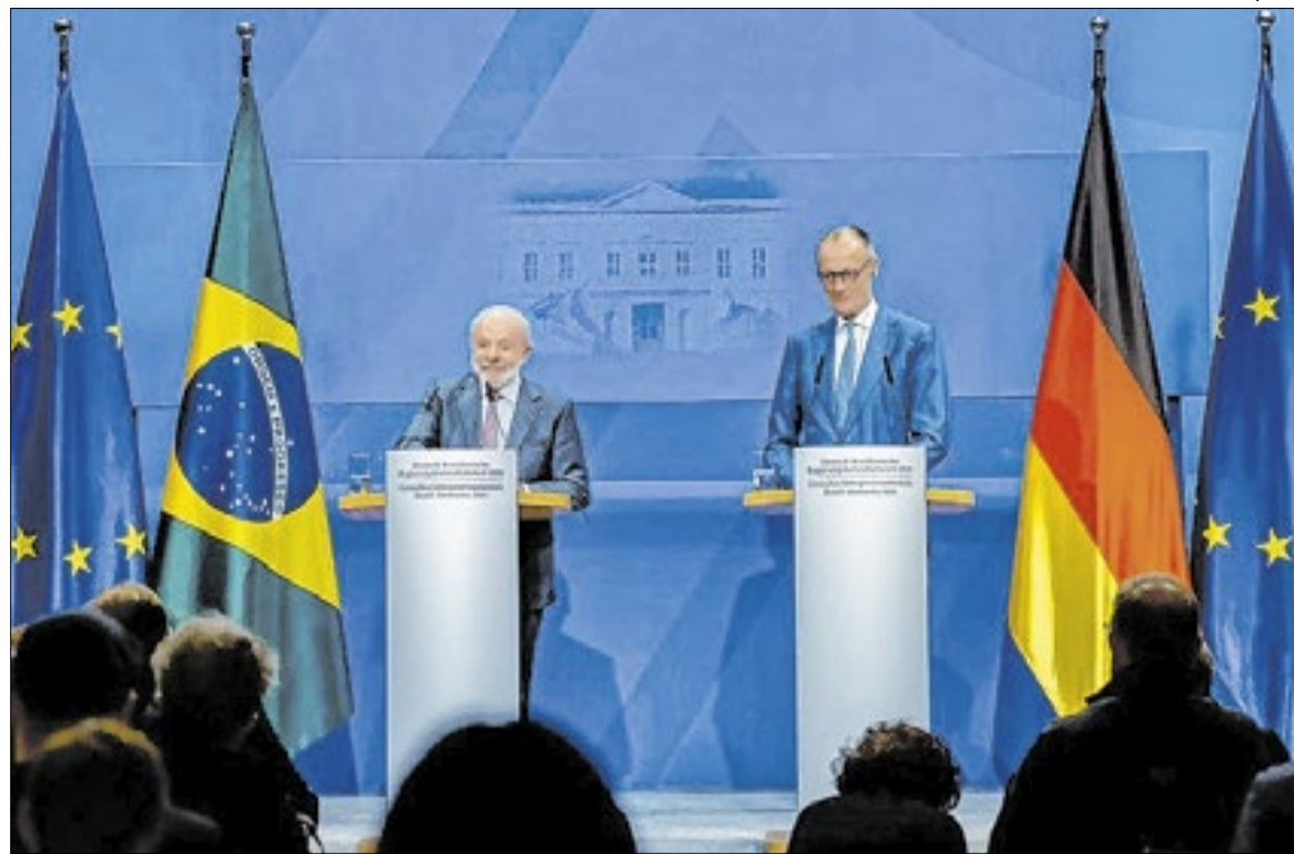
O presidente Lula, ao lado do chanceler alemão, Friedrich Merz, em Hanover, na segunda-feira(20)

O entendimento entre Mercosul e União Europeia é considerado um dos acordos comerciais mais longos já negociados, com mais de duas décadas de tratativas. A versão final busca equilibrar a liberalização do comércio com compromissos ambientais e trabalhistas, além de prever mecanismos de cooperação regulatória entre os blocos. A entrada em vigor marca a fase de implementação do acordo, com abertura gradual de mercados e adequação de legislações internas dos países envolvidos.