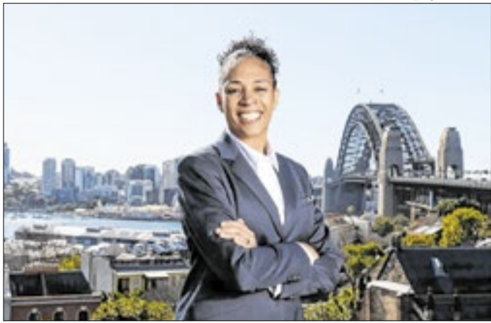
Aline Pellegrino é um reforço de peso para a Fifa