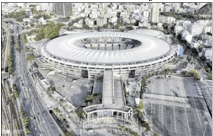
Maracanã será o palco da abertura e da final em 2027