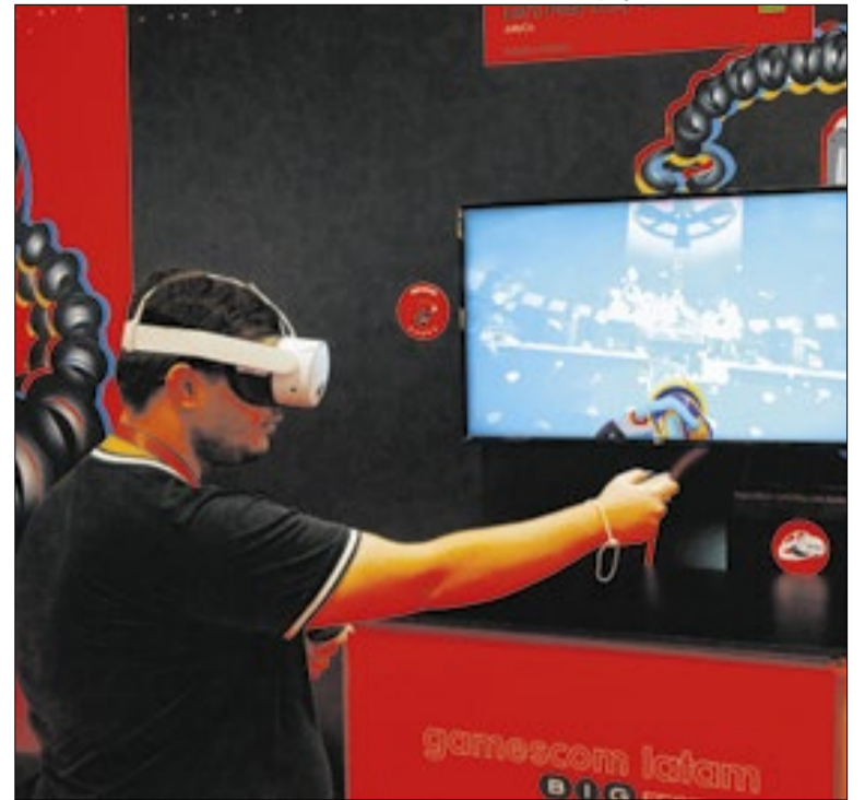
Brasil está no top 10 maiores mercados consumidores de games

A Telefônica Brasil, controladora da Vivo no país, aprovou o pagamento de R$ 365 milhões em juros sobre capital próprio (JCP) aos acionistas. O valor bruto será de aproximadamente R$ 0,11 por ação, para investidores com posição em 27/abril. O pagamento ocorrerá até 30/abril de 2027, em data ainda a definir.