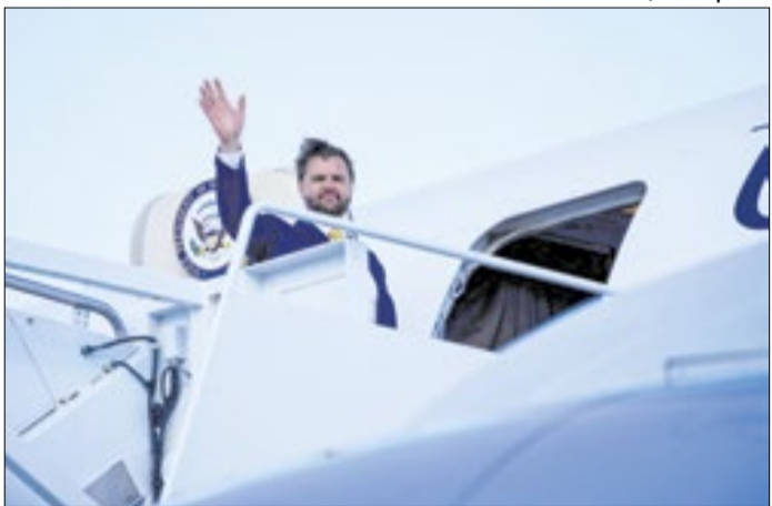
Vance criticou leitura da imprensa sobre relação com papa