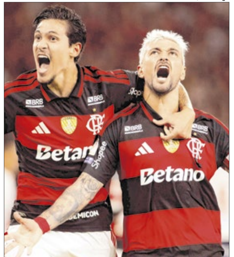
Vitória sobre o Bahia representou bem mais do que os três pontos no Brasileirão