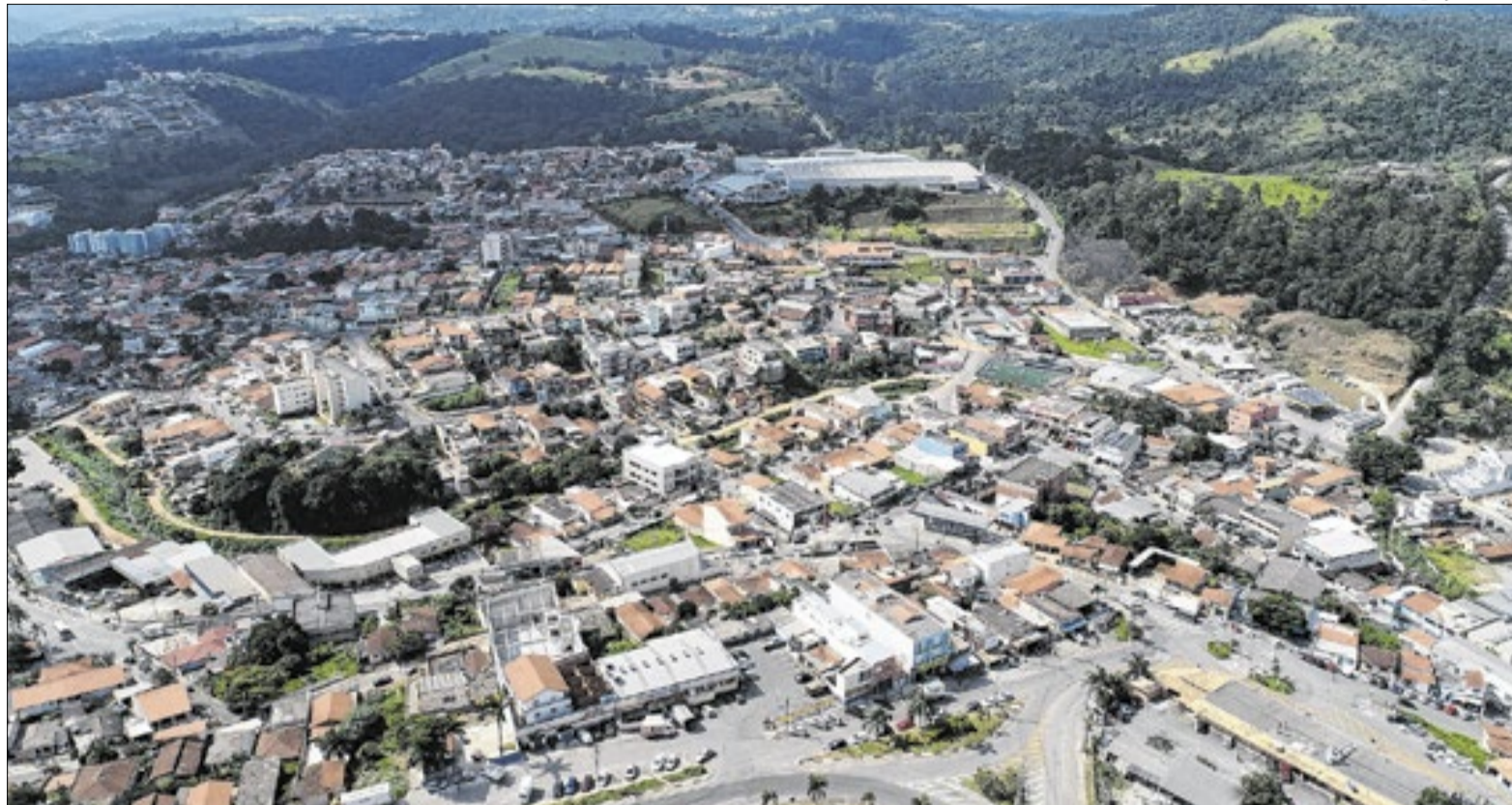
Ainda neste mês poderá ser votada a criação de CPI para investigar o caso na cidade

Em alguns dos materiais analisados, beneficiários agradecem nominalmente à primeira-dama pelas entregas, o que levanta suspeitas de promoção pessoal asso-