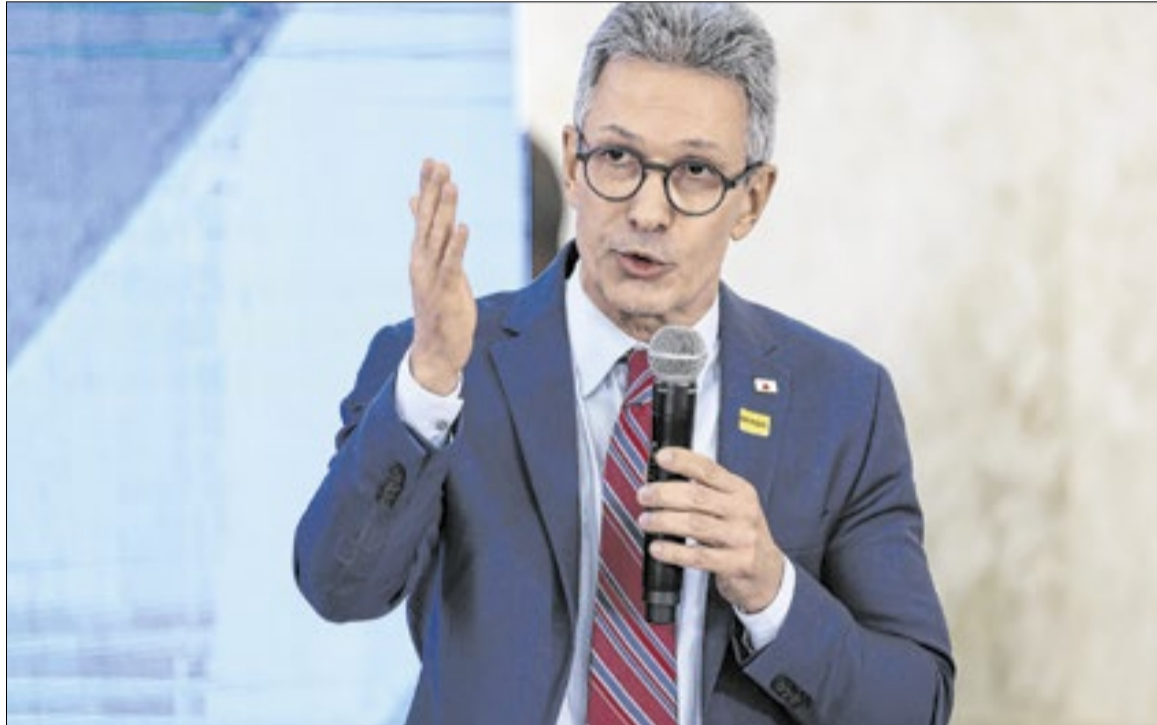
Agora Romeu Zema: o inquérito das fake news não tem fim

A encenação não é neutra. O roteiro mistura ironia com referências diretas a decisões judiciais, menções a quebra de sigilo que ocorreram no âmbito da CPI do Crime Organizado e insinuações sobre movimentações financeiras. Tudo embalado como humor, mas com conteúdo claramente político. E foi exatamente aí que o vídeo deixou de