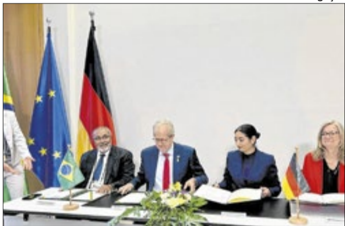
R$ 3 bi serão destinados às mudanças climáticas