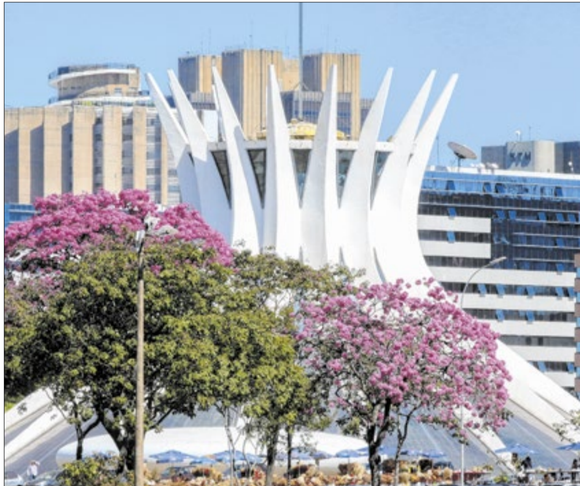
Catedral Metropolitana de Brasília é um dos monumentos mais conhecidos da capital federal

Um dos maiores símbolos de Brasília, a Catedral Metropolitana foi palco, na manhã desta terça-feira, de uma missa em ação de graças pelos 66 anos da capital federal. A cerimônia foi presidida pelo pároco Agenor Vieira e contou com a presença de moradores, fiéis, e diversas autoridades, entre elas a governadora do Distrito Federal, Celina Leão (PP), do presidente em exercício, Geraldo Alckmin, além de secretários de governo e representantes de órgãos públicos. A missa na Catedral, projetada por Oscar Niemeyer, destacou a dimensão simbólica e religiosa do aniversá-