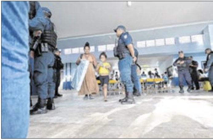
População recebe assistência em Belém