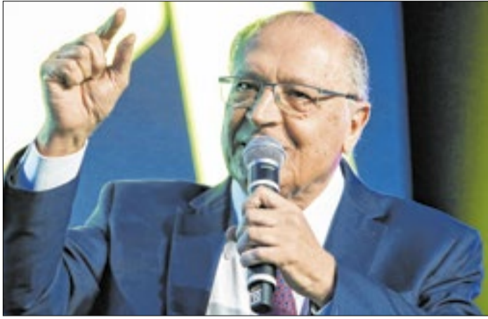
USP divulga presença do vice-presidente em debate