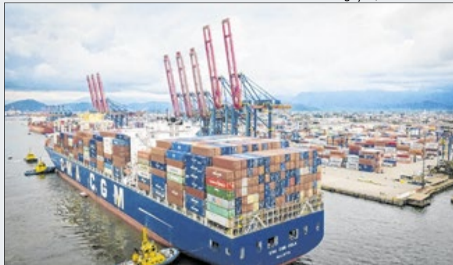
Porto de Santos segue na liderança nacional em movimentação de cargas