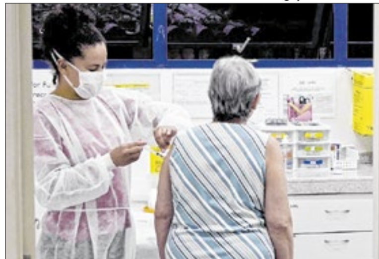
Os idosos estão no grupo prioritário para receberem a vacina

Neste ano, o público-alvo estimado no estado é de cerca de 18,8 milhões de pessoas, com meta de vacinar ao menos 90% dos grupos mais vulneráveis. Até esta quarta-feira, já foram aplicadas mais de 2,5 milhões de doses, e a expectativa é de avanço nas próximas semanas com o reforço das ações de conscientização e mobilização em todas as regiões. A Secretaria de Estado da Saúde destaca que a vacina é segura, eficaz e atualizada anualmente para proteger contra as cepas mais recentes do vírus influenza, sendo fundamental para evitar complicações, sobretudo em idosos, crianças pequenas e pessoas com doenças crônicas.