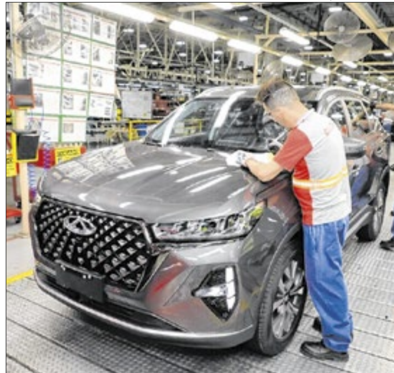
Relatório aponta a indústria como motor da economia

A Secretaria de Meio Ambiente de Três Lagoas (MS) abriu inscrições para concurso de desenho voltado a alunos do 6º ao 9º ano do Ensino Fundamental II de escolas municipais. Os interessados devem consultar regras, prazos e exigências no regulamento disponível ao fim do material divulgado pela pasta.