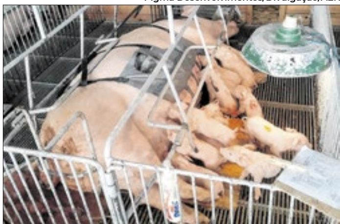
Projeto PigSave reduz natimortalidade suína