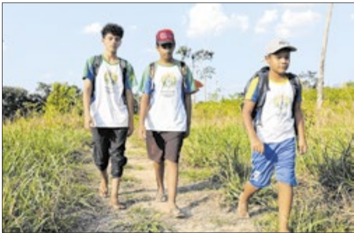
Todos os dias, os três irmãos viajam por três horas