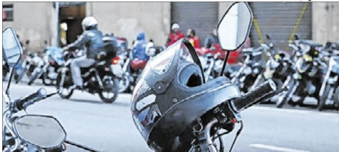
Crescimento das vendas em Campinas segue o do Brasil

O crescimento anual das motocicletas e motonetas na metrópole foi de 3,8%, segundo números da Secretaria Nacional de Trânsito. Esse ritmo de expansão é quase quatro vezes superior ao registrado pelos carros, que