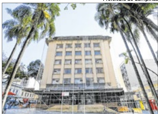
Imóvel será rebatizado como Palácio da Cidade