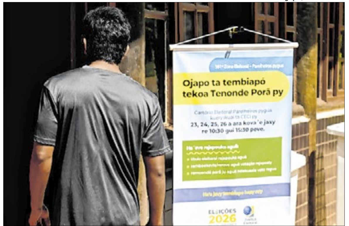
Cartazes em línguas indígenas orientam o eleitorado durante ações do Projeto de Inclusão

Entre os povos atendidos estão Guarani-Mbya, Nhandeva, Tupi-Guarani, Kaingang, Terena e Pataxó, entre outros. Dados do TSE indicam que mais de 6 mil eleitores se autodeclararam