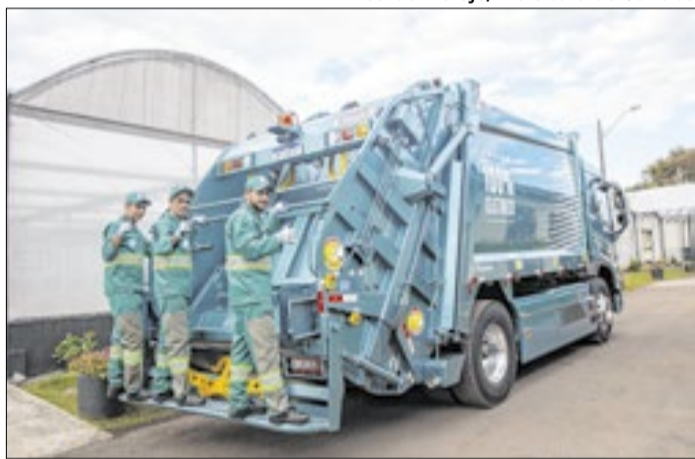
Estado atinge 98,9% e supera média nacional em 2025