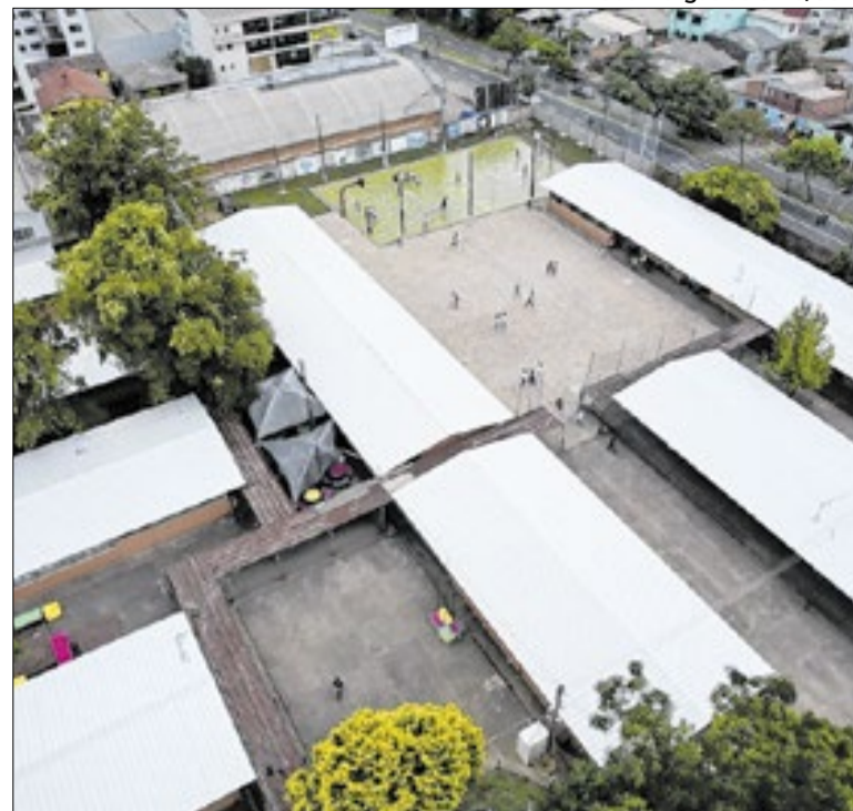
As intervenções ocorrem em 57 municípios gaúchos

A prefeitura de Londrina (PR) e o Sescap-LDR realizam no sábado (25), das 10h às 20h, na Praça da Bandeira, a ação "Viva o Centro - Declare Certo 2026", para orientar sobre Imposto de Renda (IR) e incentivar destinação a projetos sociais. O evento terá serviços, ações públicas, feira, apresentações e atividades culturais.