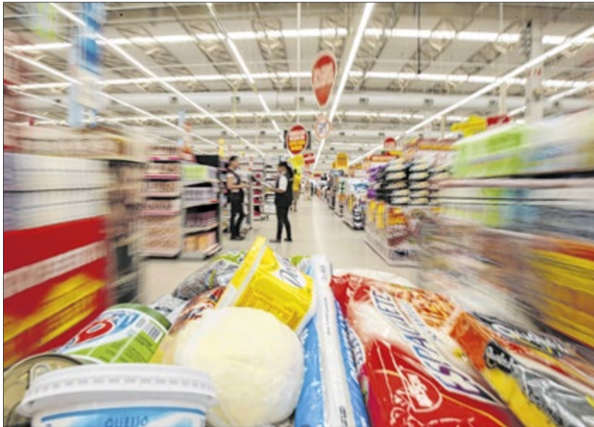
Observatório PUC-Campinas registrou a maior alta mensal desde o início do monitoramento

O monitoramento segue a metodologia do Dieese, baseada em um decreto-lei de 1938 que