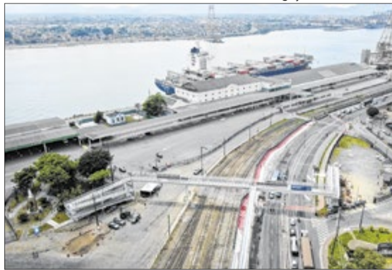
Porto de Santos mantém crescimento em 2026

Na operação de contêineres, o porto movimentou 1,40 milhão