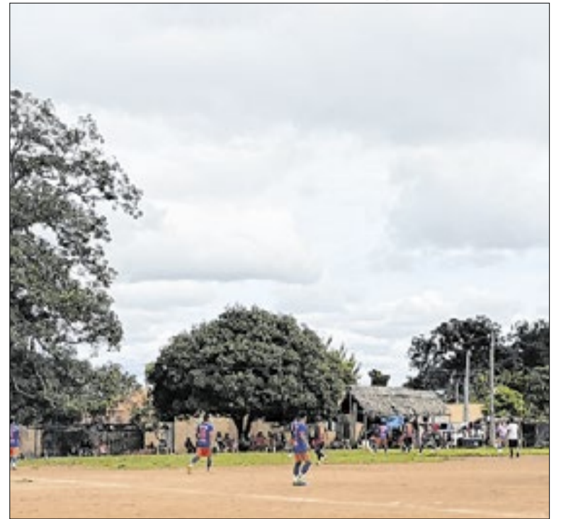
Indígenas de diferentes aldeias participaram da competição

Desenvolvido pela prefeitura de Porto Velho (RO), por meio da Secretaria Municipal de Turismo, Esporte e Lazer (Semtel), o programa Construindo Campeões oferece treinamento gratuito em diversas modalidades esportivas, com foco na formação e inclusão de crianças e adolescentes.