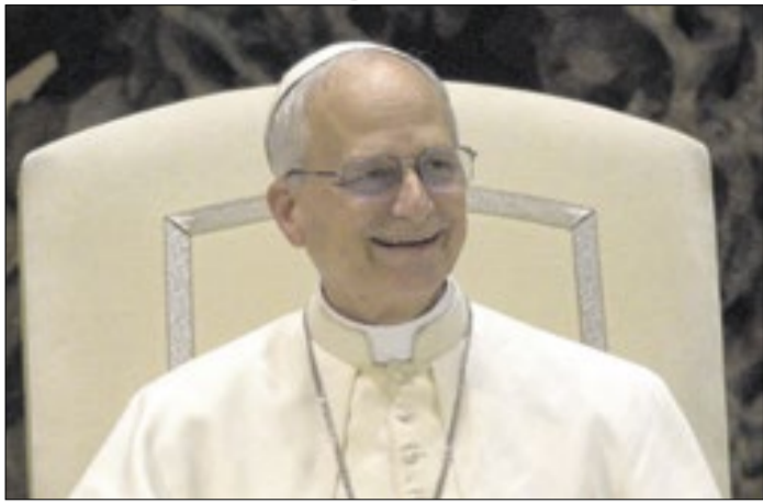
Papa não quer entrar em debate com Donald Trump